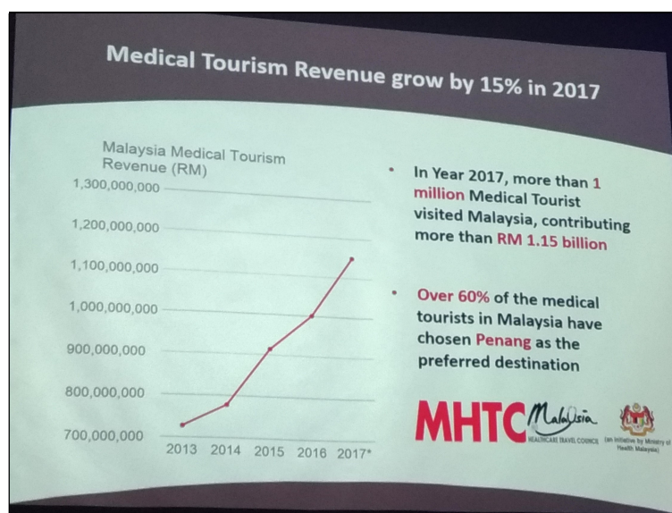
圖 1 馬來西亞近年醫療保健旅遊發展情形

2017 年衛生部所作統計，該年度醫療旅客已達 1 百萬人，醫療保健旅遊收入達 11.5 億馬元。其中主要以檳城為主，佔 60%，求診者並以印尼人佔最多數。