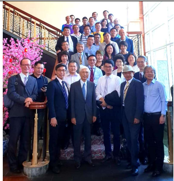
圖 7 拜會馬來西亞及汶來當地台商及政要