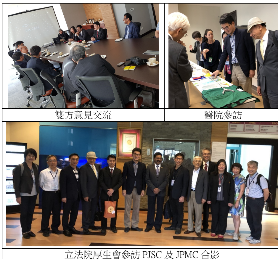
圖 4 參訪汶萊 PJSC 及 JPMC

Pantai Jerudong Specialist Center (PJSC) 是汶萊新建之專科中心，主要包括癌症中心 (The Brunel Cancer Centre, TBCC)、神經科康復中心 (The Brunel Neuroscience Stroke and Rehabilitation Centre, BNSRC) 及面部整形重建外科中心 (The Maxillofacial, Facial Plastic and Reconstructive Surgery Centre, MFPRSC)，解決過去當地民眾必須至國外治療之負擔。Jerudong Park Medical Centre (JPMC) 醫院，則為汶萊重要之私立醫院，並接受汶萊政府之經費挹注，主要診治公立醫院因缺乏專科醫師或儀器設備所轉診之病人，並由汶萊政府支付醫療費用。本次參訪過程，台灣彰濱秀傳醫院分享所創立之「秀傳亞洲遠距微創手術中心」，並討論未來合作之可能。