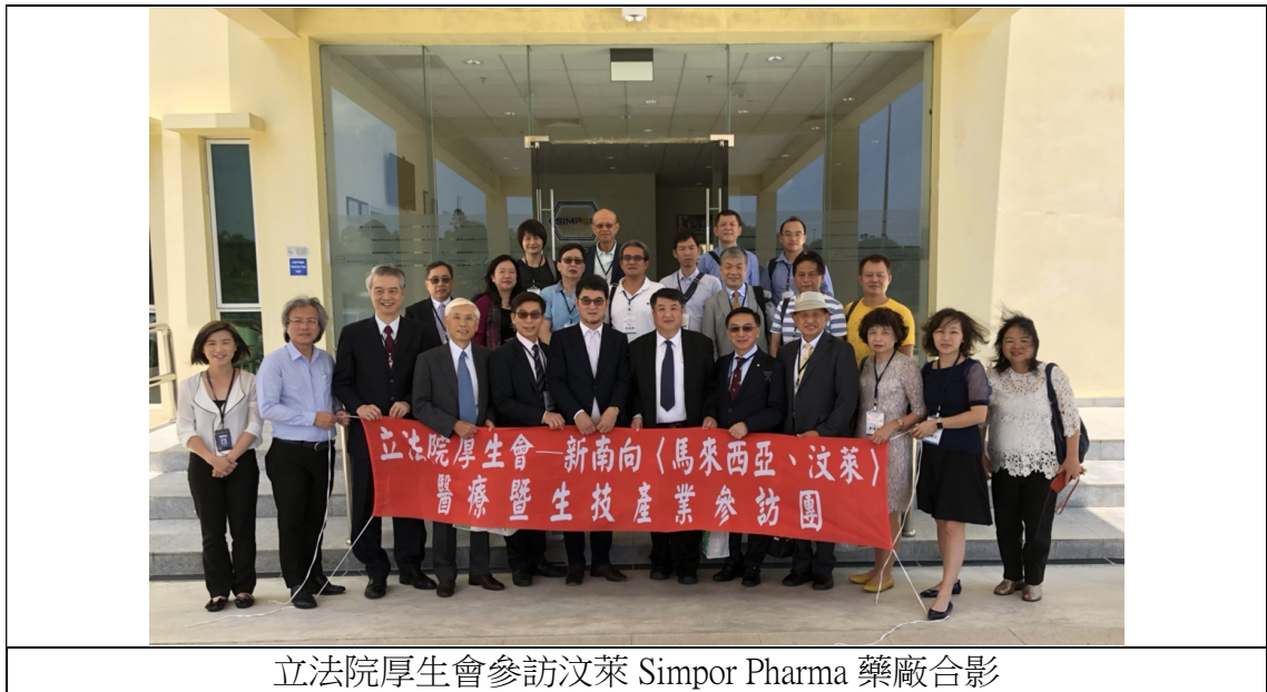
圖 5 參訪汶萊 Simpor Pharma 藥廠