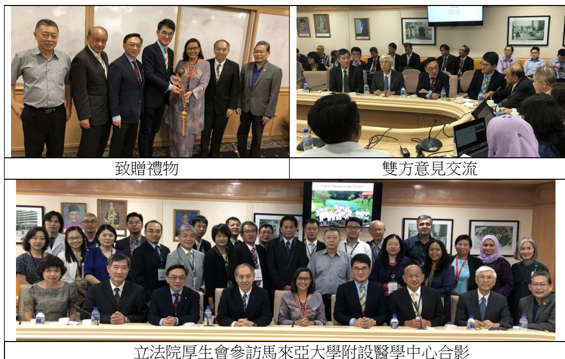
圖 3 參訪馬來亞大學附設醫學中心

本次參訪過程，台灣彰濱秀傳醫院分享所創立之「秀傳亞洲遠距微創手術中心」，以討論未來雙方相互合作之契機。UMMC亦特別介紹與台灣慈濟大學合作「無語良師」計畫之成果，除解決所面臨教學遺體不足之問題，並讓醫學生體認大體老師與其家屬之無私奉獻及大捨精神，以培育視病如親、以病為師的人文素養。該計畫於2012年開始進行馬來亞大學第一梯次的無語良師工作坊，目前已辦理23梯次之工作坊，啟用86位大體老師，受醫醫學生人數超過800位。