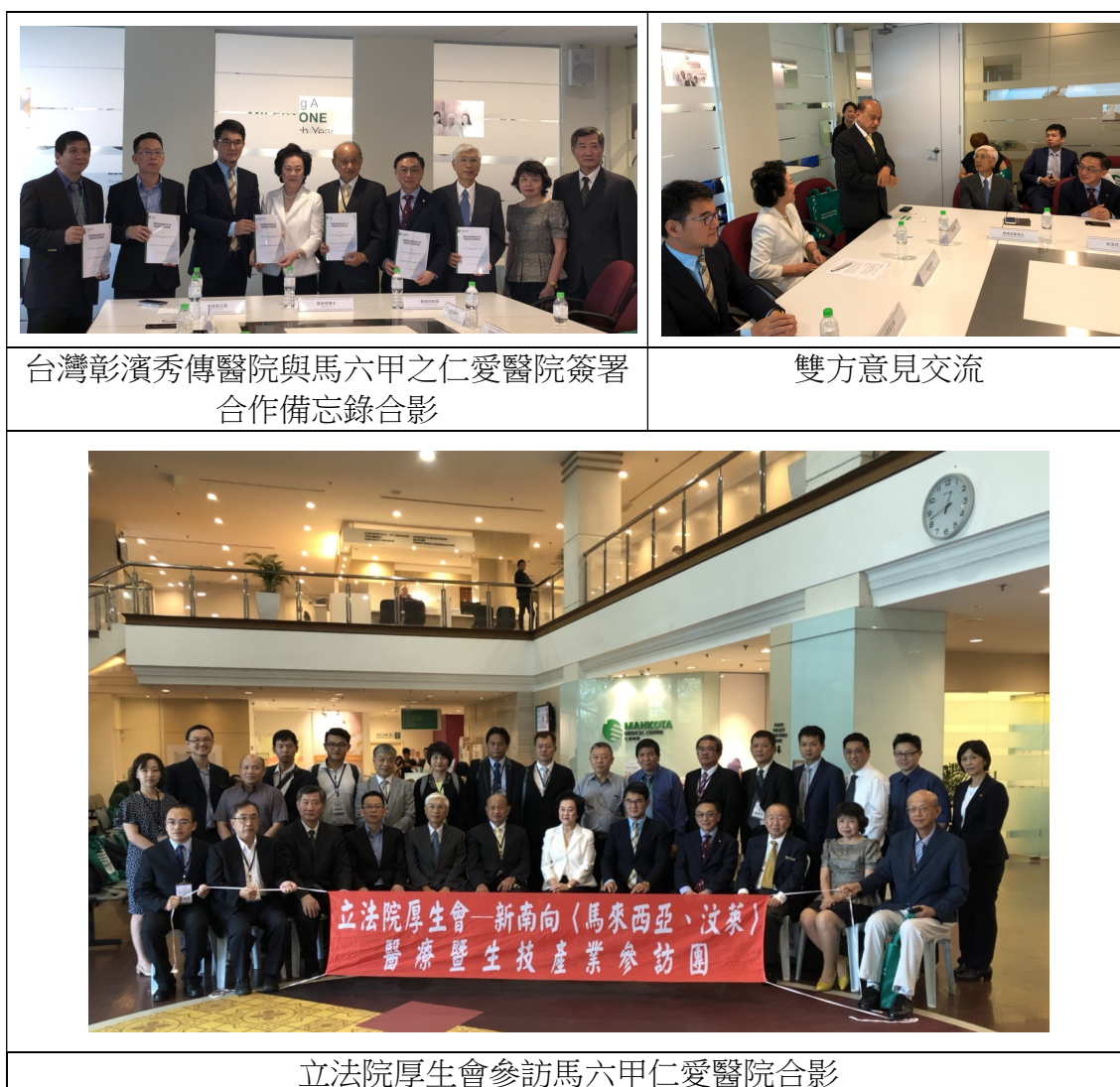
圖 2 參訪馬六甲仁愛醫院

該醫院積極參與政府推動之醫療旅遊，除透過專業醫療及合理價格，並建立便利之一站式服務，例如當日取得健康檢查報告、事前協助病人安排交通與住宿、提供多語言溝通服務等，且於海外建立服務據點，以就近服務境外人士安排醫療旅遊。目前該醫院每年接受逾 30 萬病患，其中 10 萬名為國際病患。