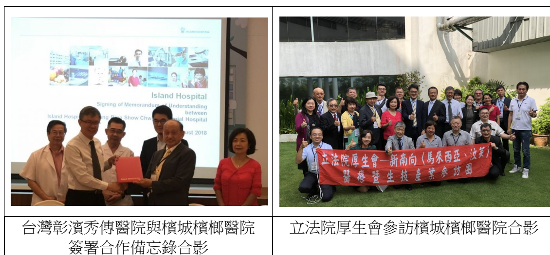
圖 1 參訪檳城檳榔醫院

院檳榔醫院，該醫院成立於 1996 年，是一家私立綜合醫院，屬第三級醫院，目前有 300 個床位，近 1000 名員工，該院提供廣泛之醫療服務，包括門診、24 小時急診、健康體檢、日間手術及住院服務等，且因地理位置處於熱門觀光景點，故國際觀光醫療事業發達，曾被馬來西亞衛生部評選為最佳的觀光醫療醫院。本次參訪，由檳榔醫院與台灣彰濱秀傳醫院簽署合作備忘錄，並進行意見交流及醫院參觀。