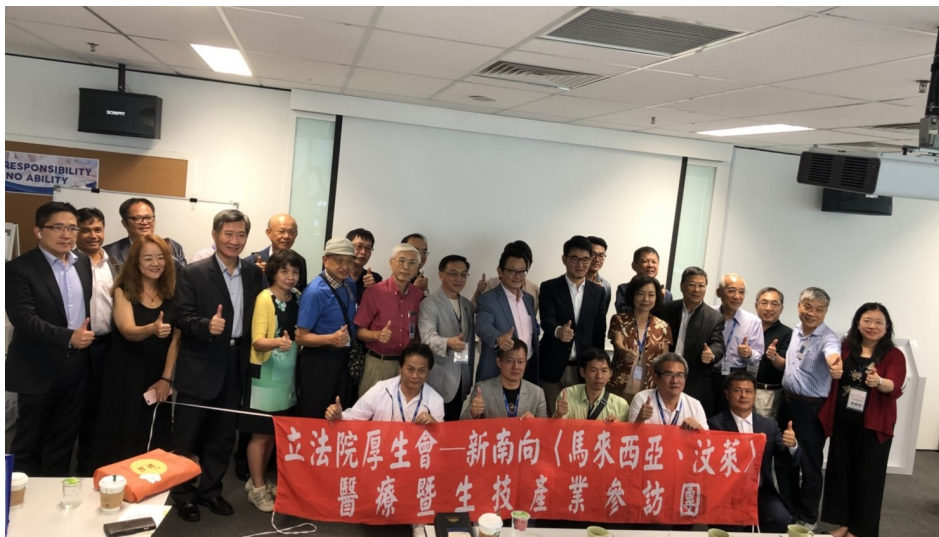
立法院厚生會參訪馬來西亞永信藥品公司合影