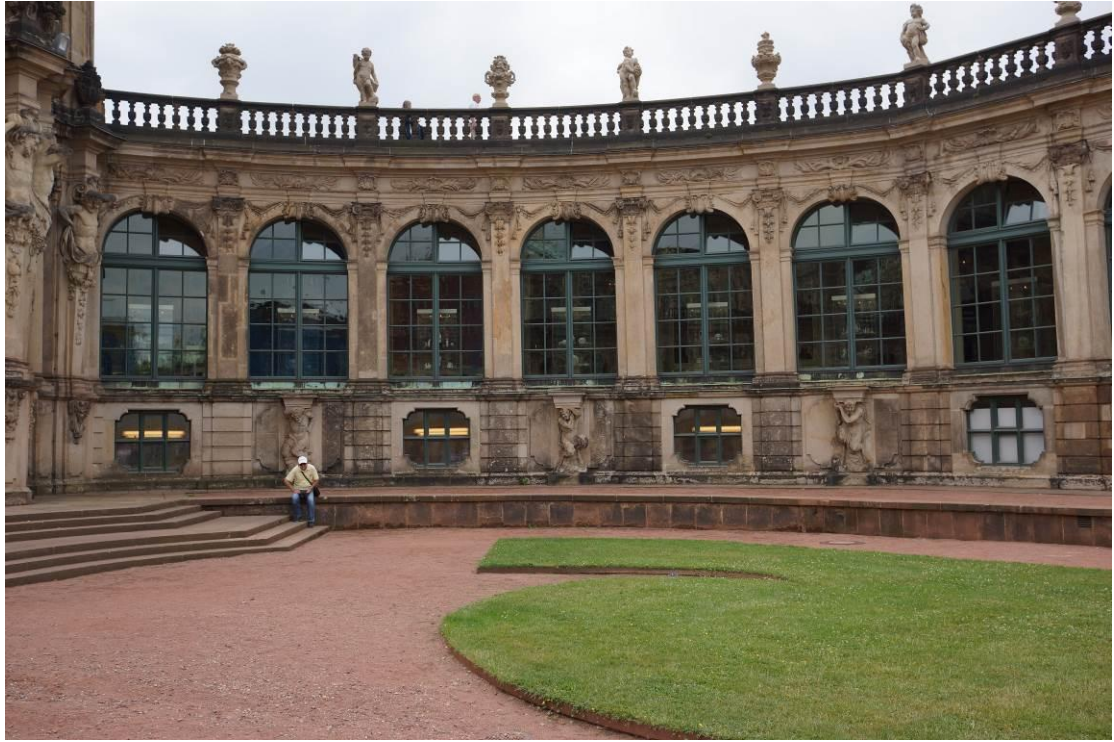
Zwinger Palace 一景