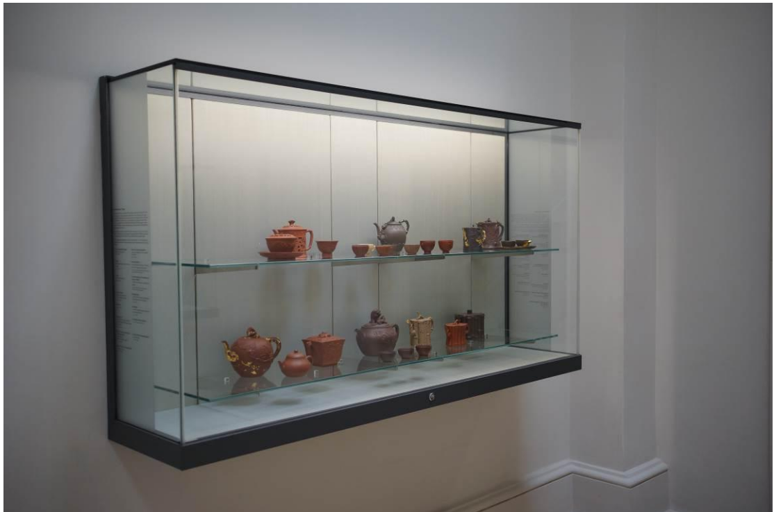
強者奧古斯都舊藏的紫砂器