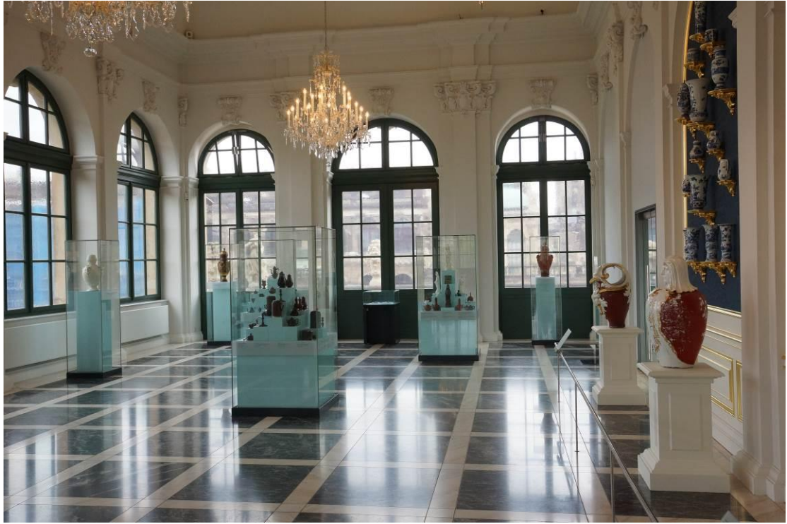
強者奧古斯都舊藏的歐洲窯場紅陶製品