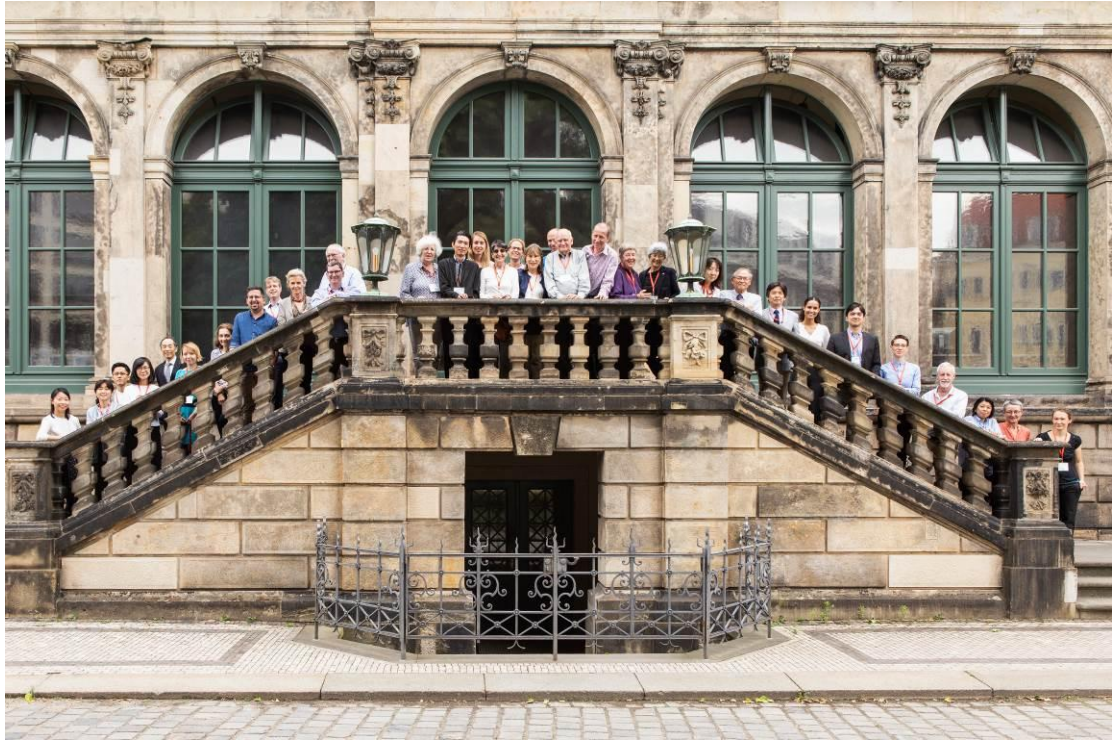
來自世界各地參與工作坊的學者們