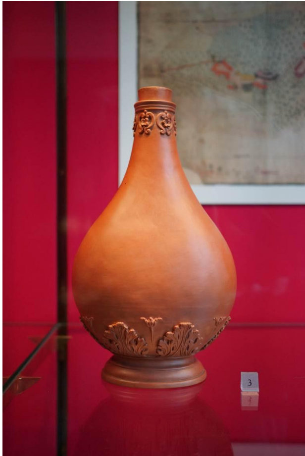
瓷場內陳設之波特格紅陶製品