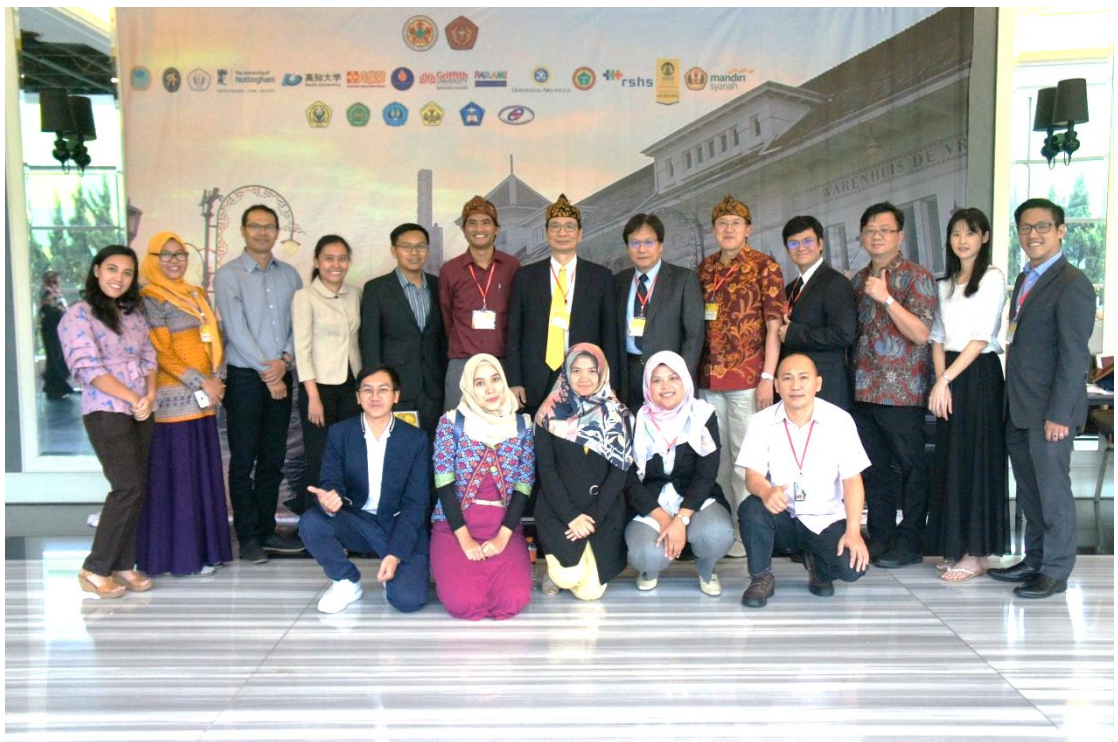
▲與在學及畢業於成大護理系碩博班的印尼籍校友在今年國際研討會上合影

截至 2018 年 2 月止，成大護理系碩博士班共 45 名外籍畢業生，其中印尼籍占了 44 名。明年起將規劃在印尼開辦小班性質的工作坊，集結這群歷年畢業的印尼籍碩博士生，以種子學員的身份，藉由這群印尼籍校友的力量，將更多知識及技術傳承下去。並且，規劃共同發表學術論文，建立長期穩定的合作夥伴關係。