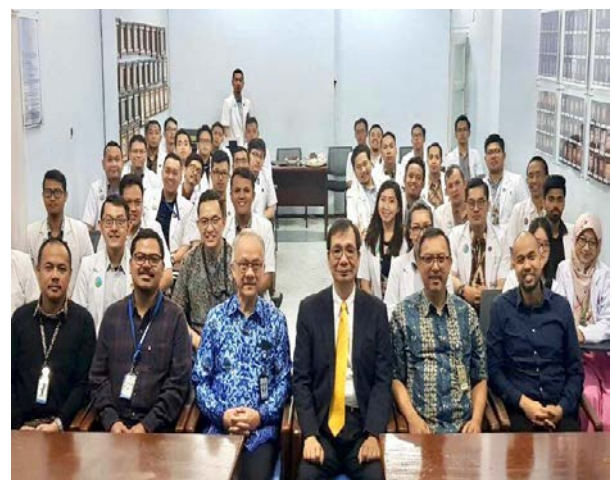
▲(RSHS，哈桑·桑迪奇綜合醫院)