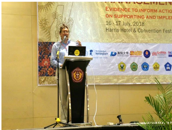
▲成大公衛研究所李中一教授