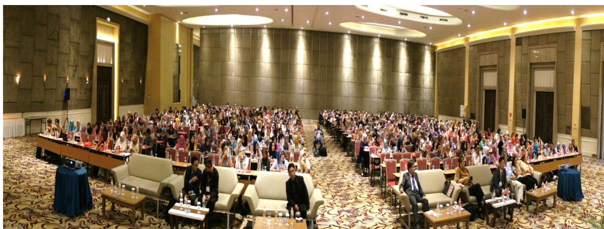
▲共計 813 人參與

本次為期兩天的國際研討會，除了安排大型演講外，另外也包含 35 篇的海報，及 87 人的口頭論文發表。並在研討會結束之際，頒發最佳論文獎與四名報名者。