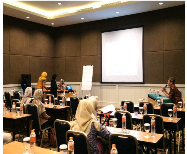
▲口頭論文 87 篇