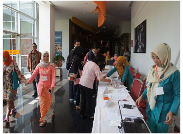
▲國際研討會報到情形