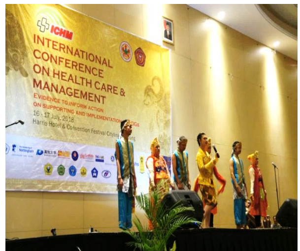
▲印尼當地傳統舞蹈揭開序幕