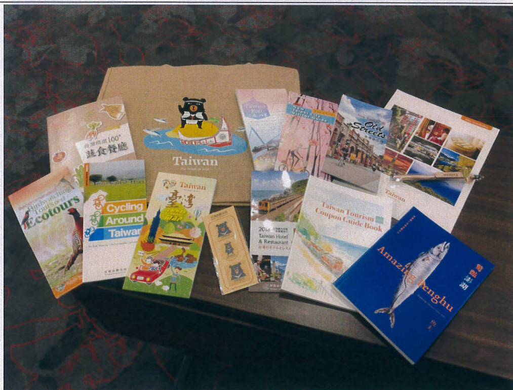
圖二：麻布環保袋內置臺灣各式文宣，宣傳臺灣多元旅遊資源及環境