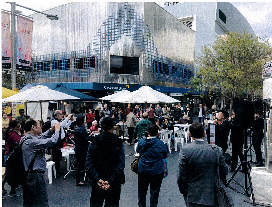
圖八、茱蒂口琴樂團於購物中心表演，吸引民眾索取臺灣旅遊文宣、品嚐臺灣點心