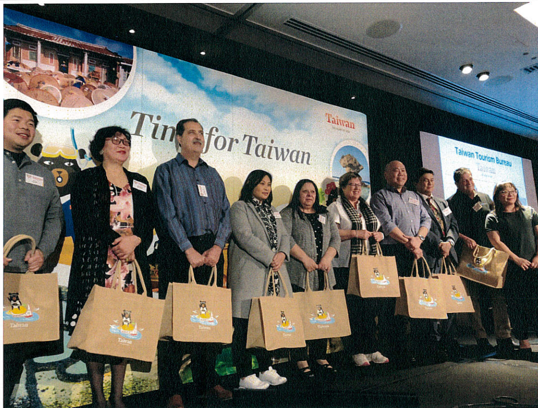
圖六、推廣餐會提供臺灣旅遊產品及點心做為抽獎獎品，加深臺灣旅遊意象