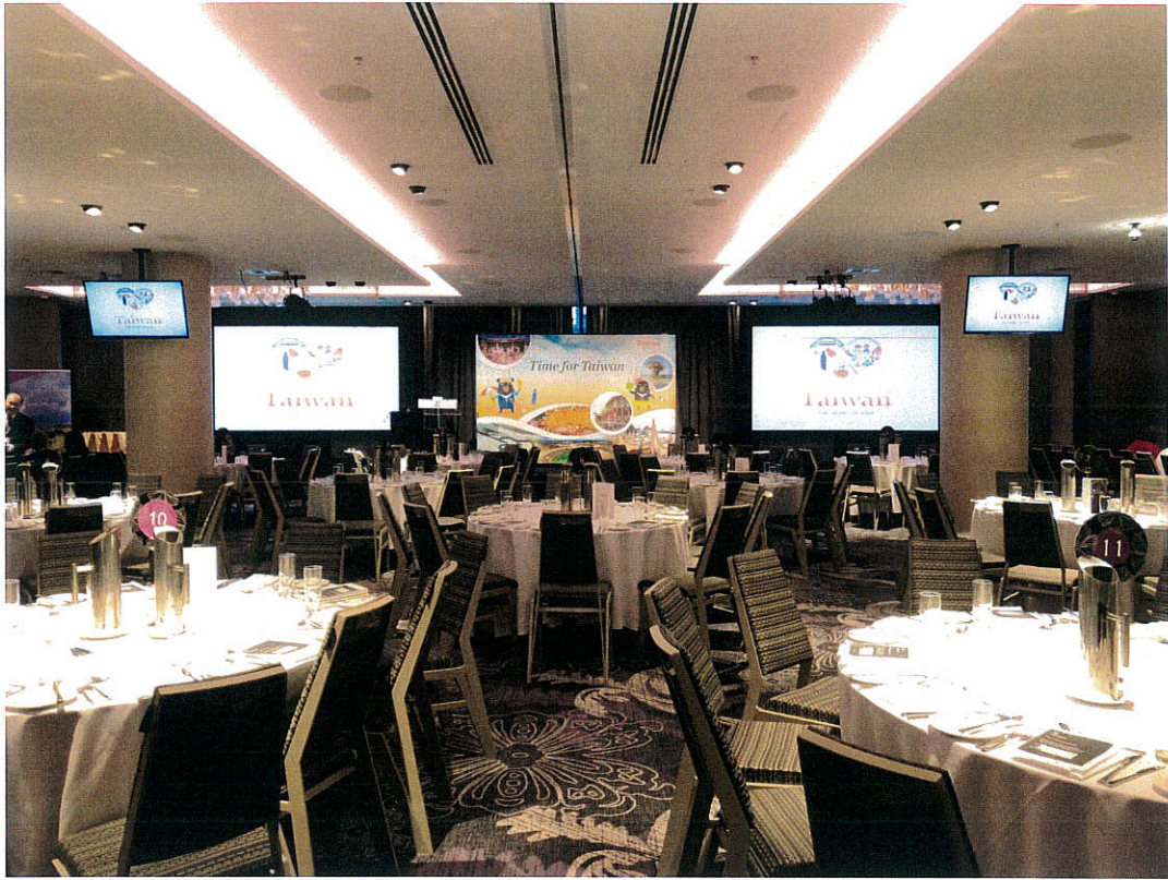
圖五、臺灣觀光推廣餐會—墨爾本場