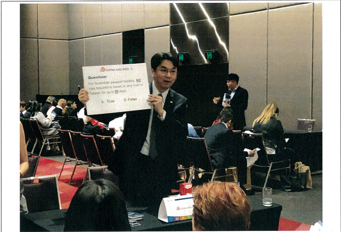
圖三：業者運用趣味問答贈獎活動，增加當地業者對臺灣旅遊情況的瞭解