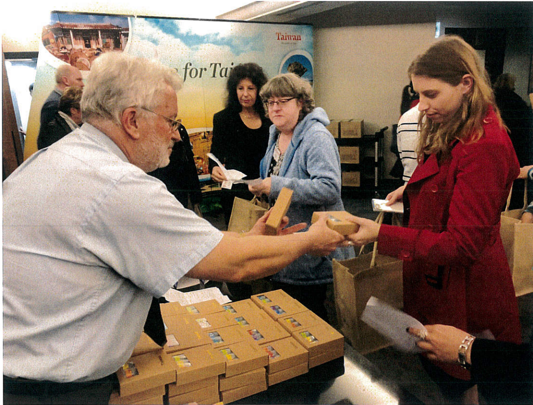
圖七、提供小紀念品鼓勵與會業者填寫問卷瞭解當地民眾旅遊偏好與消費行為