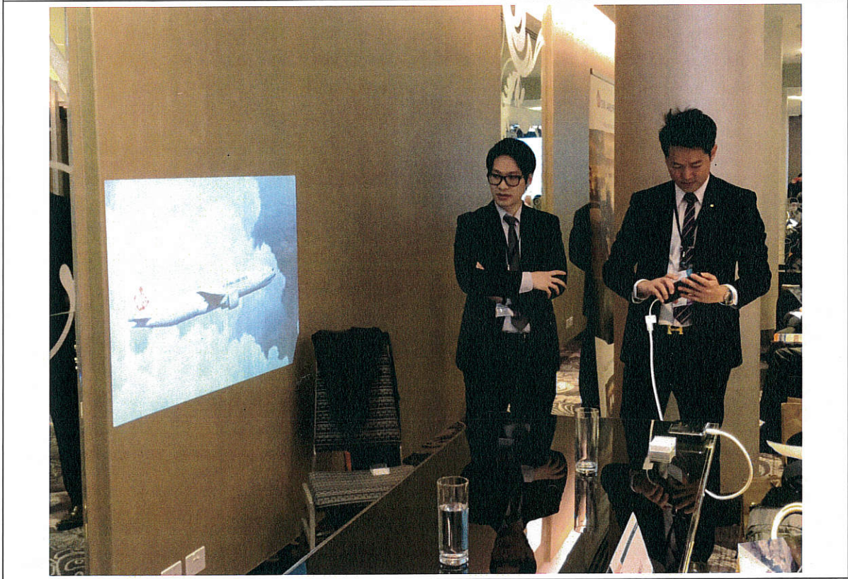
圖四、業者運用攜帶型投影機，可從手機投影公司介紹影片，克服場地限制