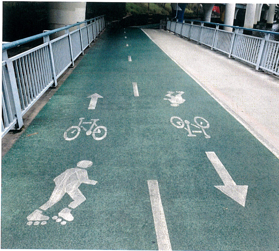
圖十二、順道觀察澳洲自行車、直排輪與跑步、行走之用路人分道管理方式