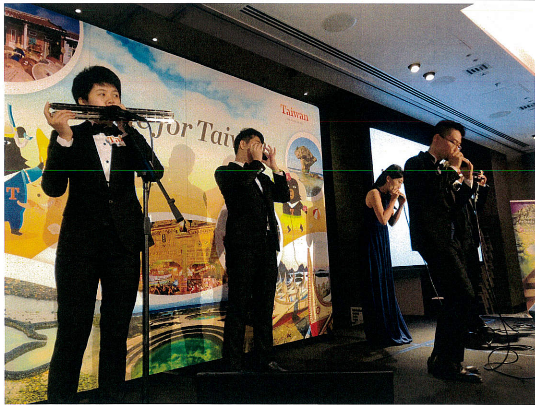
圖五、表演團體—茱蒂口琴樂團表演臺灣民謠及世界名曲，精湛技巧動人心弦