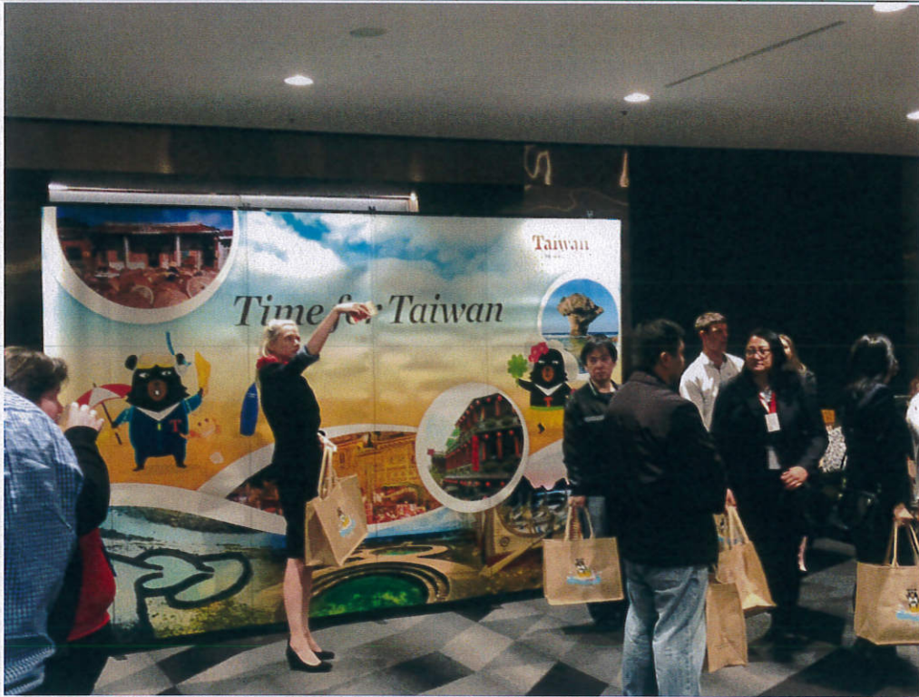
圖一：活動式大型背板置於報到處，吸引當地業者拍照及打卡，增加臺灣觀光曝光率