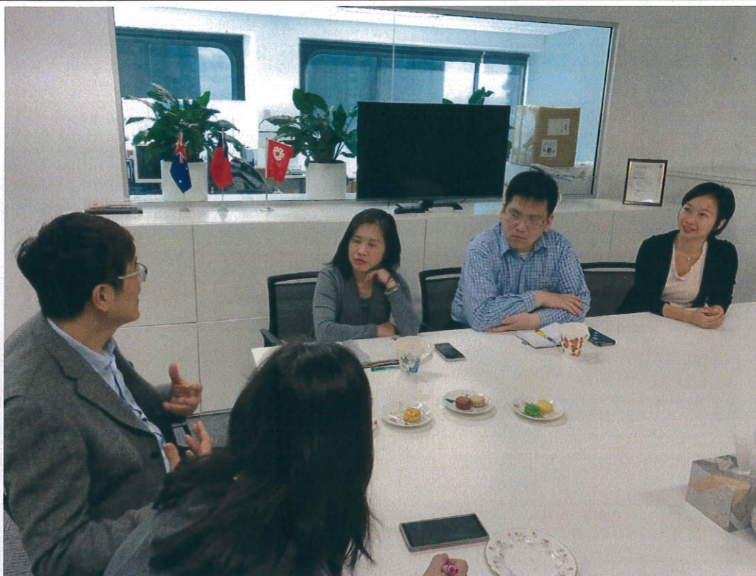
圖十、拜會雪梨台灣貿易中心瞭解雪梨戶外廣告投放地點及探詢設置臺灣旅遊資訊服務站之可行地點