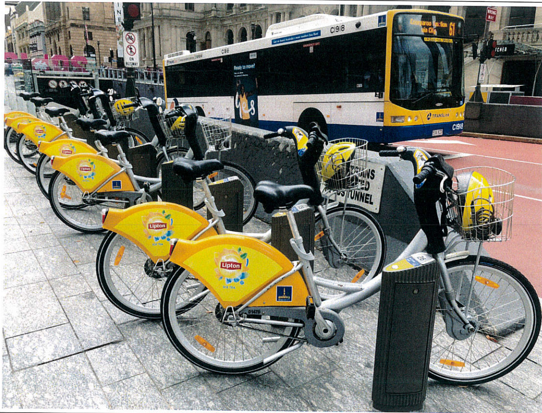
圖十一、順道觀察澳洲共用自行車之建置及觀察可投放戶外廣告處