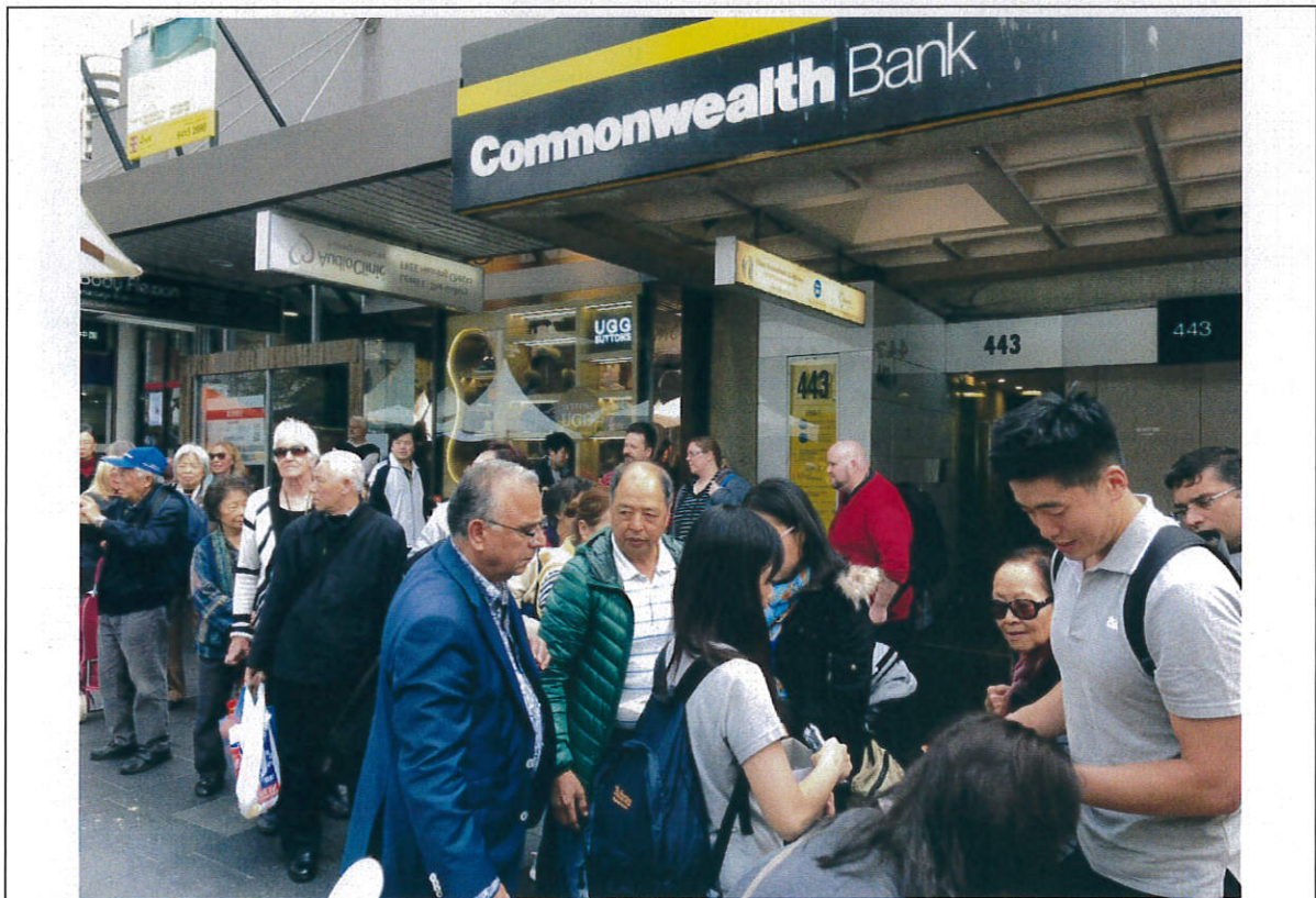
圖九、民眾熱烈排隊索取臺灣旅遊文宣及紀念品