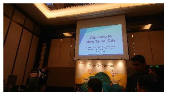
新北市政府觀光旅遊局於推廣會中說