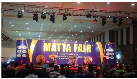
Zero Four Dance Crew 於大會舞臺表演客家主題舞蹈