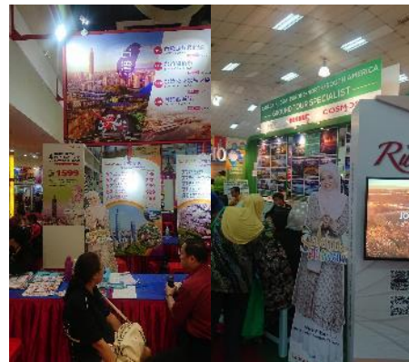
當地旅行社販售代言人臺灣見面會行程產品