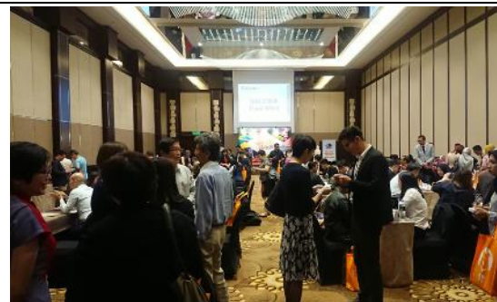
推廣會穆斯林場次洽談熱絡