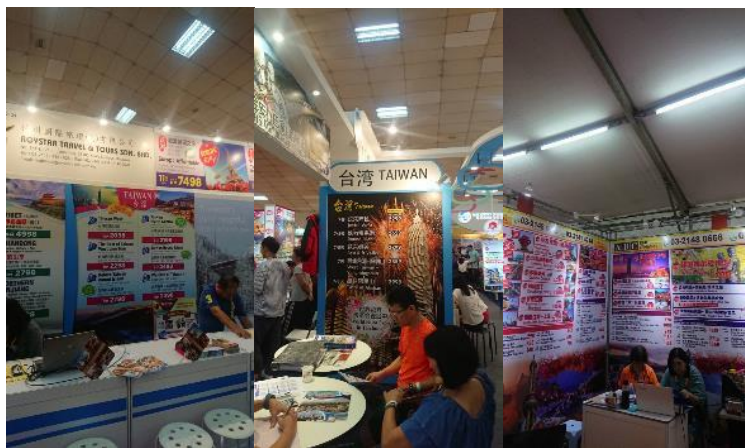
當地旅行社販售來臺旅遊產品