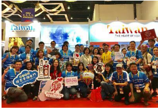
臺灣代表團與洪大使合影