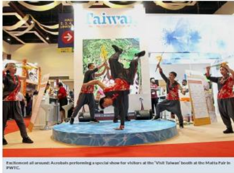
Excitement all around: Acrobats performing a special show for visitors at the 'Visit Taiwan' booth at the MATTA Fair in PWTC.