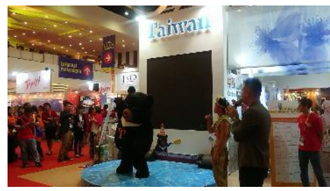
Zero Four Dance Crew 與喔熊於臺灣館舞臺表演吸引民眾駐足觀賞