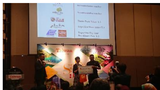
中華航空公司馬來西亞分公司魯總經理