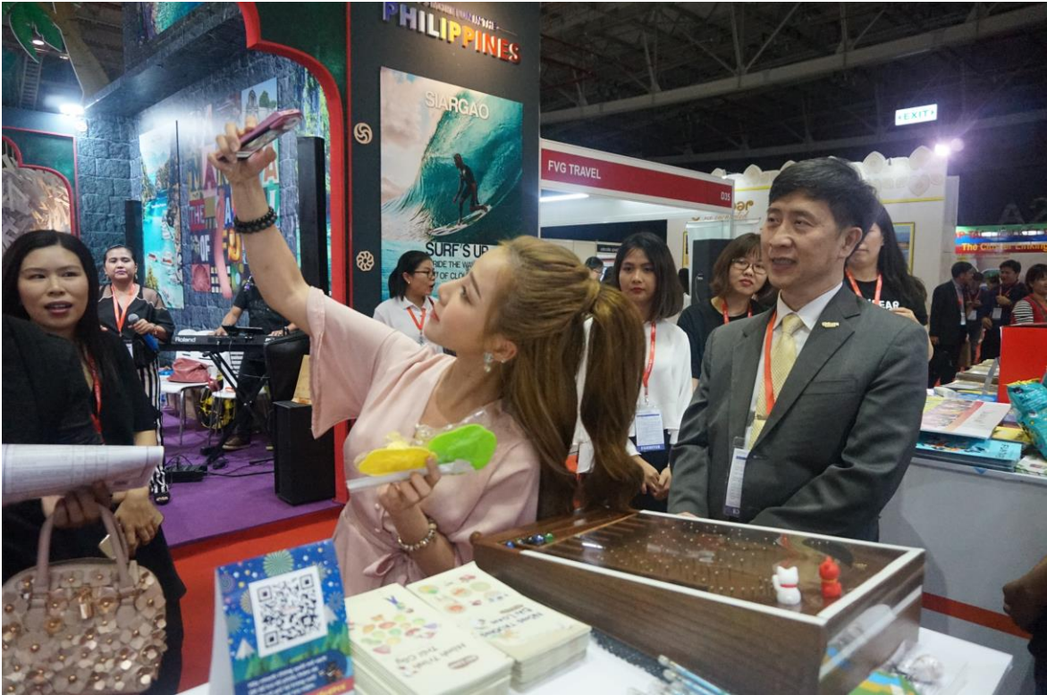
旅展當地網紅至台灣館發佈網訊吸引民眾