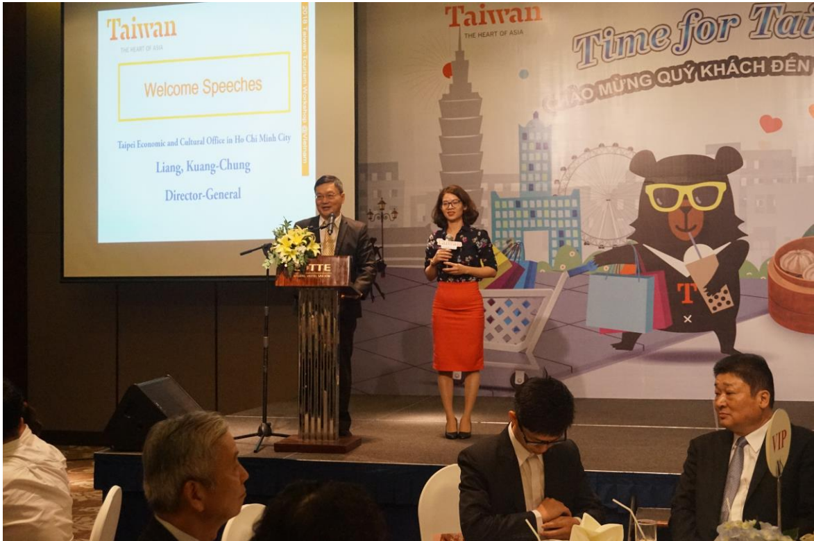
晚宴辦事處梁處長致詞