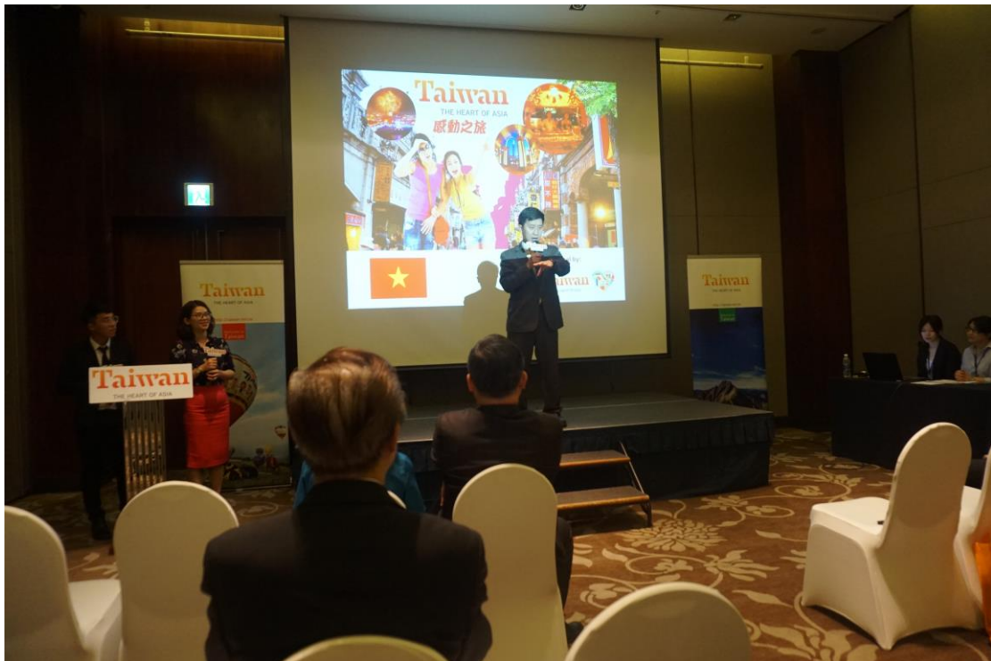
推廣會巫主任簡報