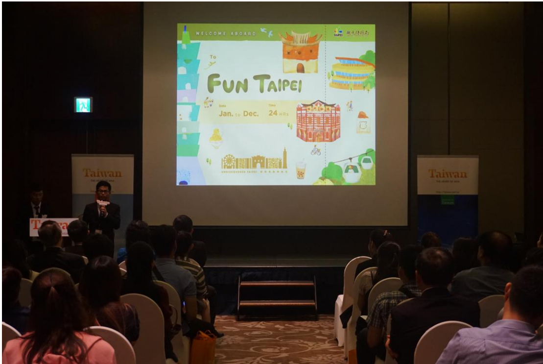
推廣會台北市政府簡報