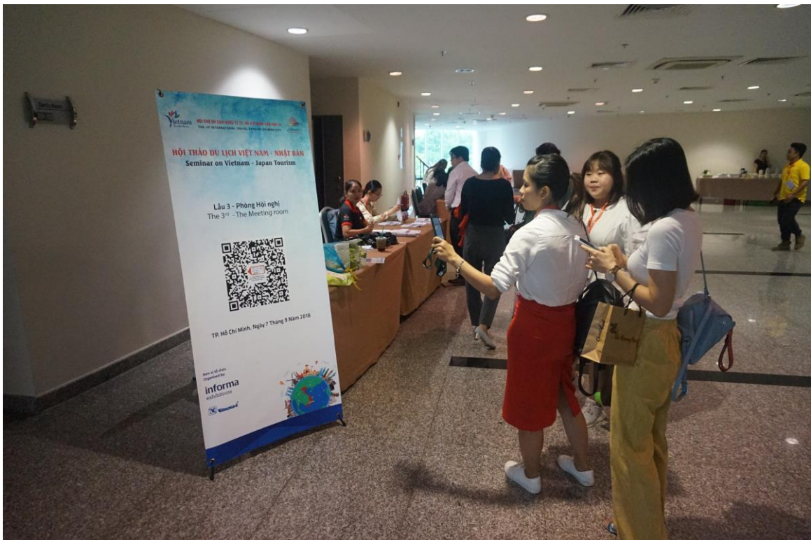
當地業者下載研討會資料