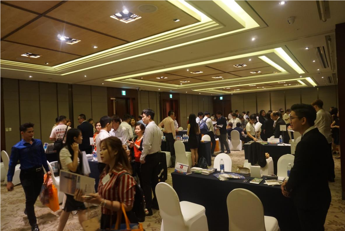
洽談會雙方業者交流情形