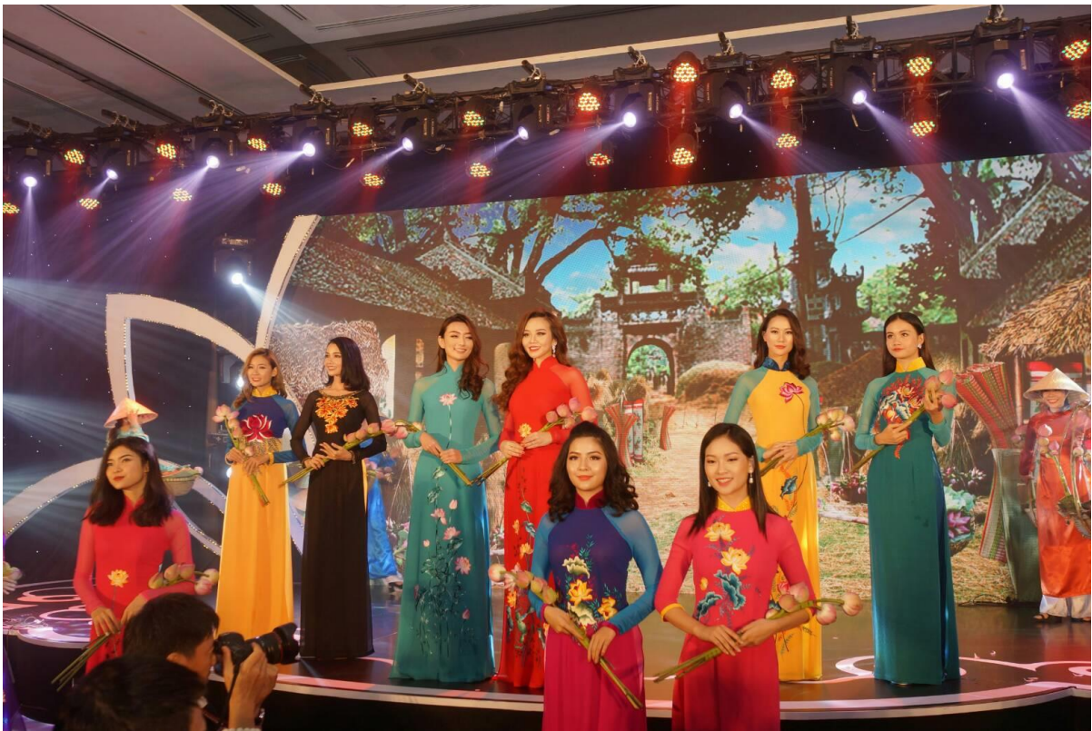
旅展歡迎晚宴表演