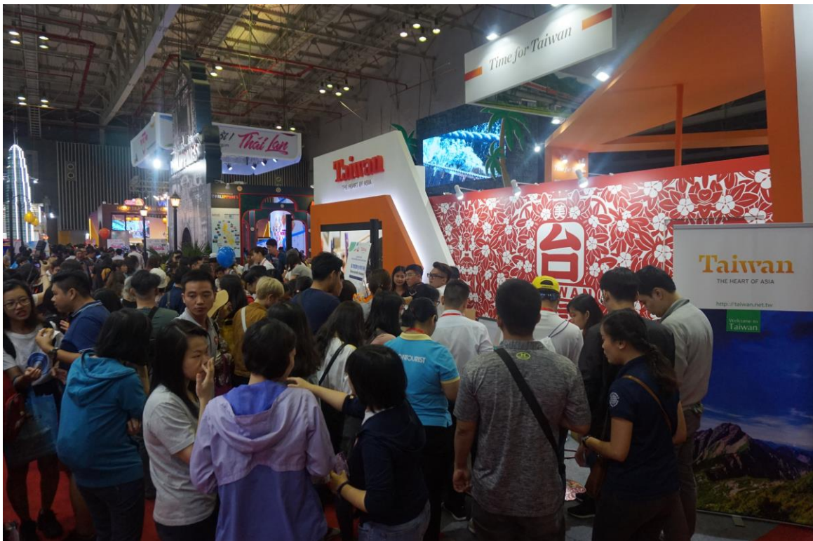
台灣館人潮-資訊洽詢