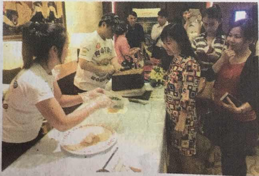
台灣旅遊業者向參觀者介紹美食。

元素所帶來的舞蹈表演，以及台灣民俗技藝捏麵人的展演等。此外，觀眾在現場打卡按讚，就能體驗台灣知名小吃，排隊品嚐九份阿珠雪在燒(花生捲霜淇淋)及鳳梨酥試吃，還有小狗提燈的DIY活動，與觀眾近距離互動。凡於旅遊展現場購買台灣旅遊行程配套者，均獲贈送精美禮品一份◆ 仁建