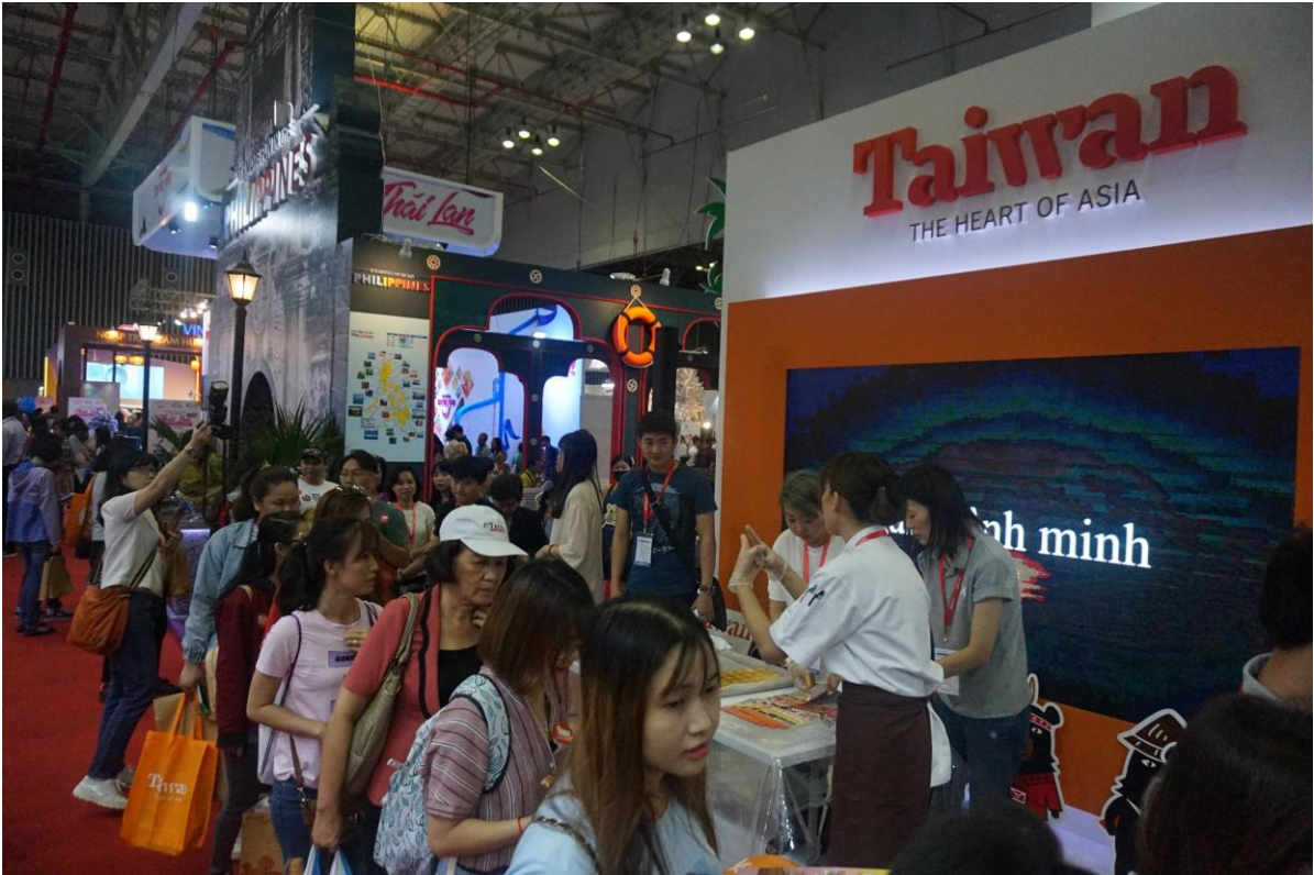
台灣館人潮-美食體驗