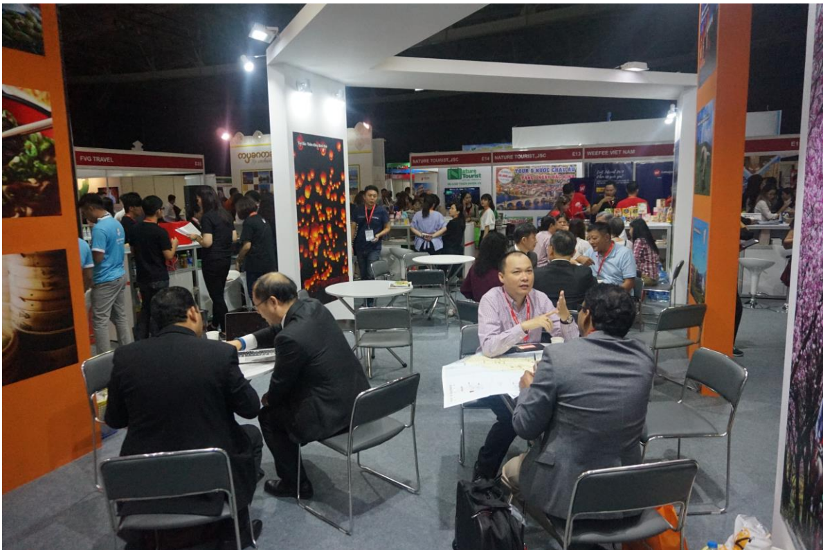
旅展業者洽談情形