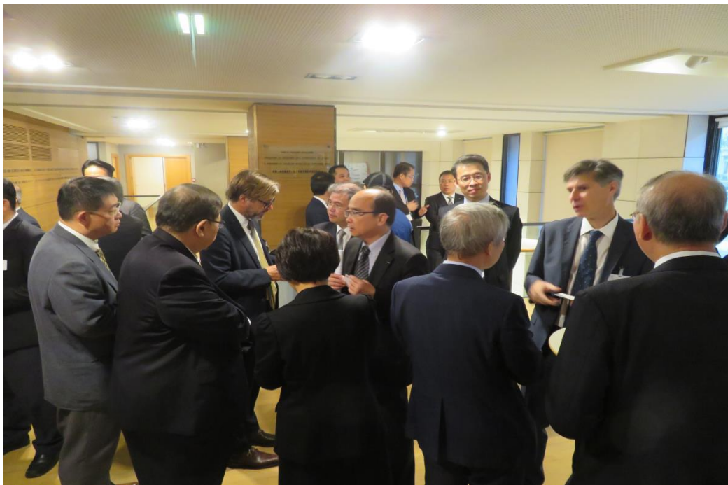
圖 4：第 24 屆臺法(國)經濟合作會議，會後貿易洽談交流