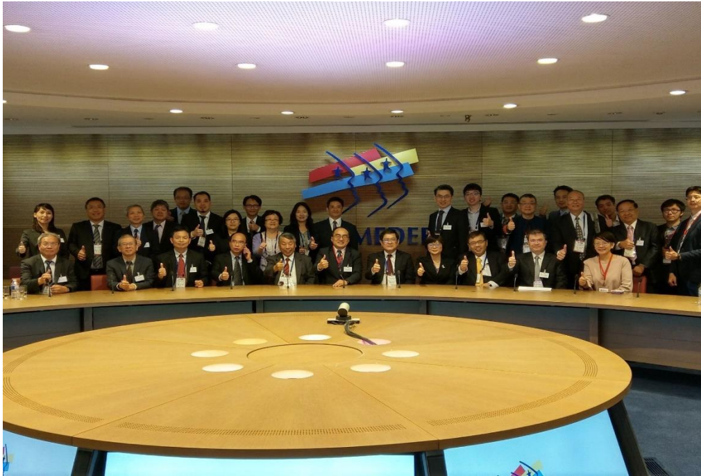
圖 3：第 24 屆臺法(國)經濟合作會議(2)