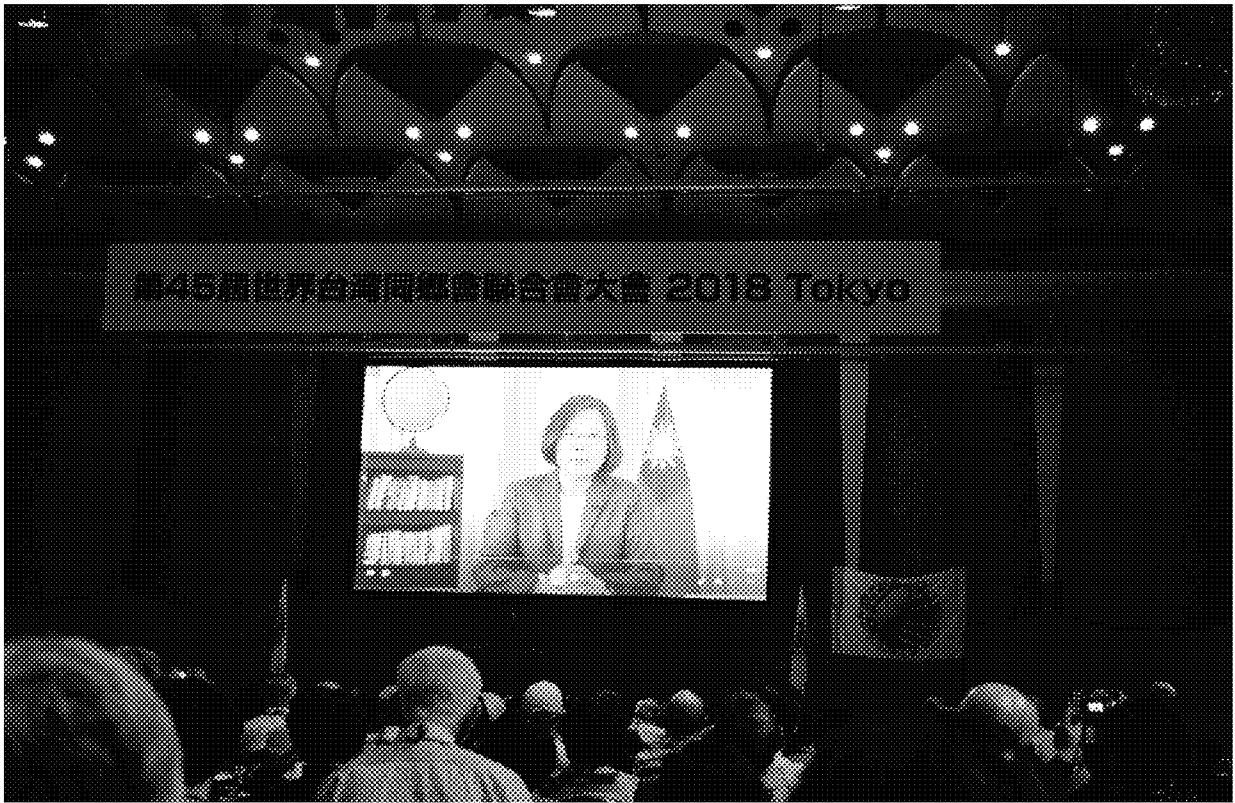
「2018年世界臺灣同鄉會聯合會第45屆年會」蔡總統以視訊方式發表演說