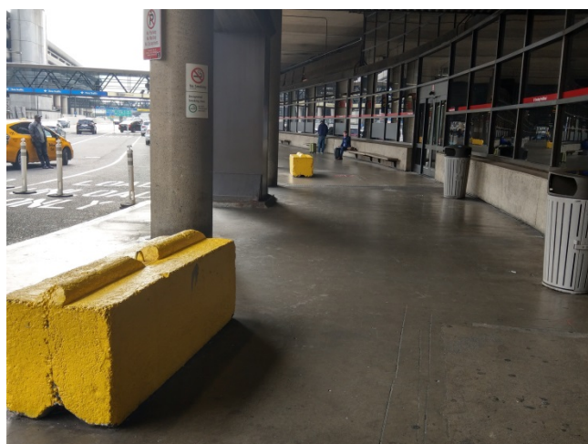
下圖為防止衝撞的石墩。