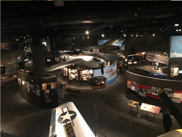
飛行博物館及其部分區域照片(受限於波音公司區域不能拍照)。