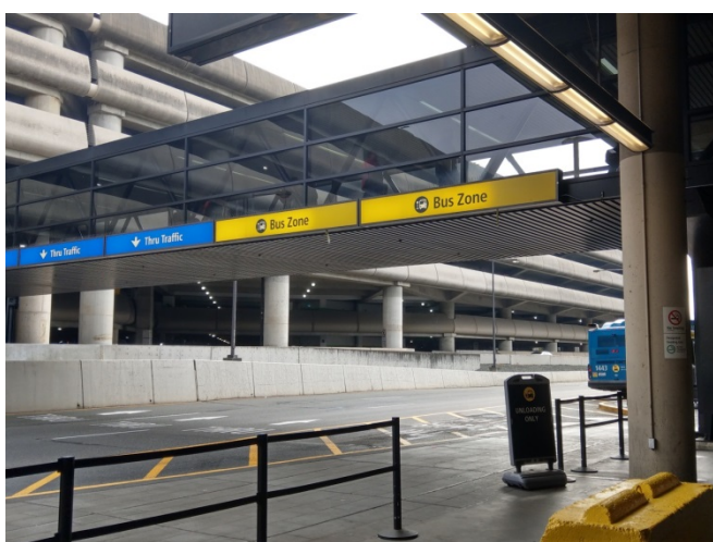
上圖為其交通的車流分區停靠，上面走道提供旅客進入對面的立體停車場。

客可藉由步道直接步行走出機場，機場對街就是發達的航空產業辦公中心以及許多的旅館業者，此次會議地點即在其中的 Hilton Conference Center，屬於 Hilton 飯店的附設會議中心。而也因為其周邊旅館業的發達，於西雅圖塔可馬機場內還設有旅館接駁車的專用接駁區域，設置許多站牌及接駁點。若旅客就近入住附近的飯店，可以利用其提供的專線公共電話直接聯絡飯店業者 CHECK-IN 並派接駁車接送，因此在機場周邊辦公非常方便。例如長榮航空於西雅圖的駐站單位即可與周邊飯店業者配合，讓其員工就近休息，不用額外花費更多時間或金錢設置員工宿舍等。而機場的停車區域除了主航廈以空中走廊連接對面的立體停車場外，也藉由西雅圖輕軌很好的發展腹地，西雅圖輕軌機場站的下一站，也是擁有許多停車場，以及周邊地區的公車轉運站。