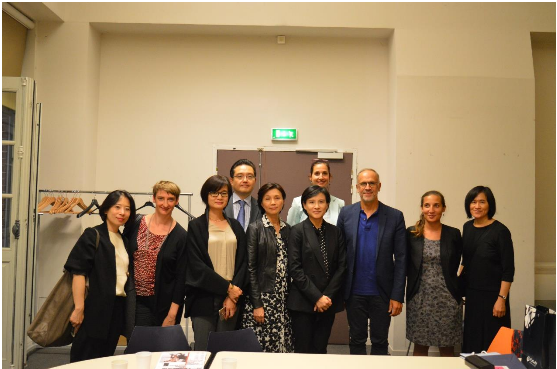
G 總監及團隊與鄭部長訪團合影