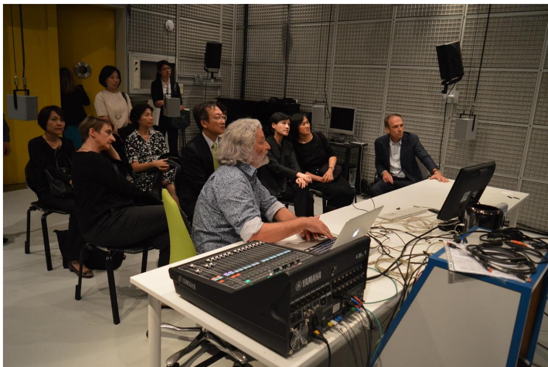
鄭部長訪團參觀音樂與聲響研究中心