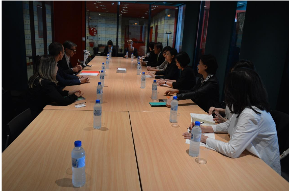
鄭部長訪團與 Serge Lasvignes 主席及龐畢度中心團隊見面

雙方於會議室簽訂雙邊合作意向書，正式表達雙邊未來進一步將就有關音樂及聲音創作節目製作、音樂工程技術及創作者等相關人才進行培訓及活動交流、節目計畫共製等合作。