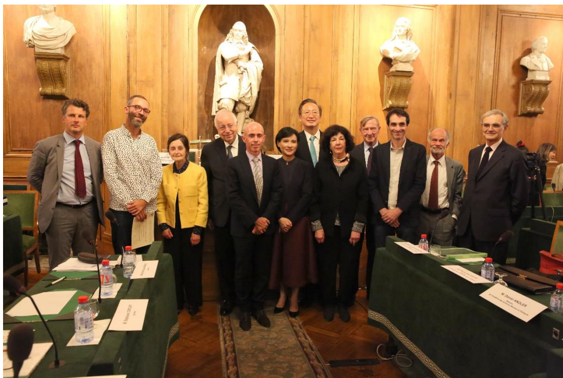
第 22 屆臺法文化獎頒獎典禮大合照