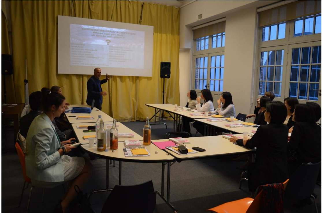
G 總監親自為鄭部長訪團簡報