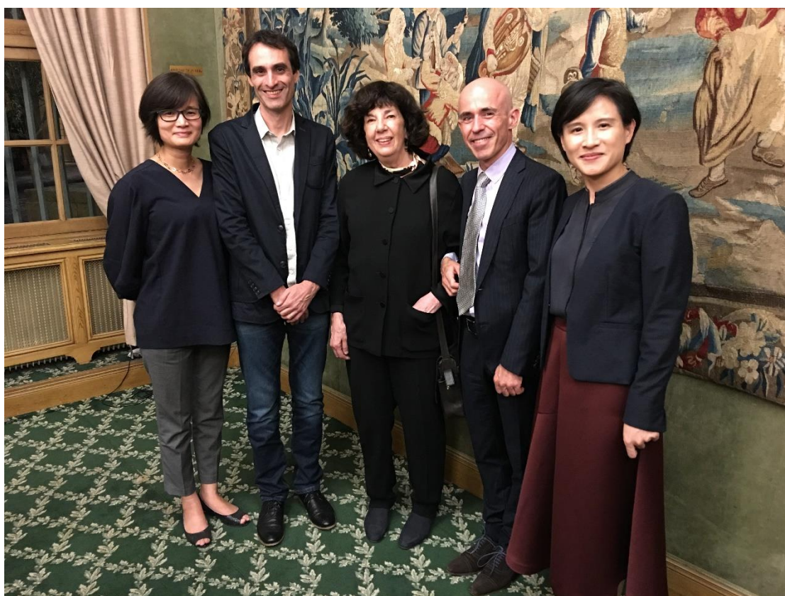
鄭部長於臺法文化獎晚宴與得獎者合照