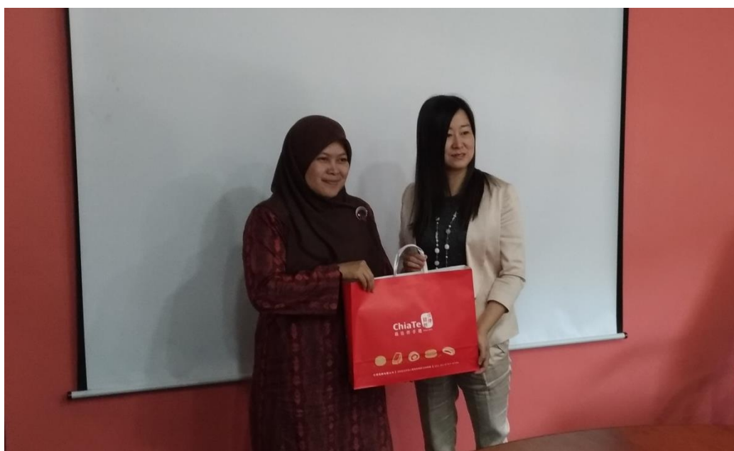
圖一、第一天會議開始前與 NPRA 官員合照 1