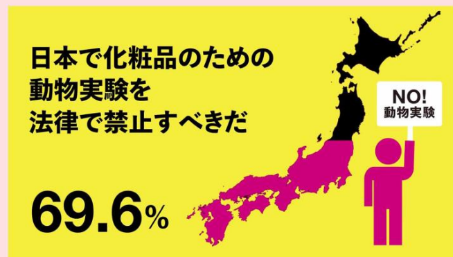
圖九、日本民眾對於化粧品禁止進行動物試驗支持率