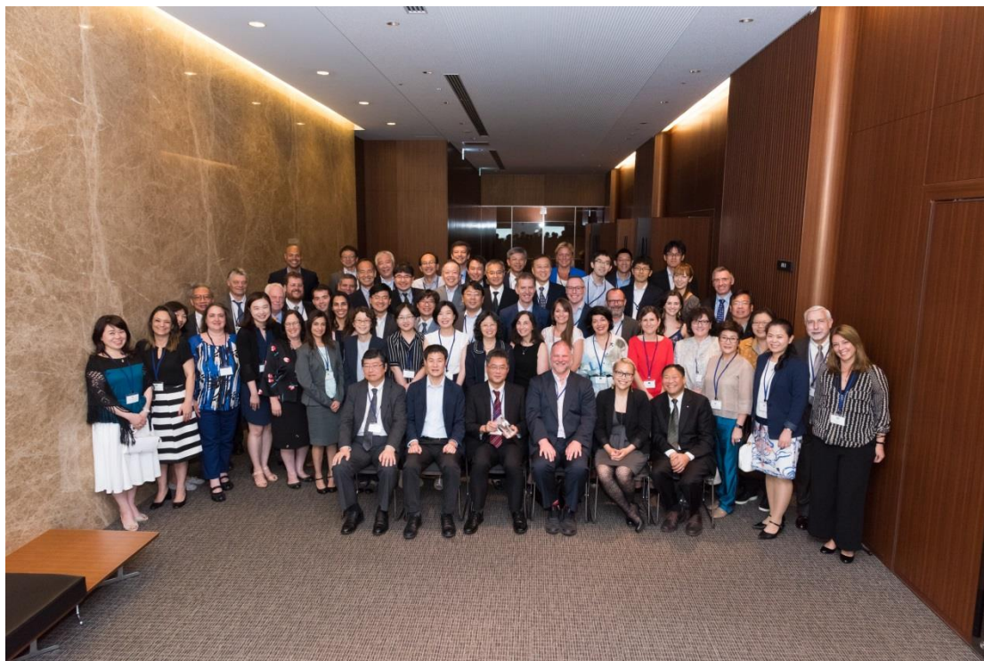
圖二、ICCR-12 會議現場情況