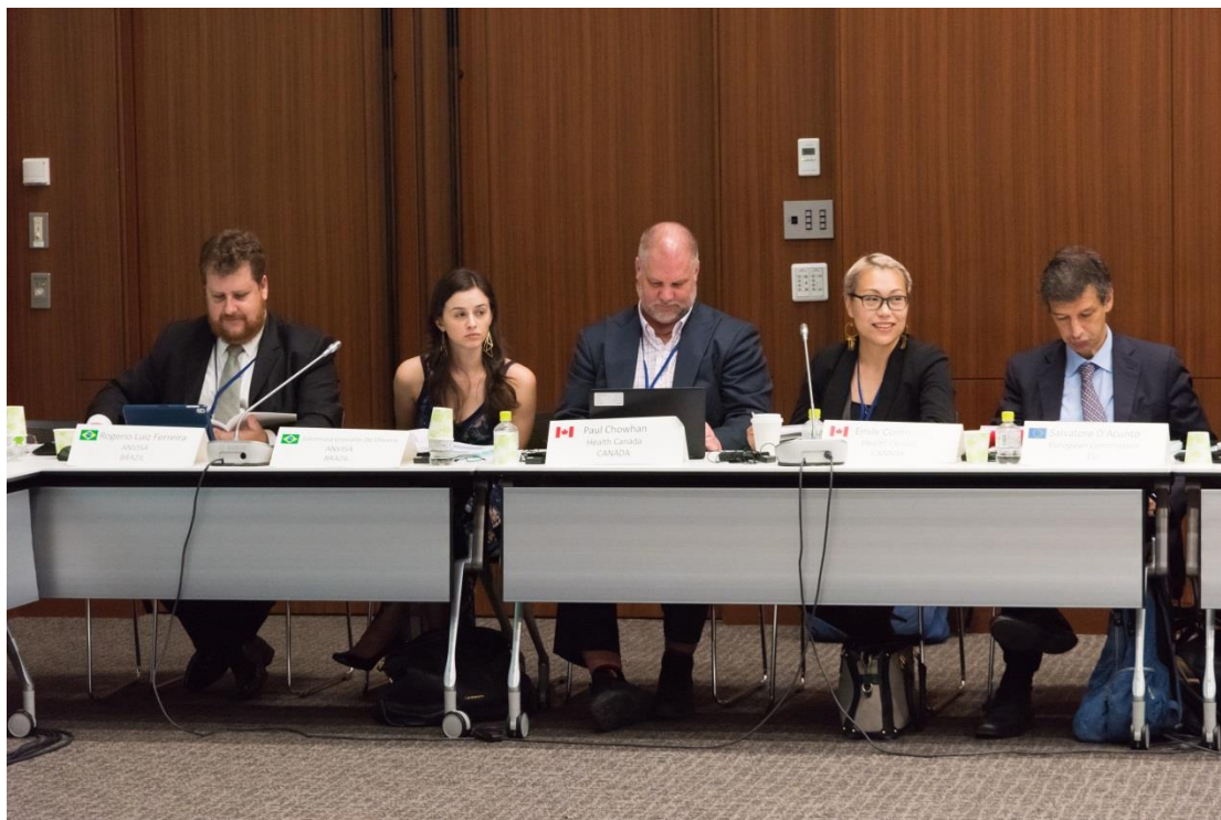
圖四、ICCR-12 會議現場情況