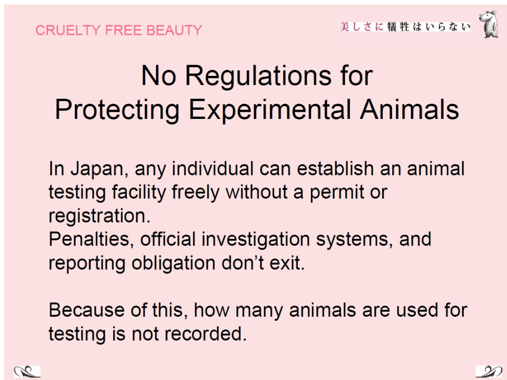
圖八、日本動物試驗法規現況