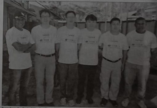
Team from the Central Weather Bureau with two employees of SIMS.

Meanwhile, first collaborative phase, the project aims at setting up six meteorological stations and 15 seismometers distributed in Solomon Islands to optimize the capabilities of weather forecasting and earthquake/tsunami warning.