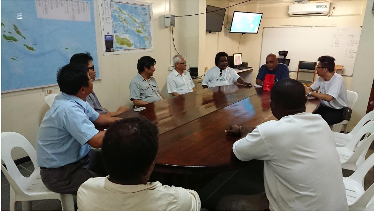
照片4 與索國 NDMO 會談未來合作事宜。