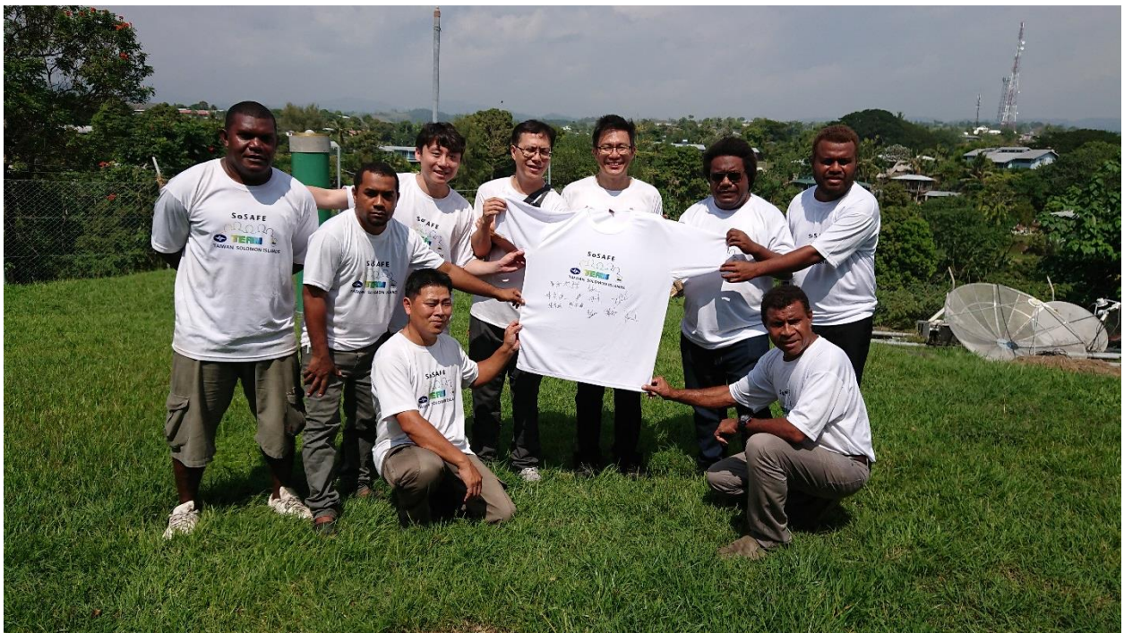
照片5 與索方工作人員合影。