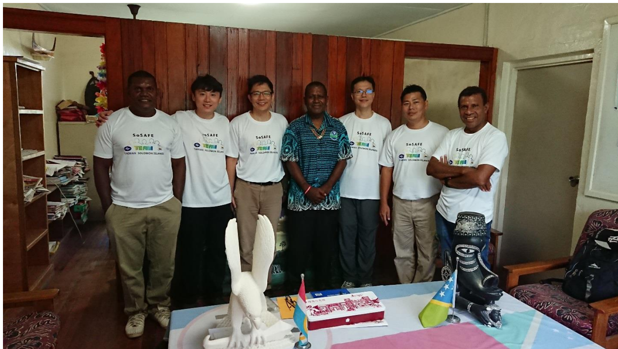
照片2 拜會索國 MALAITA 省長，洽談儀器安裝事宜。