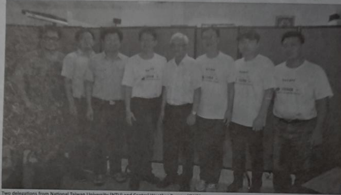
Two delegations from National Taiwan University (NTU) and Central Weather Bureau (CWB)

that it was back in September 2009 when Taiwan sent their first batch of specialist teams to Solomon Islands.