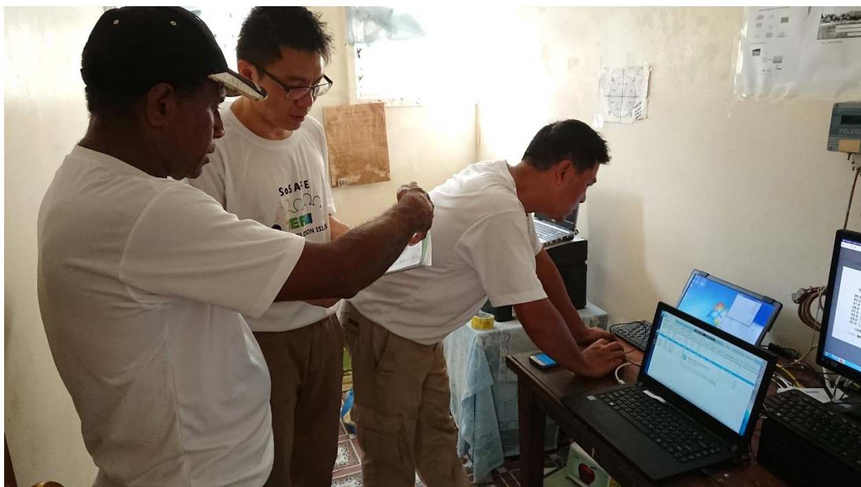
照片3 於索國 AUKI 氣象站教育訓練索方人員。