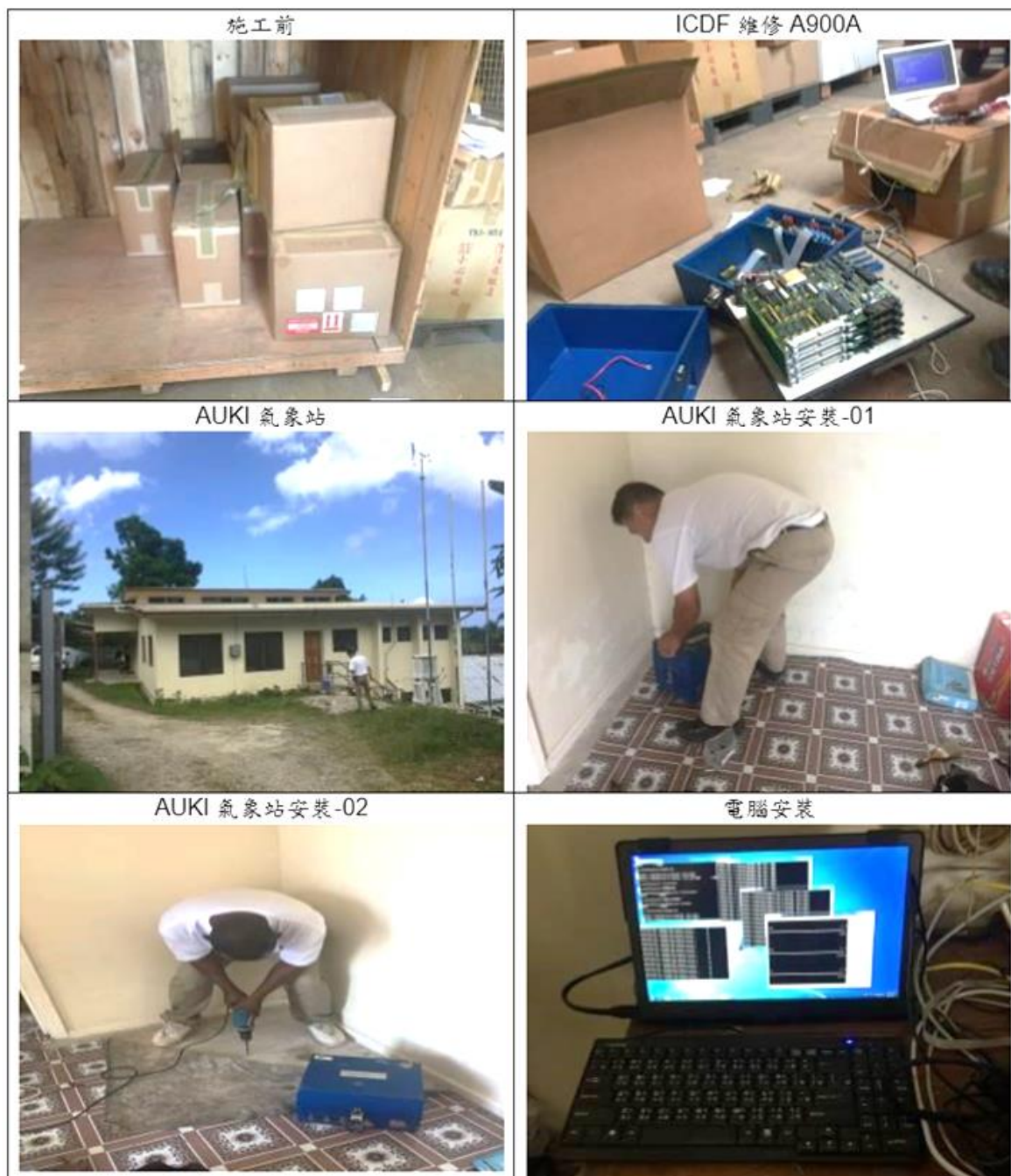
照片1 於索國 AUKI 氣象站安裝氣象、地震儀器。