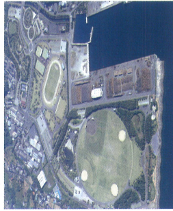
エコパーク水俣(水俣埋立地)

幅40m、長さ465mの曲線階段式護岸で、観光客や市民の憩いの場となっています。