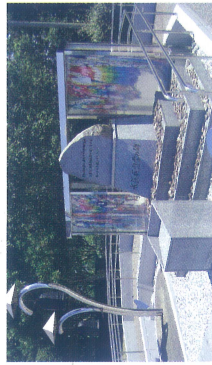
水俣病犠牲者慰霊の碑

水俣湾のヘド口を浚渫してできた58.2haの埋立地のうち、41.4haが環境と健康をテーマとした公園として整備されています。