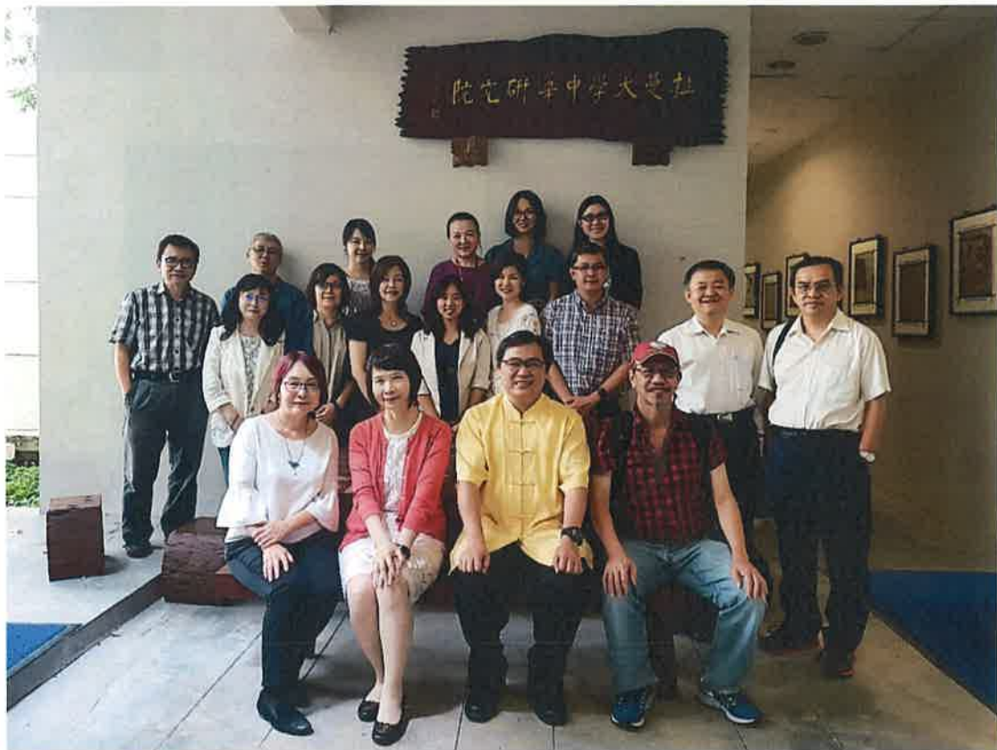
拉曼大學中華研究院

此行五日全程考察，對於檳城人文世界與人文生態產生一定程度的瞭解，並加強了台灣學人對華人移民史和文化史、英國殖民歷史，以及峇峇娘惹群族文化的理解。與當地文史建築研究室舉行具體的座談和對話，得以深入理解當地華人文史古蹟的修復工程，文史景觀之維護與推廣，此有助於未來建立台灣與馬來西亞兩地人文地景之保護與修復更具體的合作。而與馬來西亞重要大學（拉曼大學金寶校區）的座談交流中，我們進一步推廣了台灣的人文研究成果，並瞭解馬來西亞人文教育實際狀況。從本次多面向的考察訪問行程，重新建立了人文意義的詮釋軸向，擴張台灣的人文資源，在華人與異族交集的城市駐點，吸收在地知識，建構豐饒的新南向研究價值。預期本計畫將有助於科技部人文司推動各項接軌新南向政策的計畫和活動。