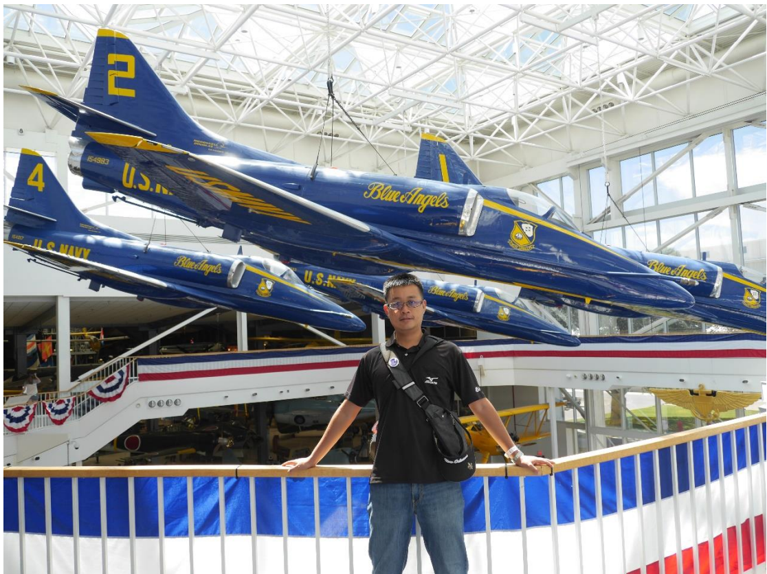
參訪海軍航空博物館 後為美國海軍藍天使特技飛行隊 F/A-18 模型