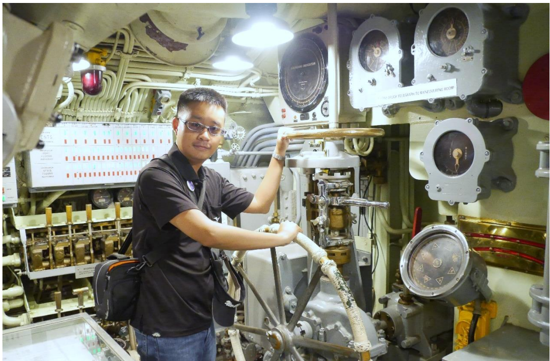
參訪阿拉巴馬號戰艦紀念公園 圖為鼓魚號潛艇 USS Drum (SS-228) 內部