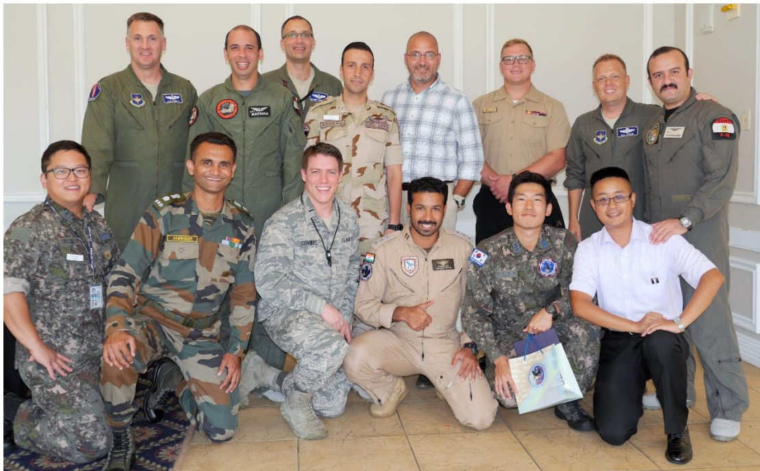
結業典禮 學員與教官合影