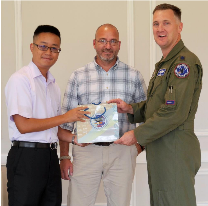
結業典禮 致贈紀念品予學生主任及教官