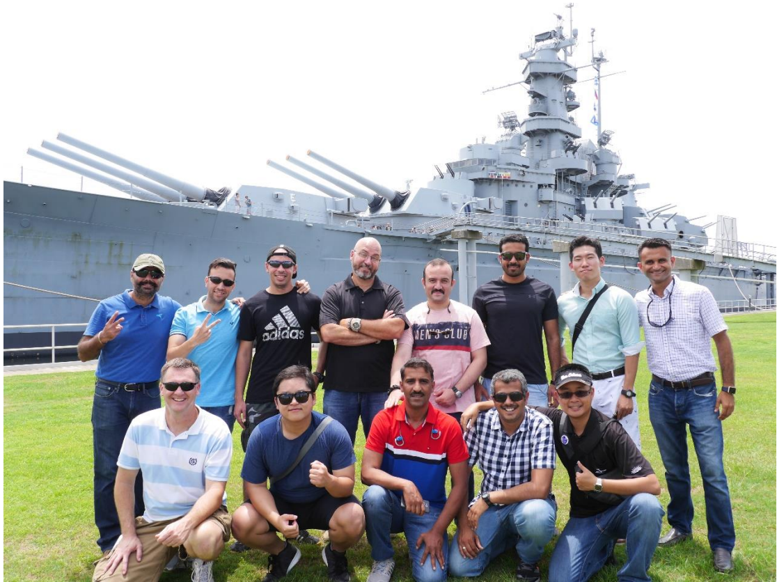
參訪阿拉巴馬號戰艦紀念公園 學員與阿拉巴馬號戰艦合影