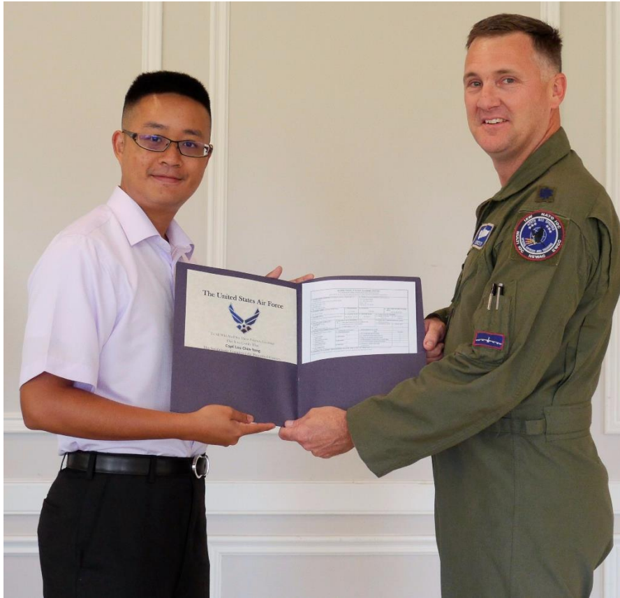
結業典禮 頒發結業證書