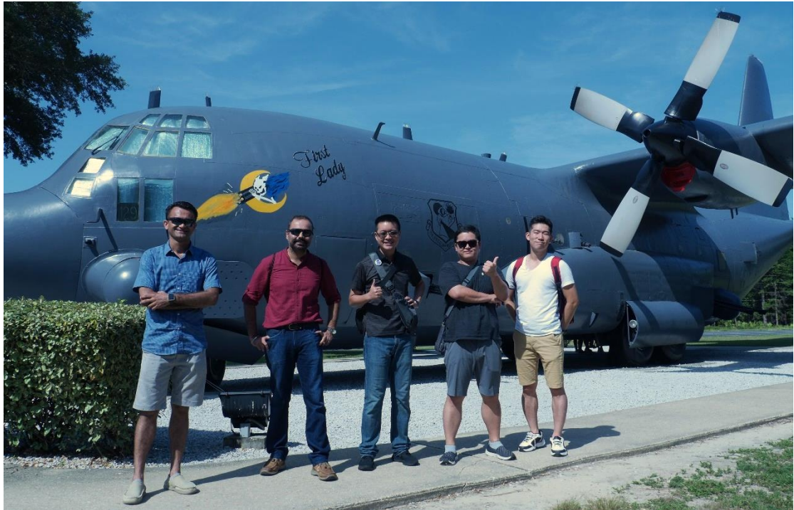
參訪艾格林空軍基地武器博物館 學員於機尾編號 53-3129 暱稱「The First Lady」的 AC-130A 合影