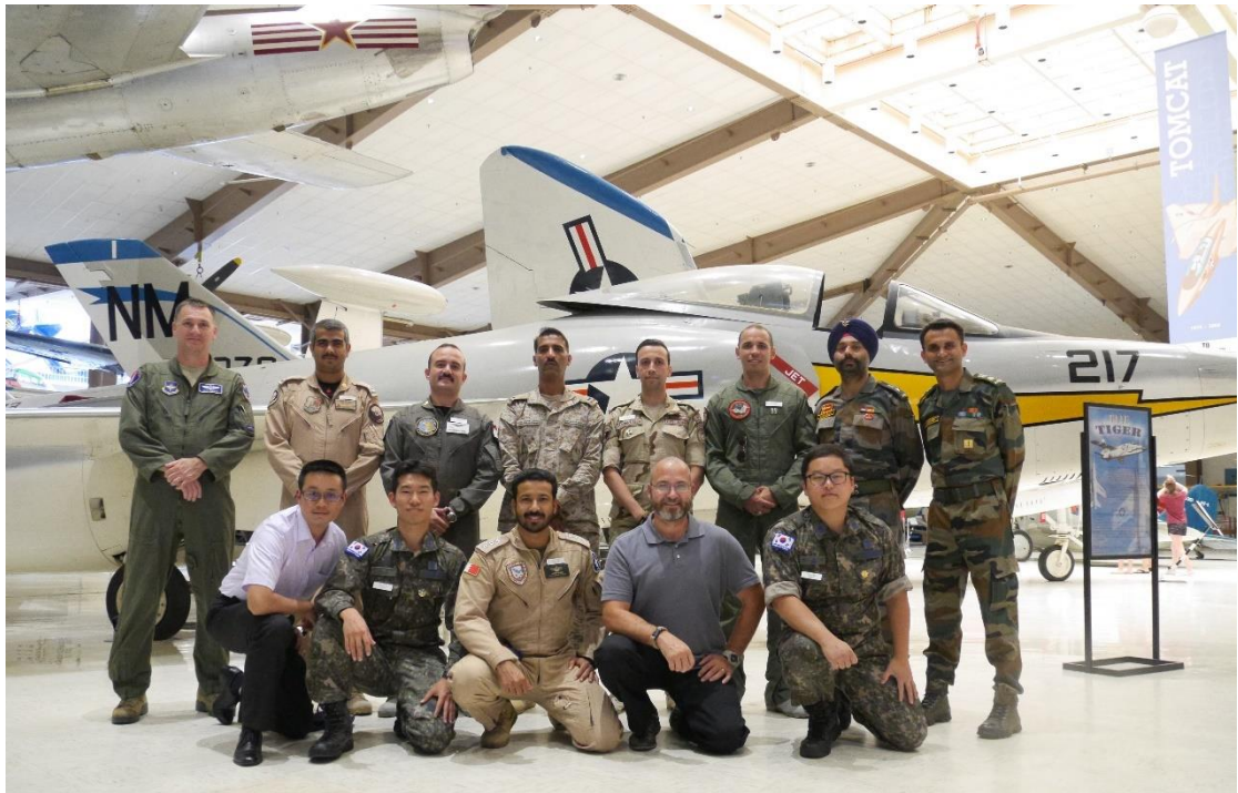
參訪海軍航空博物館 學員於F-11F 虎式艦載戰鬥機合影