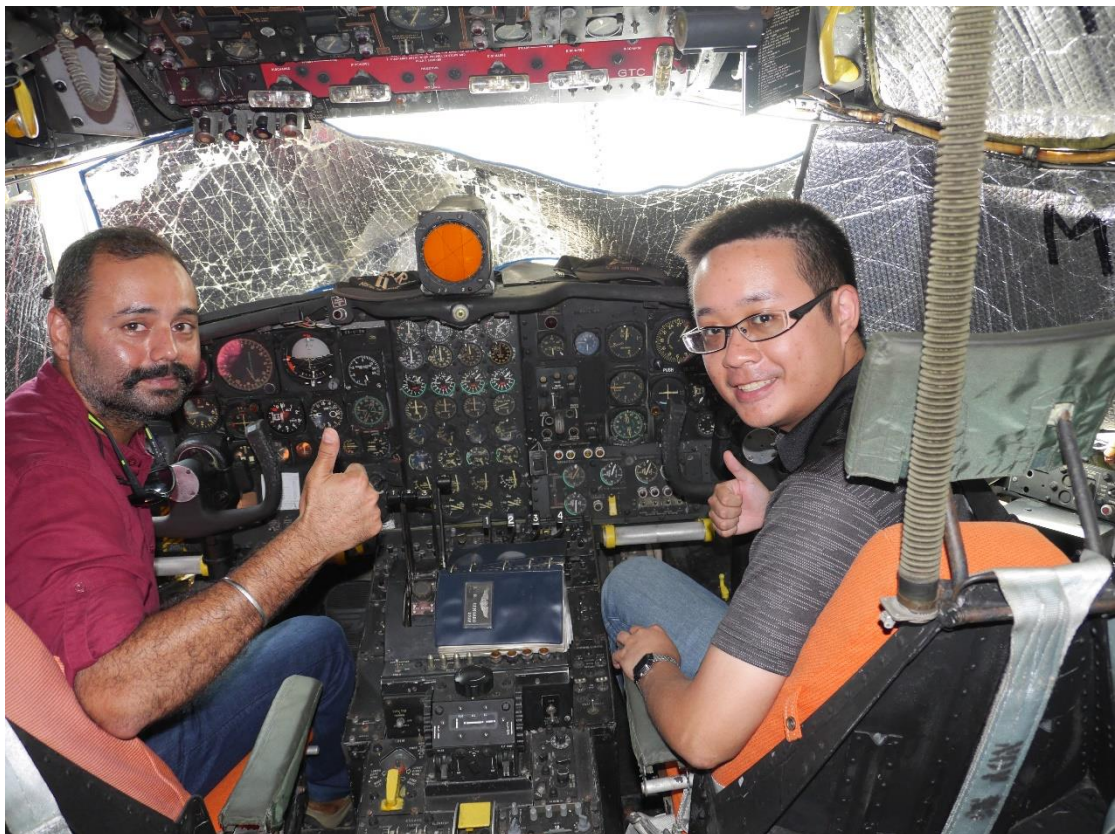
參訪艾格林空軍基地武器博物館 圖為機尾編號 53-3129 的「The First Lady」駕駛艙