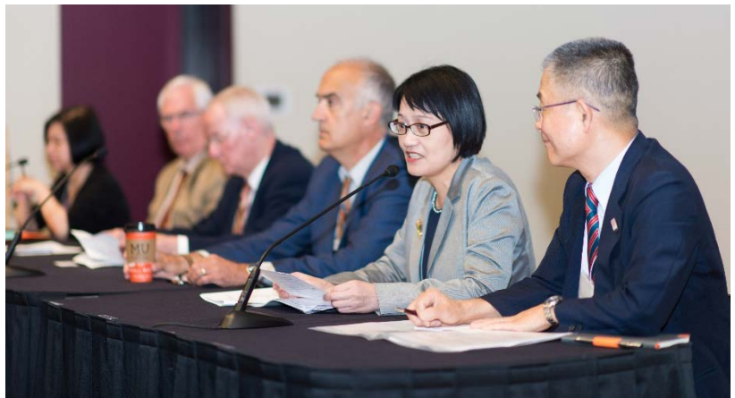
OSU 校長、藝術學院院長、 公衛學院院長及本署蔡副 署長受邀開幕致辭