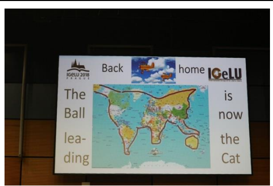
The Ball leading is now the cat