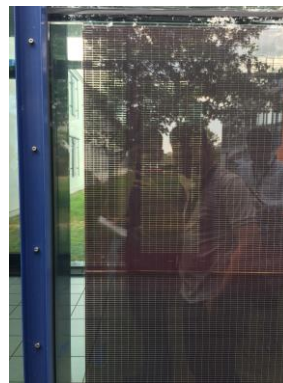
圖 15 運用熱能儲存窗簾將管內水加熱