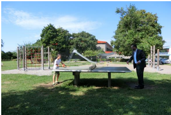
圖 10 社區重視孩童及青少年公共空間