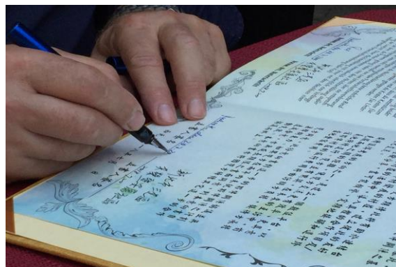
圖 47 共榮暨安康、南埔、大有及龍目社區與杜羅特簽訂合作意向書