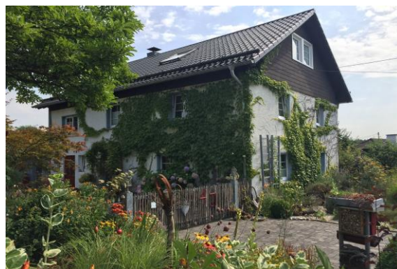
圖 21 家家戶戶維持環境美觀

社區的中心烤窯為在地聚會場所，供居民共同自製麵包，最大功能在於凝聚社區，也因為凝聚力強，居民由下而上提出許多構想，改善生活並實際去執行，20年前，一開始村長集合大家，開啟溝通對話，討論解決的對策，最重要的是希