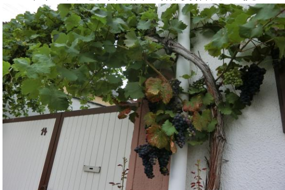
圖 6 將葡萄意象深根在地各個角落