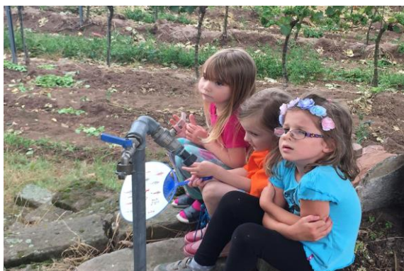
圖 4 當地對於孩童照護相當重視

店及民宿沒年提供的過夜住宿約 15000 人次，在非觀光季，飯店也提供給季節工跟學徒。對於大型活動，在教區大廳裡有一個可容納 180 人的舞台，每年的「藝術和葡萄酒」也在這裡舉辦，透過葡萄酒節跟葡萄酒公主的加持，釀酒莊園和適合徒步旅行觀賞的葡萄酒園全景，是此處觀光活動重點。