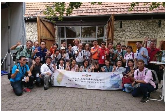
圖 50 與埃佩爾斯海姆合影

埃佩爾斯海姆保存在地文化，包括珍貴萊茵河遺址，由專業協會負責維護博物館營運與化石挖掘，罕見中世紀的村莊因設防所建造的壕溝，以及活化舊穀倉，作為咖啡廳、圖書館、民宿多功能使用。村民共同參與公眾事務，如透過足球場草皮之認養，讓居民參與，共同維護環境，增加彼此連結，以「打造工作、居住、休閒的宜居社區」為目標持續發展。