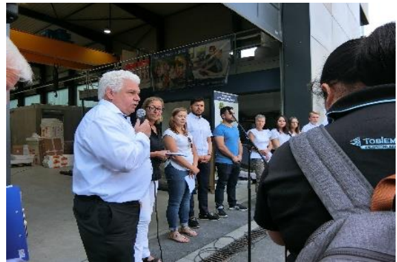
圖 39 赫靈企業介紹提供在地就業與社區互動