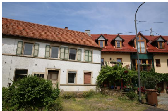
圖 44 透過老屋活化將年輕人留下