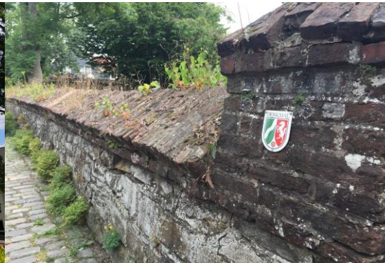
圖 29 在地歷史建築保存