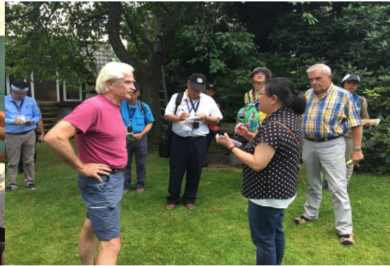
圖 27 在地藝術家進行環境解說