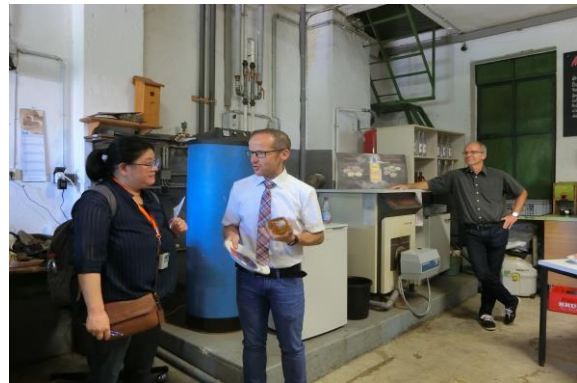
圖 11 當地蘋果家工廠協助當地加工

水果是 Erfweiler-Ehlingen 的一個重點，在社區中心有一個水果園，透過與學校合作的方式，如鄉民代表會捐贈每一班級一棵果樹由學生照顧，並且在收穫後處理其果實。因當地具有稀有的蘋果品種，並與最具規模的水果園藝協會與自然保護協會合作，共同照顧社區中心的果樹園，另外，當地亦有一處蔬果加工社團以會員制方式，讓村內的水果能在此處加工。