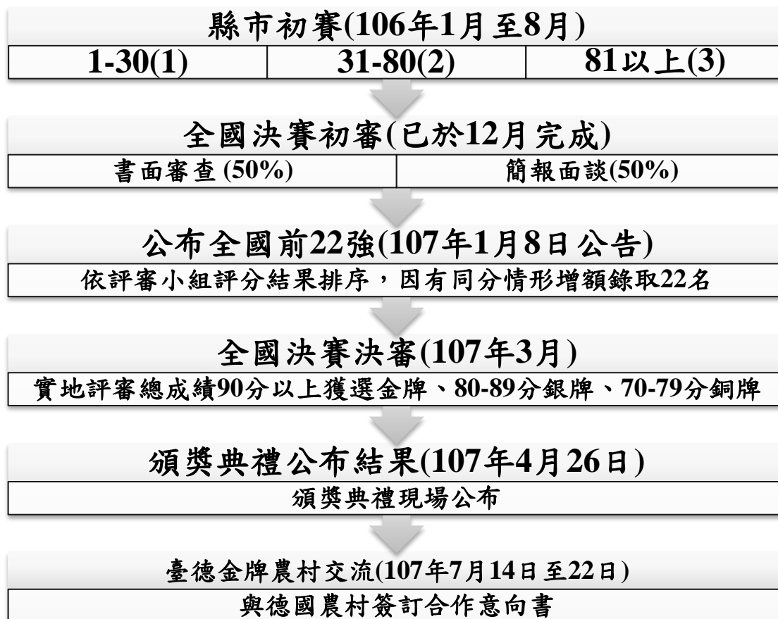
圖 1 第一屆金牌農村競賽辦理過程