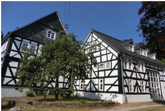
圖 34 社區隨處可見對於傳統的半木建築保存

座就學校古蹟建物成為大家的聚會場所。這裡還有自然資訊中心，一個老年俱樂部，擁有一間世界商店。這些都是各樣活動和「舊村文化」節目系列的場地。舊的磨坊現在用於發電。村中的自然小徑上設有信息板，提供了有關歷史，土地管理和灌溉系統的資訊，並強調了文化景觀管理的價值。附近的池塘已被改造成天然泳池，並設有沙灘區。「感官之路」和「聲音之路」兩條健行路徑通過村莊。