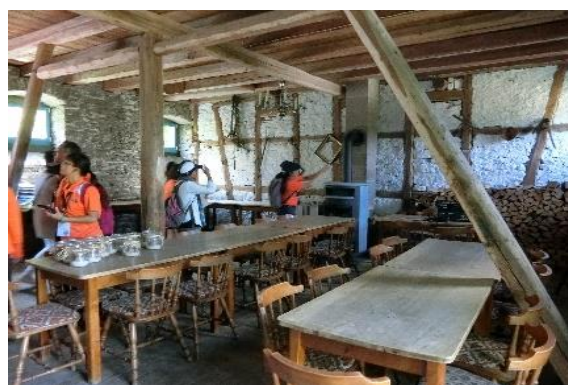
圖 41 原有舊屋改造重新賦予新意義，為社區聚會點以及出租