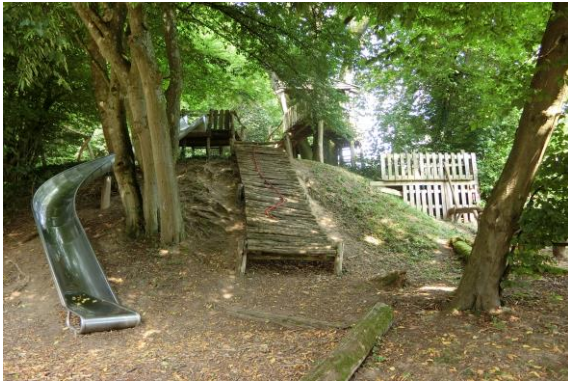
圖 22 社區對於孩童照護相當重視