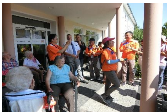
圖 40 瓦爾梅德注高齡化問題，設置銀髮族照護場所，提供長者照護所需

各世代的保健和住宅問題，目前被列為重要議題。「生活在村子裡」這個項目中也包括老年人照護以及無障礙設施的改建，另外因為小家庭增多，積極投入小型住宅的建設，並考慮保健的必要，投資一個大型藥局。