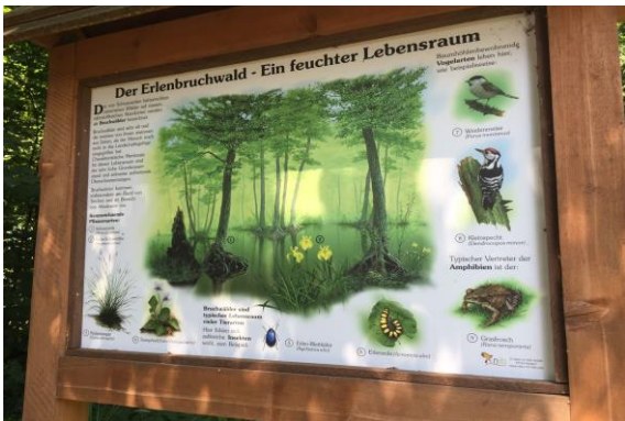
圖 24 社區將周遭生態融入在地教育