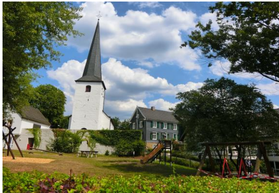
圖 28 教堂與鄰近公園為居民聚集中心