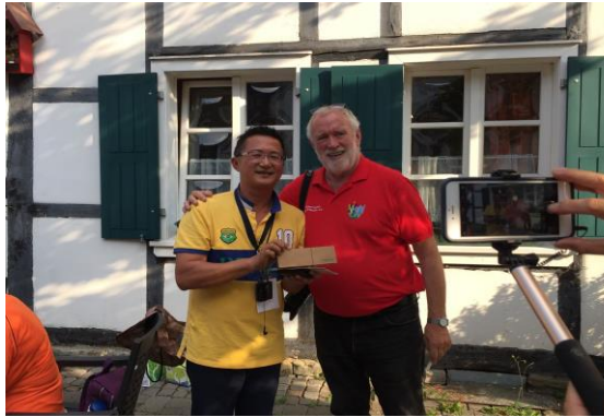
圖 26 村長與團圓互贈禮物

值 -- 傳統與未來(“Liebenswert und lebenswert - unser Dorf mit Tradition und Zukunft” )」為願景，榮獲第 25 屆德國農村競賽銀牌獎