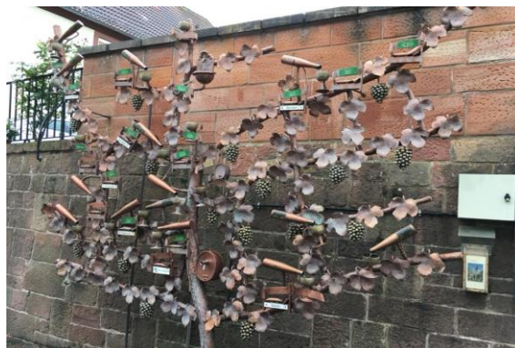
圖 3 將葡萄意象融入裝置藝術呈現社區地圖

Weyher 非常重視文化景觀元素，村子外圍的巴洛克式的神社、十字架碑石和藝術家雕構成一條景觀長廊，居民藉此將此區有名的健行路徑連結。由於當地地質的礦質土壤的特殊性，適合葡萄的種植，此地盛產葡萄酒，因此在地許多旅遊活動結合葡萄酒協會發起，這些活動由當地 25 個主流農企業協力，這同時也增進居民凝聚力。另外，這裡的駝鳥農場、酒莊、畫廊，非常吸引遊，飯