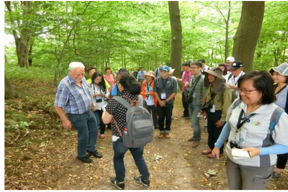
圖 23 村長介紹社區對於生態環境的維護