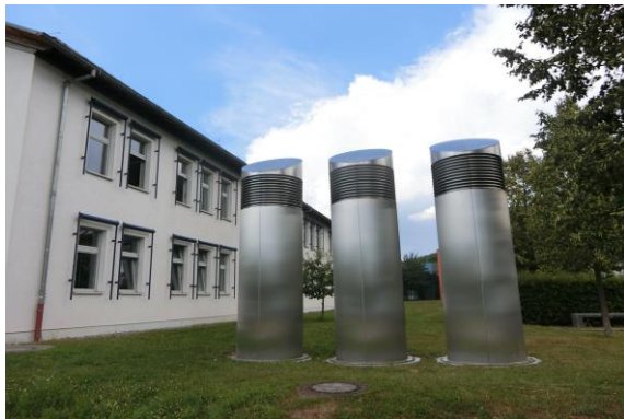
圖 14 透過風洞調節空氣溫度達節能效果

Umwelt-Campus Birkenfeld 為位於薩爾蘭邦(Saarland)之循環經濟示範點，透過物質流管理(Material flow management)的實踐，包括運用太陽能、生質能等多樣再生能源，發展太陽能停車場之汽車與腳踏車租借系統(充電)及運用管理方式達零排放及能源自主，強調以整體規劃方式，運用系統管理讓能源效率提高，而非一味增加來源為該示範點之核心價值。