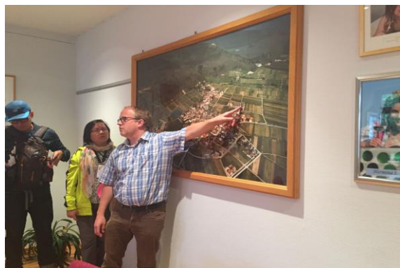
圖 2 村長介紹魏黑爾之地理環境

Weyher 是一個人口數約 553 人，面積僅有 5.16 平方公里的散居型村莊，人口結構 0-17 歲 78 人，18-65 歲 312 人，65 歲以上 164 人，為 2016 年第 25 屆德國聯邦農村競賽的金牌農村，以文化景觀與旅遊為其亮點，更曾於 2015 年獲得萊茵蘭邦農村更新特別獎(在地建設)。周圍綠樹環繞，葡萄園部分構成村莊景觀，週遭的哈特森林為獨特的栗樹林所構成。