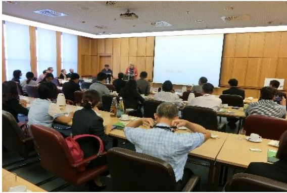
圖 30 拜會推動德國農村競賽的聯邦農糧局