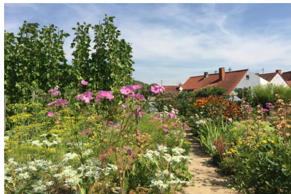
圖 45 以可食村莊為目標維護生態

他們懂得默默耕耘耐心規劃，30 年的努力讓村子經濟結構轉型，老屋的更新、年輕人的留下、區域的整合，改變的過程中也有懷疑與反對的聲音，獲選為第 25 屆農村競賽聯邦級金牌。