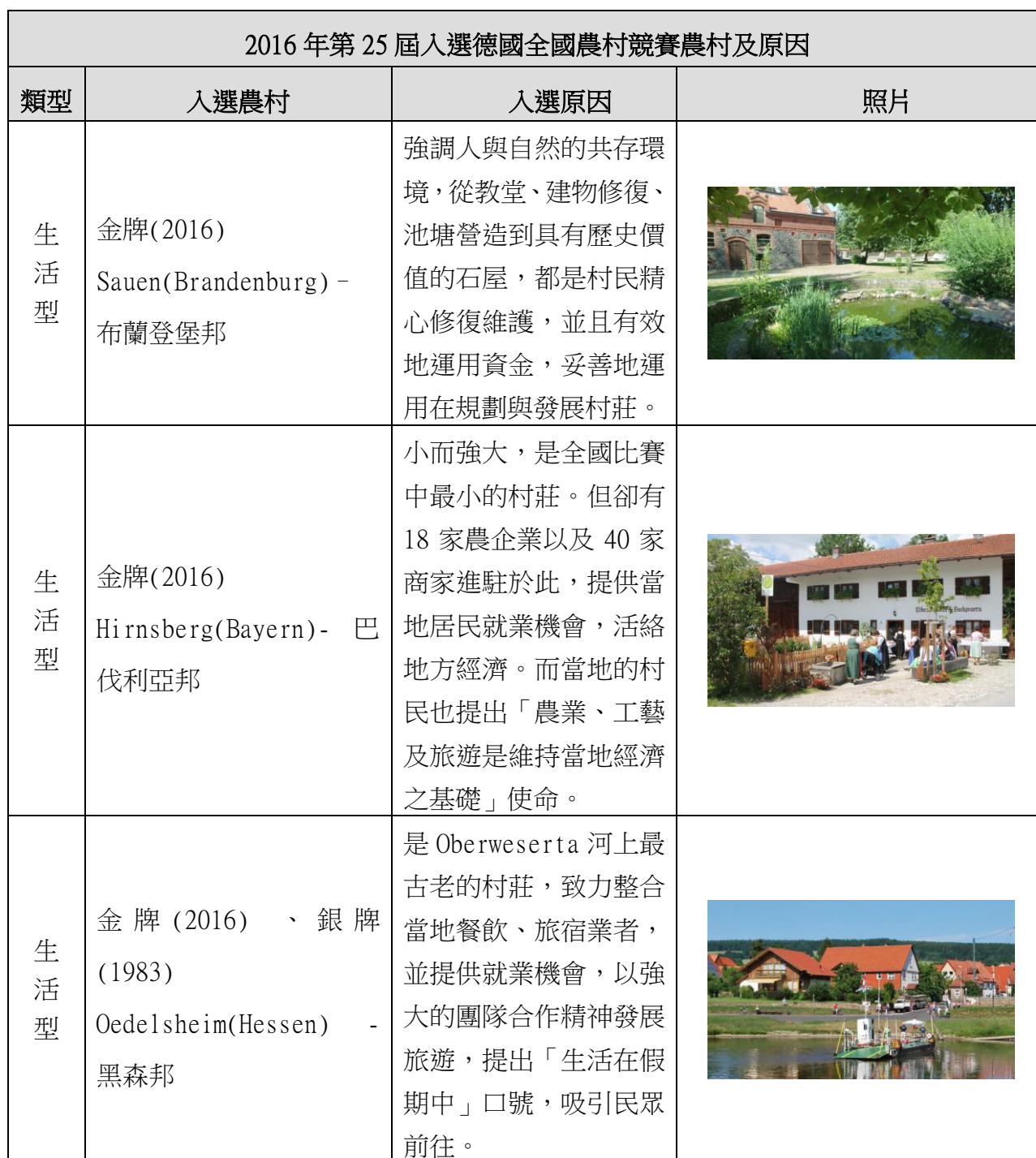
表 5 德國 2016 年第 25 屆全國農村競賽獲獎農村及理由