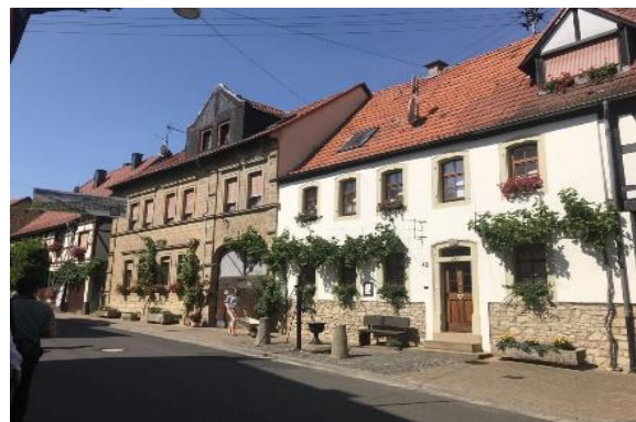
圖 49 德國農村建築材料與工法一致性，增添環境整體視覺美感

當地提供完善的交通網絡及生活機能，便於往返城市與郊區交通。也因該地介於兩個萊茵河支流中間，有許多工作機會，火車每小時有開往曼海姆和法蘭克