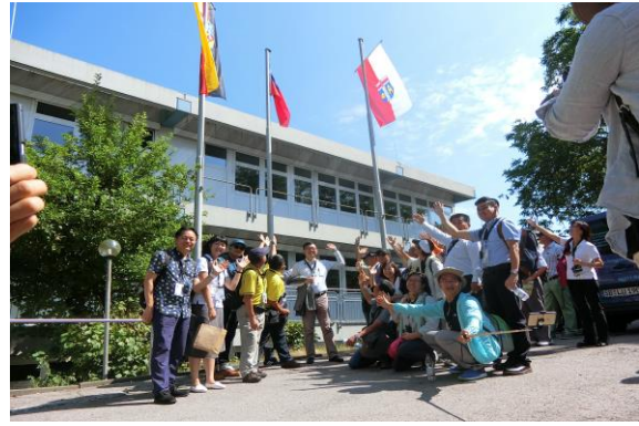
圖 13 社區升起國旗以示歡迎