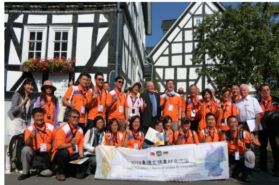
圖 35 臺灣交流團隊於霍爾茨豪森合影

「參與，整合，建設未來」為社區重要願景，村民在一年一度的「木屋村談」聚會中貢獻自己的想法，社區的指導原則是「對新住民，新的生活方式採取開放的方式，讓這裡成為大家的故鄉」。移民和很大比例的移民被視為可持續加強村莊的機會，當地企業具有極高的社會責任意識，推動「難民近入職場」的專案。以「住在內，保護外」為口號，增強自然環境保護觀念，位於三個邦的交界處，農村內有三個自然保護區，強調住在村子裡並保護周圍環境，重視自然資源永續，城市規劃目標以減少開發，並激活現有空地為理念發展未來。