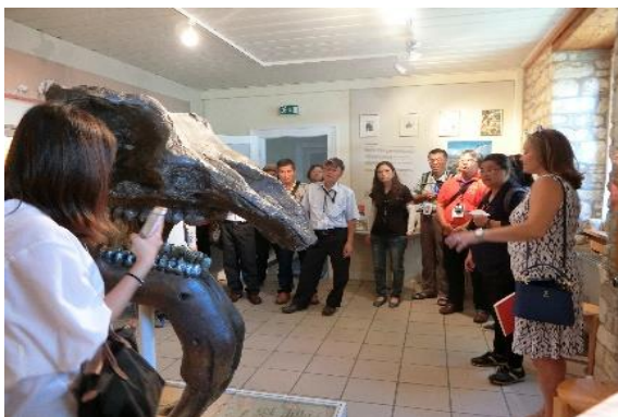
圖 48 參觀 Dinotherium 博物館內所展示的萊茵河遺跡

該地區保存良好自中世紀以來設防所建造之壕溝，成為該地重要文化景觀特色，包括法蘭克人的石板屋、四方形建築，以及達貝爾塔為此村之特色。此處以發現史前萊茵河地區之化石聞名，在村子週遭就有一個考古保護區，曾經作為彈藥庫之用。當地通過有計畫性的維護，開發出一片乾燥的草地，出現蘭花和稀有蝴蝶品種。此處的考古成果可以追溯到一千萬年前的萊茵河遺址。1820 年，在這裡發現了一種猿猴股骨，並命名為「埃佩爾斯海姆股骨」。稍後，這裡也挖掘到始祖象的完整上部頭骨。市政廳目前也兼作為「始祖象博物館」，原始的始祖象頭骨是鎮館之寶。有一個協會負責照料博物館和化石挖掘地點，挖掘工作仍然持續在進行，通常是在夏天作業。