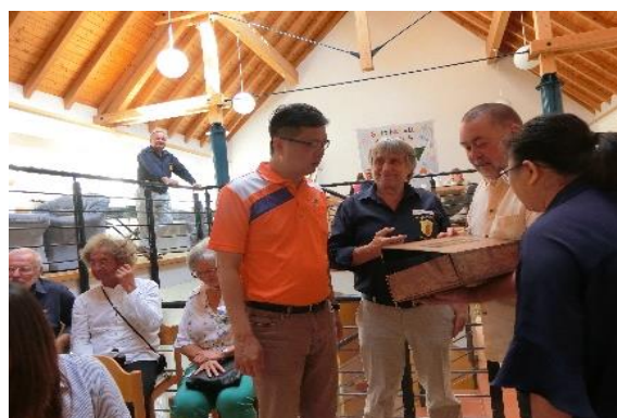
圖 43 村民介紹與當地 SooNahe 品牌推出之特色產品

這個鄉在行政上是完全獨立地方自治的，鄉有自己的稅收，而鄉長自 1984 年義務擔任至今，對於地方的發展努力了 30 年，村子的蛻變的具體作為如下：