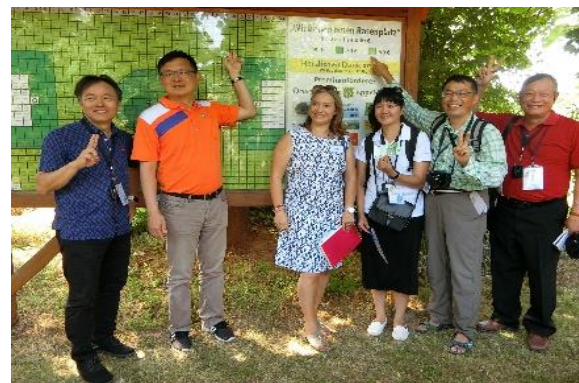
圖 51 臺灣交流團隊參與埃佩爾斯海姆足球場草皮認養