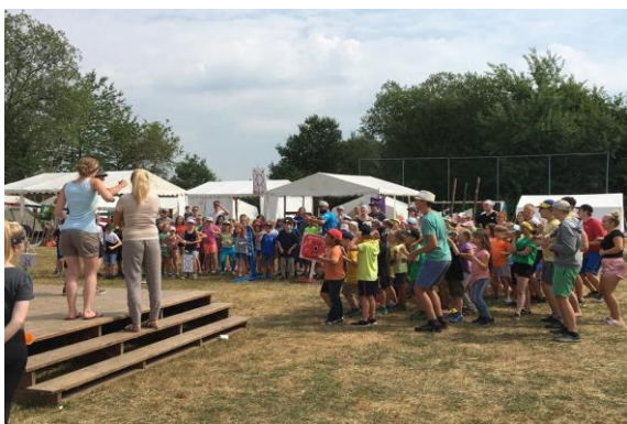
圖 20 般若德無償提供土地舉辦營隊活動增加社區曝光機會