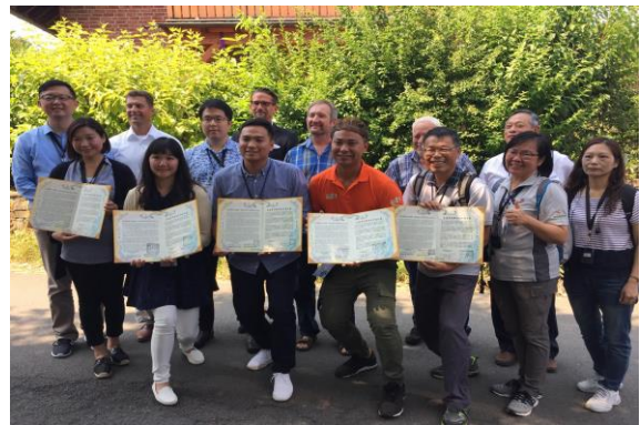
圖 25 競賽讓村民有目標變成嗜好，一次次的競賽讓村子持續改變

另外，當地具有好客文化(Gelebte Willkommenskultur)，傳統上，新抵達的住民會由村代表團引領參觀村子，並邀請到村里的歡迎晚會。而高度的生態意識，讓當地不管是私人建築或是公共空間，綠化無所不在，當地居民非常重視使用傳統的灌木和樹種，而在翻修建築物時，也特別注意使用當地的材料，這也在生態方面發揮作用。並設有專門的生態資訊平台為這裡的村民提供支持。