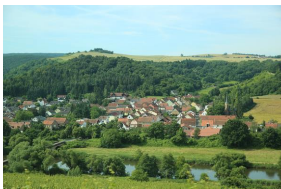
圖 42 過去 Duchroth 村因地屬偏僻、交通連繫困難，導致人口外移

運用想像力設計出許多創意藝術項目和活動，例如以農村婦女的餐點來與國際玫瑰花園工作坊合作，展示了該地區的特色。體育活動在這裡同樣重要，當地培育的輕田徑項目跟跑步選手在德國非常有名，體育社團已經產生了许多才華出眾的國家冠軍，標槍運動的選手中曾經拿下奧運冠軍。自 2009 年以來經常舉辦古典鋼琴音樂會，「市政廳音樂會」是每年的亮點之一，享有很高的知名度，並吸引了從遠處到杜赫羅斯的音樂愛好者。