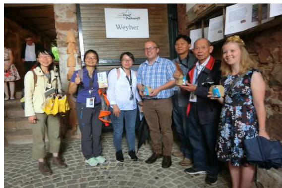
圖 7 團員與村長合影

在 Weyher 的高品質生活，不只宜居，也適合工作與度假，在地基礎建設良好，具完善的光纖網路鋪設，提供免費 WIFI，路燈改為 LED 技術，將市中心的表面和混合水分開，市政廳更安裝了節能燃氣鍋爐。由於當地協會和教區的良好凝聚力和交流，許多節日是共同組織的。同時，年輕人也積極參與各個領域。