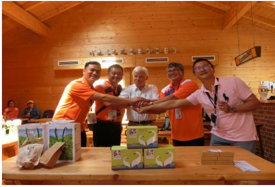
圖 36 無米樂、仕安、薑麻園及南豐社區與霍爾茨豪森簽訂合作意向書