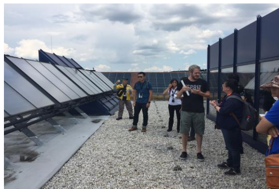
圖 17 校區太陽能板設置說明