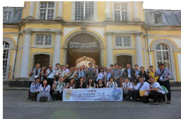
圖 33 臺灣交流團隊於波昂大學合影