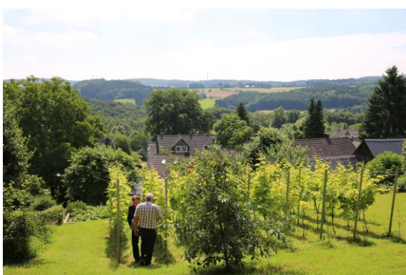
圖 18 居民以「未來的生態農村」為願景

大，各類議題通常通過社區協會發起討論，特別關注改善村里年輕和老年人的居住環境。例如，所有公共建築都是無障礙的，對進行共同執行的興趣是巨大的，村子裡排滿了各種活動。應老年人的要求，公民巴士服務持續擴大中，年輕居民也為老年者規劃出共餐及送餐服務，其他更多的行動服務及鄰里互助也著手進行，而老年人也做出回饋，例如幫忙照顧幼兒。另外，他們也鼓勵孩子們參觀農場或參加為孩子舉辦的「遊戲奧林匹克」，村民認為在這樣持續的努力下，20年後這個村子會向他們想象中的那麼珍貴。