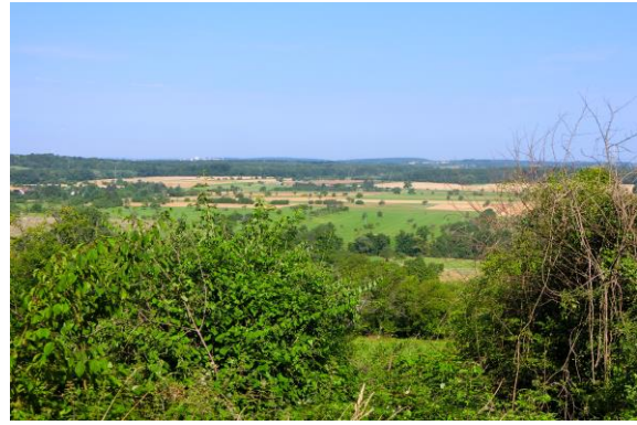
圖 9 居民驕傲的表示眼前所見均為友善耕作為該地獲獎主要原因之一