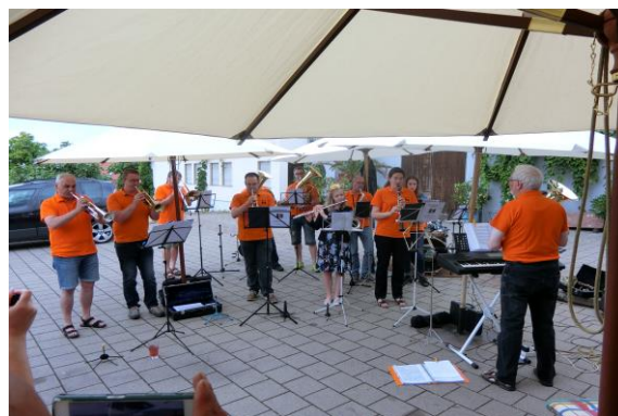
圖 5 村民藉由社團參與凝聚共識