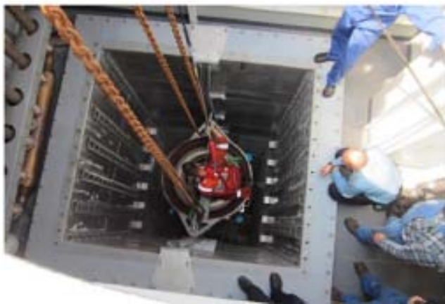
燃氣渦輪機回裝作業