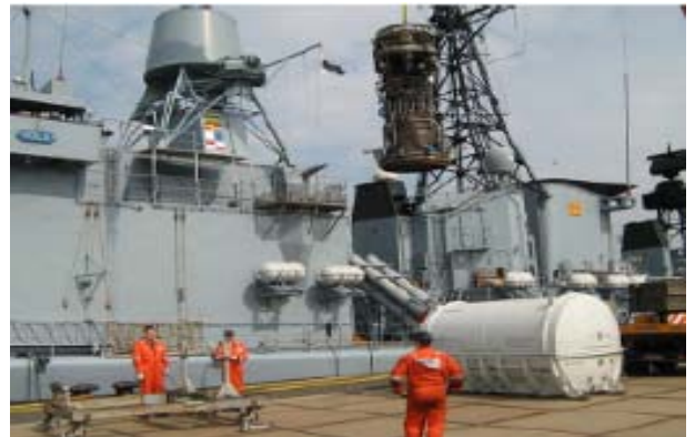
MTU 技術人員現場支援