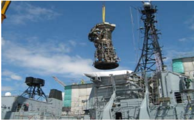
燃氣渦輪機現場換裝工程