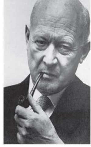
biologist Conrad Hal (C.H.) Waddington med groundbreaking research on aircraft enance during World War II.