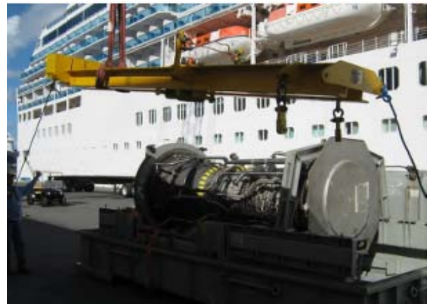
更換下之燃氣渦輪機