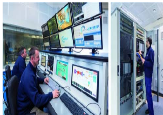
中央控制室及數據彙整中心