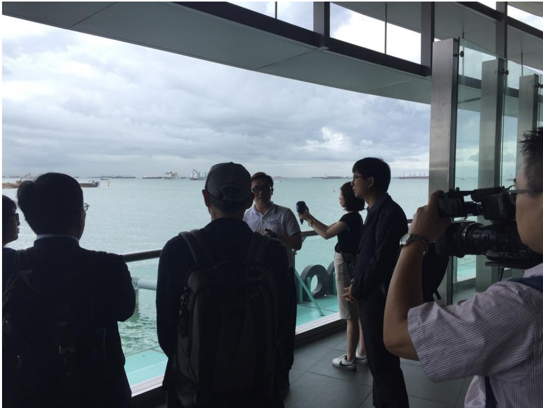
資源永續展覽館向邱司長、團員及隨行記者進行解說