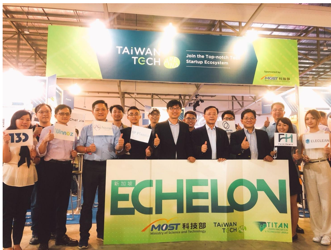
邱司長與本次參展團隊開幕宣示

展期兩天共計有 2,453 人次蒞臨台灣新創館、159 個媒合場次、48 則國內外媒體露出(含展前記者會)，蒞臨臺灣館人士包含國際創投如 Founders Fund、KK Fund、ID Capital 等；國際企業代表如 Airbus、Haier 等，收穫豐厚。