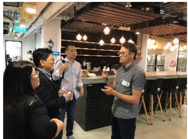
團員聽取投資執行長簡介