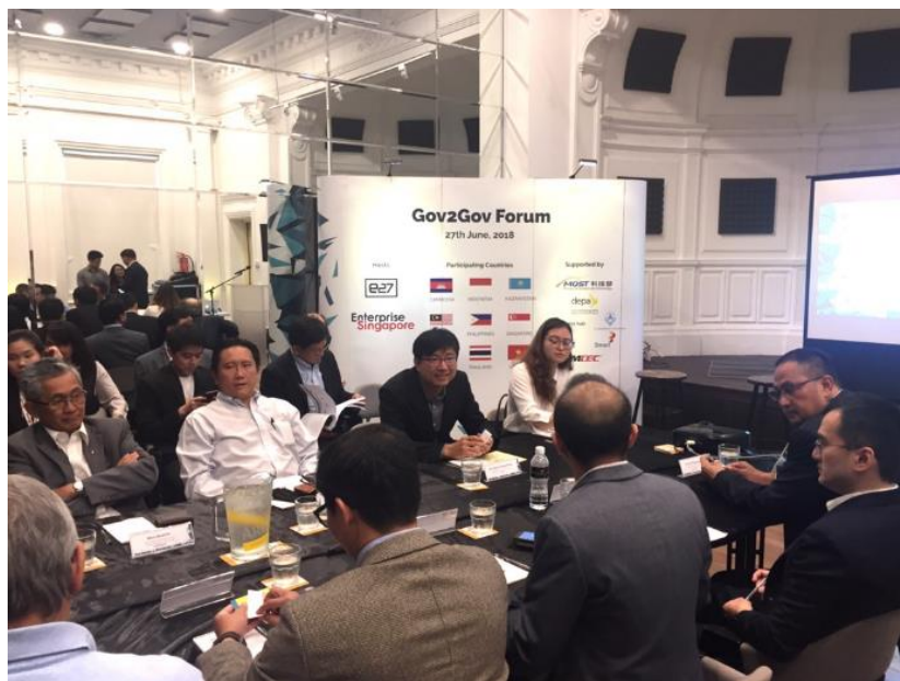
邱司長向各國與會代表介紹我國新創政策，並邀請來台合作交流