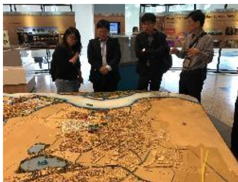
新加坡整體建築模型

值得注意，規劃館放置一個模型尺寸為 1：400 的新加坡整體建築模型，且模型依據實際市容定期更新，並為尚未建成的建築物建模，十分符合新加坡建築現況。因此，該模型除供市民及訪客觀賞之外，也是政府、開發商土地規劃討論之參考依據。