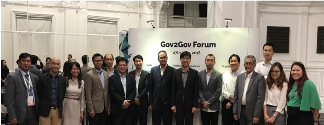
各國與會代表合影