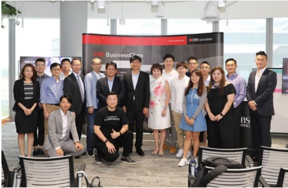
科技部團隊與 DBS 鄭秀鳳董事總經理等人合影