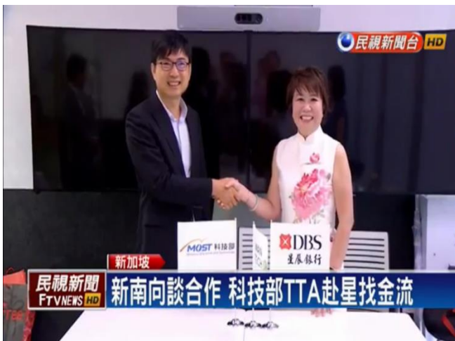
TTA 與星展銀行共同宣誓成為前進新南向市場與創新策略夥伴