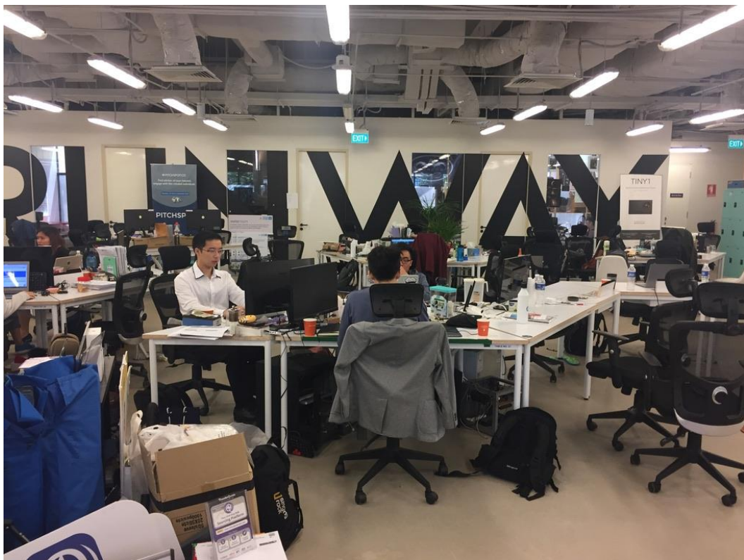
NUS Enterprise 創業空間 The Hanger