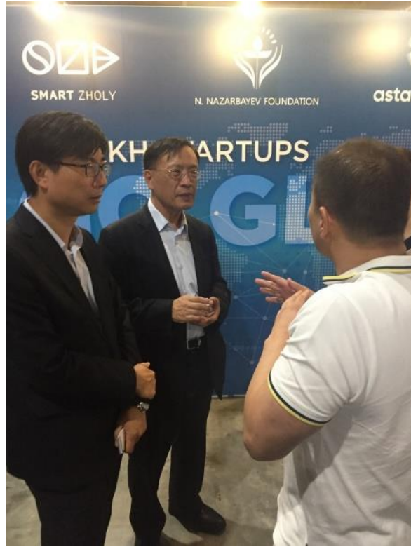
邱司長及駐新加坡台北代表處經濟組陳組長聽取哈薩克國家館簡介