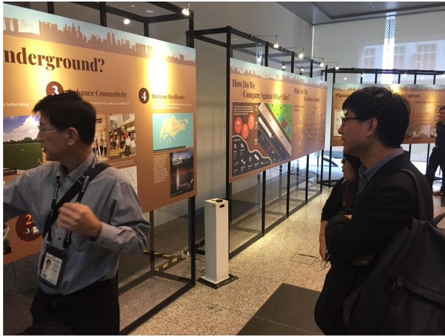
導覽員進行新加坡都市規劃簡介