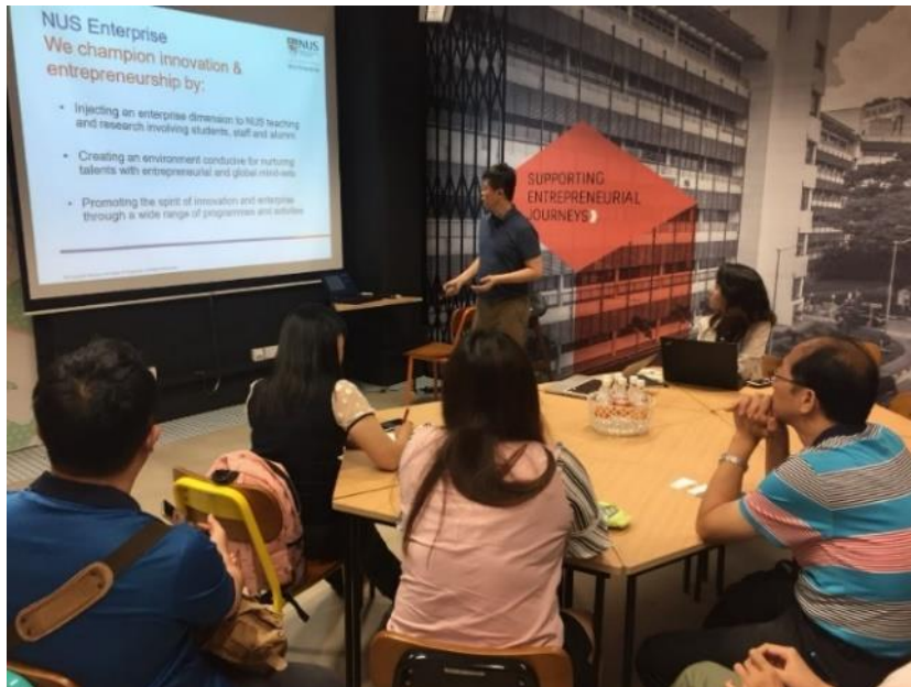
計畫新創團隊參與 ACE Program