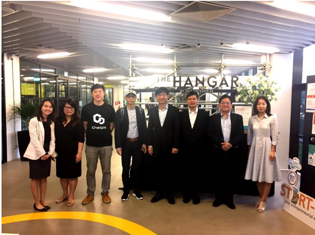
邱求慧司長與 NUS 副執行長(右三)及團隊合影