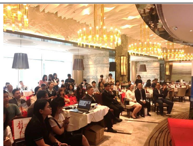
澳門推介會現場實況