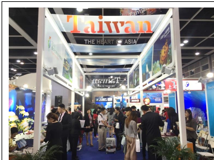
民眾參觀臺灣館實況