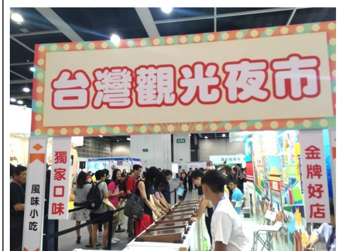
民眾體驗臺灣館夜市活動