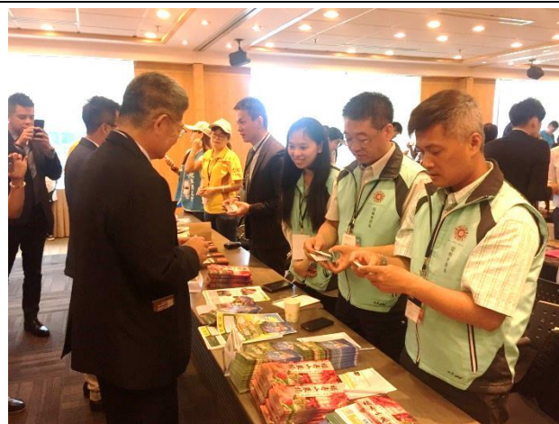
臺灣代表團與香港業者洽談交流