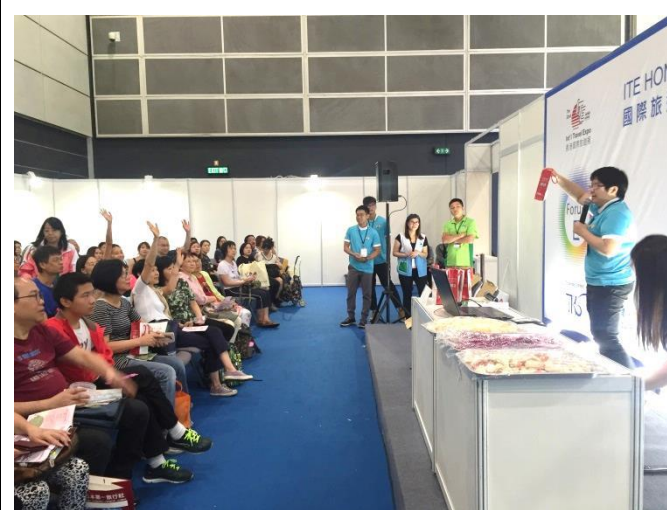
休農協會舉辦臺灣水果講座