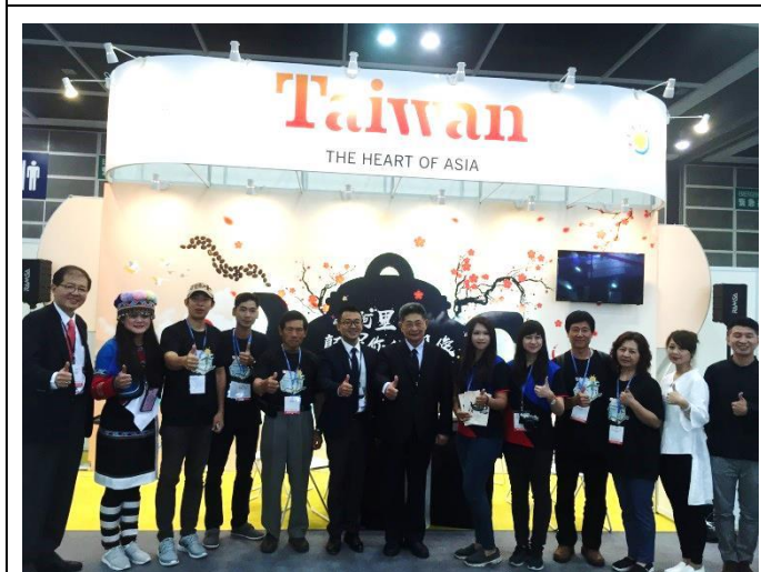
業者參觀臺灣館實況