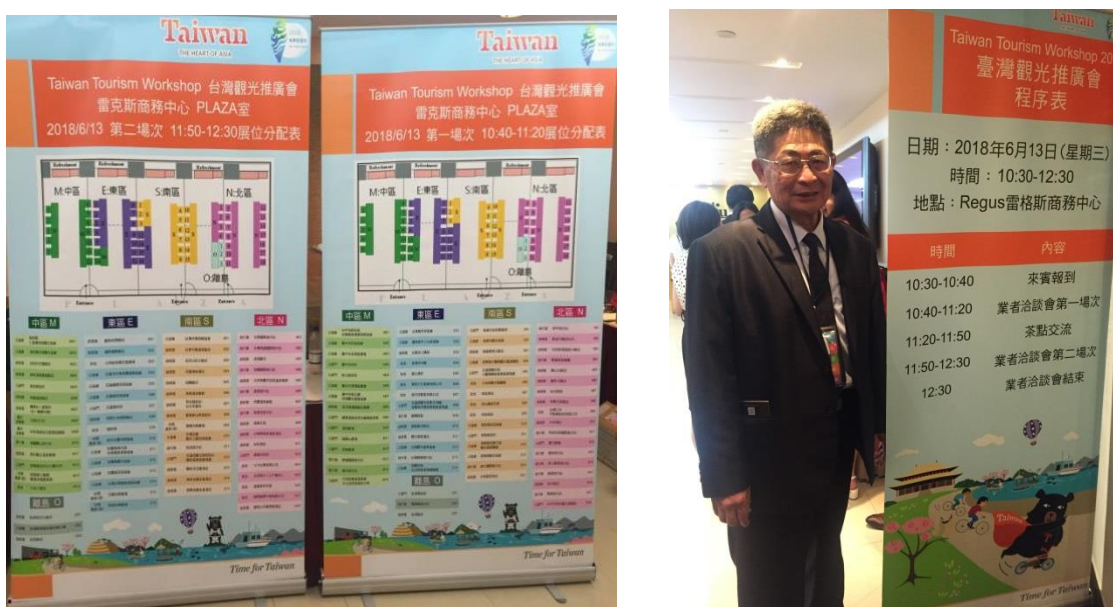
業者洽談會座位分配及場次表

業者洽談會以買家交易會方式舉行，共分為兩場次，各場次約 40 分鐘，活動規劃以北、中、南、東、離島之區域概念規劃臺灣業者展桌，並由香港業者跑桌方式辦理。臺灣與香港業者能藉此場合進行商業洽談與交流，面對面交流以瞭解彼此的產品內容及特色。臺灣代表團參加單位包含公部門、公協會、休閒農業(區)、旅行業、旅宿業及觀光遊樂業等相關產業，約 130 個單位，而參與洽談的香港業者約 31 人。