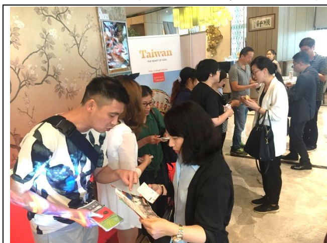
臺灣代表團與澳門業者洽談交流

本局邀請臺灣 10 個縣市政府、觀光協會、民宿協會及休閒農場等單位之代表赴澳門，與當地旅遊業界交流，分享臺灣最新、最優惠的旅遊資訊及產品。藉由推介會宣傳 2018 年為臺灣海灣旅遊年，以「探索台灣十島」為活動品牌，展現前所未見的臺灣離島旅遊魅力。此外，本局港辦更透過該場合，向業者及媒體公告「台灣玩家$588」優惠活動，此係本局與澳門航空及長榮航空合辦，將與澳門 7 家旅行社合作，並加碼推出 800 個購票名額予澳門市民，以優惠價澳門幣 588 元購買澳臺來回機票，現場反應熱烈，活動至 2018 年 10 月 31 日截止限時購買。同時，本局贈送每位旅客單程機捷運券 1 張，希望能吸引更多澳門旅客來臺灣觀光。