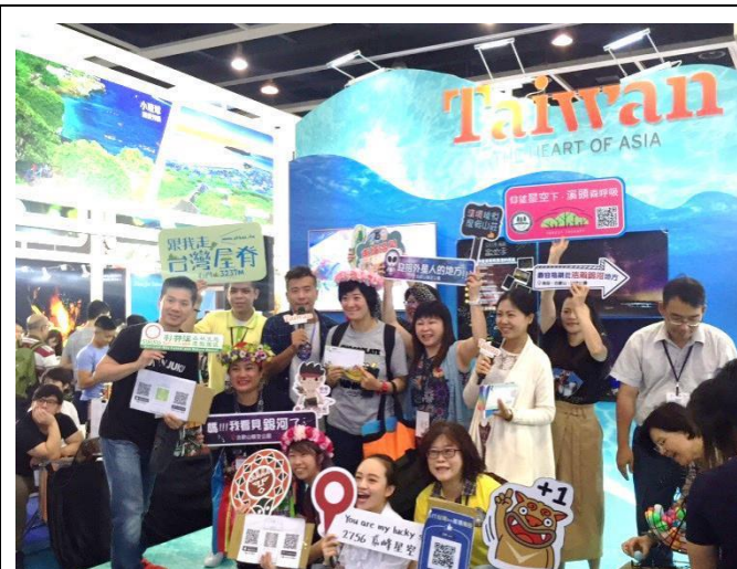
民眾參與臺灣館舞台活動