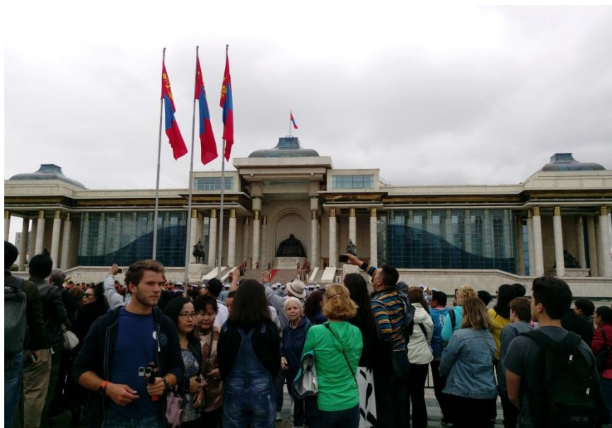
蘇赫巴托爾廣場上圍觀的群眾