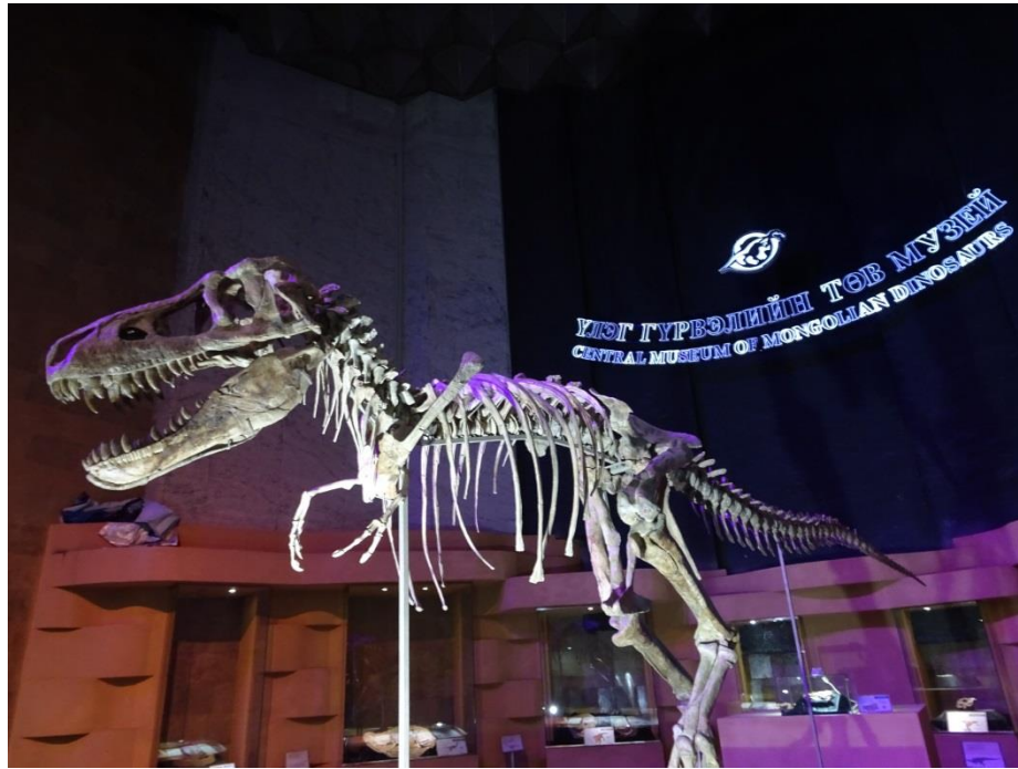
中央恐龍博物館一樓展區

由於此行未能參訪恐龍挖掘現場，故接續安排參觀中央恐龍博物館(Central Museum of Mongolian Dinosaurs)。此館開幕5年多，一二樓展區陳列了多組漂亮的恐龍化石，許多是在南戈壁省發現的，也有幾組化石主角是幼年期的恐龍，可惜的是面板全以蒙古文介紹，難以深入了解。值得一提的是，蒙古有許多恐龍化石因為走私而流出國外，展品中有數件自美國追回的化石。如果以後有機會進行合作，應該還是以學術研究優先，畢竟蒙古境內挖掘出多種恐龍化石，若要進行科教交流的話，語言則是最大的障礙。