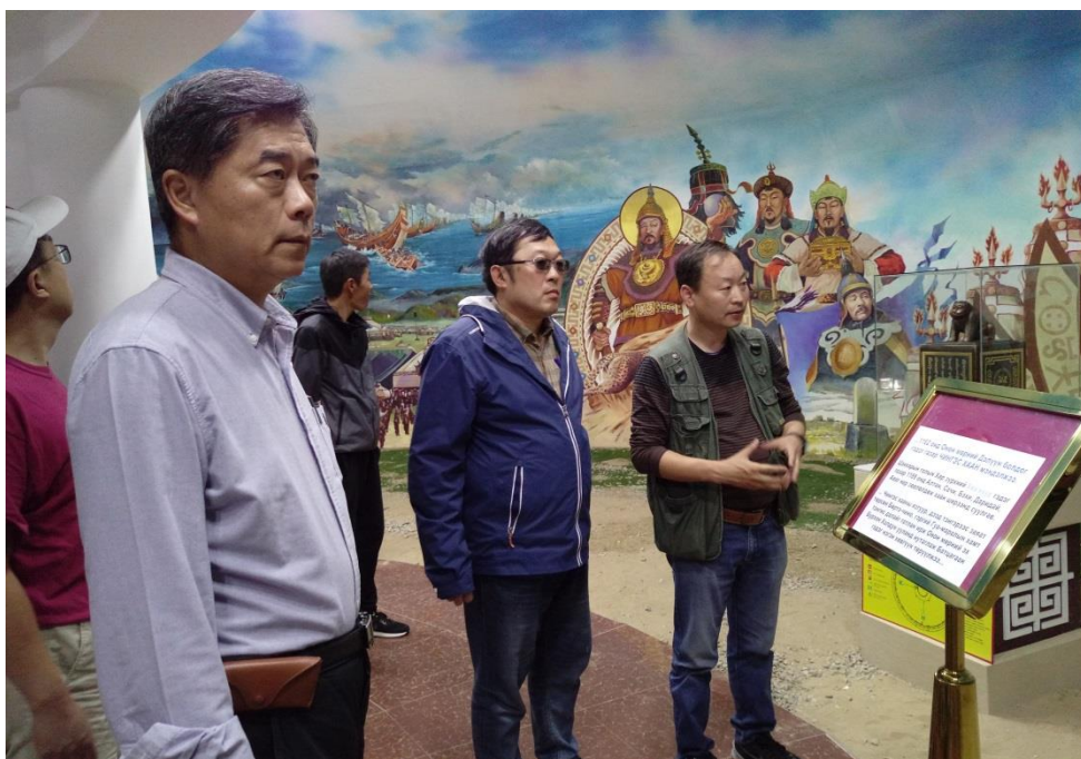
額爾登特市展示館的室內展區