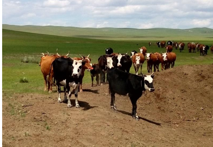
準備穿越馬路的牛群