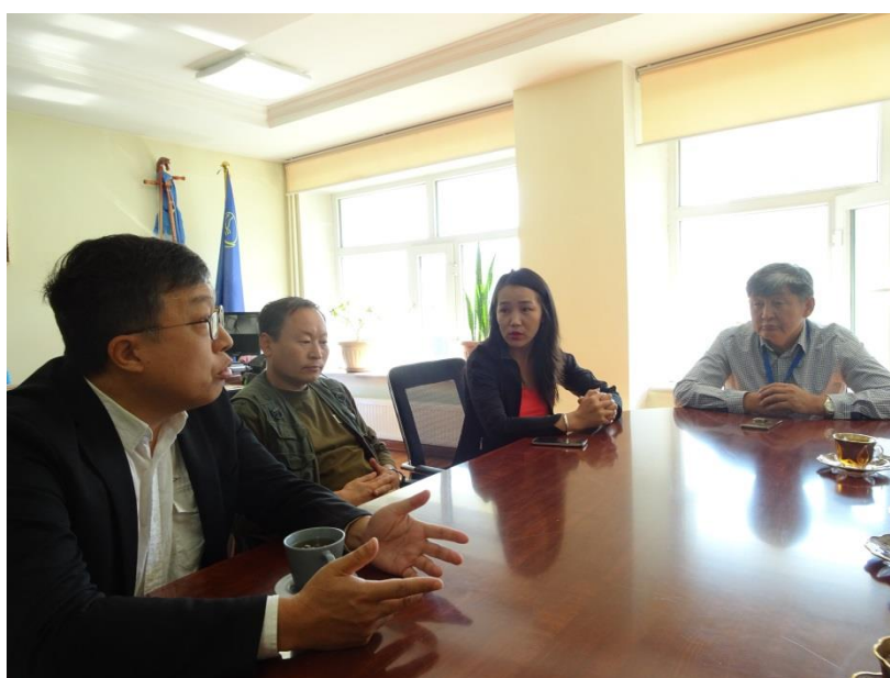
在國立蒙古博物館館長辦公室內一同討論兩館未來合作方式