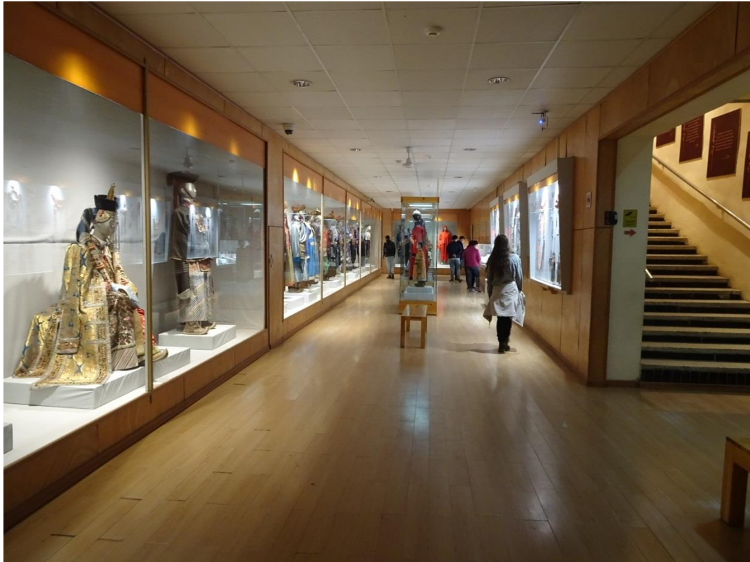
傳統民族服飾展區