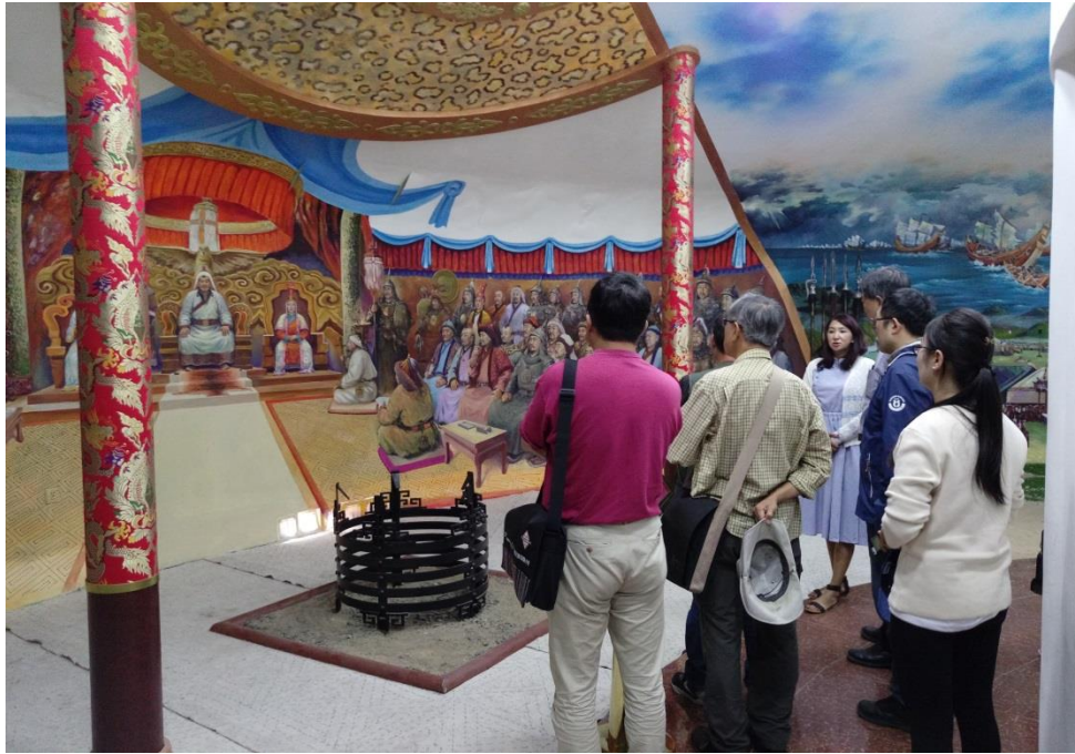
額爾登特市展示館的室內展區