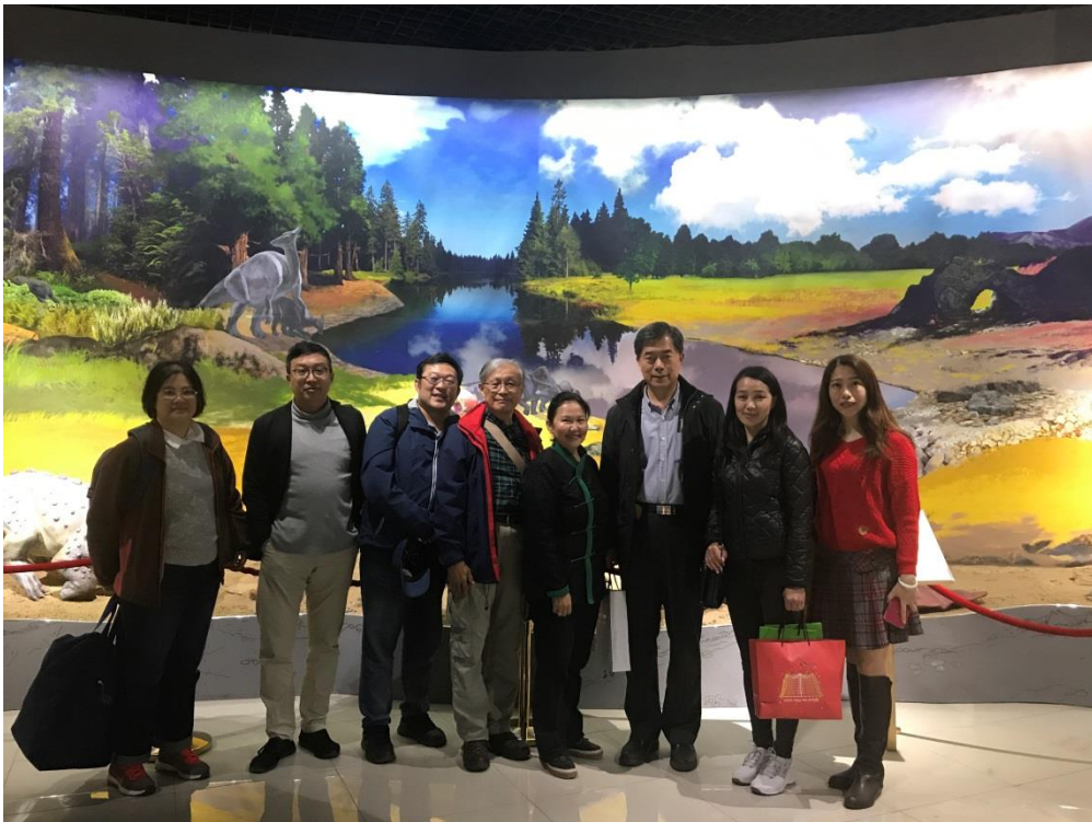
中央恐龍博物館二樓展區