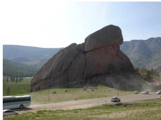
Melkhii Khad 實景

我們在石山下走走看看及拍照後返回烏蘭巴托，快進城時還是塞車，有些車於是離開柏油鋪面進入路旁的泥土空地裡、在飛揚的塵土中尋路向前一段之後再插入長長的車陣裡。我們到訪時遇上了全國歡慶、3天下雨，及溫度變化有些劇烈的日子（7月10日的高溫預測是攝氏15度，7月14日的高溫預測是攝氏28度），也算是值得記錄的經驗。