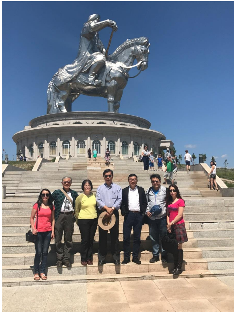
成吉思汗紀念館外合影

離開博物館後我們前往 50 公里之外的成吉思汗紀念館，一樣有車輛壅塞的情況。這個紀念館最著名的是高達 40 公尺的成吉思汗騎馬塑像，雄壯威武，內部有階梯，讓遊客可以登高到設於馬頭上的觀景臺俯瞰附近的風景。建築物內除了餐廳、紀念品店，也有展示區介紹成吉思汗的家族人物及遊牧民族使用的物品，比較特別的是以實物介紹了蒙古包演變的四種型制，除了內部擺設之外，旁邊也配有人及動物的模型。