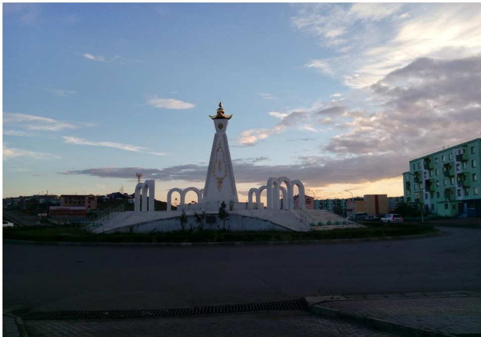
額爾登特市的街景

7月13日出發前往考古遺址前，ODBAATAR 博士特地與當地一個小型展示館情商，在閉館日時接待我們參觀。這個館的庭園裡有許多蒙古不同省份特殊地質景觀的縮小造景，周圍牆面上對各省也有圖文介紹，建築物本身造型特殊，並繪有具故事性的圖像。內部展示則是以描繪蒙古歷史的壁畫為主，配合著幾件展