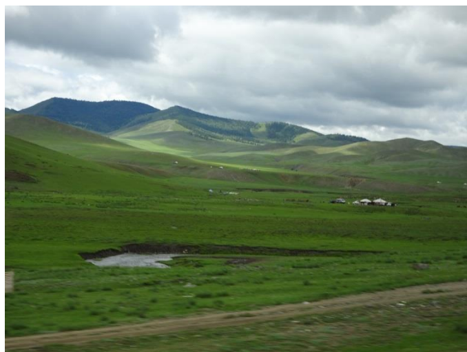
路旁草原上偶有牧民的蒙古包出現