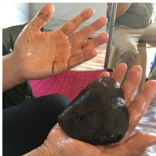
用來烤羊肉的黑色石頭