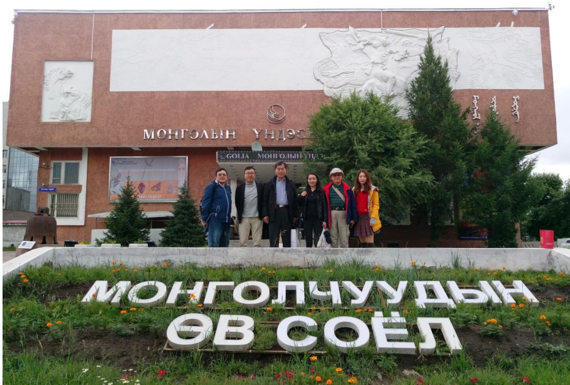
國立蒙古博物館正門