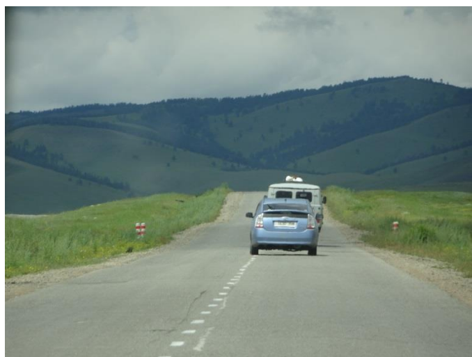
叉路不多、大部分都是筆直的公路