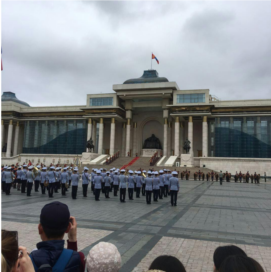
蘇赫巴托爾廣場上的軍樂隊及騎馬的戰士們

行廣場周遭馬路一圈再轉往中央體育場。國家宮是政府辦公室，正面中央有成吉思汗塑像，每逢重大節日及典禮，都會在蘇赫巴托爾廣場舉行儀式。當時在場觀看遊行的除了本地人之外，也參雜許多外國觀光客，由於是國家節日，不少蒙古人是穿著傳統服裝來參加慶典。