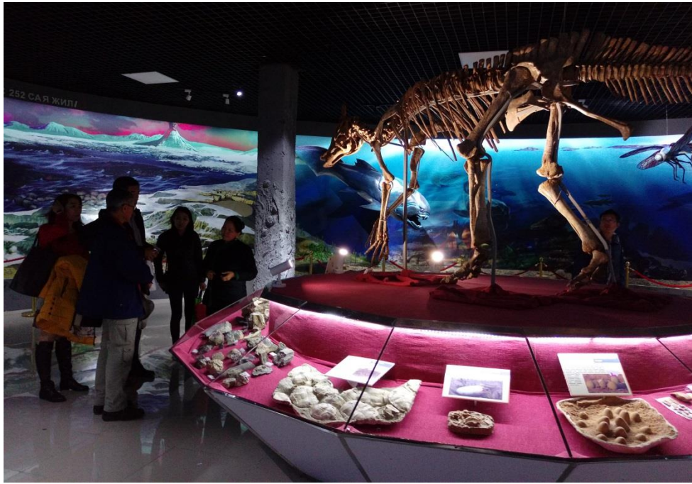
中央恐龍博物館二樓展區