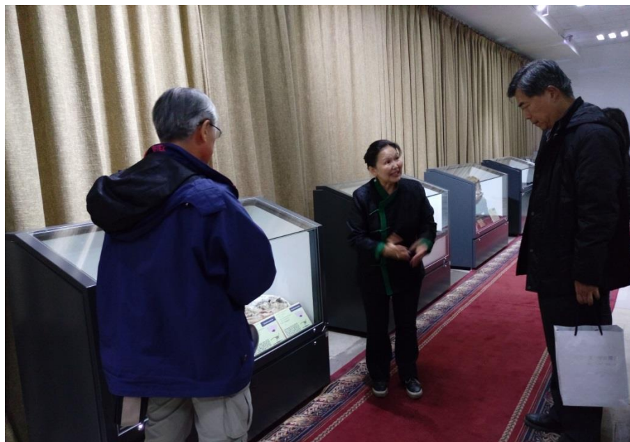
中央恐龍博物館二樓走道展區