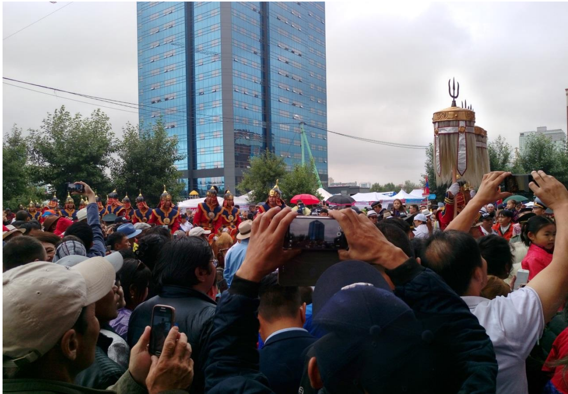
群眾在體育場 16 號入口前爭睹騎馬戰士入場的英姿