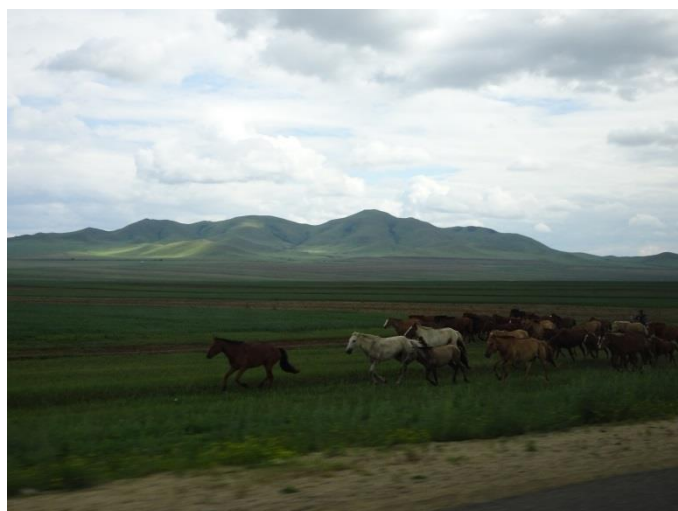
路旁奔跑中的馬群