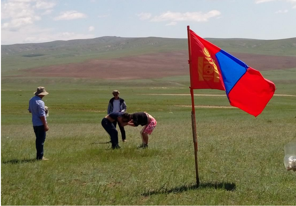
工作人員在基地裡以摔角比賽慶祝那達慕節

參訪的考古遺址屬於匈奴晚期的墓葬群，國立蒙古博物館與北京的人民大學合作，由人民大學出資挖掘，由於尚在進行，所以請我們不要將遺址照片外流。經由 ODBAATAR 博士及現場負責人的說明，我們大致瞭解實地挖掘時的需求及可能會遇到的問題，獲得了寶貴的資訊。由於只能在夏季時進行挖掘工作，又地處偏遠，基本上要準備充分才能在短短兩個月間得到具體成果，且需在前一年就向蒙古政府提出申請才能執行。