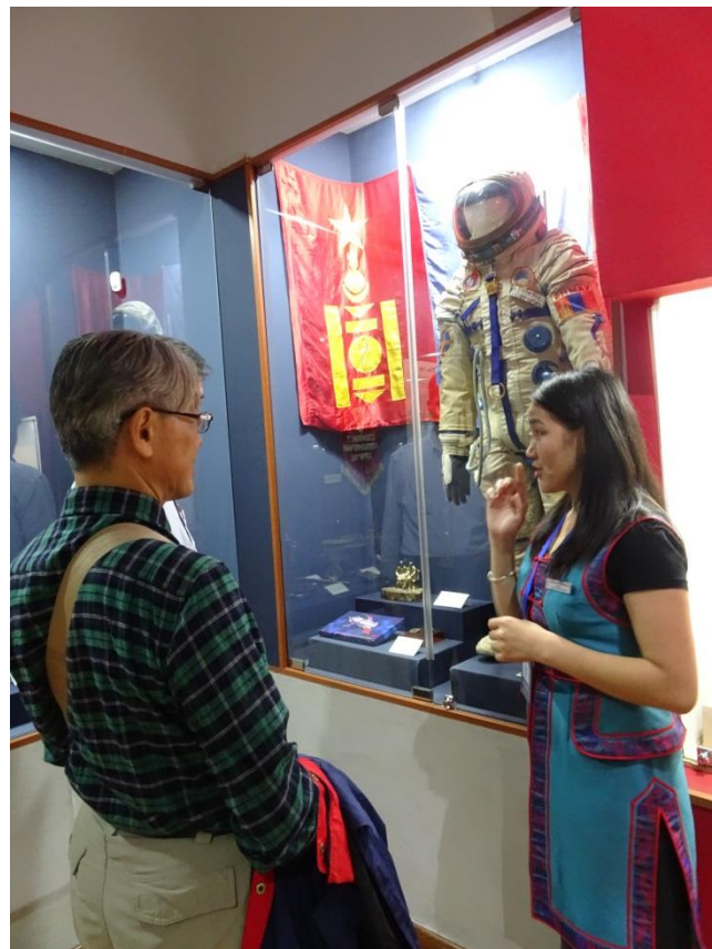
民主革新時期展區中的太空人裝