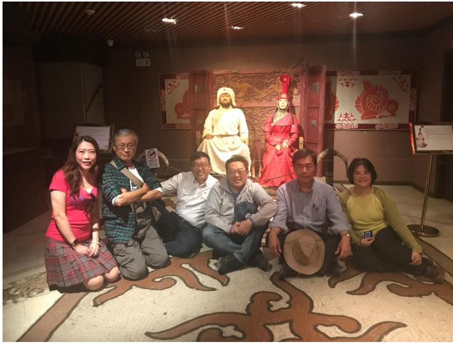
成吉思汗與孛兒帖塑像前合影