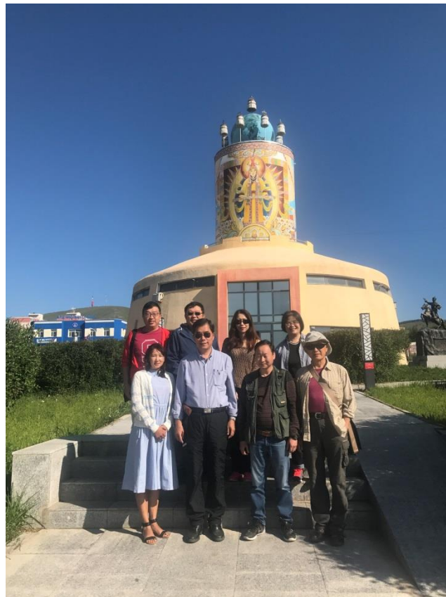
額爾登特市展示館的特殊外型