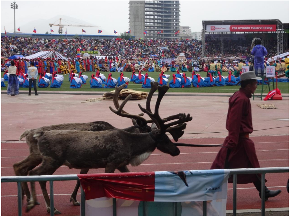
那達慕節開幕儀式的表演活動