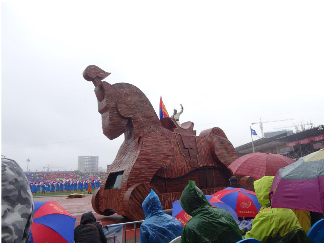
那達慕節開幕儀式的表演活動