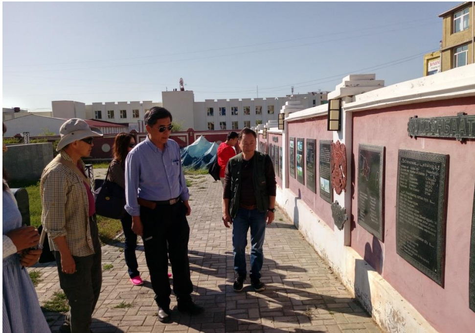
額爾登特市展示館周邊圍牆上的展板

品，透過接待人員的說明（說蒙文，由 ODBAATAR 博士翻譯成英文），讓我們再次感受到了蒙古人民對以往光輝歷史的崇敬。在登上觀景臺欣賞風景之後，我們觀看了一部由採礦公司出資拍攝、介紹額爾登特市的影片。該市建於 1974 年，主要是為了挖採銅礦，人口約 9 萬人，但已是蒙古的第 2 大城，地毯也是其重要經濟產品。影片中多由空中鳥瞰方式介紹城市重要地標，令人印象深刻。