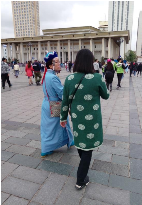
著傳統服飾的蒙古婦女