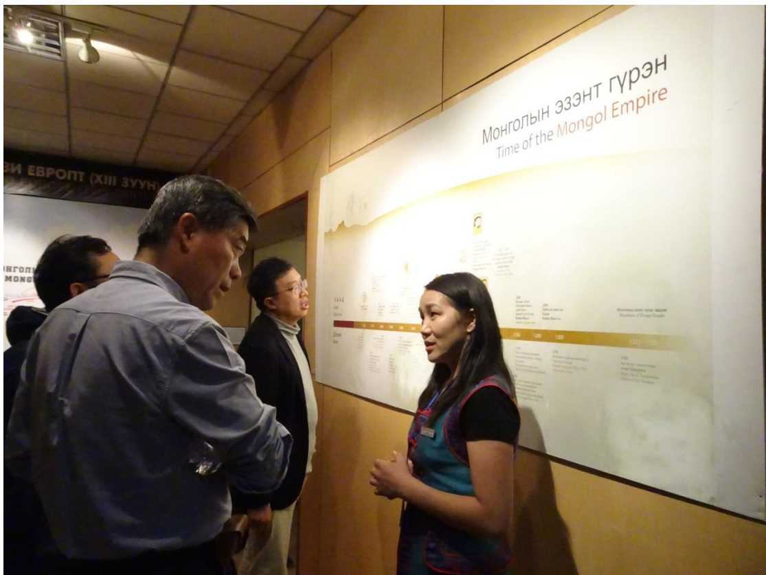
Muunuu 小姐穿上解說員的服裝為我們導覽