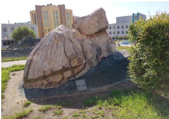
額爾登特市的 Melkhii Khad 模型