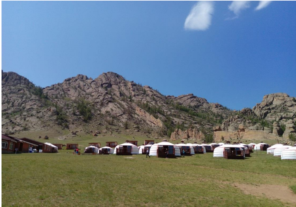
Gorkhi-Terelj 國家公園用餐地點周遭景色