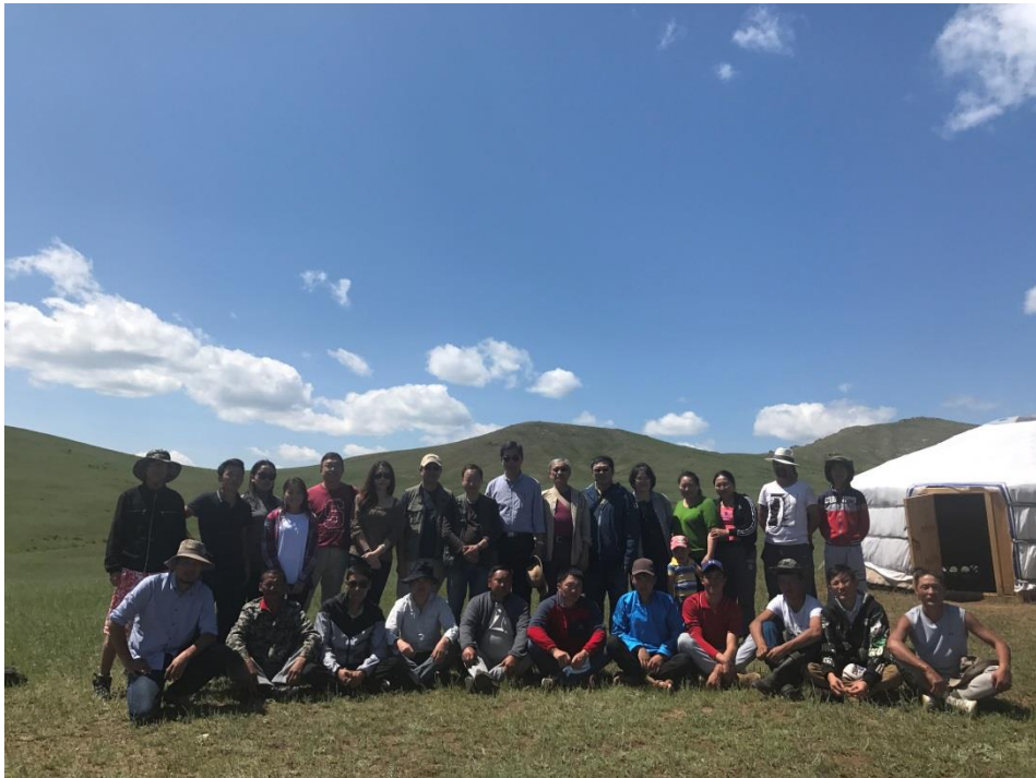
與考古挖掘工作團隊合影

參訪的考古遺址屬於匈奴晚期的墓葬群，國立蒙古博物館與北京的人民大學合作，由人民大學出資挖掘，由於尚在進行，所以請我們不要將遺址照片外流。經由 ODBAATAR 博士及現場負責人的說明，我們大致瞭解實地挖掘時的需求及可能會遇到的問題，獲得了寶貴的資訊。由於只能在夏季時進行挖掘工作，又地處偏遠，基本上要準備充分才能在短短兩個月間得到具體成果，且需在前一年就向蒙古政府提出申請才能執行。