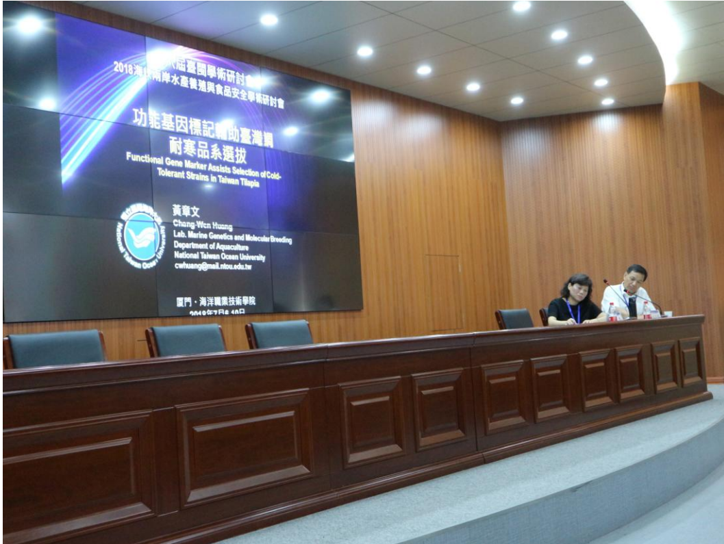
圖 9. 本所蔡慧君組長兼任臺灣水產學會秘書長與福建省海洋與漁業廳海洋經濟處劉春榮處長共同主持研討會主題學術報告