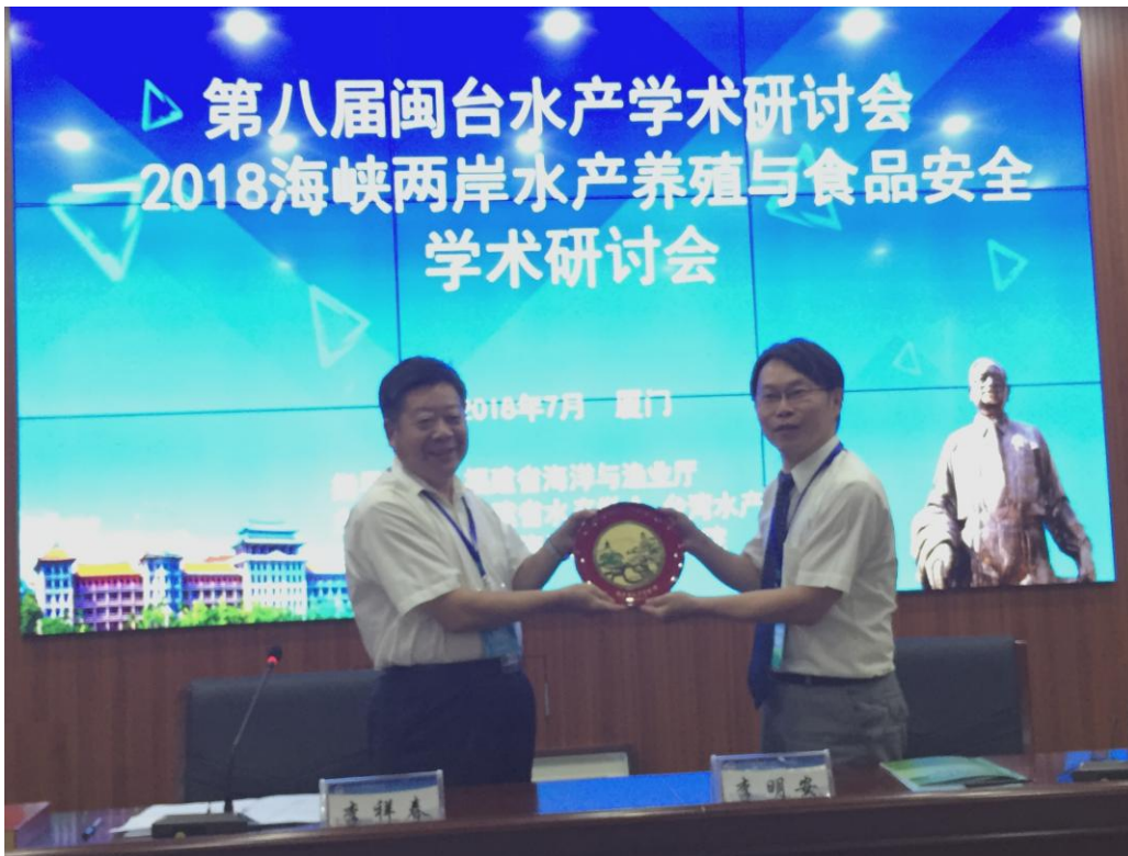
圖 16. 臺灣水產學會與福建省水產學會互贈紀念品