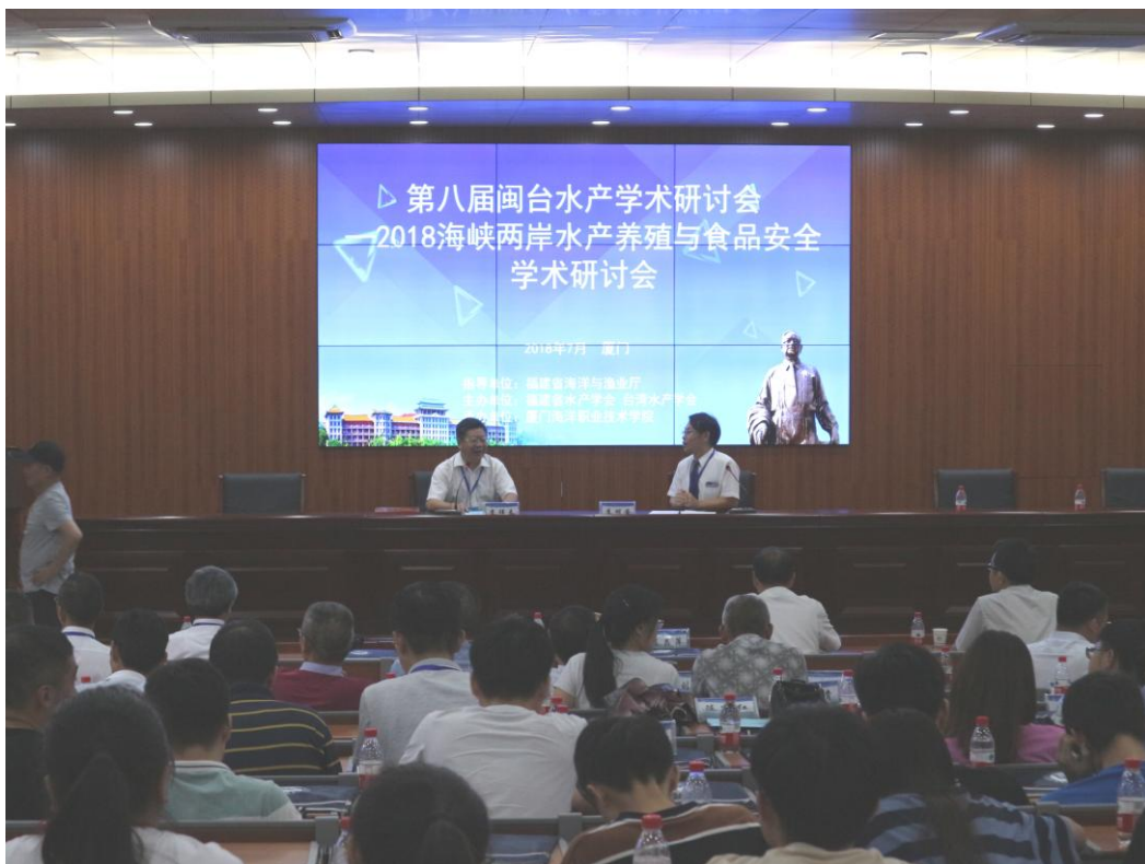
圖 15. 臺灣水產學會李明安副理事長與福建省水產學會李祥春理事長共同主持閉幕座談