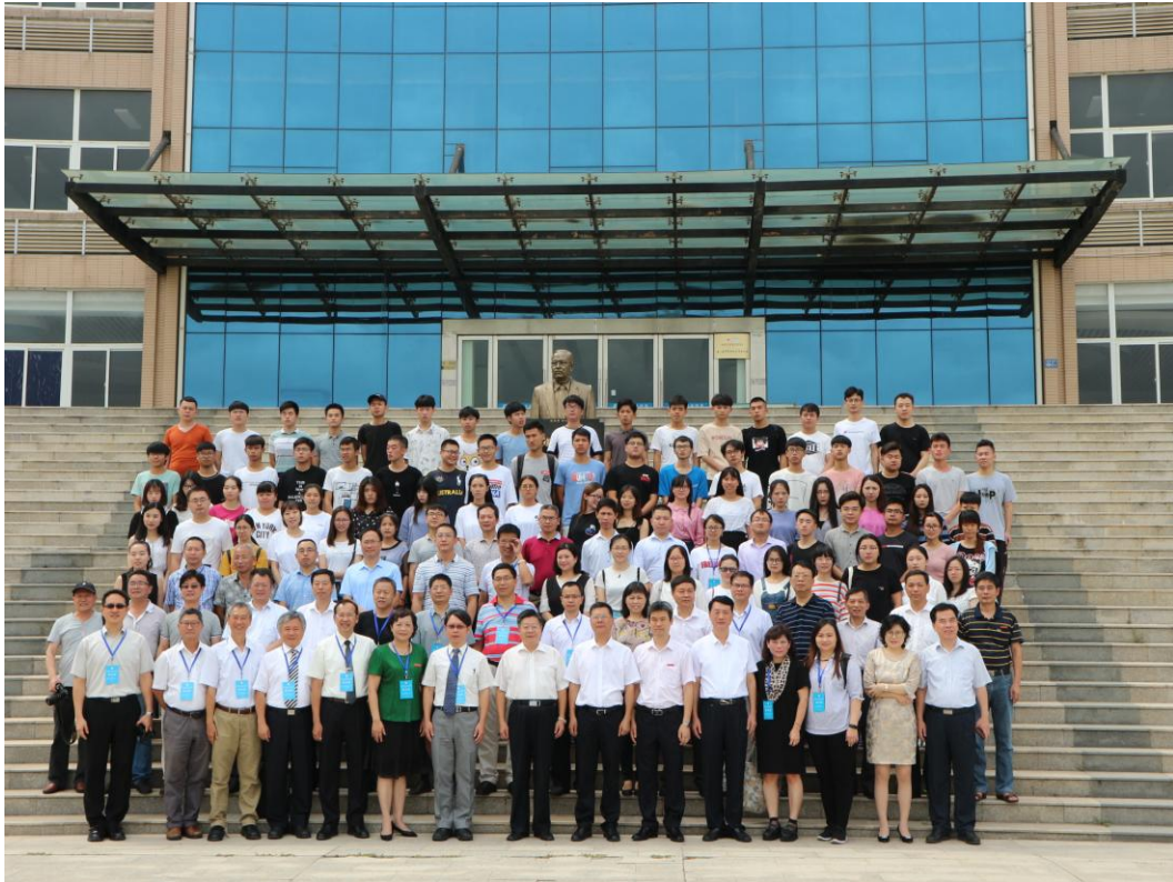
圖 4. 「2018 海峽兩岸水產養殖與食品安全學術研討會」全體與會者合影