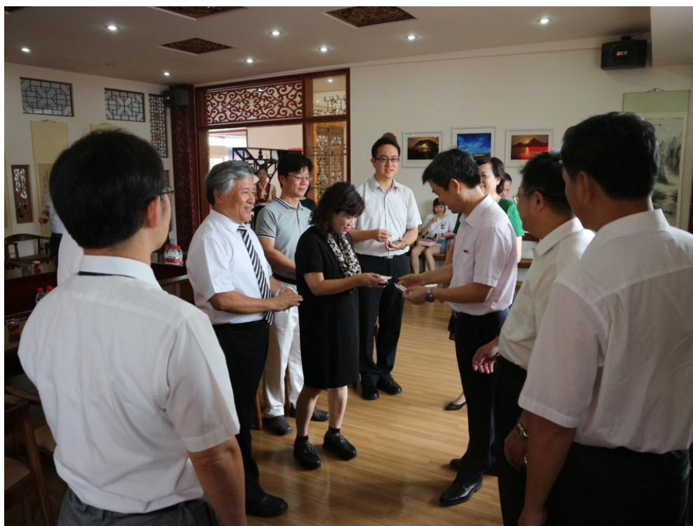
圖 1. 臺閩兩岸學者專家於「2018 海峽兩岸水產養殖與食品安全學術研討會」之會前座談與交流