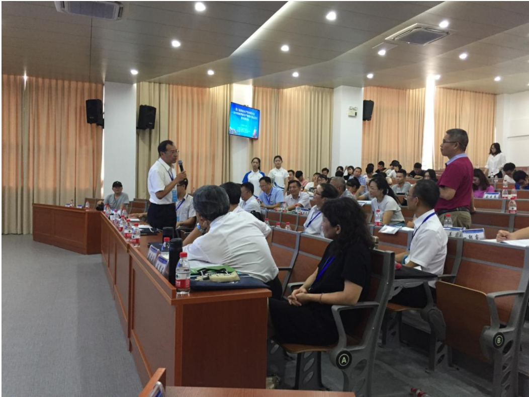
圖 14. 臺閩兩岸專家座談交流互動