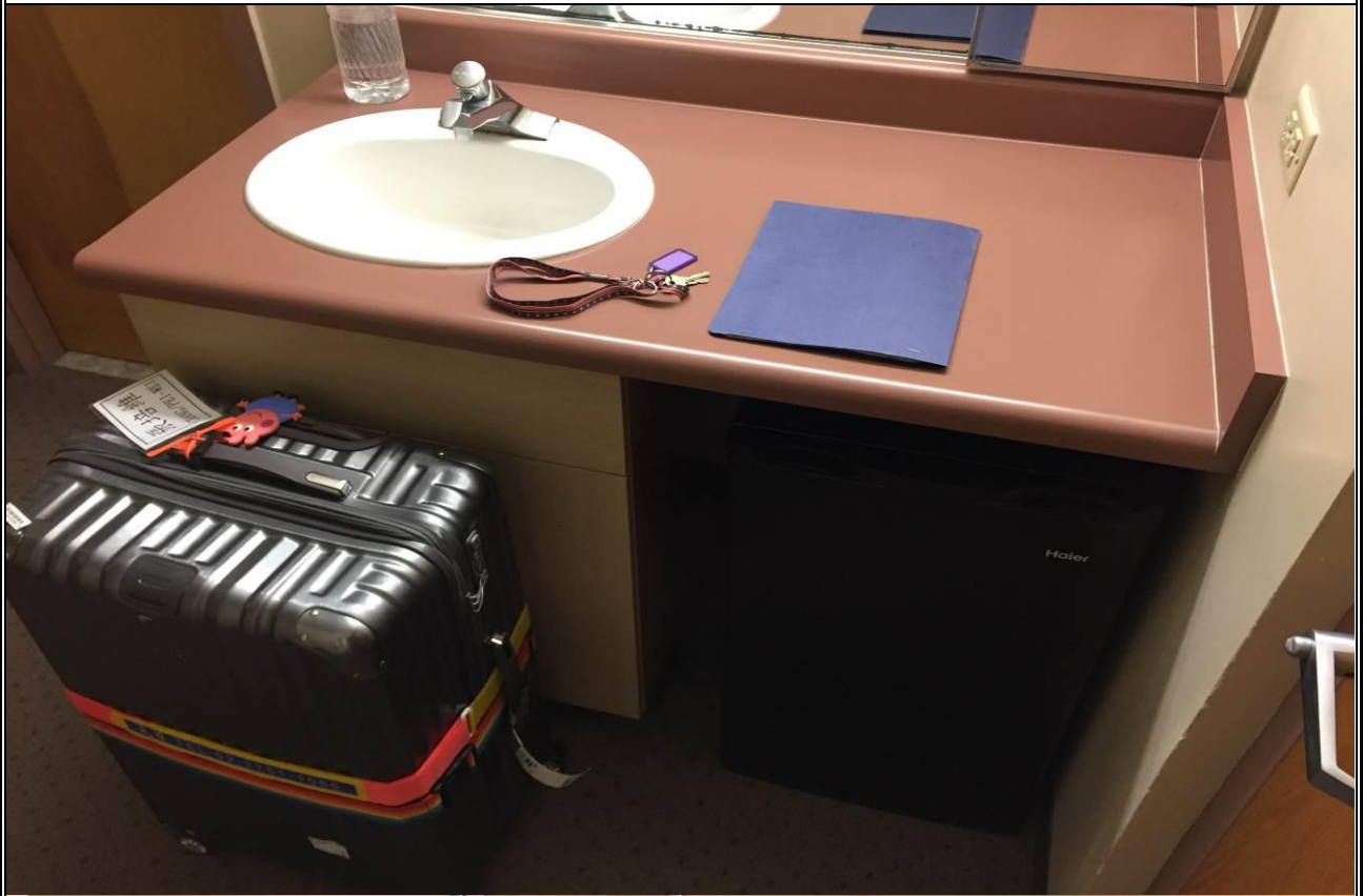
受訓翦影:寢室環境 (設備齊全備有冰箱、微波爐、電視、燙斗/板、中央空調)