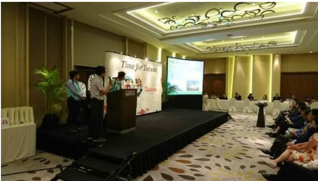
圖十一：印尼雅加達推廣會由清境與武陵農場代表上臺簡報農場旅遊資訊。