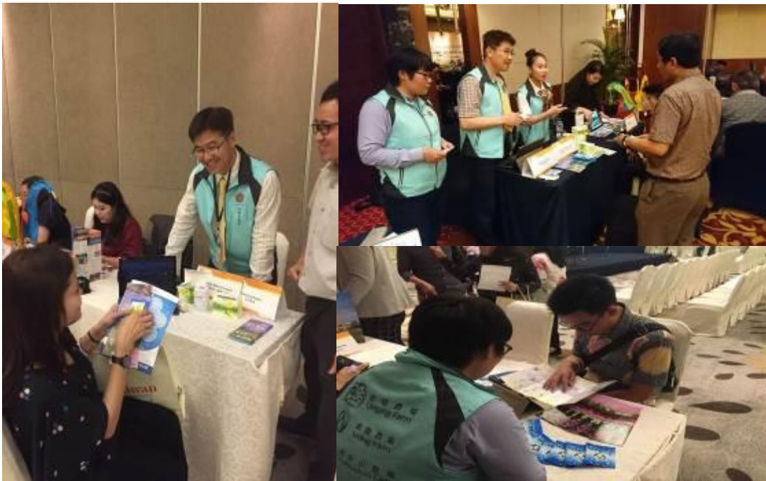
圖十三至十五：退輔會與農場代表分別於雅加達（左圖）、棉蘭（右圖）等二場推廣會與旅行業者進行交流。