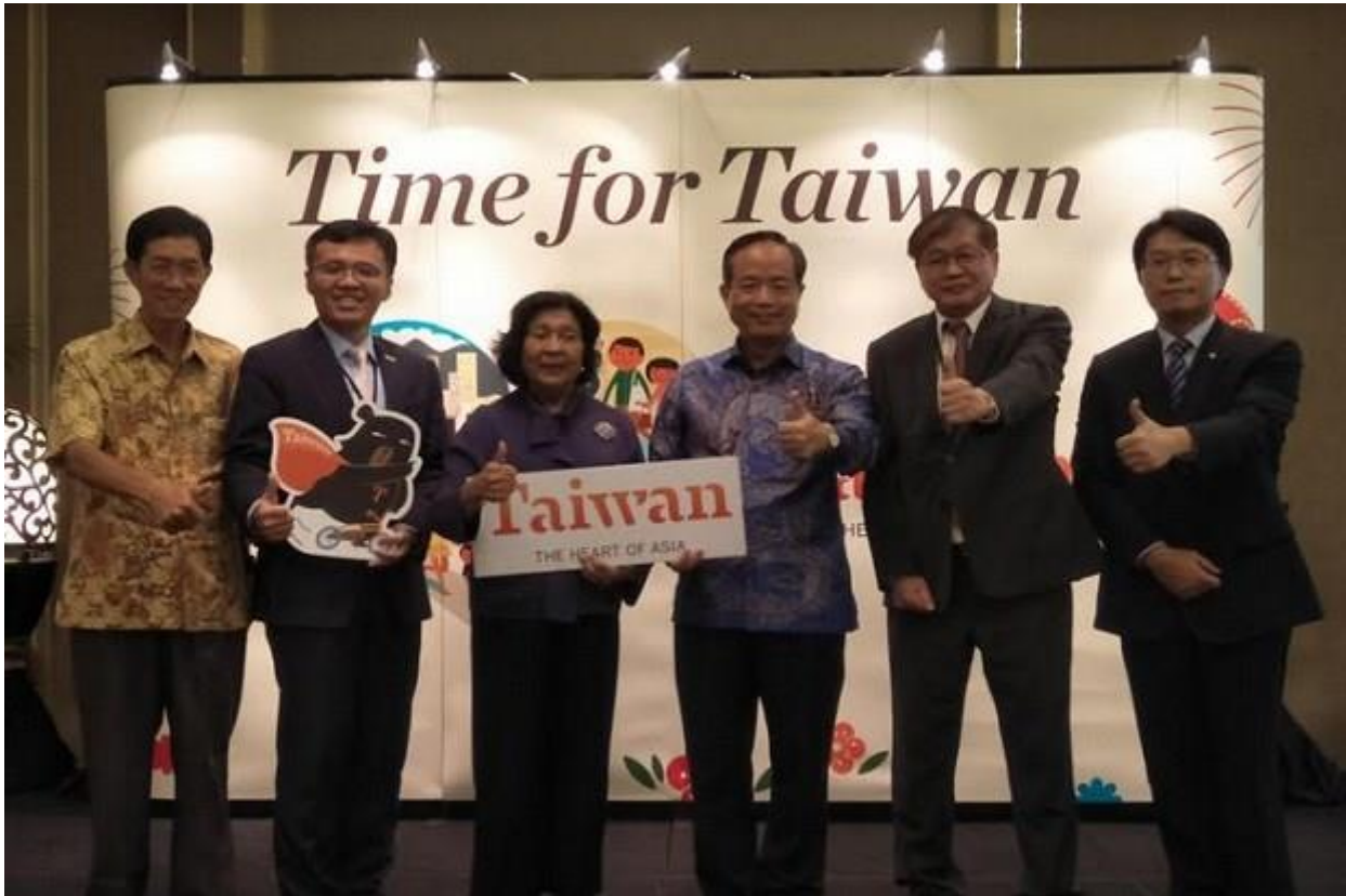
Taiwan Tourism Workshop 2018 memperkenalkan tempat menarik di Taiwan.

JAKARTA - Taiwan terus menjadi incaran wisatawan dari berbagai negara, terutama Indonesia. Tak hanya memiliki pemandangan alam yang indah, keaneka ragaman budaya, keramahan penduduk serta kuliner yang lezat, membuat negara ini menjadi pilihan untuk dikunjungi.