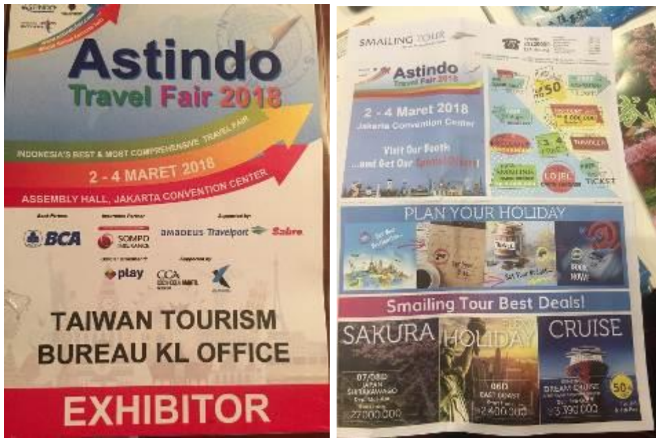
圖三：本次印尼旅展 ASTIDO 國際旅展參展證及旅展資訊報導。