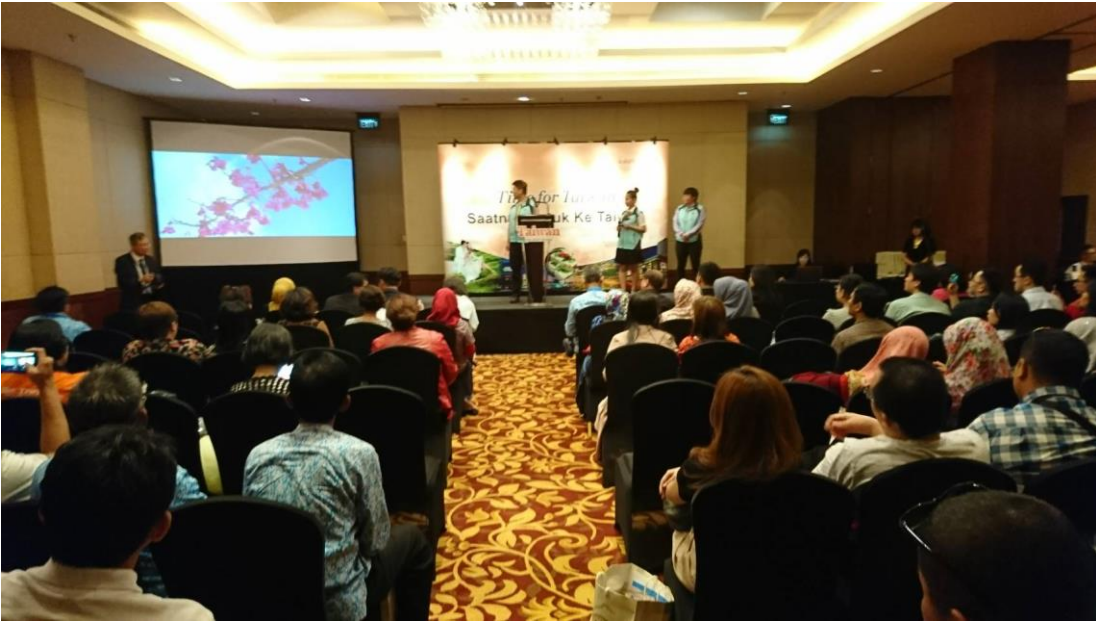
圖十二：棉蘭推廣會由清境與武陵農場代表上臺簡報農場旅遊資訊。