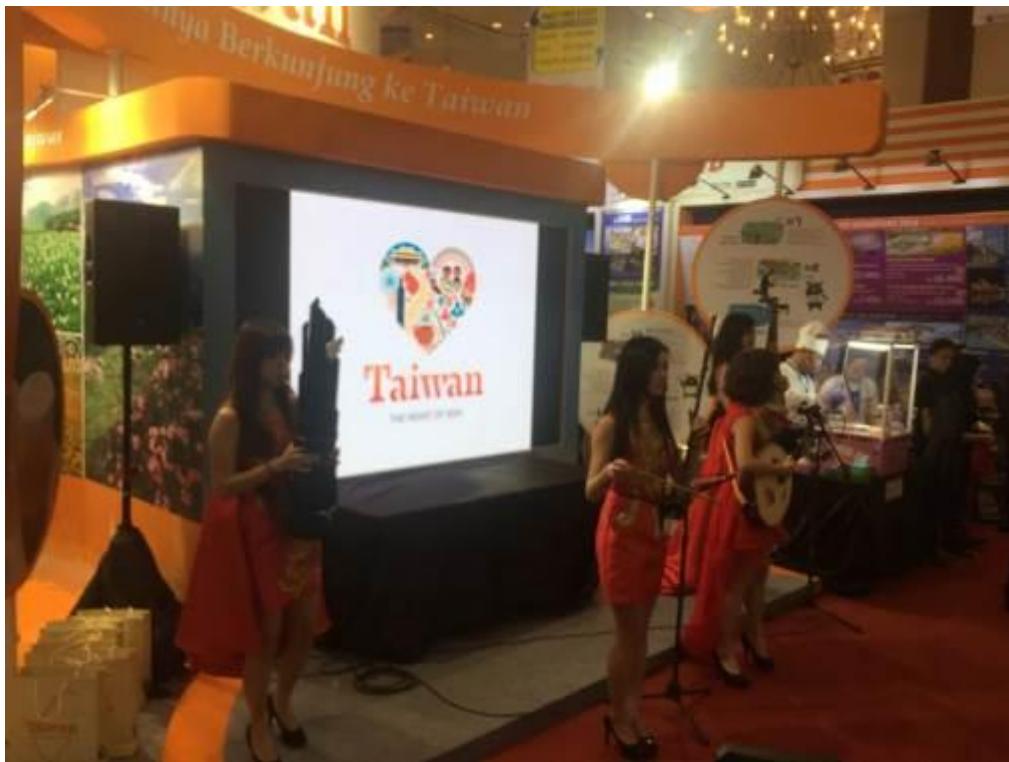
圖七：臺灣館每日定時舉辦戰嬌女子國樂團表演藉以吸引現場民眾。