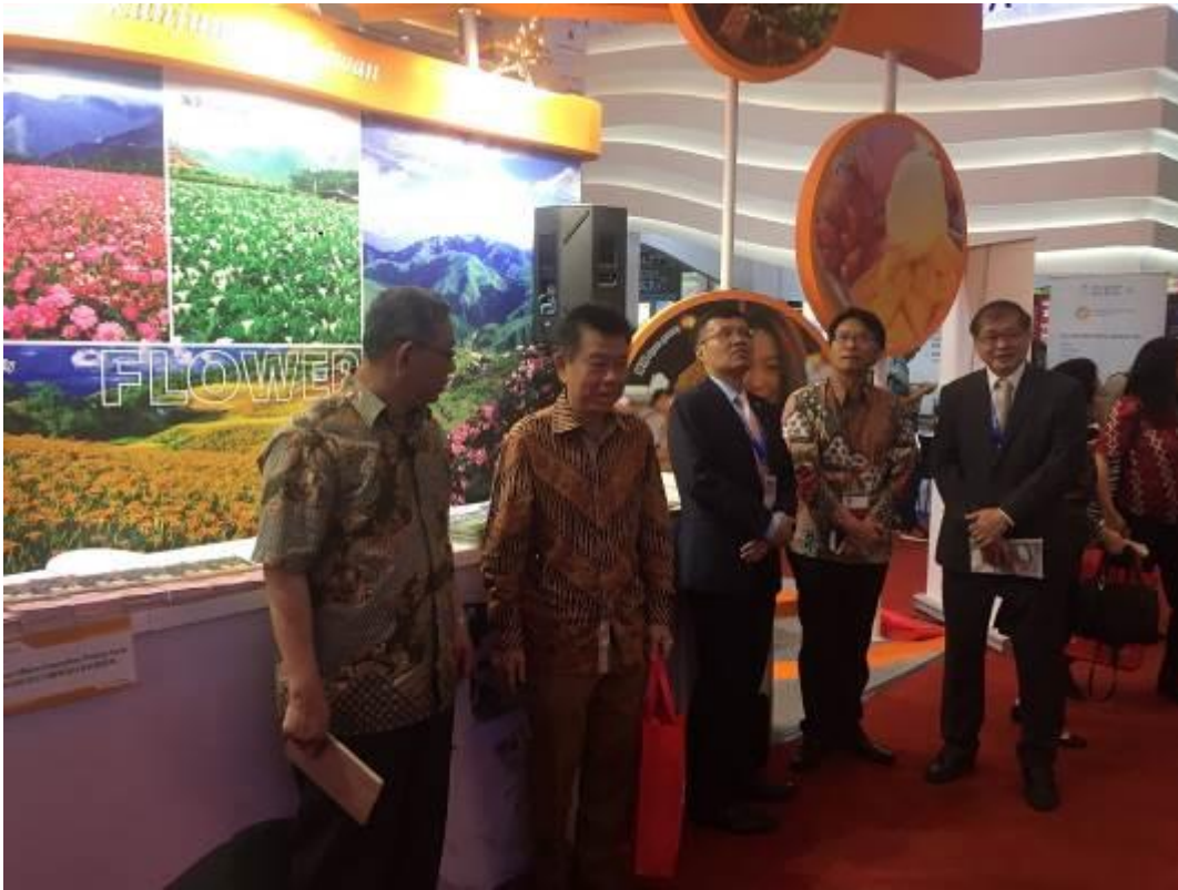
圖一：2018 年印尼 ASTIDO 旅展臺灣展區展館一隅。