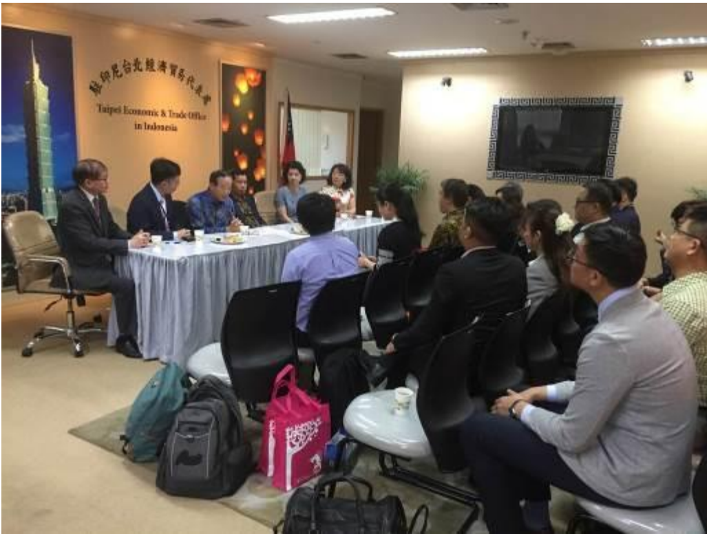
圖十：臺灣代表團特地拜訪台北駐印尼經濟貿易代表處，由陳忠大使親自接待，並與團員說明新南向政策成果與配合交通部觀光局將臺灣介紹給印尼遊客，提升印尼旅客來旅遊人數。