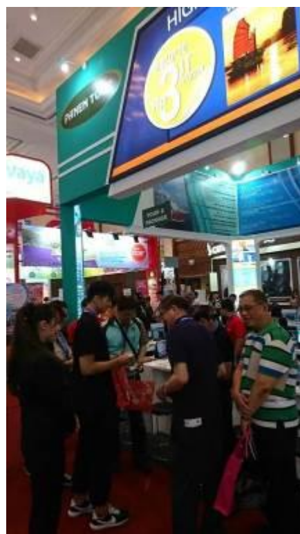
圖八、九：臺灣代表團至旅展現場各大旅行社櫃台進行拜會活動、交換名片，介紹每家參展資源特色。