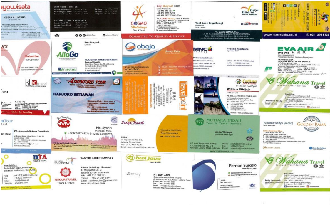
圖十六：印尼雅加達旅行社業者名片