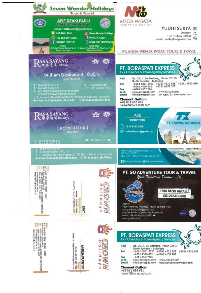
圖十七：印尼棉蘭旅行社業者名片