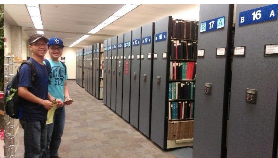
圖書館的校園導覽