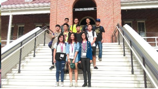
在亞歷桑納大學著名建築前的大合照