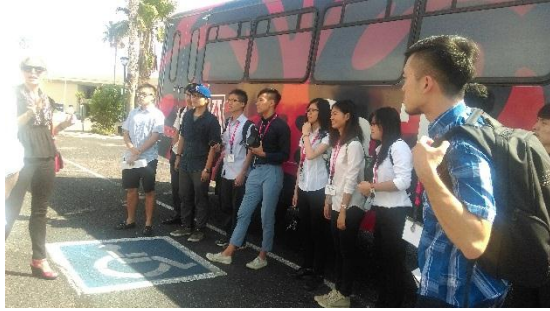
7/19 第一次企業參訪-Farmer Market