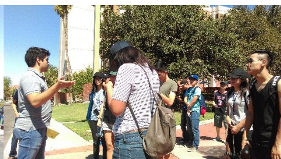
聆聽志願者校園導覽的學生們