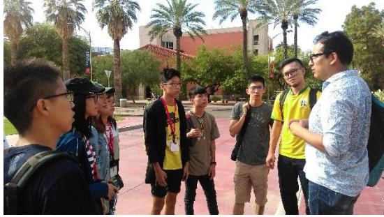
聆聽承辦人員解說的學生們