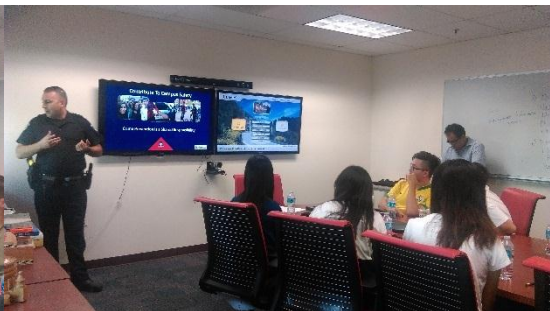
警察部門與學生講解相關注意事項