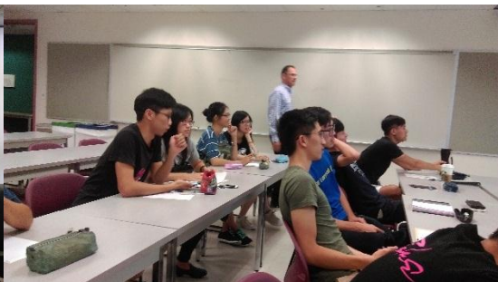
第一次英文工作坊的上課情形