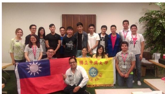
7/15 抵達當天晚上的大合照