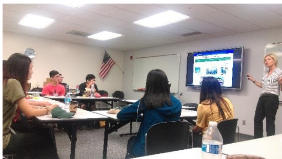
7/18 第一次正式專業課程