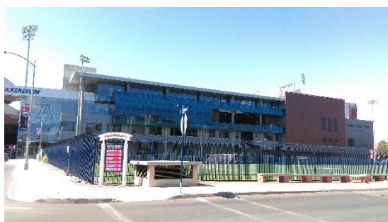
7/16 足球/橄欖球體育場校園導覽