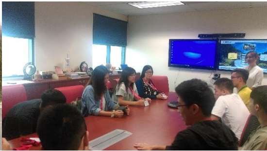
7/17 處理學校註冊相關事宜