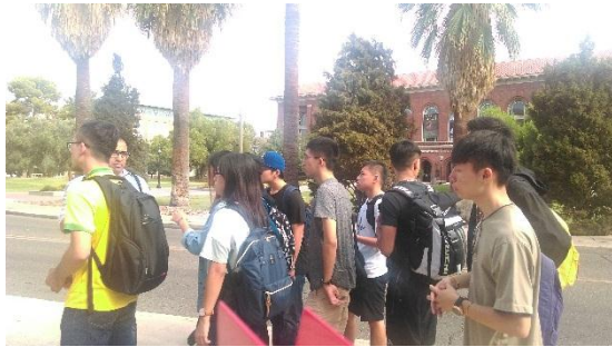
跟承辦人員提問的學生們