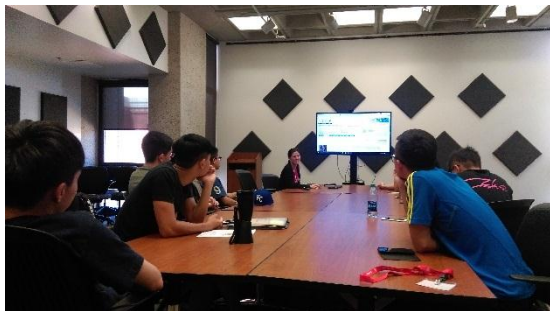
圖書館館員的 UA 資料庫檢索教學