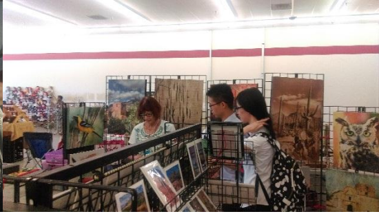
學生在農夫市集的議價行為