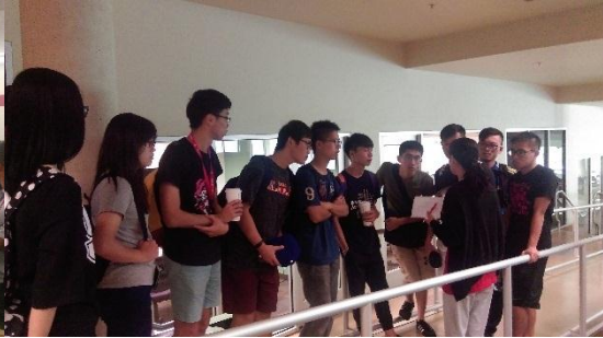
7/20 圖書館館員的導覽