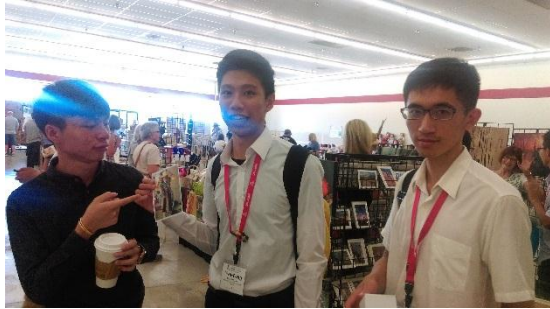
成功購買商品的學生