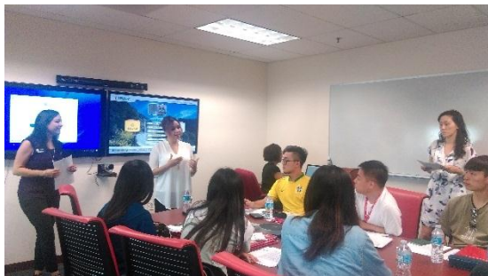
和 ISS 單位共同處理簽證後續事宜