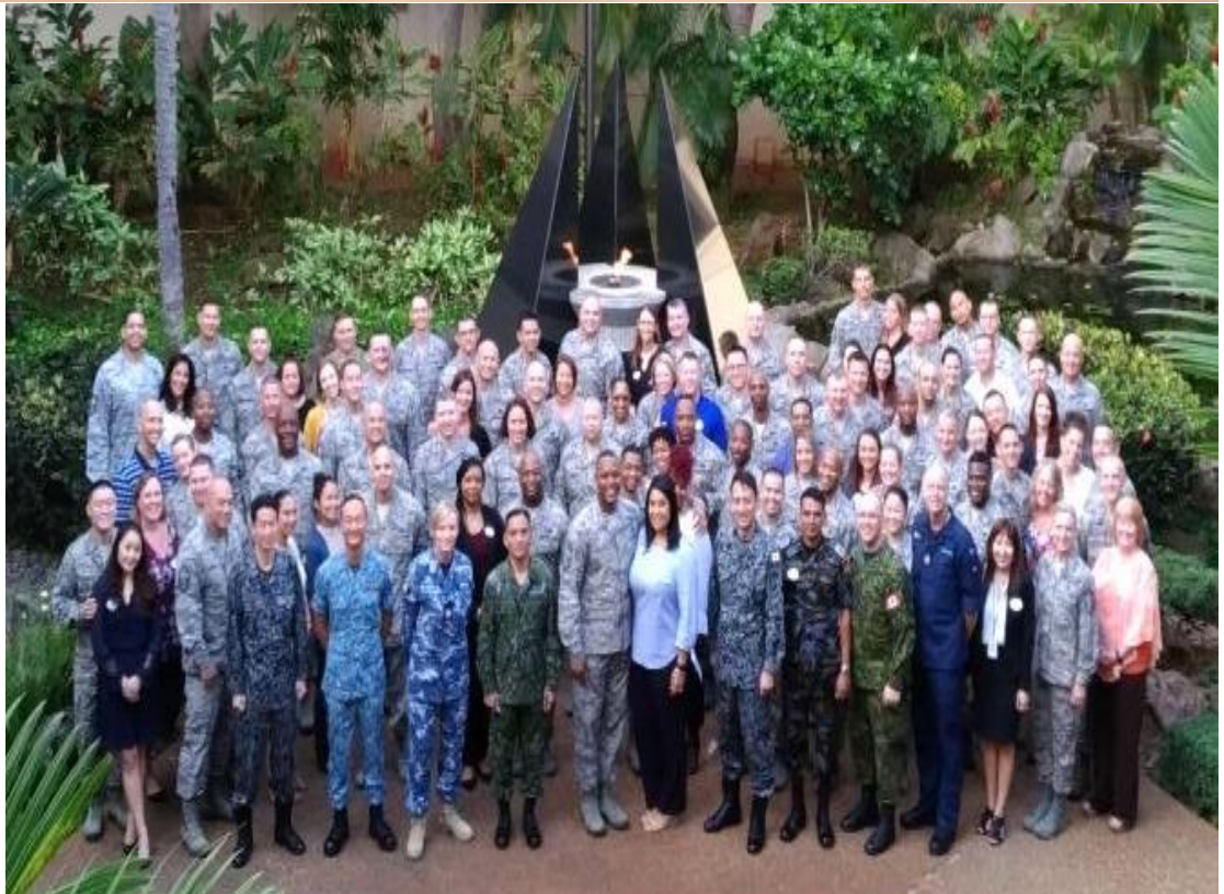
上圖為國際學員上課位置，下圖為所有參訓學員含眷屬於英雄廳合影。