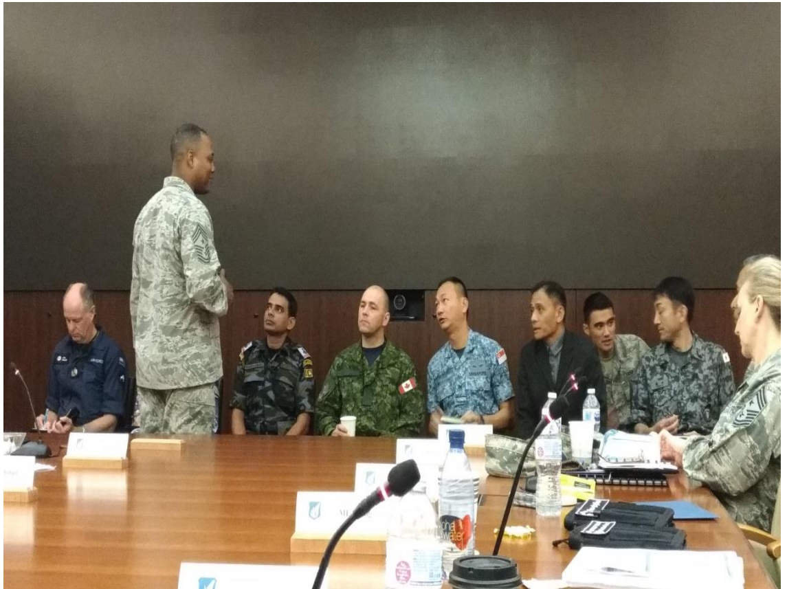
上圖為韓國(左)阿拉斯加(中)日本(右)空軍士官督導長與參訓人員座談。 下圖為國際學員與參訓人員座談預備說明。