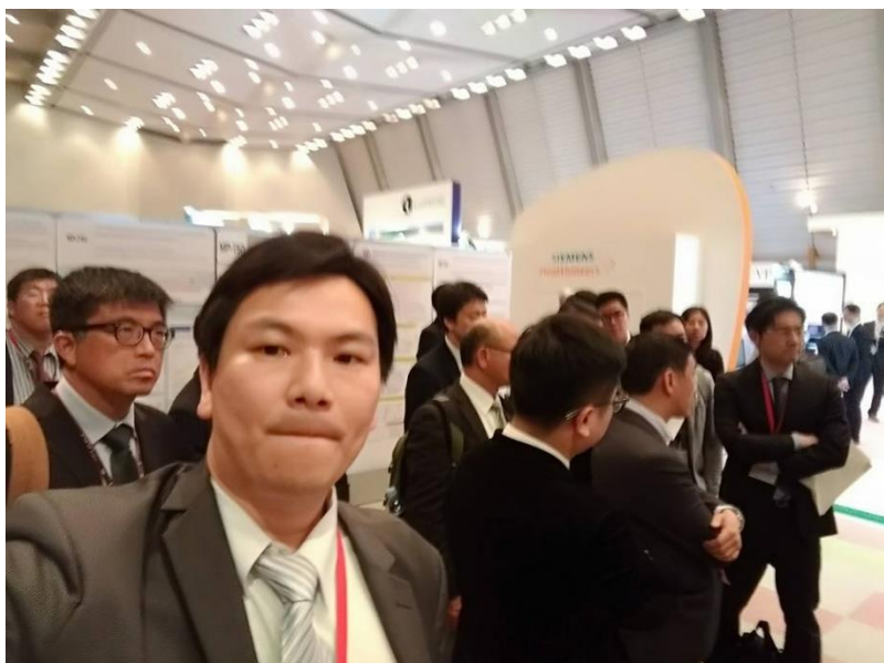
(圖 8~10:代表國軍台中總醫院及台灣泌外醫學會於京都發表海報)

其餘日期4月20日~21日是以大會專題演講、研討會、溝通討論會及日本本國醫學年會海報展示來安排大會議程。我熱中參加的課程，是以大堂大會專講語有興趣的醫療新知為主，並從中受益良多且習得了最新 update 的新知與技術。(如圖 11~14)