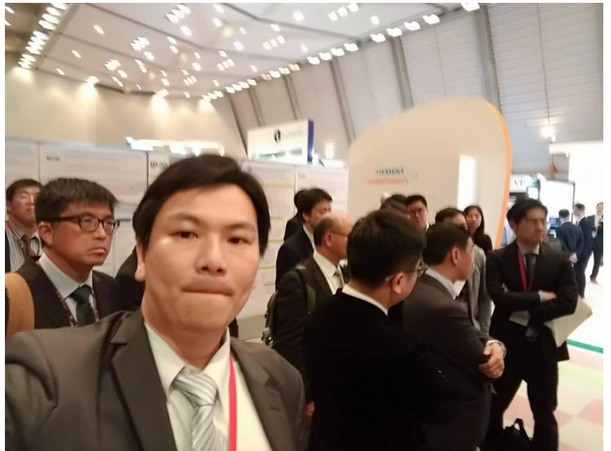
(圖 3& 4:代表國軍台中總醫院與台灣泌外醫學會發表海報)