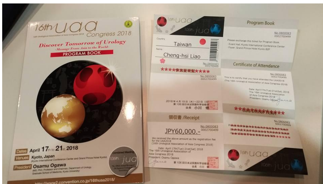
(圖 2:大會名牌與手冊)