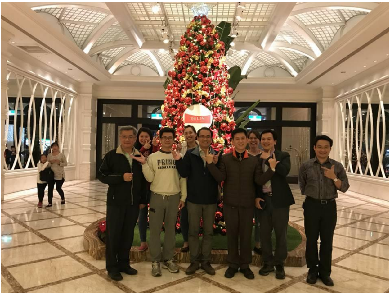
(圖 16 國軍台中總醫院教研中心堅實的核心幹部成員與陣容)

3.職熱中研究與教學並積極參與與本職學能相關的各大國內與國外醫學會盛事，除了自我能力的提升、同時希望一起為國軍醫院的國際能見度與聲譽打拼，位優良的國軍軍醫傳統增添榮耀，感謝院部長官、外科部與教研室同仁們的鼎力協助與支持，才有今日的小小成就呢!(如圖 16)