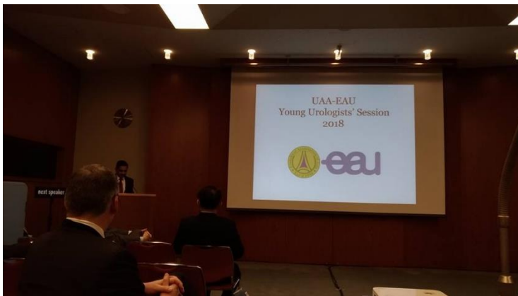
(圖 5: YUS 課程講座)

UAA(亞太泌外年會)會議舉辦日期為 2018 年 04 月 17 日至 04 月 21 日，在 04 月 18 日及 04 月 19 日以 YUS(Young Urologists Sessions)的形式舉辦青年學者醫師成長講座，可與同領域的專家學者近距離面對面討論課程內容、汲取新知、並共同解決所面對的困難問題。我有報名參加兩天精彩的講座課程、並從中獲得很多知識也結交來自亞洲國家的眾多好友醫師呢!(如圖 5~7)