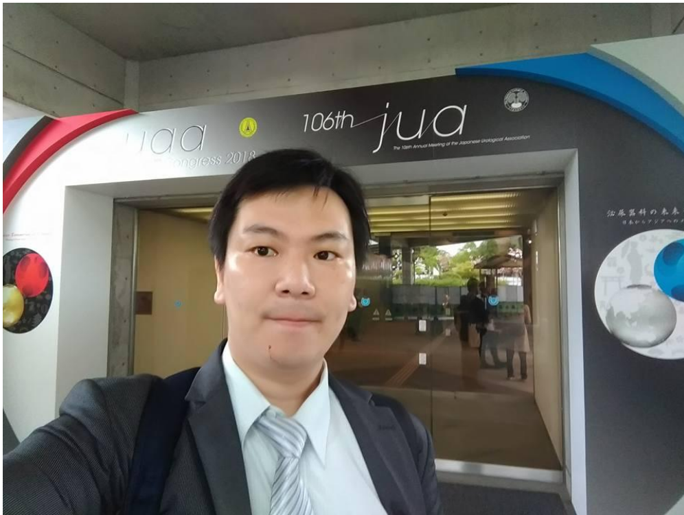
(圖 1:大會門口:京都國際會館)

每年亞太泌尿外科年會都會在亞洲國家的某一大城市舉辦，集結了來自以亞洲為主的專家學者齊聚一堂，在泌尿外科的領域盡顯所長並推廣分享，是極具指標意義的國際型年會呢！今年舉辦國日本，在京都這個傳統又復古、古典與現代結合的歷史古都舉辦國際年會真的很有意義且匠心獨具，東道主盡顯地主情誼熱烈歡迎來自全亞洲各地的泌尿科專家學者、醫護專業與教授學生們，會中也有邀請來自歐美、大洋洲、以及世界上致力於泌外領域專長的專家學者與會，在下有幸躬逢其盛會並代表台灣泌尿外科醫學會及國軍台中總醫院發表論文海報，實乃一大榮耀!(圖 1~圖 4)