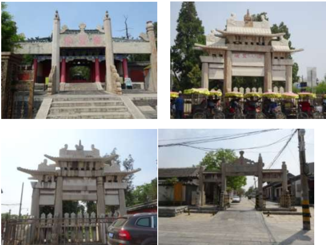
圖七十七、顏廟諸景