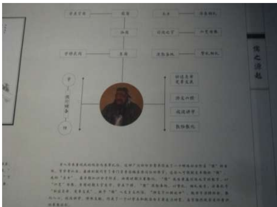
圖三十八、山東省博物館萬世師表展孔子的影響層面(圖為孔府文物檔案館藏品)