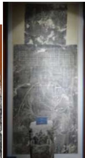
圖十、元代虛靜真人像

館藏最大的孔子圖像為傳唐吳道子繪文宣王像拓本(圖八)，然則以線描風格和孔子容貌的神話特色判斷，則應該是宋元以後的摹本。其餘與孔子相關的文物以漢畫像中的車馬人物為主(圖九)，在描繪細節與姿態處理上，共通的特色是注重人與人之間的互動答禮。此外，元代的高士肖像造型，則明顯追仿孔子形象特色(圖十)，另外，雖然沒有孔子相關特展，濟南博物館的文物紀念品店鋪竟也販