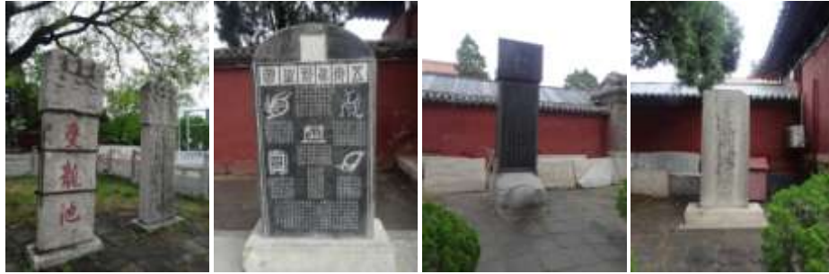
圖四十一、泰山各處碑刻 筆者攝