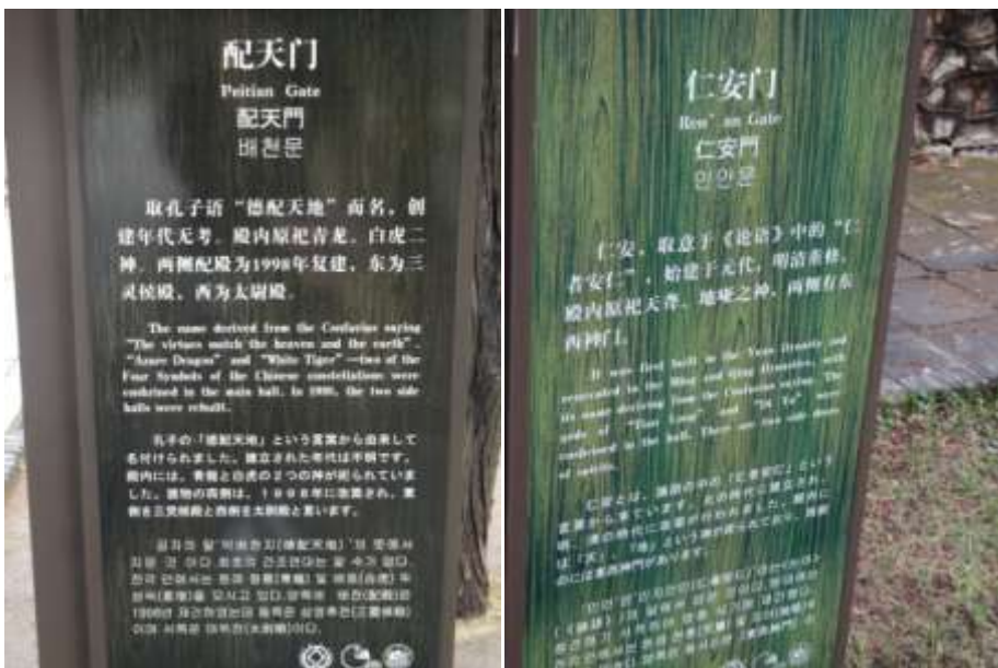
圖四十八、岱廟各處建築的儒家典故

然而所有建築的命名，都很明顯的和儒家典故具有密切相關，如「配天門」即典出《莊子·田子方》孔子贊老子「德配天地」之語；「仁安門」則是出自《論語·里仁》子曰：「不仁者，不可以久處約，不可以長處樂。仁者安仁，知者利仁。」的典故。(圖四十八)