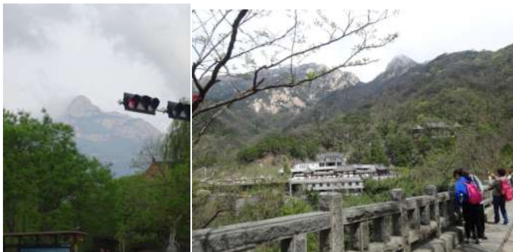
圖三十九、泰山遠景