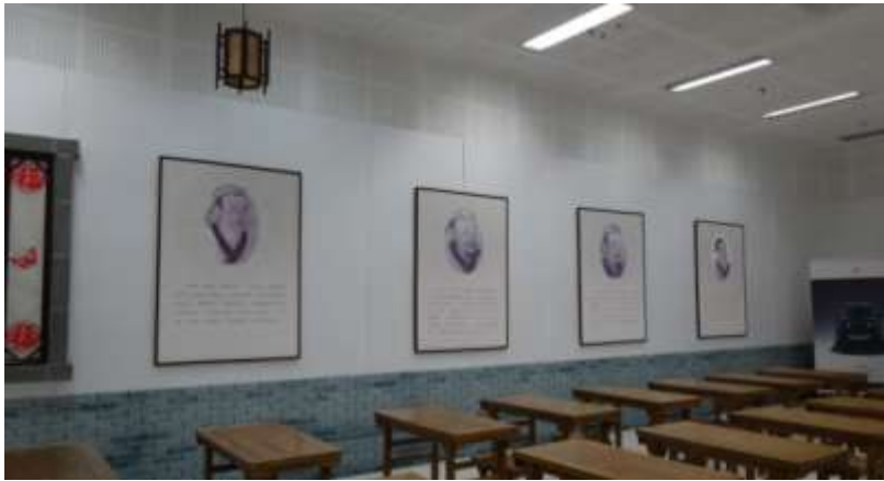
圖二十六、山東省博物館孔子學堂教室的孔門弟子像