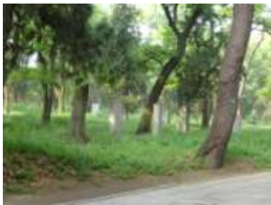
圖七十三、孔林群碑