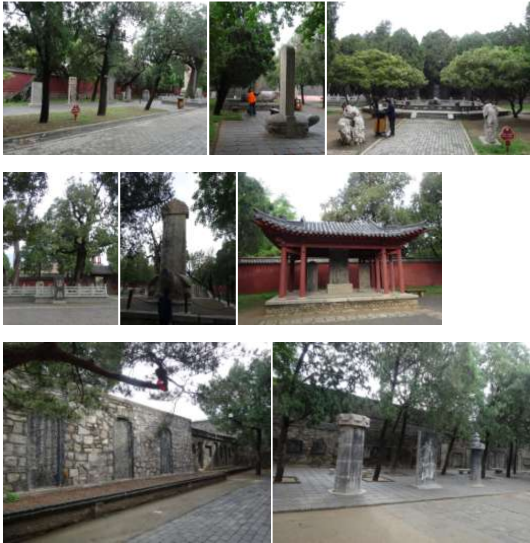
圖四十九、岱廟碑林的各種形式 筆者攝