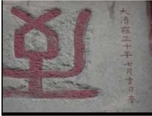
圖七十二、孔林的豪華石雕與建築