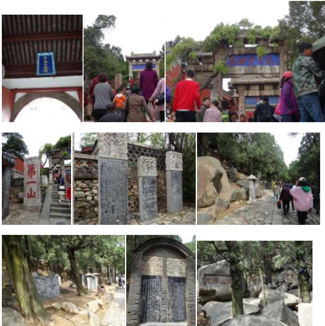
圖四十二、登泰山起點拱門匾額與沿途牌匾碑刻

到了泰山的登山起點（圖四十二）起，則沿路皆見攀崖刻石，據說共計一千多處，而且越高處的摩崖時代越為古遠。帝王祭祀泰山的岱廟，目前所存最古的建築群可至宋代(960-1127)（圖四十三），目前所見明清重修的磚構建築相當堅