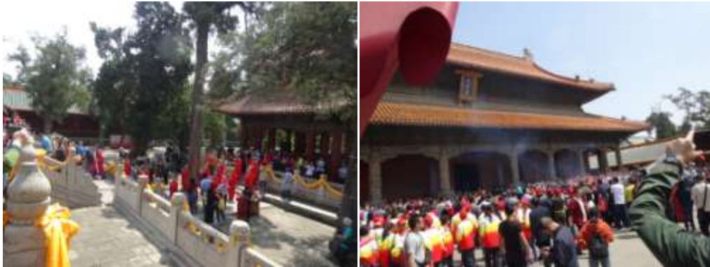
圖六十五、曲阜孔廟的觀光表演

孔子的塑像，也採用帝王服飾（圖六十四）。然而，這些都是所謂「解放前」的規制，現在讓孔廟更有看頭的做法，已經不再是修繕加封，而是各種祭孔舞蹈、開關城門等的觀光秀（圖六十五）。