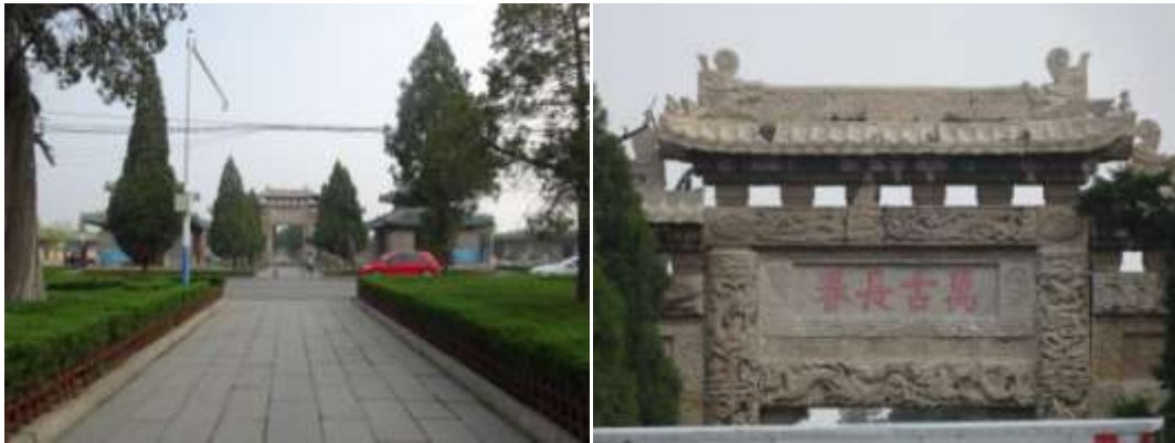
圖七十一、曲阜祭祖石道與孔林牌坊