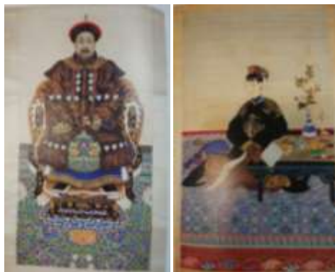
圖五十九、孔府檔案館藏衍聖公及夫人肖像