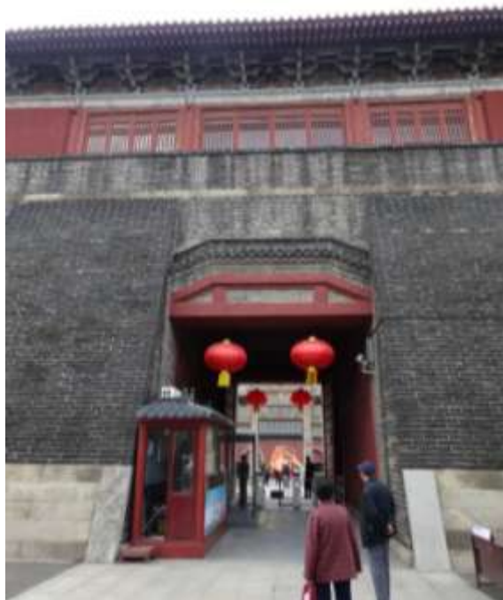
圖四十五、岱廟厚實的高牆門洞

不知是否為了配合破除迷信的政策方針，岱廟景區的說明沒有提到任何信仰，主要介紹都是針對歷史（圖四十六）與景物（圖四十七）。