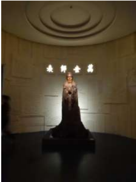
圖二十八、山東省博物館萬世師表展

此外，展廳當中也有孔子相關展覽，二〇一八年二月十八日開展，名稱與本院二〇一七年七月一日開展的展名一樣，叫做「萬世師表」（圖二十八）。