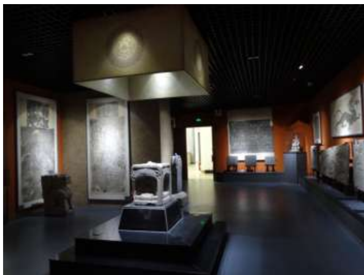
圖六、濟南市博物館石刻拓本與禮器展廳

最著名的館藏為彩繪陶負鼎鳩(圖四)、彩繪陶樂舞雜技俑(圖五)等，均為齊魯之地受道儒家厚葬觀念影響，所製作的精美墓葬器。僅有的八個展廳中，側重於介紹濟南當地的地方歷史，而以石刻拓本與禮器展廳最為精美(圖六)。