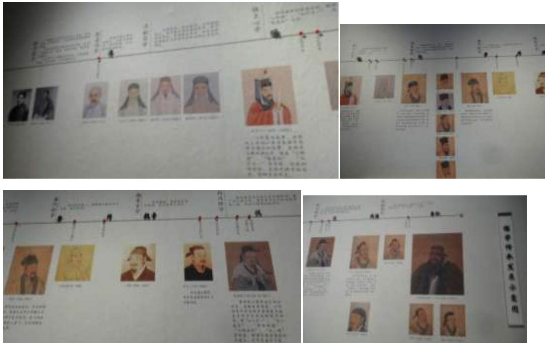
圖三十六、山東省博物館萬世師表展儒學傳承發展示意圖