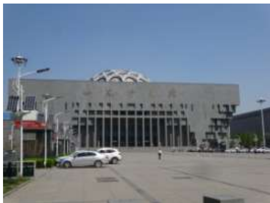
圖二十、山東省博物館外觀