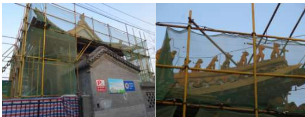
圖十六、整修中的濟南府學文廟西牆

傳統科舉以四書五經為考試題材，因此天下讀書人莫非孔子的再傳弟子，孔廟往往與地方學校合一，每年的祭孔典禮也因為這樣廟學合一的做法，培養學子們尊孔的觀念與對古禮的認識。很可惜的，本次行程雖然安排了濟南府學文廟(圖