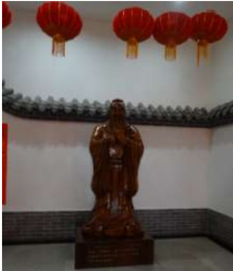
圖二十四、孔子學堂孔子像

館內有專門的孔子學堂（圖二十二），內有課桌椅（圖二十三），孔子木雕像（圖二十四），禮器（圖二十五）與孔門弟子像（圖二十六）等，但孔門弟子像所輸出的圖像，似與本院藏品雷同（圖二十七）。