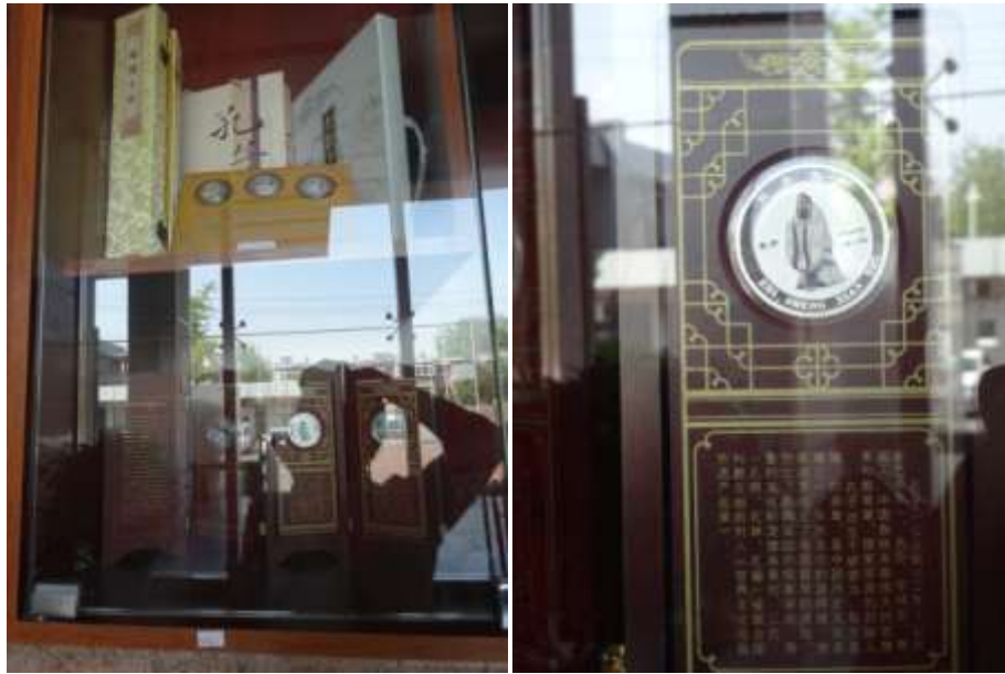
圖十一、濟南市博物館商店孔子相關紀念品

賣數種孔子相關商品(圖十一)，可見孔子被視為山東地區傑出歷史人物的範圍，不只在其家鄉曲阜一地而已。