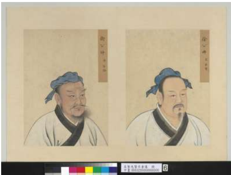
圖二十七、本院藏《至聖先賢半身像 冊 子路；子有》