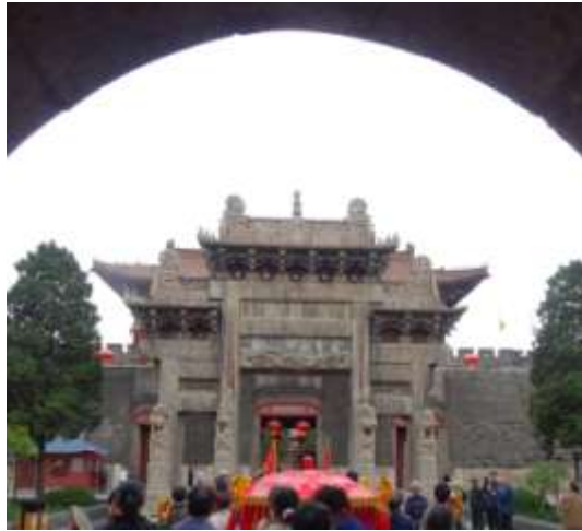
圖四十三、岱廟的豪華牌樓

固（圖四十四），從嚴密包圍的厚實內外城牆與狹窄門洞（圖四十五），可知此處為了皇帝安危做足了準備。