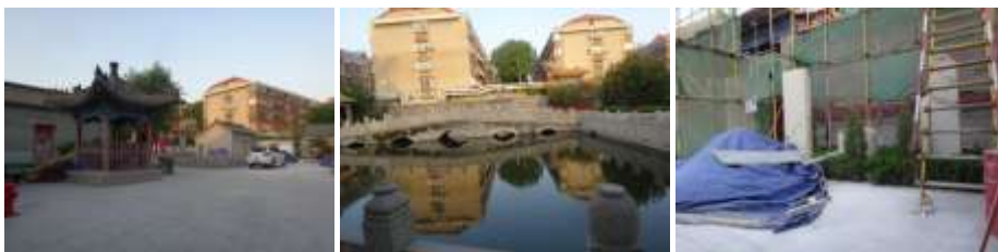
圖十八、濟南府學孔廟建築、井庭、泮池與石碑 筆者攝