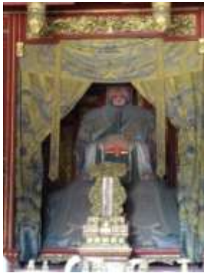
圖六十四、曲阜孔廟的孔子塑像

孔子的塑像，也採用帝王服飾（圖六十四）。然而，這些都是所謂「解放前」的規制，現在讓孔廟更有看頭的做法，已經不再是修繕加封，而是各種祭孔舞蹈、開關城門等的觀光秀（圖六十五）。