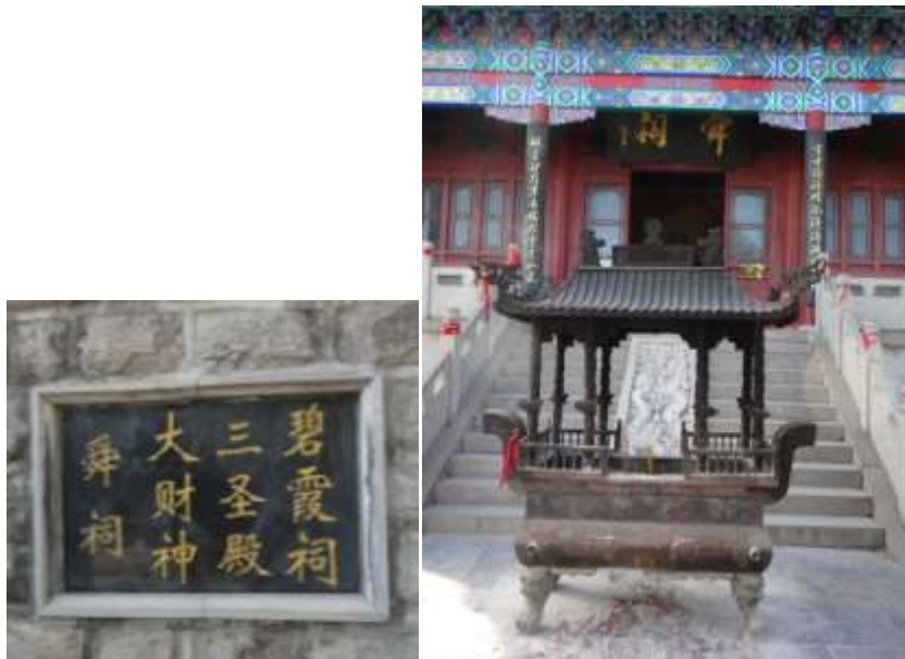
圖十二、歷山（千佛山）舜祠外觀