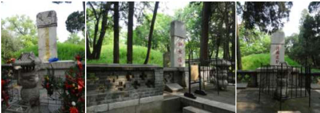
圖七十四、孔子、孔鯉與子思三代墓