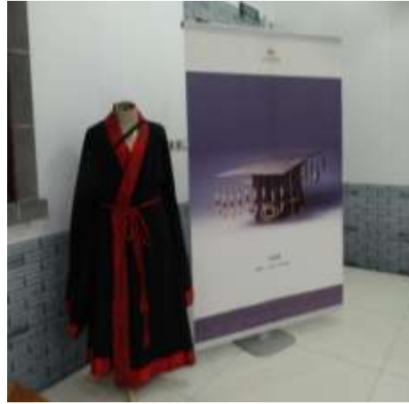
圖二十五、孔子學堂展示禮器與教室陳設