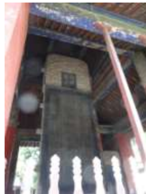
圖五十七 孔府洪武石碑碑亭