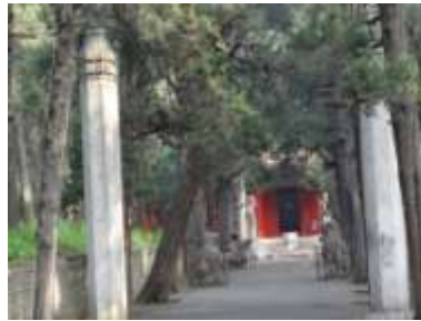
圖七十四、至聖墓甬道