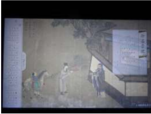
圖三十、聖蹟圖多媒體