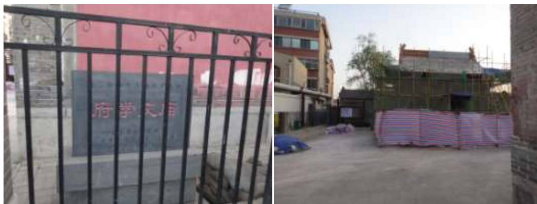
圖十五、整修中的濟南府學文廟正門