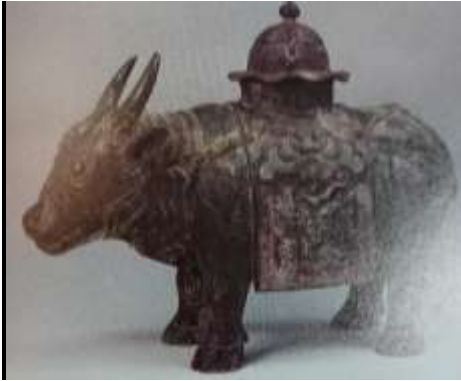
圖六十、衍聖公朝服及禮器