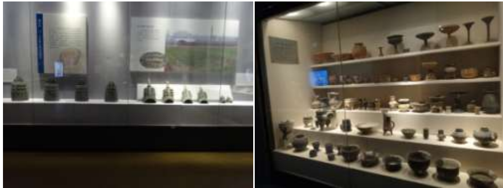
圖五十一、山東省文物局打擊文物犯罪成果展破獲的禮器樂器