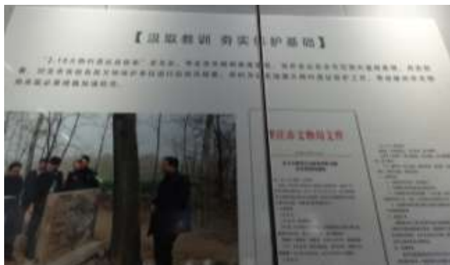
圖五十二、打擊文物犯罪成果展照片