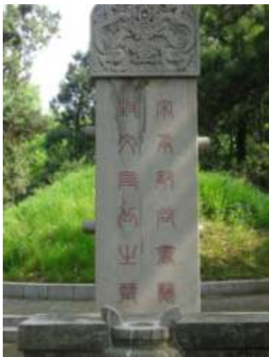
圖七十五、孔仁玉墓 筆者攝