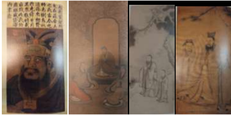
圖五十八、孔府檔案館藏各類孔子像 筆者攝

九四八年。檔案數量約二十五萬件。檔案內容有宮廷、、祀典、襲封、宗族、林廟管理、屬員等類，是中國著名的私家檔案，也是研究孔府的重要資料。孔府文物檔案館館藏書畫主要為孔府舊藏，書畫總計六千多件，多為孔子（圖五十八）與孔氏後裔畫像肖像（圖五十九）、孔府傳世帝后名人書畫作品，曲阜市文物局也收藏有衍聖公朝服和自宋代以來的各種精緻禮器（圖六十）。