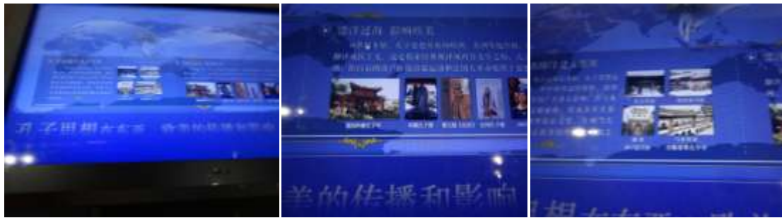
圖三十五、山東省博物館萬世師表展孔子思想在東亞歐美的傳播影響