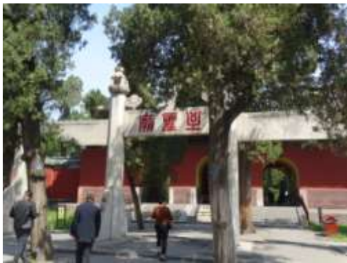
圖六十一、曲阜孔廟牌樓

曲阜孔廟（圖六十一）規制，比其他地方的孔廟更大，以萬仞宮牆來說，曲阜（圖六十二）明顯更為大型，也更為宏偉，其他的殿閣建築，規模則比照皇帝宮宮，凸顯了孔子一言以為天下表的文化統領身分（圖六十三）。