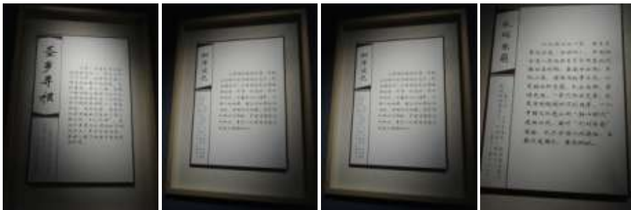
圖二十九、山東省博物館萬世師表展分說展示板

此外，展廳當中也有孔子相關展覽，二〇一八年二月十八日開展，名稱與本院二〇一七年七月一日開展的展名一樣，叫做「萬世師表」（圖二十八）。