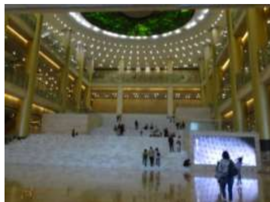
圖二十一、山東省博物館大廳

成立於一九五四年的山東省博物館（圖二十），是中華人民共和國成立後所建第一座省級綜合性地誌博物館，二〇一〇年於現址建成開放，是山東地區最大的博物館，展場內部十分寬敞（圖二十一）。