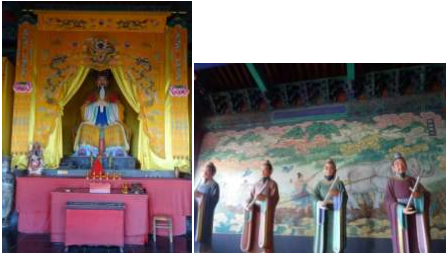
圖十三、歷山舜祠舜帝與臣子塑像、壁畫