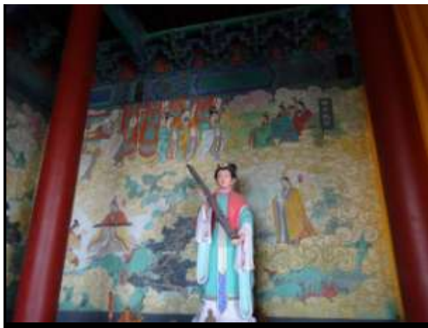
圖十四、舜祠壁畫及塑像