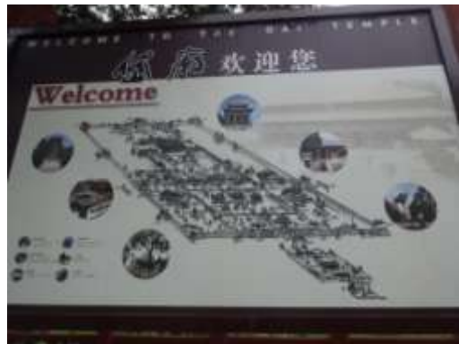
圖四十六、碑林入口說明 筆者攝 圖四十七、岱廟建築示意圖 筆者攝

然而所有建築的命名，都很明顯的和儒家典故具有密切相關，如「配天門」即典出《莊子·田子方》孔子贊老子「德配天地」之語；「仁安門」則是出自《論語·里仁》子曰：「不仁者，不可以久處約，不可以長處樂。仁者安仁，知者利仁。」的典故。(圖四十八)