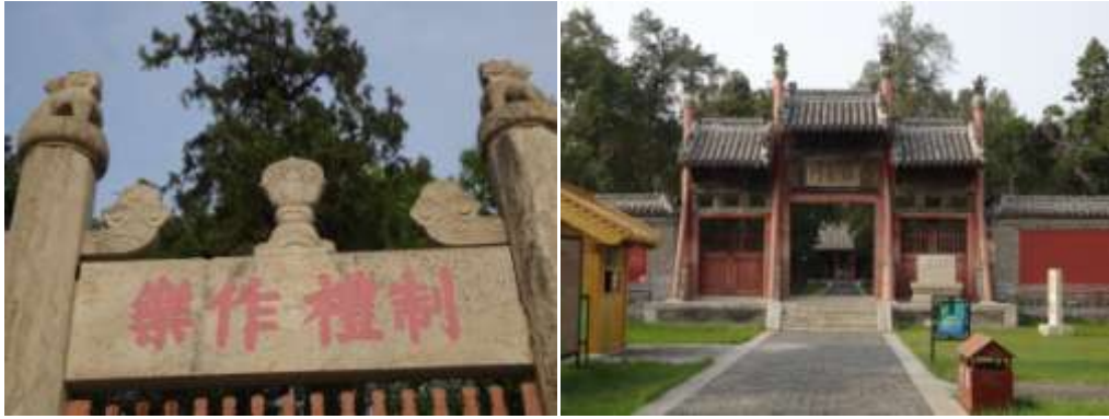
圖七十六、周公廟

曲阜當地，除了孔廟以外，孔子崇拜的周公也有周公廟（圖七十六）；孔子的愛徒顏回也有復聖廟（圖七十七），處處盡是精雕工細的石刻，曲阜當地的縣令，常是孔子的嫡孫衍聖公兼任，在當地修廟追尊儒家所崇敬的聖賢，也是孔氏代代治理曲阜的政績之一。