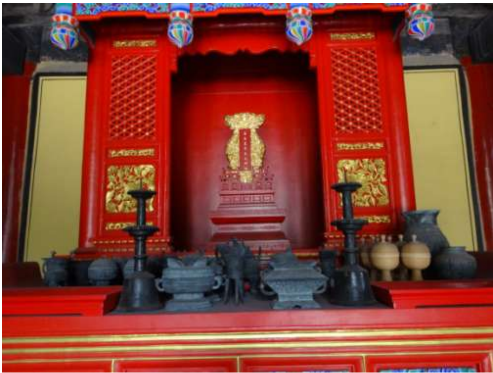
圖七十、曲阜孔廟啟聖殿祭器