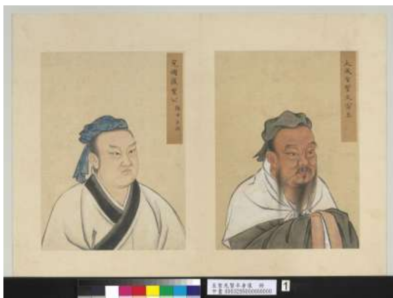
圖一、本院藏《至聖先賢半身像 冊 孔子；顏回》

孔子(圖一)是華夏文化家喻戶曉的聖人，鄰近的日本、韓國、越南及東南亞等地亦受濡溉，形成儒家文化圈。不僅只是典籍文獻，中華傳統藝術也受到孔子思想浸透，極具文人性質。西漢著名史學家司馬遷(約西元前 145-約前 90)，在論及孔子時感嘆：「天不生仲尼，萬古如長夜。」孔子為華夏文明燃起的曙光，代有才人薪火傳承，漸趨發揚。自從西漢以來，歷代爭相追尊孔子、祭祀孔陵、加封孔門弟子與孔氏子孫，詔令各地學校祀孔，並且因為曲阜地近歷代封禪祭拜天地所在的泰山，歷代統治者為了表達對孔子的尊崇，行程安排上往往在封禪泰山之後，幸駕曲阜。孔廟在帝王不時親臨的情況之下，屢屢奉旨修繕，並且刻石立碑。本次研究參訪雖以孔子的故鄉曲阜為主，然而因為台灣臺灣並無航班直飛，必須搭機前往山東省會濟南，再乘火車經泰山往曲阜。考量班機起降所在濟南為山東博物館密集，文物薈萃之地，亦甚值得考察當地文物收藏，故而也將濟南地