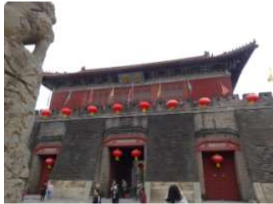
圖四十四、岱廟磚構建築