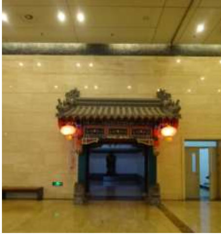
圖二十二、孔子學堂