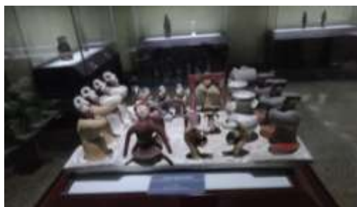
圖五 濟南市博物館漢彩繪樂舞雜技陶俑

最著名的館藏為彩繪陶負鼎鳩(圖四)、彩繪陶樂舞雜技俑(圖五)等，均為齊魯之地受道儒家厚葬觀念影響，所製作的精美墓葬器。僅有的八個展廳中，側重於介紹濟南當地的地方歷史，而以石刻拓本與禮器展廳最為精美(圖六)。