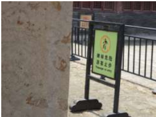
圖五十六、孔府碑林警示

孔府諸多收藏，已經移交孔府文物檔案館，宅內多為後加刻石，很明顯的是為了讓觀光客拍照而立（圖五十四），除了以孔子故事吸引遊人目光，曾至孔府作客的皇帝們也被拿來製成吸睛的說明牌（圖五十五），然而最引人思古幽情的碑林卻不知所以的標示遊客止步（圖五十六），筆者探詢管理單位，被告知是因為古碑或有傾頽斷裂之虞，所以禁止進入。眾多碑刻，只有明清皇帝賜碑因為建有碑亭，狀況尚佳（圖五十七），聖裔故居的現狀，看來因為觀光遊客太過眾多，備受破壞，使人親見頗有不如聞名之感。