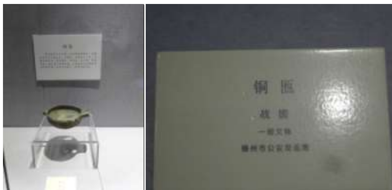
圖五十三、山東滕州文物局破獲追繳物