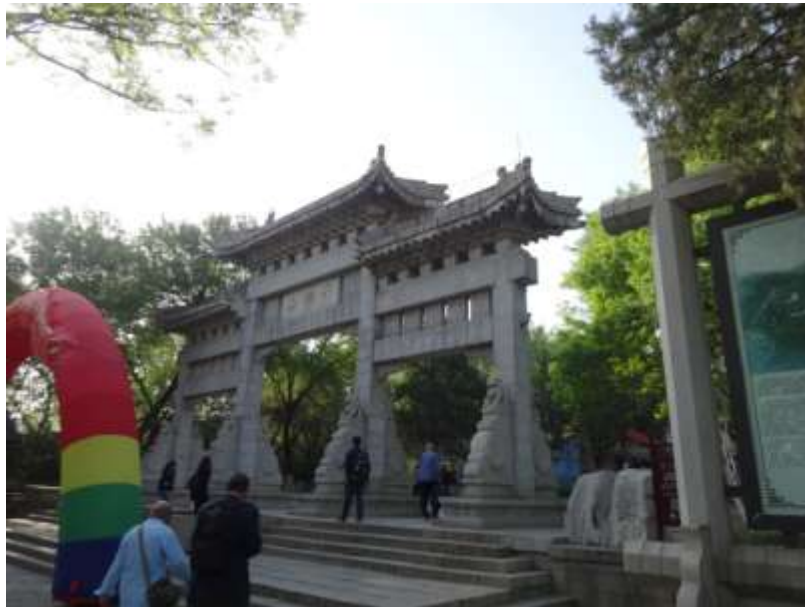
圖三 千佛山(歷山)景區牌樓

濟南市博物館(圖二) 位於歷山千佛山景區(圖三)附近，自古以來皆為傳說中，以孝友聞名的古代賢君舜躬耕之處，附近路名亦以「舜耕」為名。濟南市博物館始