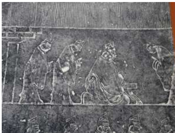
圖九、漢代車馬出行圖