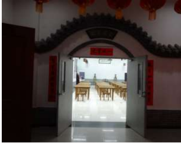
圖二十三、孔子學堂教室門口