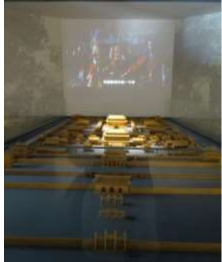
圖三十四 山東省博物館萬世師表展孔廟模型與祭孔視頻