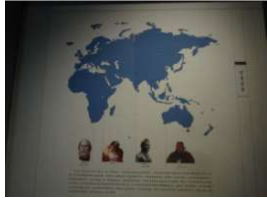
圖三十一、上古思想家分佈