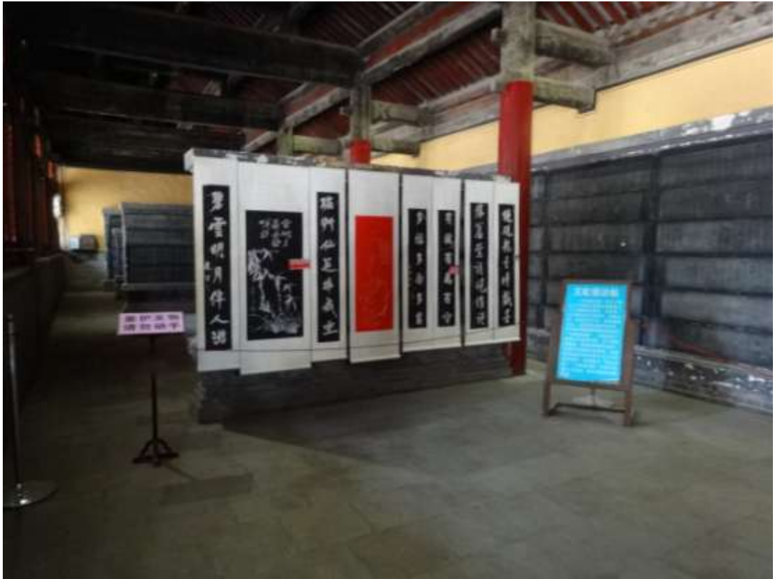
圖六十九、曲阜孔廟玉虹樓法帖