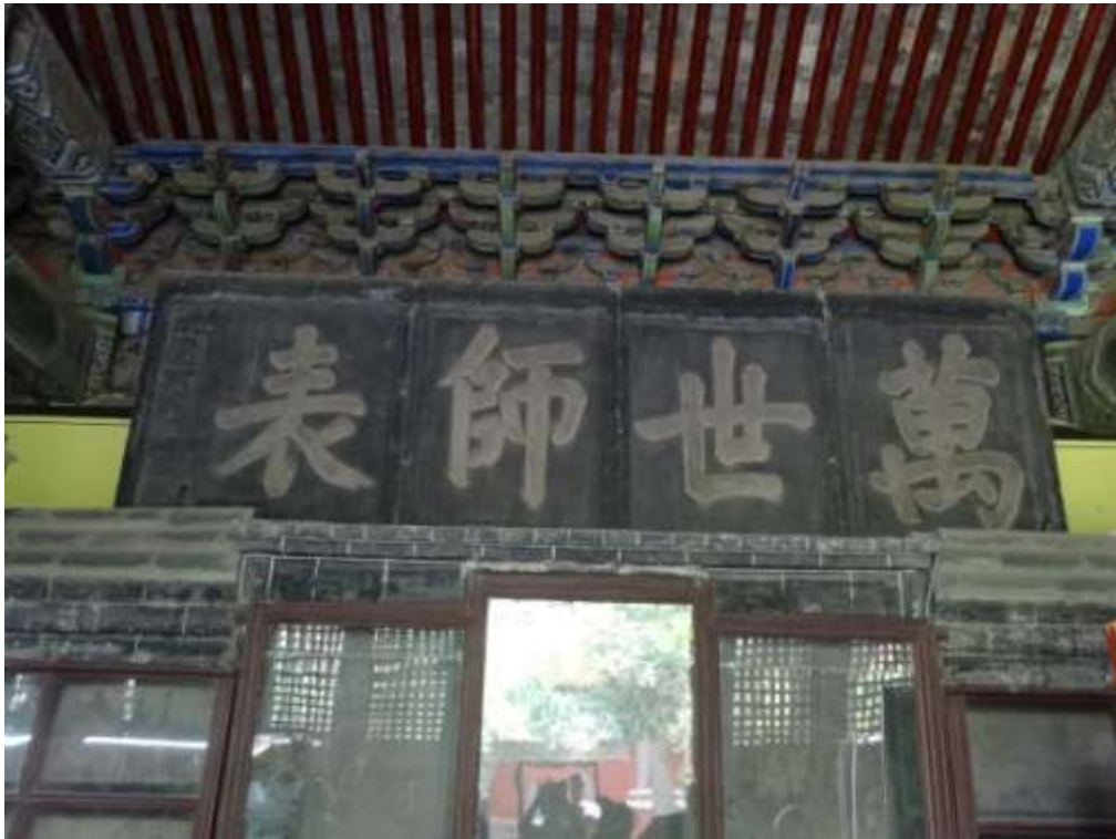
圖六十七、曲阜孔廟萬世師表清聖祖康熙二十三年賜御筆匾額石刻