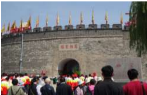
圖六十二、曲阜孔廟萬仞宮牆

曲阜孔廟（圖六十一）規制，比其他地方的孔廟更大，以萬仞宮牆來說，曲阜（圖六十二）明顯更為大型，也更為宏偉，其他的殿閣建築，規模則比照皇帝宮宮，凸顯了孔子一言以為天下表的文化統領身分（圖六十三）。