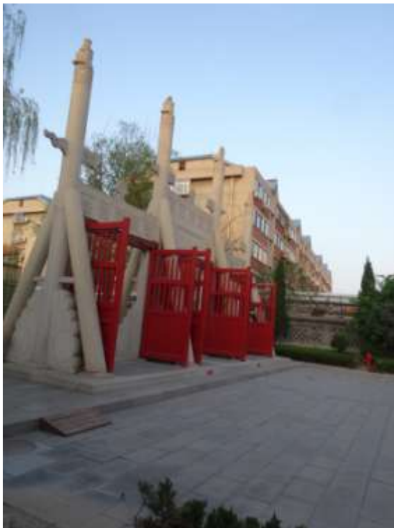
圖十七、濟南府學孔廟櫺星門牌樓

十五)，但卻因為文廟建築整修，不得其門而入。幸而筆者與附近街坊交涉，在隔鄰市場幹部帶領下，拍攝了西牆(圖十六)、府學孔廟櫺星門(圖十七)並且登上附近屋頂拍攝鳥瞰圖(圖十八)，其實所有的傳統孔廟建築規模，如櫺星門、泮池、萬仞宮牆等一應俱全，濟南府學文廟與台南孔廟的規制，大致相同。有趣的是，街坊市場的名字叫做「歷下『貢院』牆根便民市場」(圖十九)，可見目前所見的府學規模應該經過相當的縮減，否則實在難以想像貢生在嘈雜的市集叫賣聲中朗誦詩書。