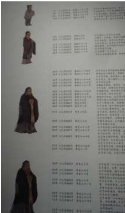
圖三十二、山東省博孔子年表