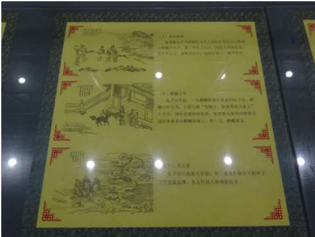
圖六十八、曲阜孔廟聖蹟殿的聖蹟圖石刻與線描