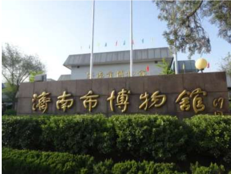
圖二、濟南市博物館外牆