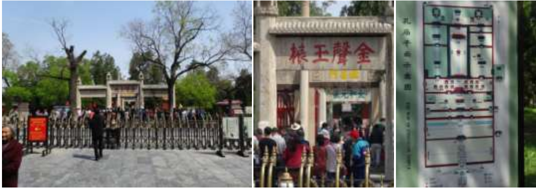
圖六十三、曲阜孔廟建築與平面示意圖 筆者攝