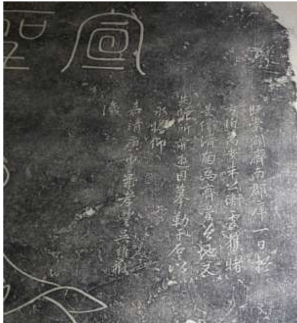
圖八、濟南市博物館藏孔子像