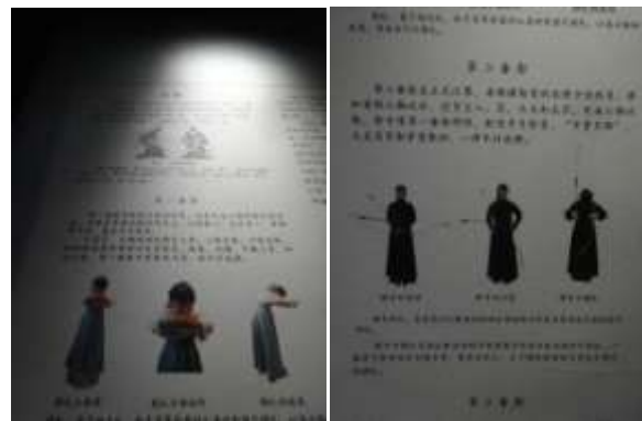
圖三十三、山東省博士射禮

輔以上古世界思想家分佈圖，俾使觀者了解孔子、佛陀、亞里斯多德等人對於東西方思想哲學與宗教方面啟蒙的地理位置（圖三十一），孔子年表也取明代成化年間聖蹟圖中的孔子圖樣來為文字增加趣味性（圖三十二），士射禮部分以真人為模特兒拍攝示範（圖三十三）。