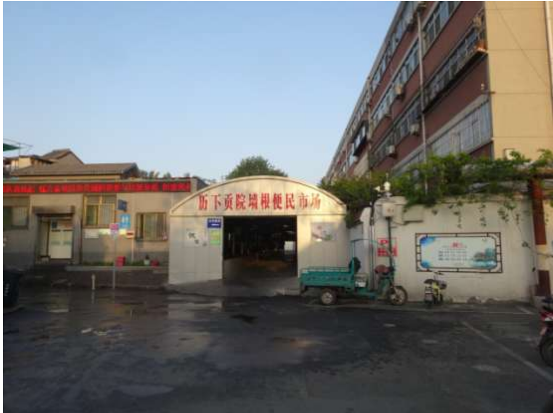
圖十九、濟南府學外的「貢院」菜市場