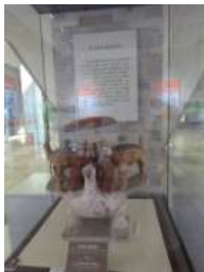
圖四、濟南市博物館漢彩繪載人載鼎陶鳥

建於一九五八年，為山東省地方綜合性大型博物館，國家等級二級，館藏文物二萬餘件，其中國家級文物三件，一級文物五十九件，三級以上文物逾千件，展覽方式則以單純的陳列為主。