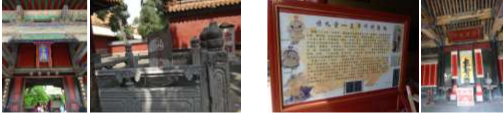
圖五十四、孔府匾與石碑