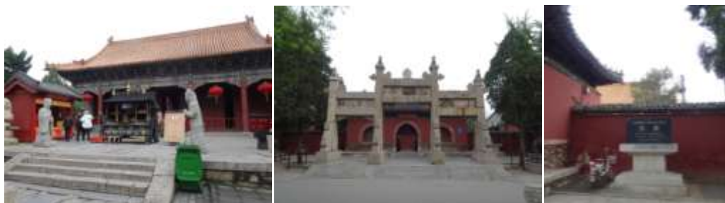
圖四十、岱廟行宮

此行亦赴孔子登泰山而小天下與歷代帝王封禪的泰山（圖三十九）及岱廟（圖四十），泰山因是歷代帝王巡行封禪必至之處，路上幾乎遍地刻碑（圖四十一），除了常見的記事碑、題字碑，還有與泰山有關的詩文都常被拿來立碑，數量眾多，非常驚人。