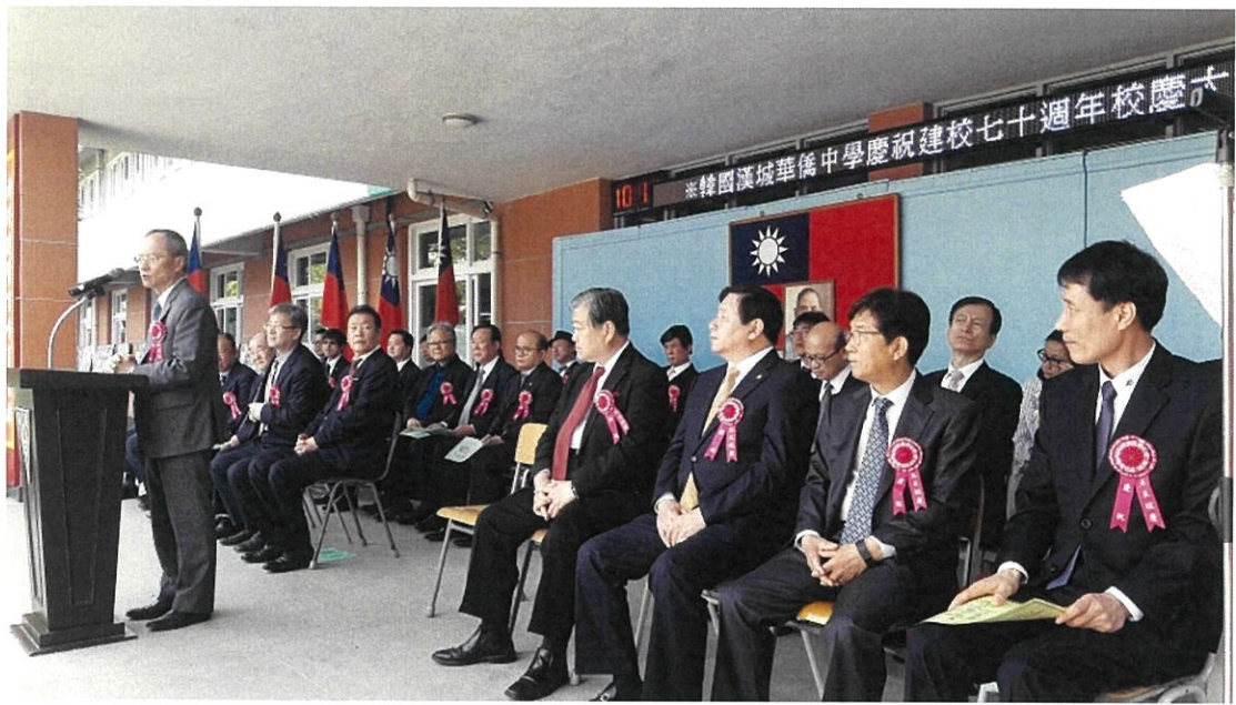
於漢中校慶典禮致詞