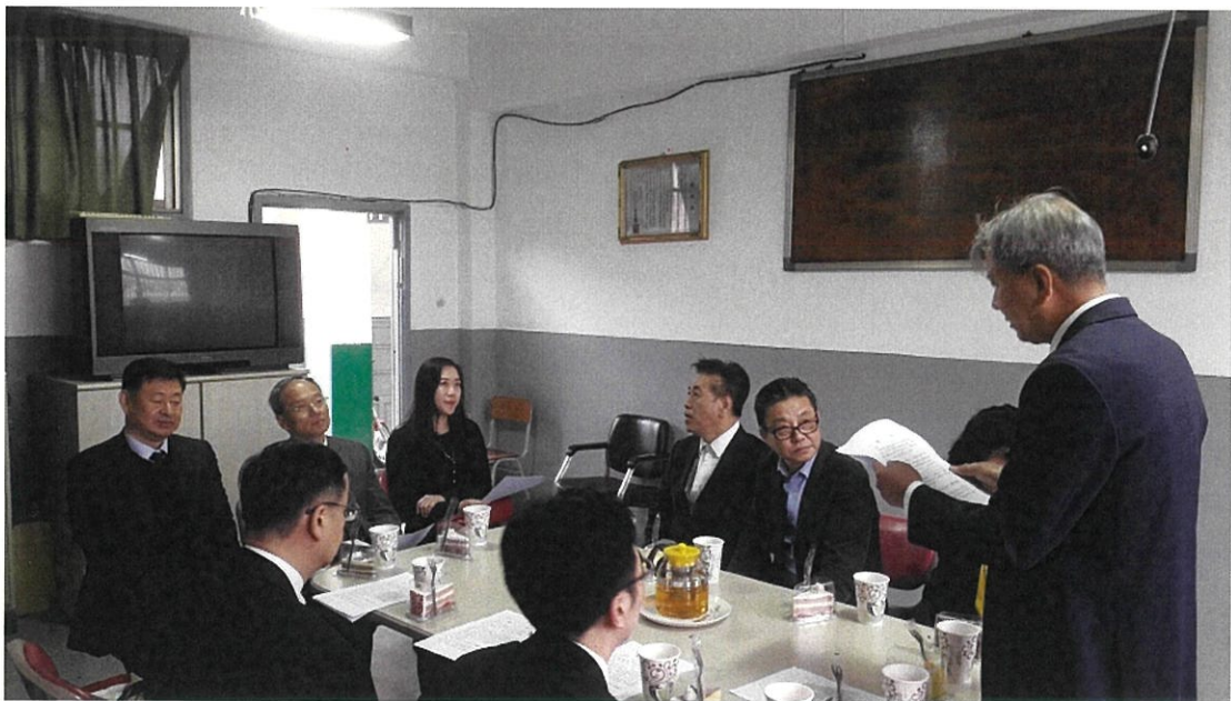
大邱華僑中學校長簡報學校概況