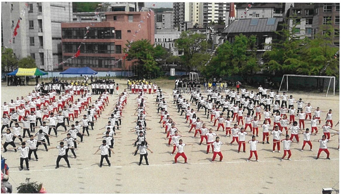
漢城華僑中學大會操表演