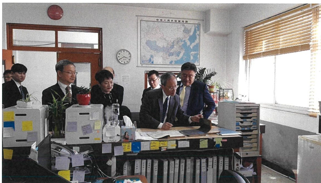
瞭解仁川華僑協會核發戶籍謄本作業狀況