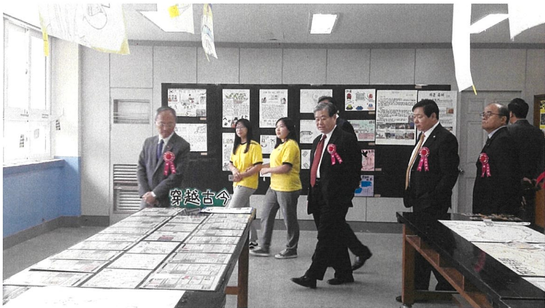
參觀漢城華僑中學學生作品展示