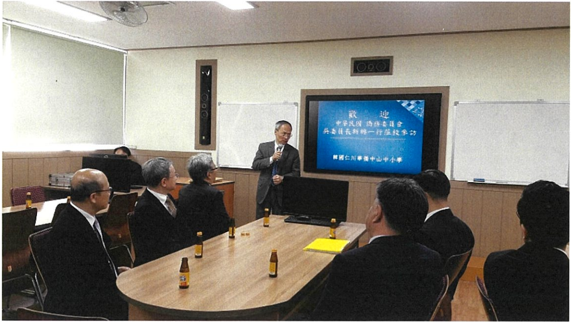
致詞嘉勉仁川華僑中小學理事們及老師們