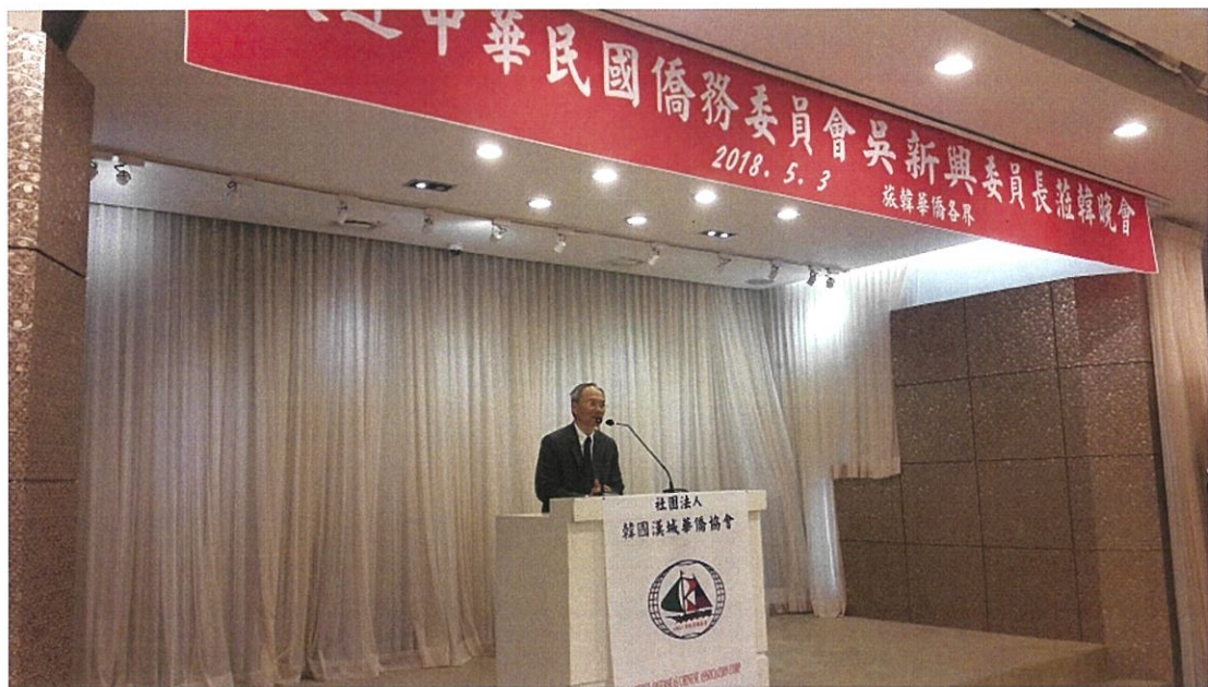
漢城華僑協會主辦僑宴中致詞