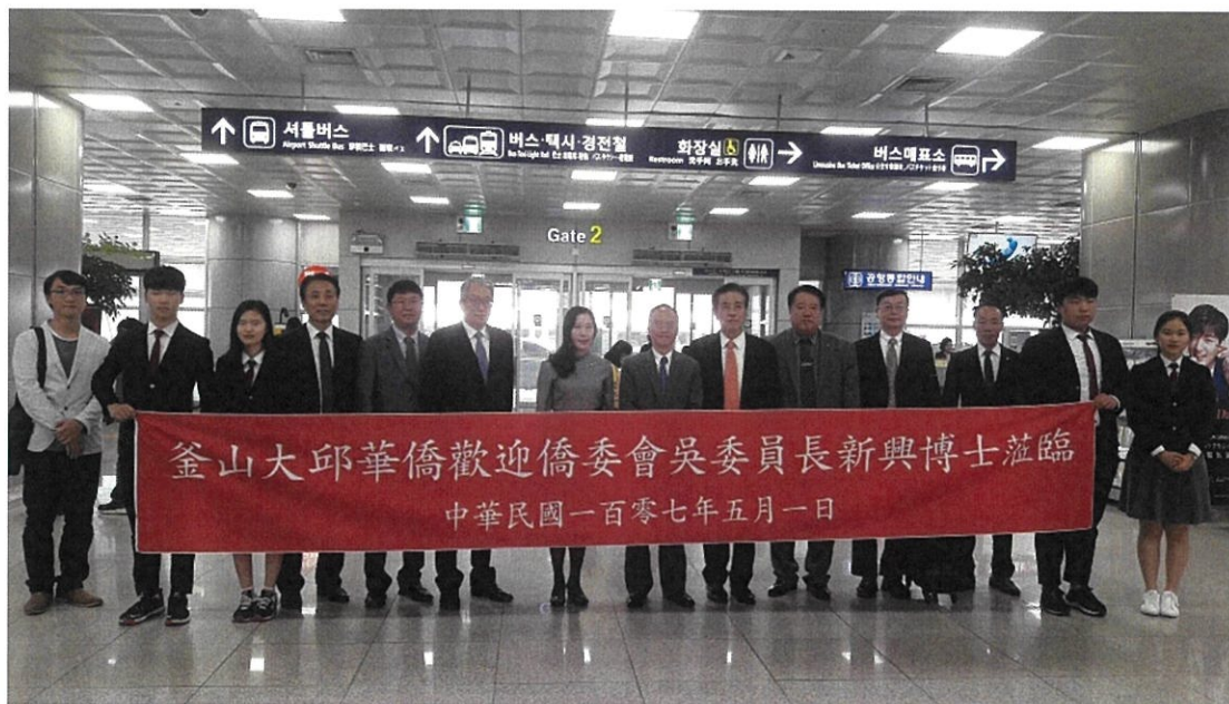
駐釜山辦事處吳處長、當地僑領及老師、同學等於機場迎接