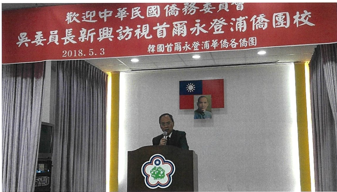
於永登浦座談會上致詞