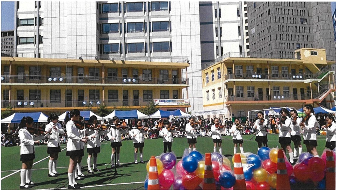
漢城華僑小學弦樂表演