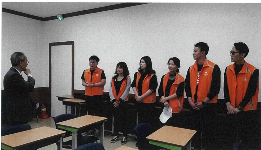
嘉勉漢城華僑小學臺灣老師