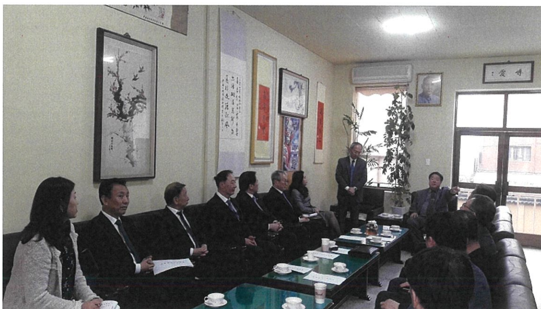
與釜山華僑協會僑領座談