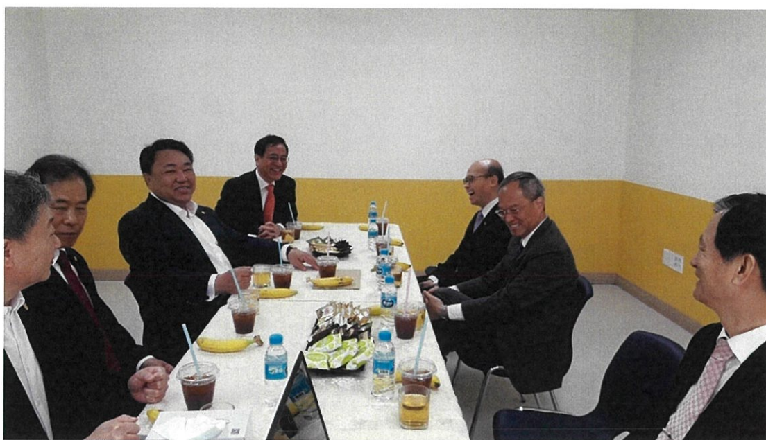
與漢城華僑小學理事會座談