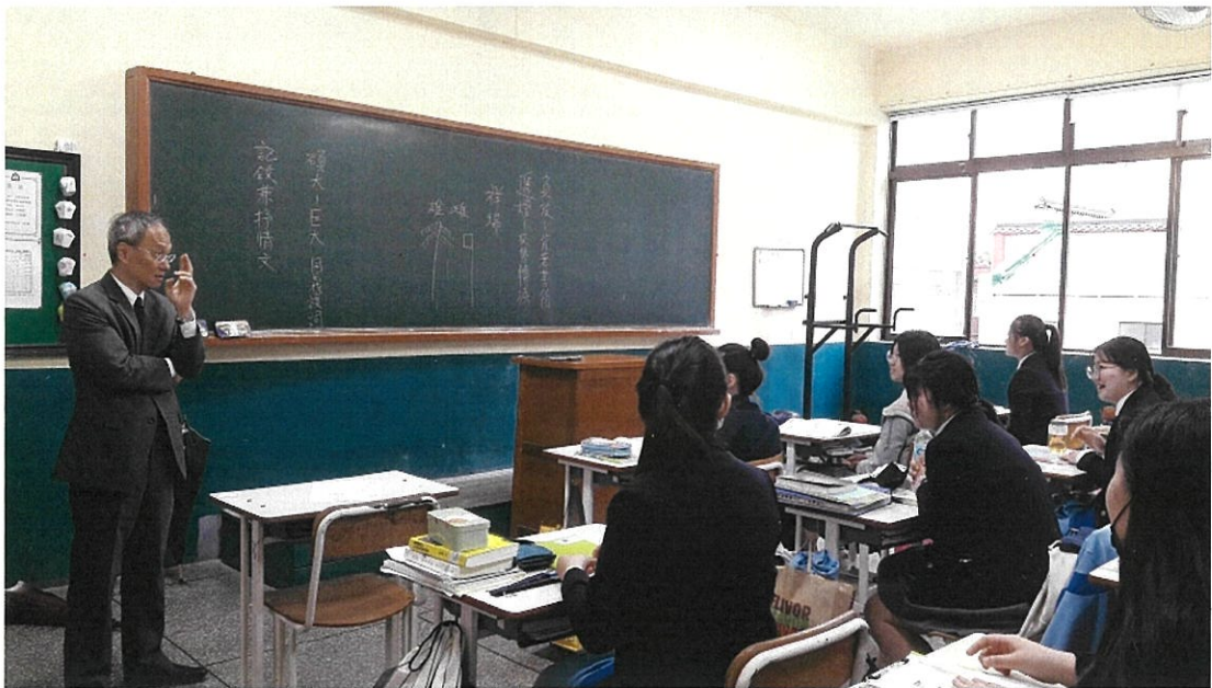
鼓勵金山中學學生回臺升學