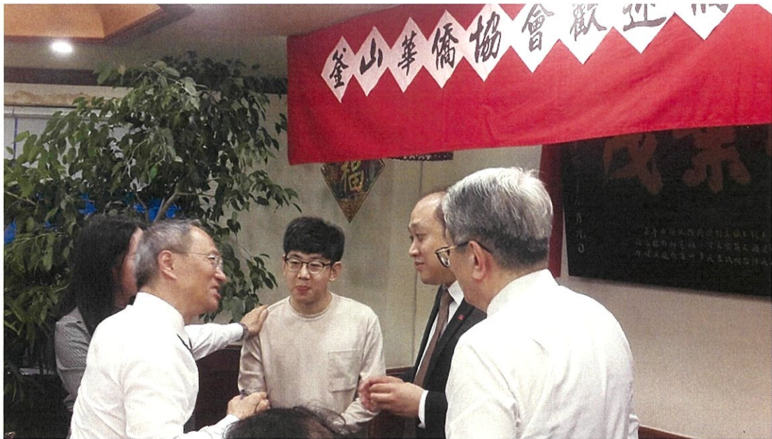
金山僑宴中鼓勵年輕世代加入僑社經營