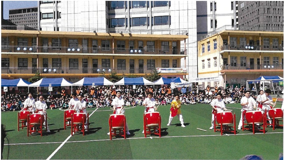
漢城華僑小學武術表演一鼓韻