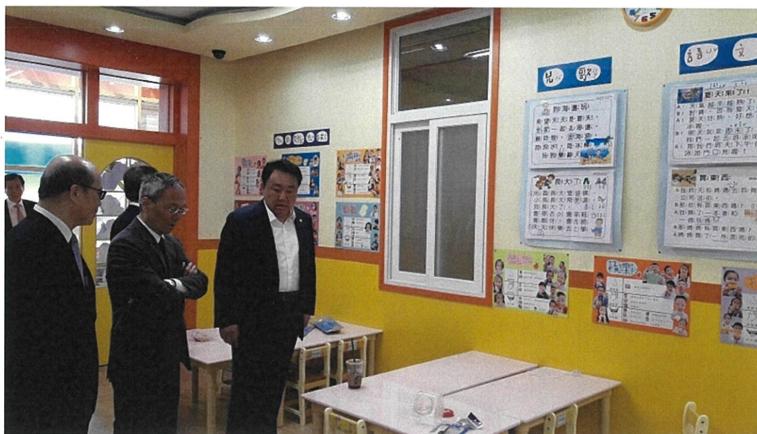
參觀漢城華僑小學設備