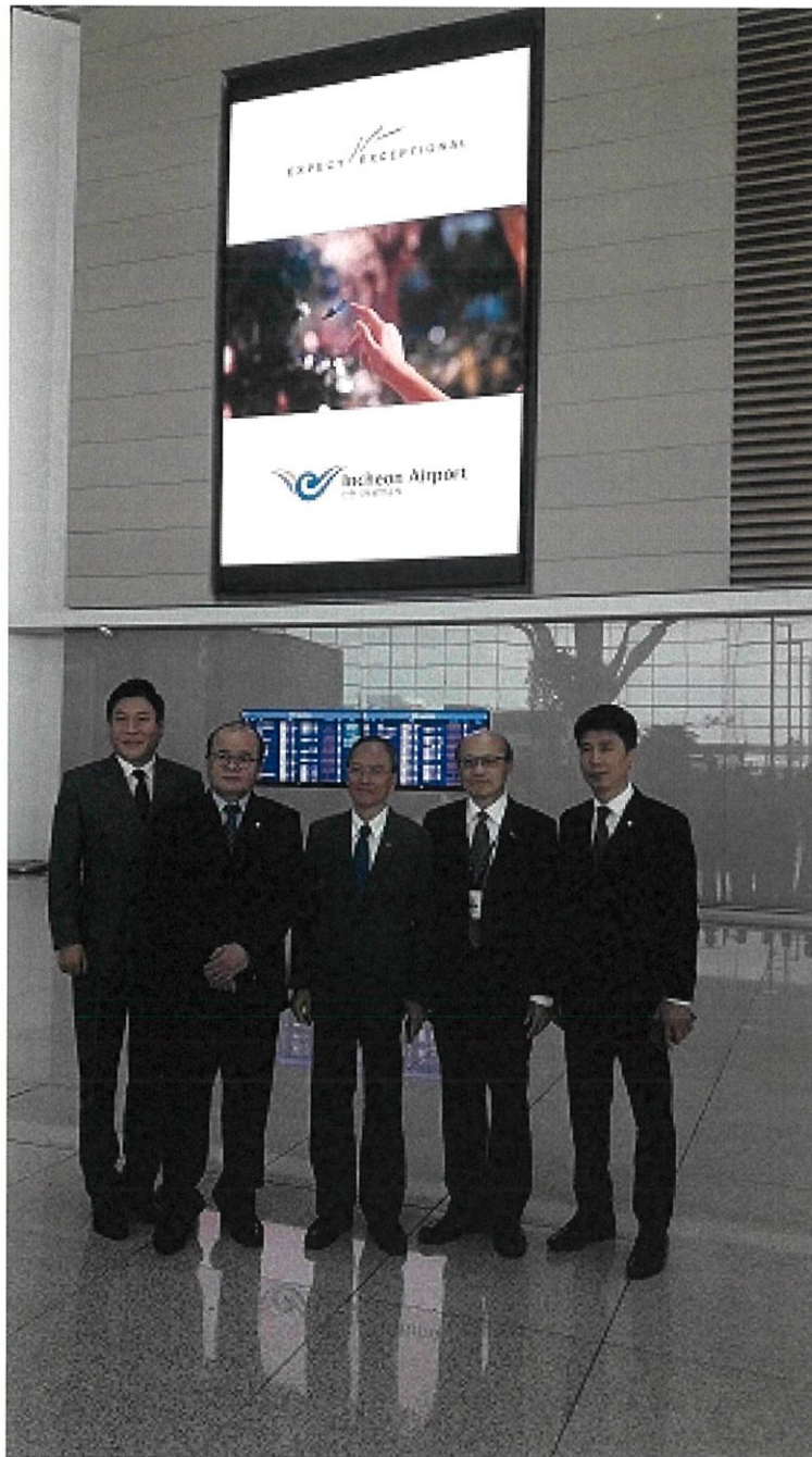
漢城華僑協會候任會長及副會長們機場送機