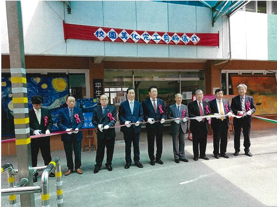
為校園美化工程剪綵