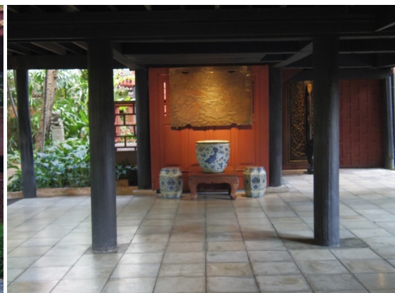
圖十四：傳統高腳式建築(右)

由於泰絲博物館偏向以「名人故居」的形式經營，其建築物本體乃至室內陳設與文物盡量維持著當時湯普森先生仍在世時的風貌。也因此其經營模式較為特殊，地面上的開放式空間與熱帶庭園，全部開放讓已購票民眾自由參觀，而高