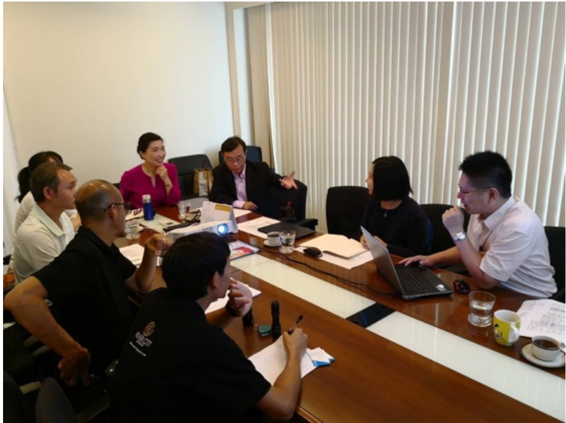
圖八：本院出訪人員與河城藝術中心開會情形