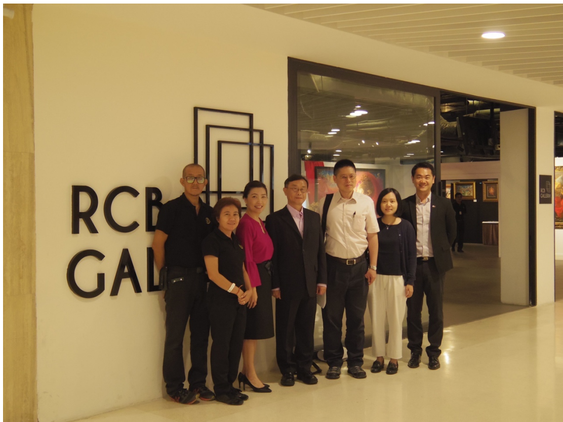
圖七：本院與河城藝術中心與會人士於展場門口合影

除了在展覽主題及展件規劃上與對方達成共識，本次會議討論中亦將本展定位為商業型展覽，並將特別規劃以本院典藏文物為主題的文創商品展示銷售區。此舉乃看重本區以文創發展為主的商業模式，以及河城本身作為大型複合商場的特色，在本展中導入在地化的文創商業特性，使本院典藏文物得透過文創設計展現不同風貌，也是從文創行銷的面向，達成台泰雙方實質的文化交流。