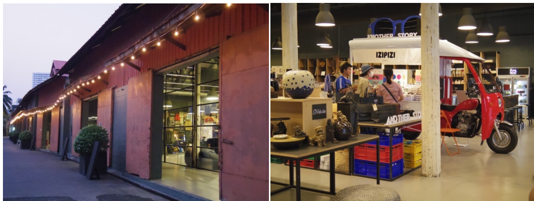
圖五：Warehouse 30 由二戰時期的幾棟老倉庫改造 (左)