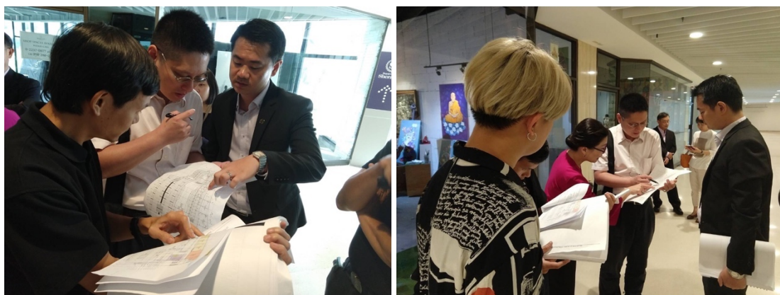
圖九、圖十：本院出訪人員與河城藝術中心場地勘查情形

解整體空間如何運用、展場動線規劃、電力配置以及展件擺放上可能面臨的各種問題，也能更準確找出解決的方法。在場勘之後，各展件的擺放位置已大致底定並與河城達成規劃上的共識，回國後也能更精準作後續規劃及準備。