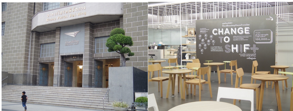
圖三：TCDC 進駐郵政總局(Grand Postal Building)舊址 (左)

TCDC成立於 2005 年，原設於曼谷市區的Emporium百貨公司內，後搬遷至石龍軍路的郵政總局(Grand Postal Building)舊址，為泰國文創設計發展重要的資訊與資源整合平台，內含專業的設計與材料圖書館、創客空間、咖啡廳、創意商業服務空間、展覽廳、文創商店及頂樓觀景空間等。泰國政府希望透過TCDC的資源與發展，引領國內各產業的創新思考，並進一步刺激泰國整體的文化資源發展。 1 而搬遷至石龍軍路現址後的TCDC則另外被賦予活絡舊城區的重任，透過TCDC鏈結社區與資源整合，吸引文創產業進駐，繼而活化與改造社區。