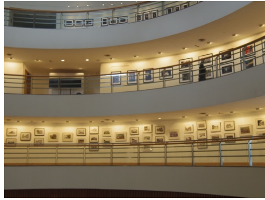
圖十五：BACC 內部採光明亮(左) 圖十六：BACC 環狀展演廳(右)