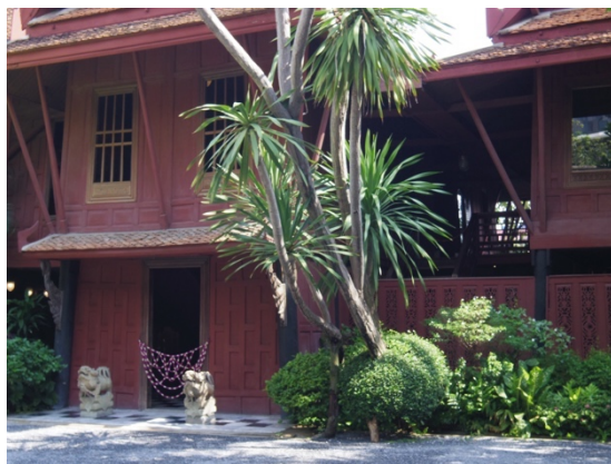
圖十三：泰絲博物館外觀(左)

泰絲博物館為曼谷的著名景點，過去為泰國絲綢大亨金·湯普森（Jim Thompson）的私人別墅，依照泰國的柚木傳統建築建造，保存了東南亞高腳式建築的風格。其中部分構造甚至從其他傳統建築物拆解，搬運至目前位置，為當今曼谷保存最完整的傳統住宅。 2 在潮濕多雨的熱帶地區，傳統高腳式建築主要為嚴防雨季洪水而設計，因此建築物的一樓為開放式空間與種滿各式花卉植物的熱帶庭園，僅擺放幾件戶外傢俱、花盆、雕塑，而主要的居住空間則集中在二樓。建築物內部亦遵循古法，讓遊客得以欣賞傳統的室內陳設、建築技術與工法，如為了加強建築結構的梯形窗戶與門廊就是其中一種特殊工法。同時，屋內也展示著湯普森先生多年來自東南亞各地收藏的古文物，如青花瓷、佛像、珍玩等，而這些收藏日後都成為其經營泰國絲綢工藝與設計上的靈感。