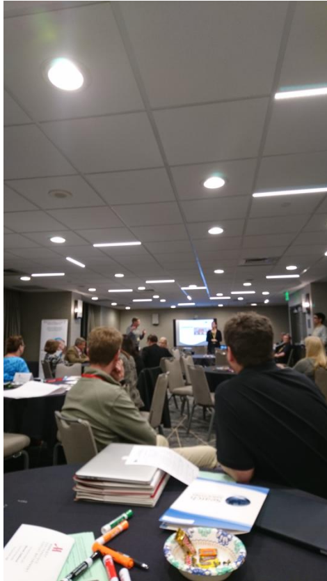
大會辦理面試外師說明會