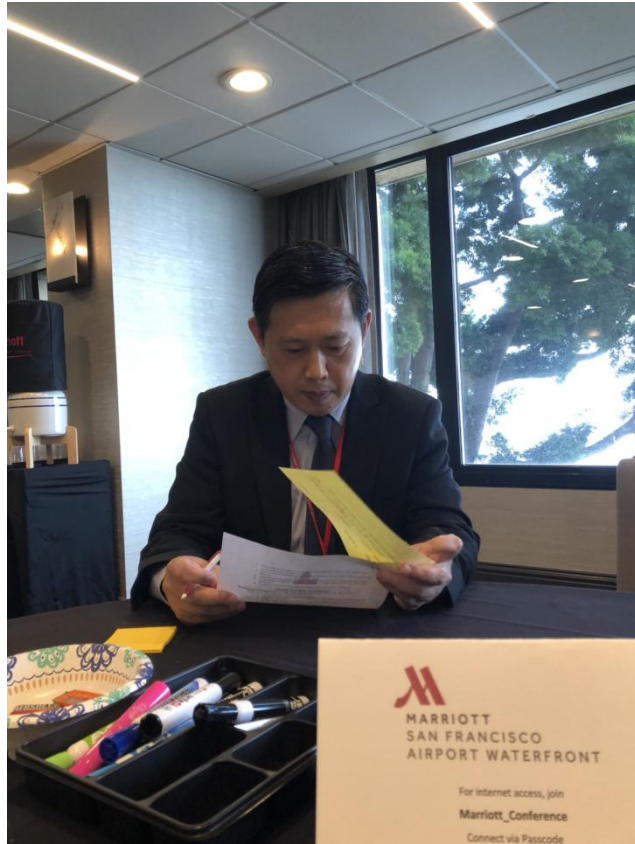
校長審查外師履歷表