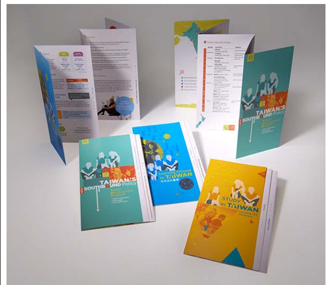
Study in Taiwan 文宣