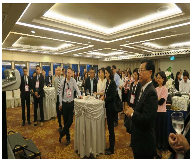
臺灣夜出席人數踴躍