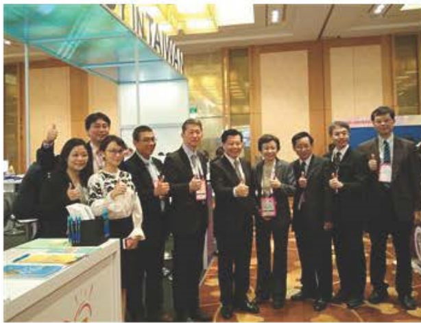
駐新加坡台北代表處梁國新代表(右五)、教育部國際及兩岸教育司畢祖安司長(左五)、財團法人高等教育國際合作基金會陳貞夙執行長(右四)與出席「亞太教育者年會」之我國內大學代表在Study in Taiwan展位合影。