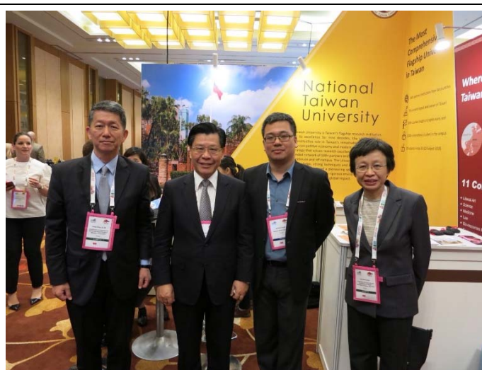
參觀臺灣大學攤位