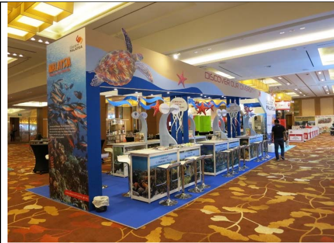
馬來西亞國家攤位