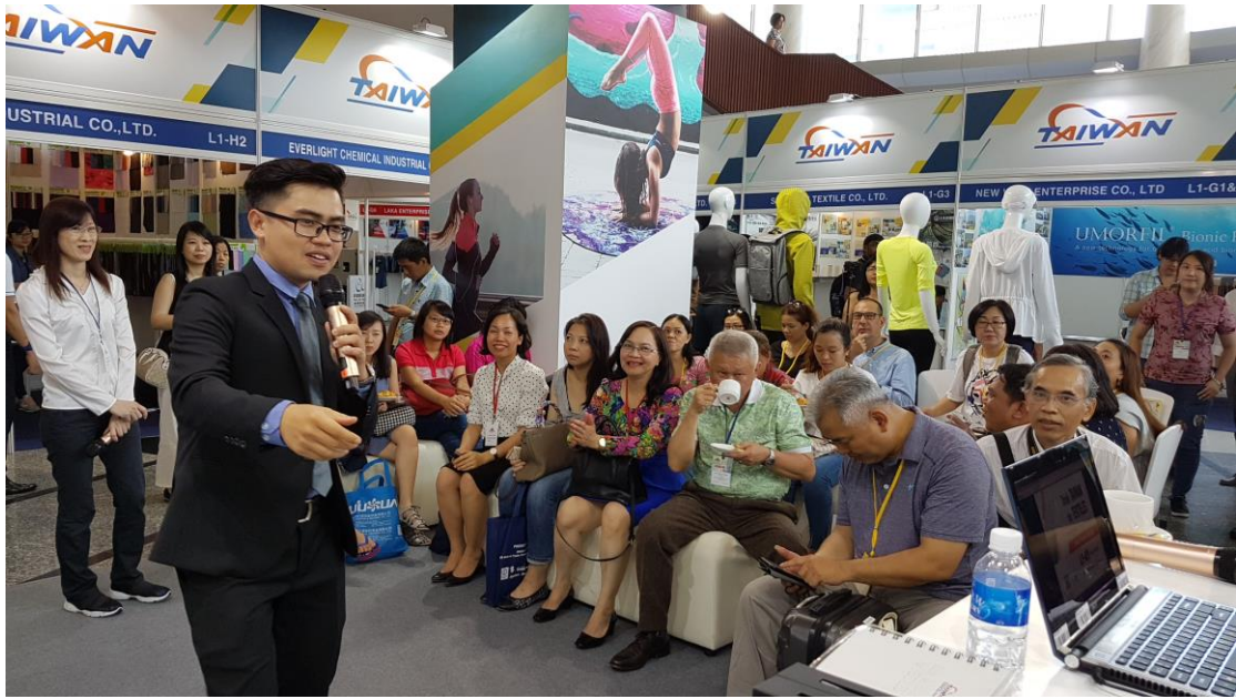
臺灣館形象區-新產品發表會