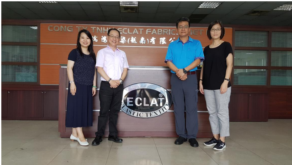
越南當地臺商訪談-儒鴻織染公司