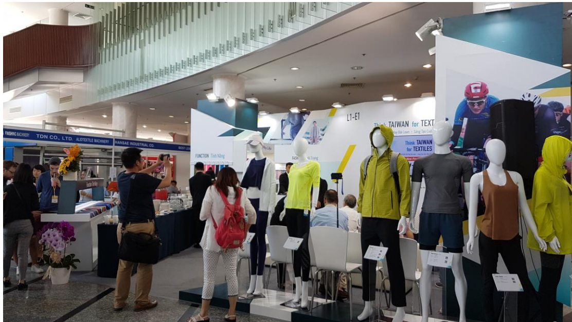
臺灣館形象區-展示臺灣優質機能性紡織品