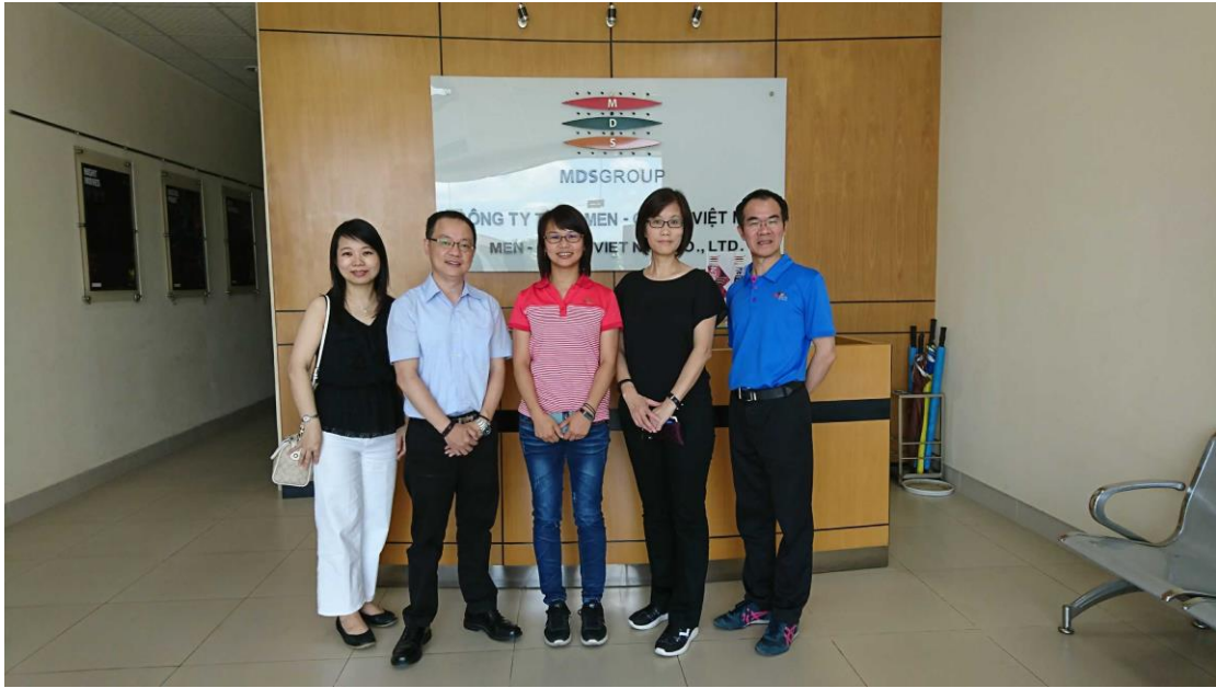
越南當地臺商訪談-綿春纖維工業