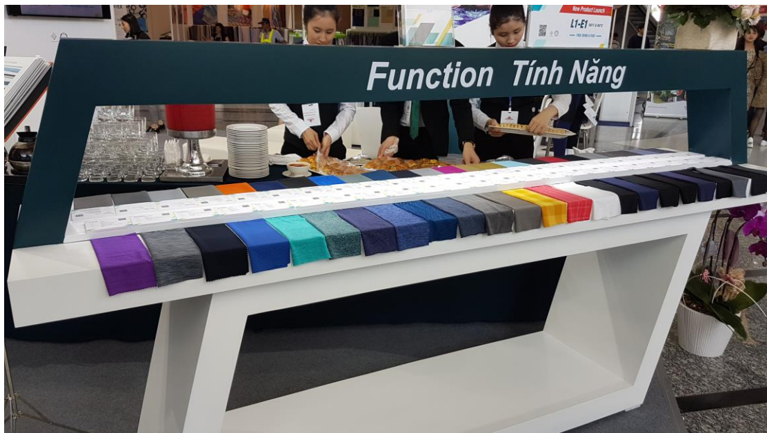
臺灣館形象區-臺灣廠商優質機能布料展示