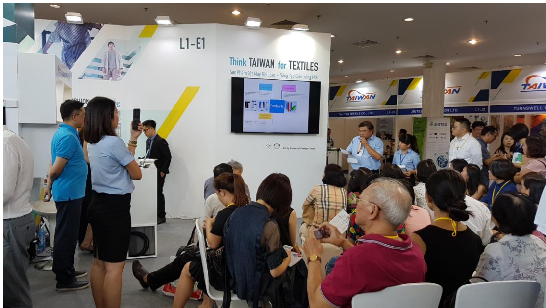
臺灣館形象區-新產品發表會