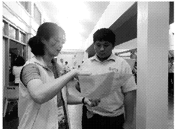
介紹海青班及 3+4 僑生技職專班