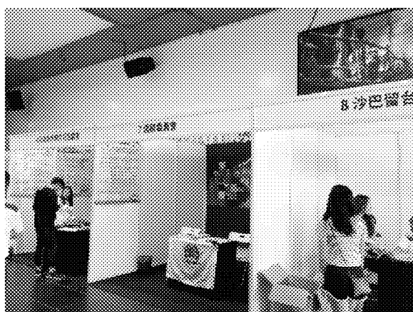
本會展場佈置情形