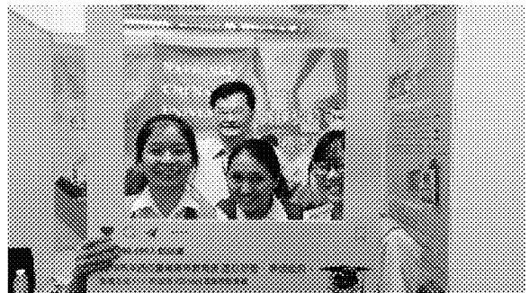
海外聯合招生委員會主任委員與同學一 同參與該會臉書拍照上傳活動