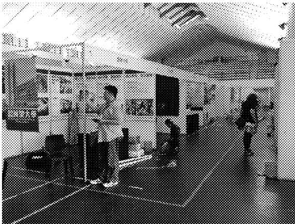
詩巫衛理中學佈展實況