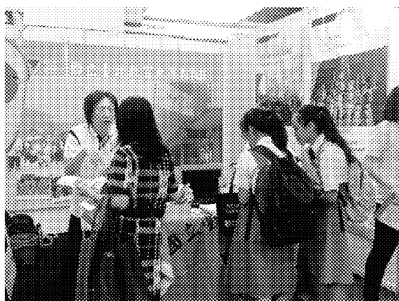
亞庇展場參觀情形