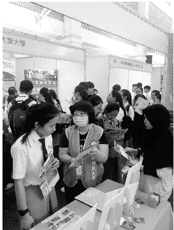
詩巫展場參觀情形