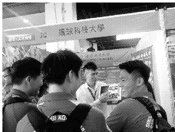
亞庇展場參觀情形