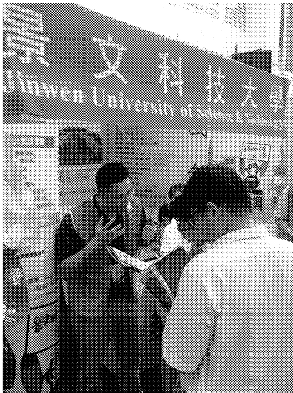
詩巫展場參觀情形