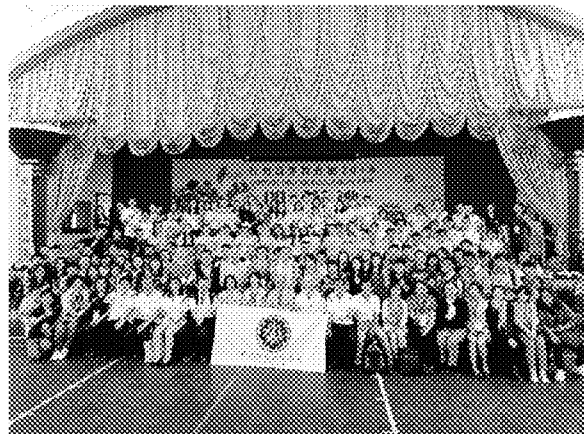
詩巫展場開幕儀式全體合影