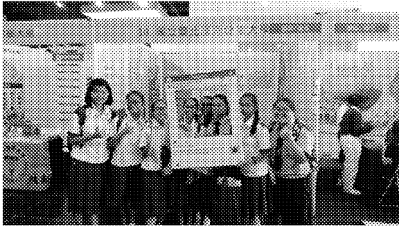
參觀同學參與海外聯合招生委員會臉書 拍照上傳遊戲