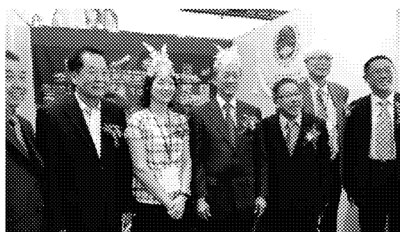
沙巴州首席部長署助理部長拿督暨留臺 聯總、沙巴留臺同學會、海外聯合招生 委員會等人巡視本會展場