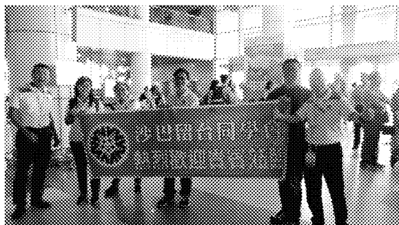
沙巴留臺同學會於亞庇機場歡迎宣導團 抵達