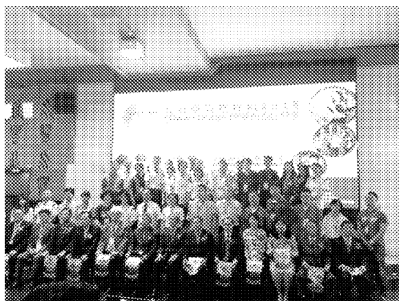
亞庇展場開幕儀式全體合影