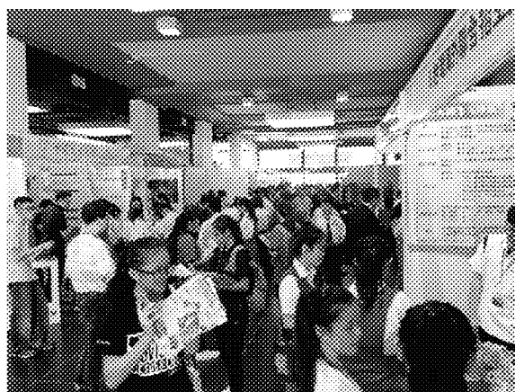
亞庇展場參觀情形