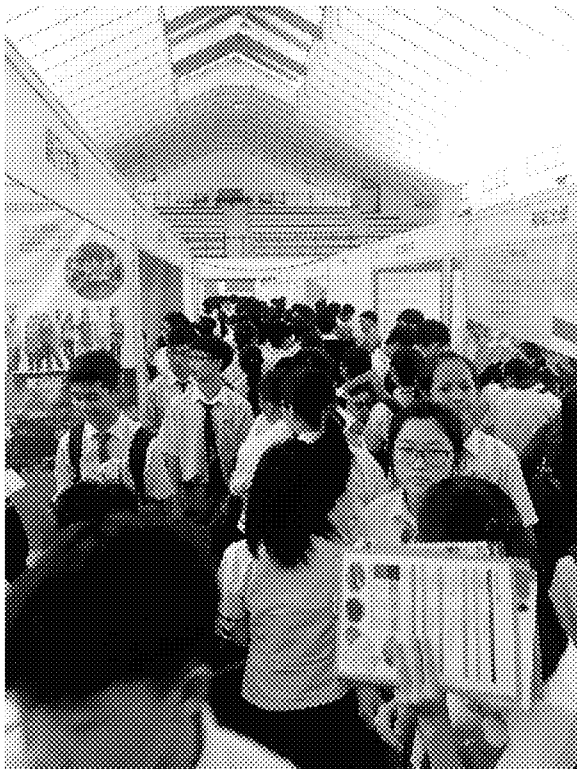
詩巫展場參觀情形