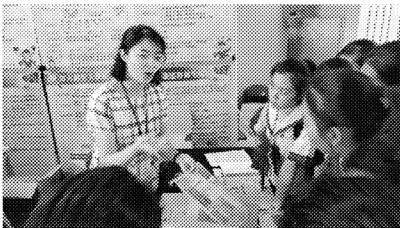
介紹來臺升學各項路徑