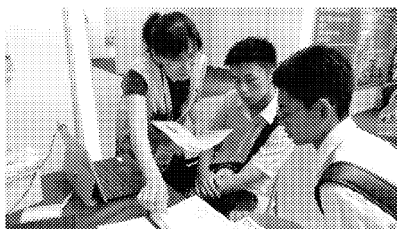
亞庇展場參觀情形