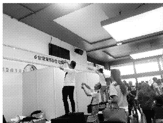
亞庇加拉文星商業廣場佈展實況