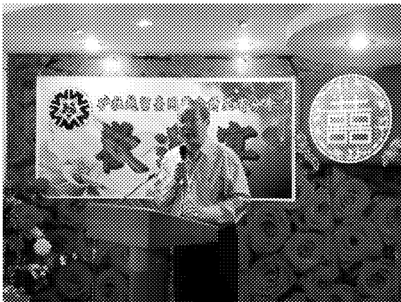
砂拉越留臺同學會詩巫分會歡迎晚宴