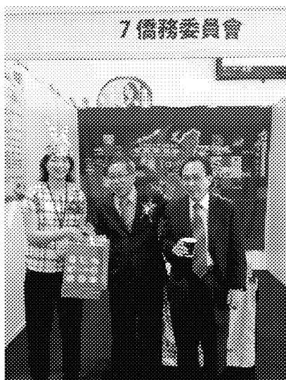
代表本會饋贈禮品致沙巴留臺同學會