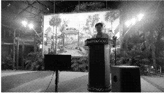
海外聯合招生委員會主任委員於詩巫展 場慶功宴致辭感謝各單位參與