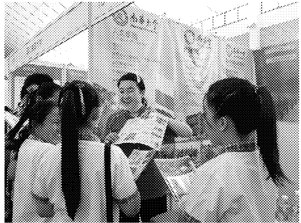
詩巫展場參觀情形