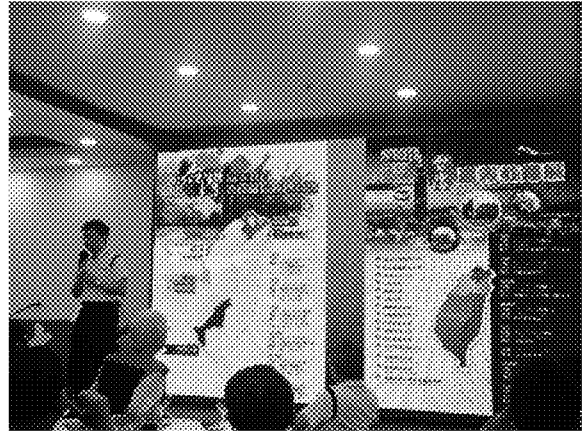
慶功宴上沙巴留臺同學會說明近來招生 宣導工作辦理情形