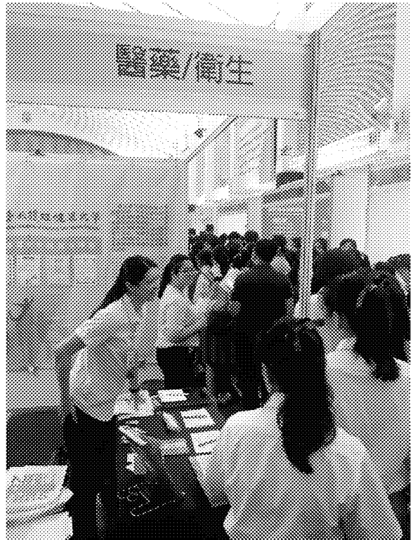
詩巫展場參觀情形