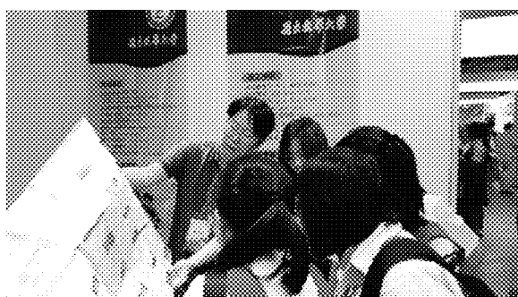
亞庇展場參觀情形