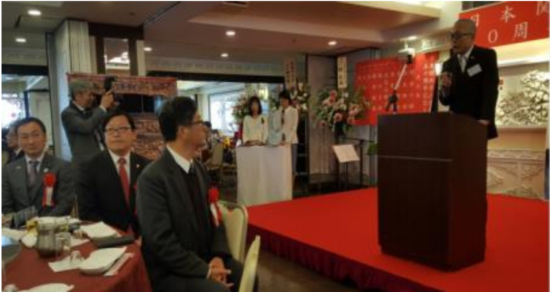
圖 1：城會長年德致詞

然徐老先生因年事已高無法親臨會場，但從城會長的致詞中仍能深切體會老父親的殷殷期盼，以及城會長的捨我其誰之氣概，無不令人動容。