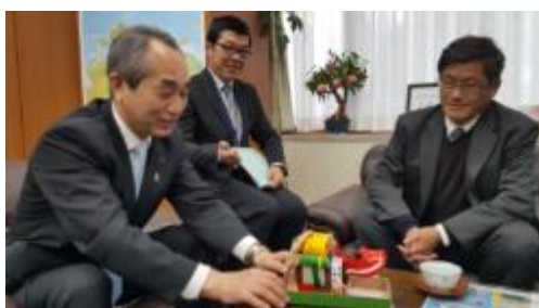
圖 22：副知事介紹福島吉祥物