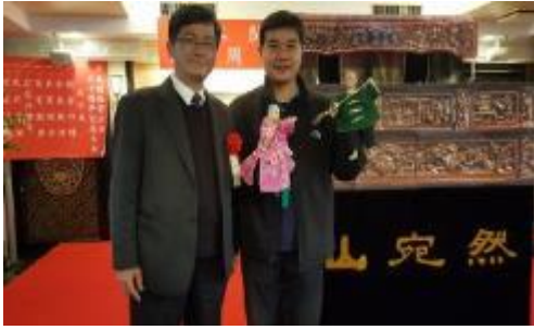
圖 3：與表演團隊合影