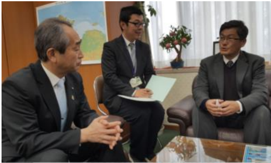
圖 20：楊副主任委員副知事 HATA Toshiyuki 相互交流

雖然拜會福島副知事乙案安排甚為匆促，但在臺日雙方密切聯繫下，得以順利成行。當日前往福島縣政府拜會 HATA Toshiyuki 副知事，楊副主任首先對臨時安排行程表達歉意，並對副知事排出會面時間表示感謝之意。楊副主任說明此次前來，主要是日本東北 311 大地震已屆七周年，臺灣民眾對東北的災民現況仍然非常關心，依據媒體報導，經過多年的重建發展之後，仍有數萬災民無法回到自己家鄉。臺灣與日本都是地震頻繁的海島國家，這幾年來也都經歷過幾次重大傷亡的地震災害，對於災後重建的心路歷程，彼此更是感同身受。特別是災害發生後的互相協助，更加有助於發展臺灣與日本民眾之間的友好情誼。