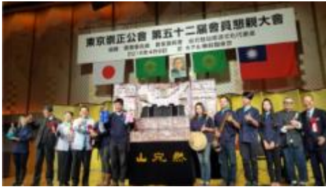
圖 11：山宛然及與會貴賓