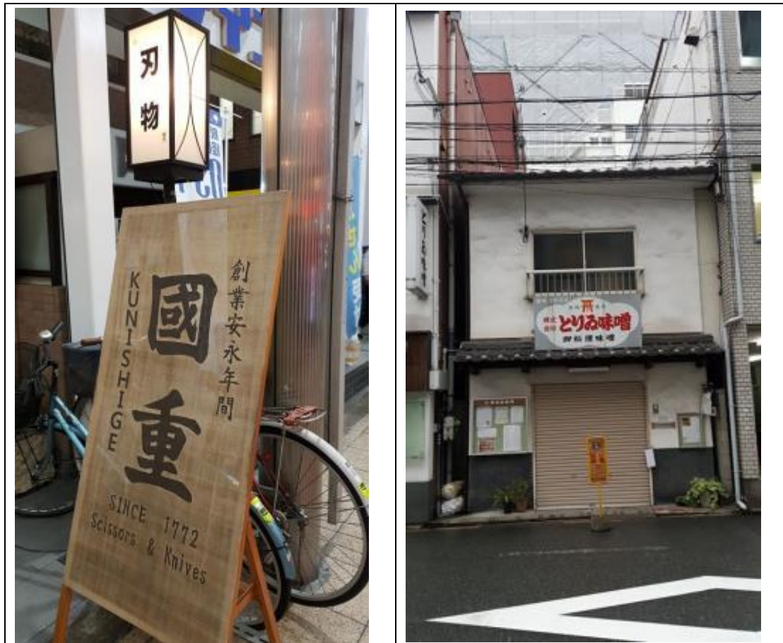
幾代人，一件事，技進於道。 一個「本土社會」的安穩從容，時間不過是掛漏。