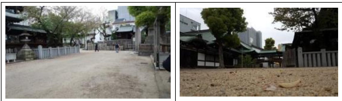
大阪天滿宮-- 這片沙地在臺灣一定鋪滿水泥