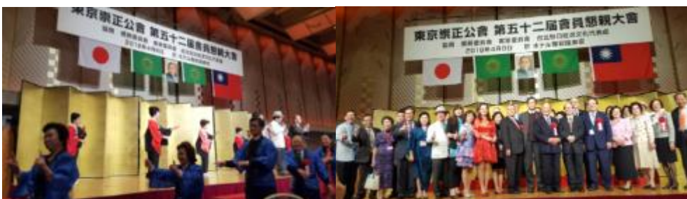
圖 17：在日本踴舞中賓主盡歡