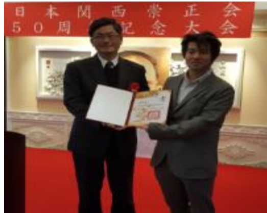
圖 7：代表主委頒贈諮詢委員證書