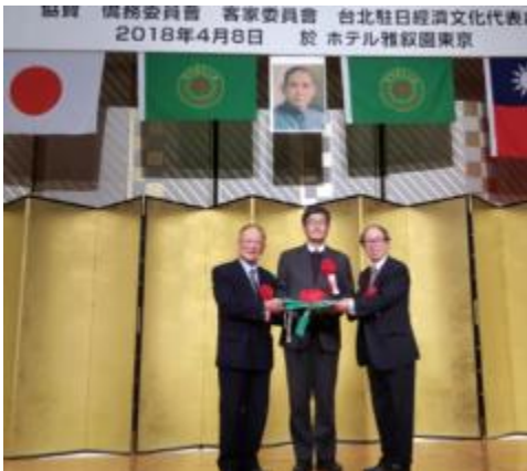
圖 13：東京崇正公會會長交接