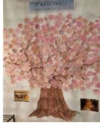
圖 24、25 搭起福島與臺灣客庄的友誼之橋，期待日本與臺灣的友誼之花綻放