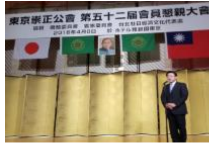
圖 12：日本參議院西田實仁議員