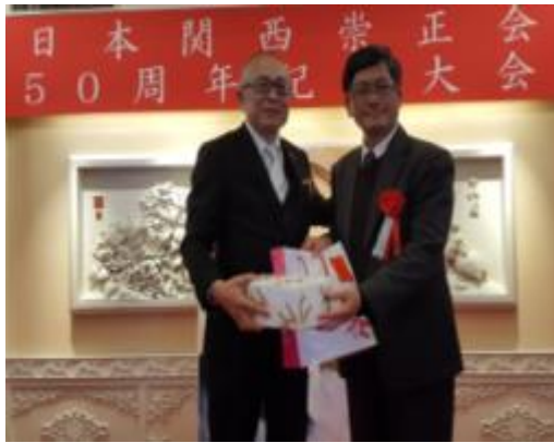
圖 5：與城會長互贈紀念品