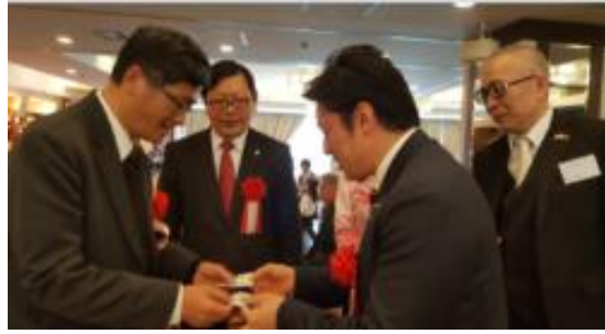
圖 4：日本眾議院外務委員長中山泰秀議員