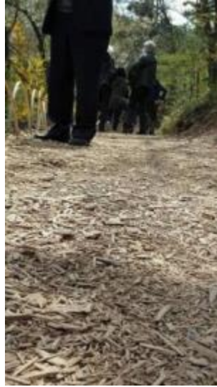
花見山步道簡易扶手與鋪面