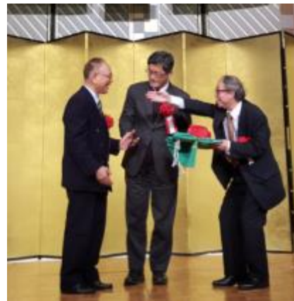
圖 14：前後任會長揖讓而升