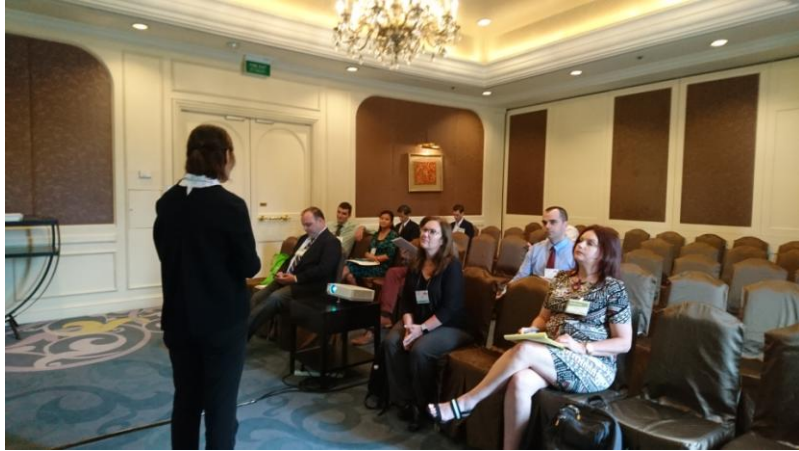
黃校長向老師們作學校簡報