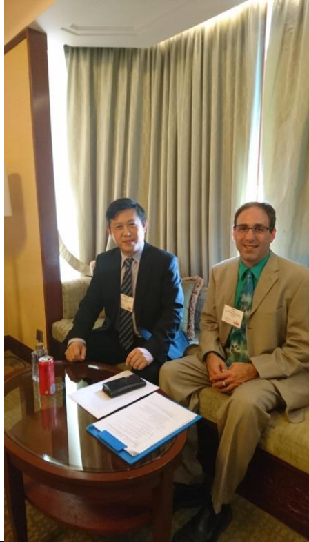
校長與羅瑟老師進行面試前拍攝