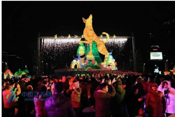
现场市民游客众多

本届“江苏·台湾灯会”将一直持续到3月18日，每晚17:00-22:00亮灯，全程免费开放，光影交织、璀璨梦幻，其视觉、互动效果堪称亚洲一流水平。灯会期间，著名的台湾美食“士林夜市”也将来到迪诺小镇，蚵仔面线、天妇罗、蚵仔煎等五十余种小吃，让你畅享台湾美食！此次士林夜市小吃街将随第八届江苏台湾灯会2月2日一同开幕，结束时间为3月11日。