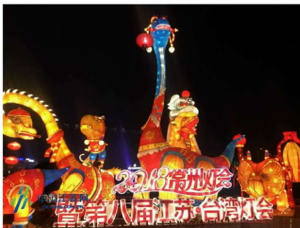
苏台灯会正式亮灯

中国江苏网讯（记者梅源）2月2日晚，常州环球恐龙城迪诺水镇灯火璀璨，华光溢彩，由常州市人民政府和江苏省旅游局共同主办，常州旅游协会、环球恐龙城联合承办的2018第八届“江苏·台湾灯会”在这里举行亮灯仪式，为期一个多月的“江苏·台湾灯会”正式启幕。