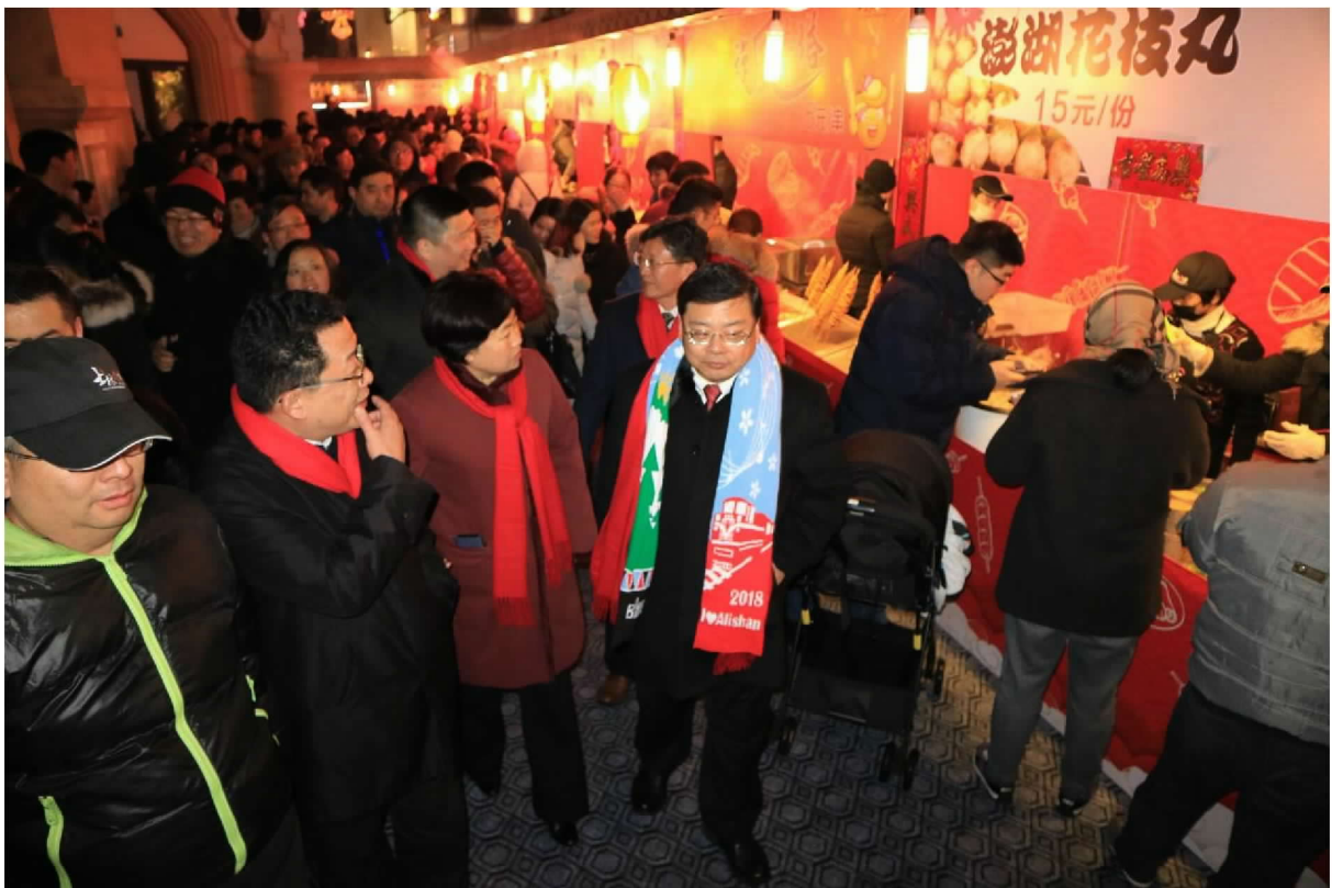
張副局長與會貴賓巡視市林夜市攤位區品嚐臺灣小吃美食