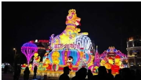
2018台灣江蘇交流燈會閃亮登場。