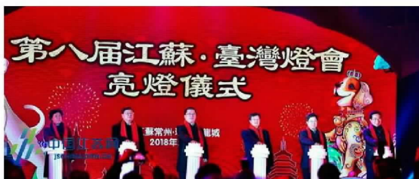
第八届苏台灯会正式亮灯