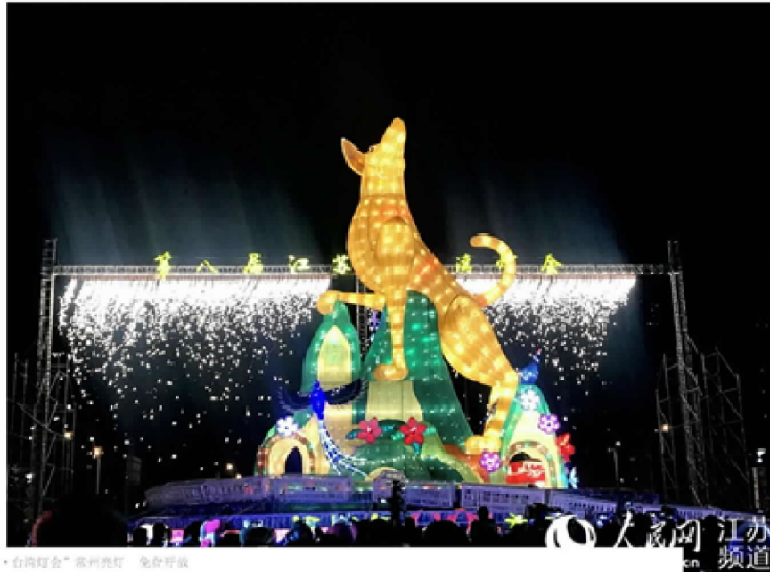
第八届“江苏·台湾灯会”常州亮灯 免费开放