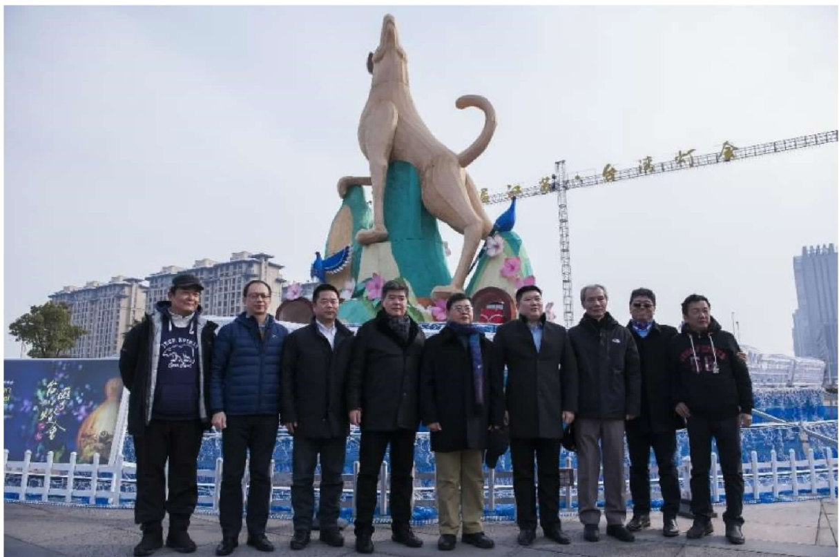
與江蘇省旅遊協會、常州市政府及燈藝師於主燈前合影