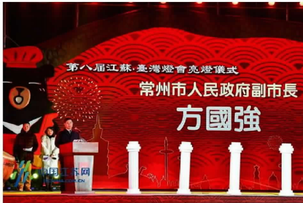
常州市副市长方国强致辞