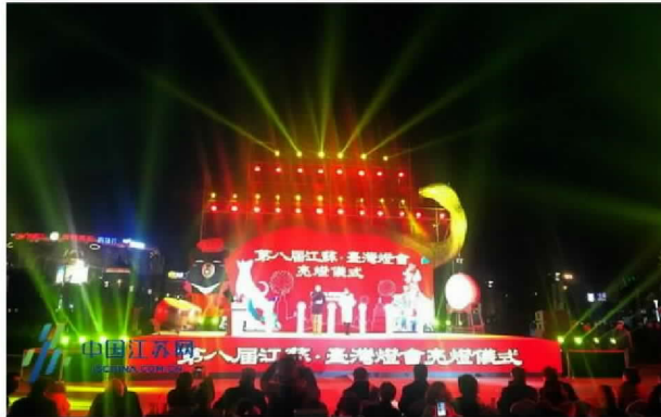
第八届苏台灯会亮灯仪式现场

2月2日晚，常州环球恐龙城迪诺小镇灯火璀璨，华光溢彩，由常州市人民政府和江苏省旅游局共同主办，常州旅游协会、环球恐龙城联合承办的2018第八届“江苏·台湾灯会”在这里举行亮灯仪式，为期一个多月的“江苏·台湾灯会”正式启幕。