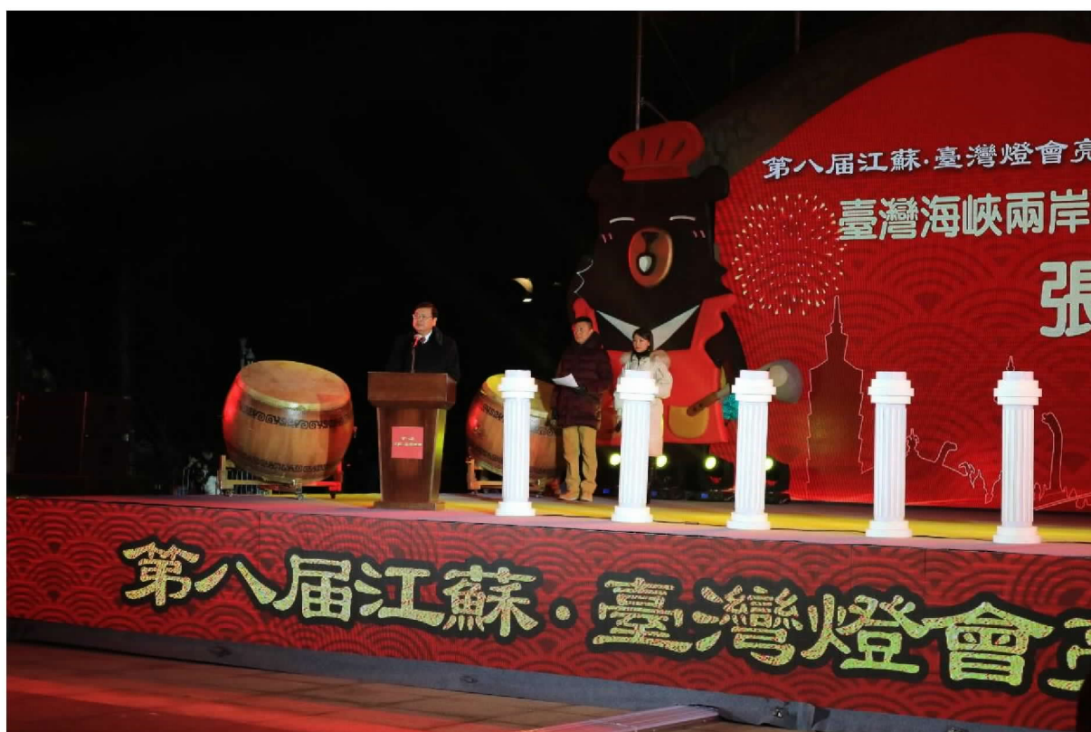
2018 臺灣江蘇燈會交流－開燈典禮由張副局長代表致詞