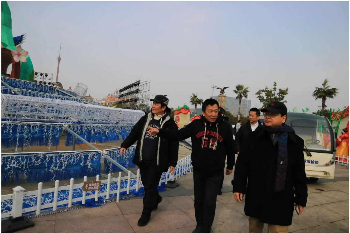
2018 臺灣江蘇燈會台灣燈區檢視作業