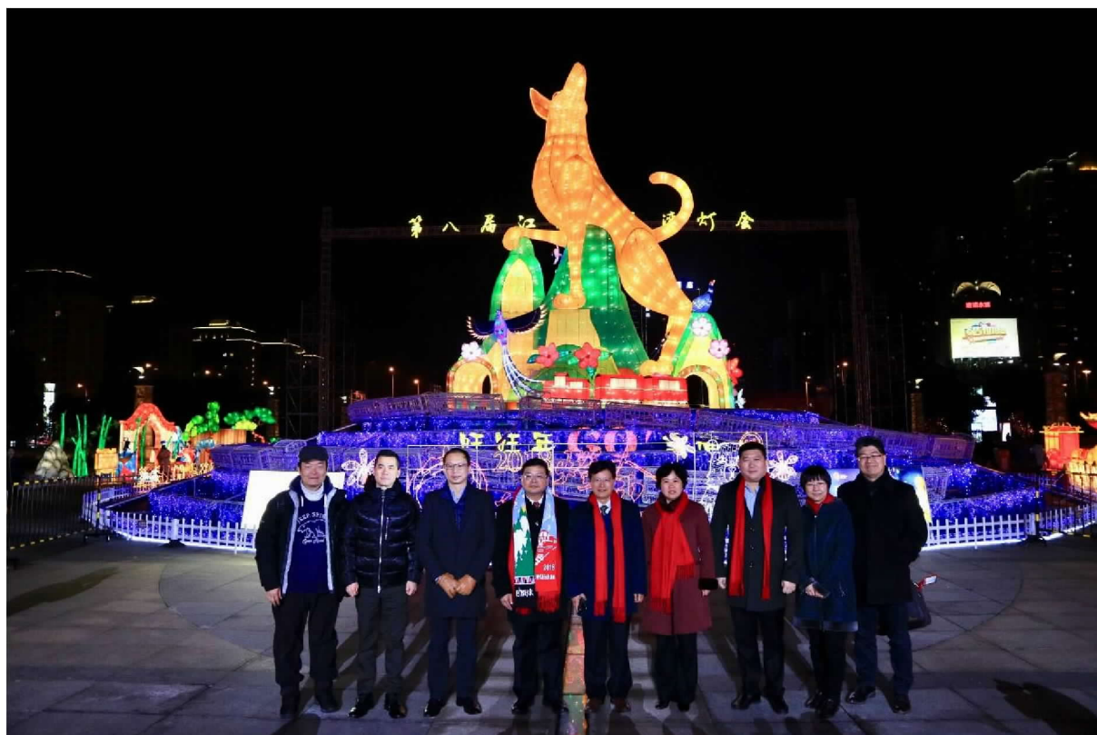
張副局長與會貴賓於主燈前合影