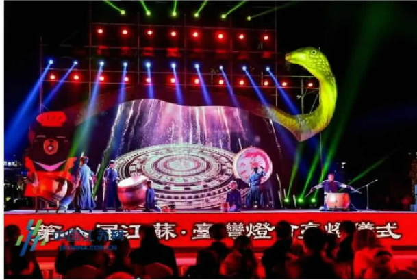
精彩文艺节目表演

苏是大陆开放赴台个人游城市最多的省份之一。2017年，苏台双向旅游交流再一次突破百万人次，接待入境台湾同胞109.05万人次、同比增长14.1%，入境人数再创新高。