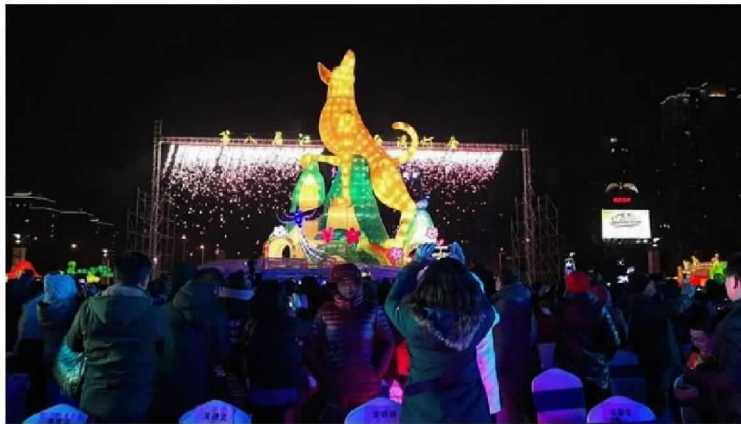
2018台灣江蘇交流燈會閃亮登場。(台旅會提供)