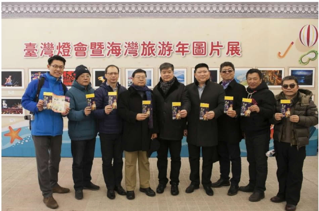
臺灣燈會暨海灣旅遊年圖片展