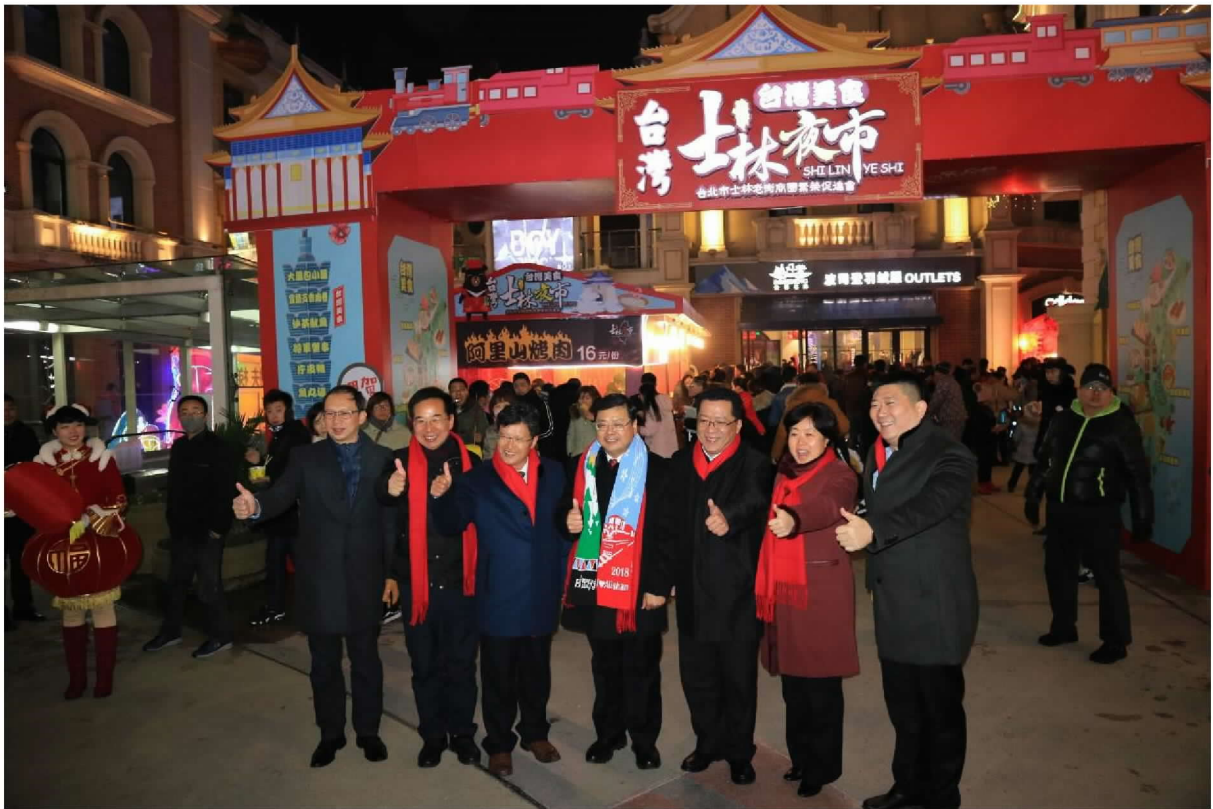
張副局長與會貴賓巡視市林夜市攤位區