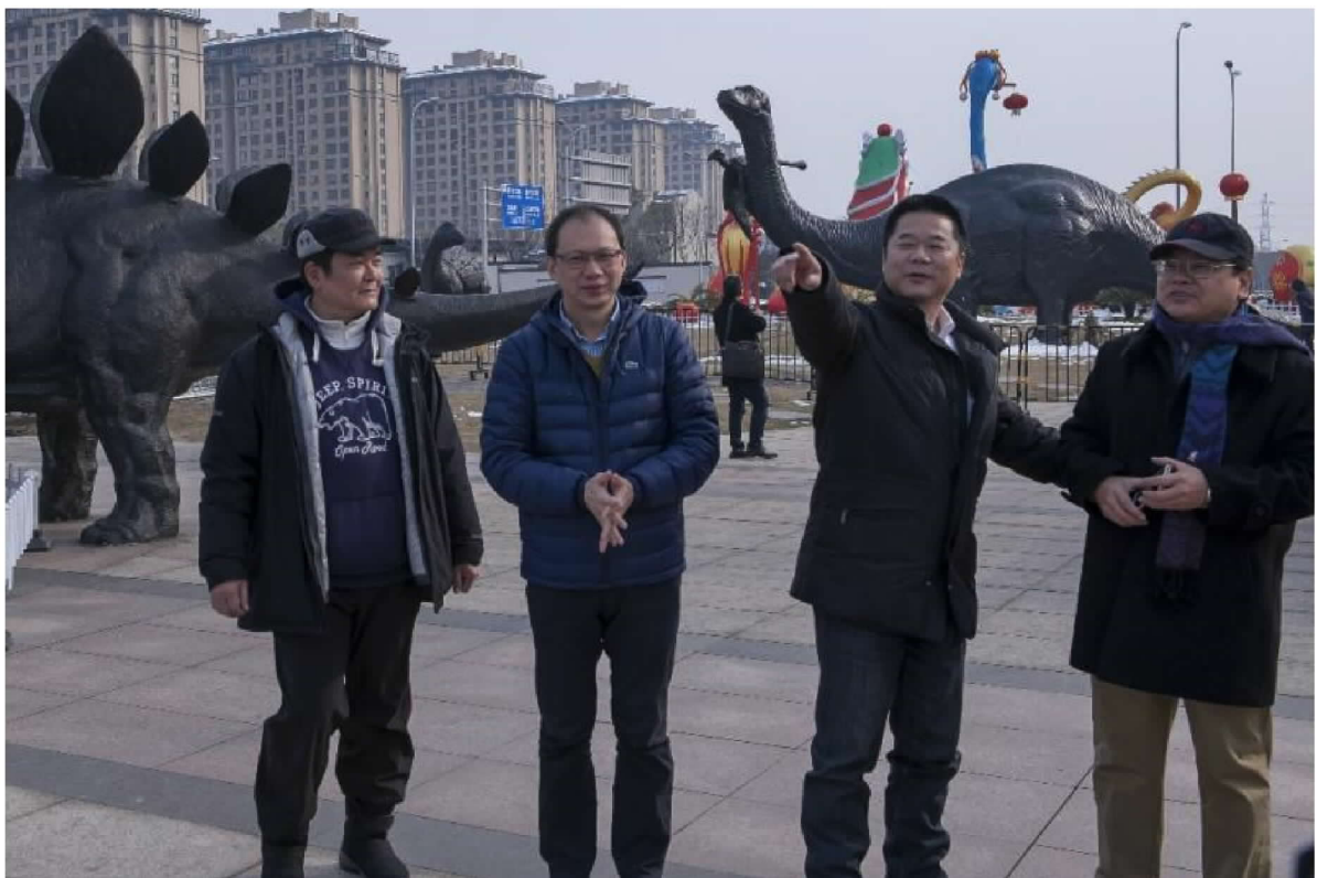
2018 臺灣江蘇燈會主辦單位常州市政府說明燈會進度