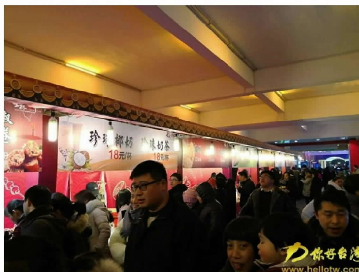
台北士林夜市小吃，首度進駐燈區。