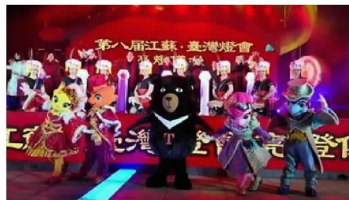
2018台灣江蘇交流燈會閃亮登場。