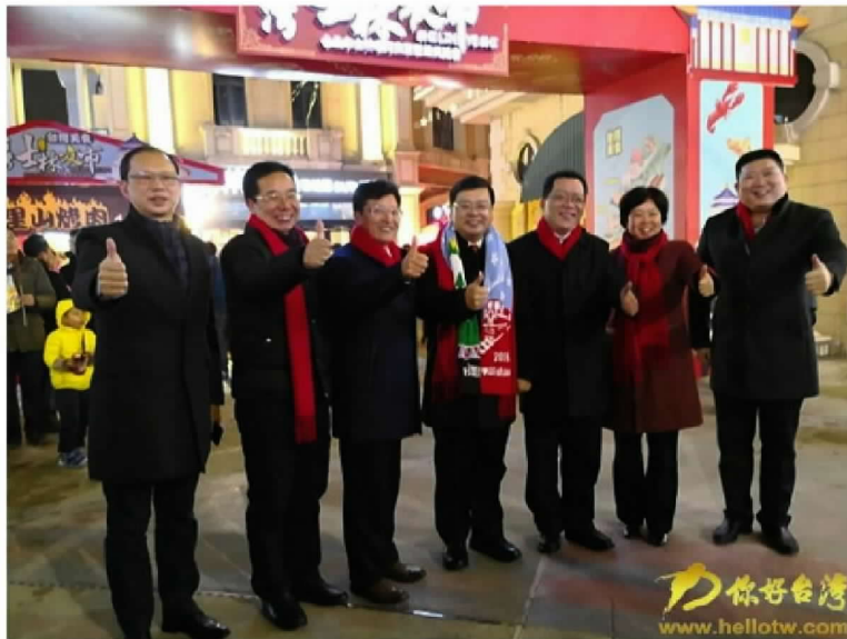
臺旅會北京及上海辦事處也結合組團社，推出“台灣燈會主題遊程”。

記者了解到，臺旅會上海辦事處也針對即將赴臺感受賞燈之旅的大陸游客及主題樂園親子客群進行了微信推送及提供宣傳折頁。臺旅會上海辦事處主任李嘉斌表示，除熱情歡迎大陸朋友赴臺賞燈，第 8 屆“台灣江蘇交流燈會”也可圈可點、值得觀賞，本屆活動再次選定於江蘇常州“恐龍城迪諾水鎮廣場”舉辦，周邊的南京、無錫、蘇州及上海等民眾都可在 1 小時高鐵車程內前來賞燈遊玩、品台灣美食。