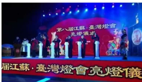
2018台灣江蘇交流燈會閃亮登場。

為宣傳台灣燈會活動，台灣海峽兩岸觀光旅遊協會自2010年起與人文薈萃的江蘇進行「台灣江蘇交流燈會」，今年已邁入第8屆，本屆活動再次選定江蘇常州「恐龍城迪諾水鎮廣場」舉辦，周邊的南京、無錫、蘇州及上海等客源市場都在1小時高鐵車程內，可以有效吸引更多潛在客群前來觀賞。