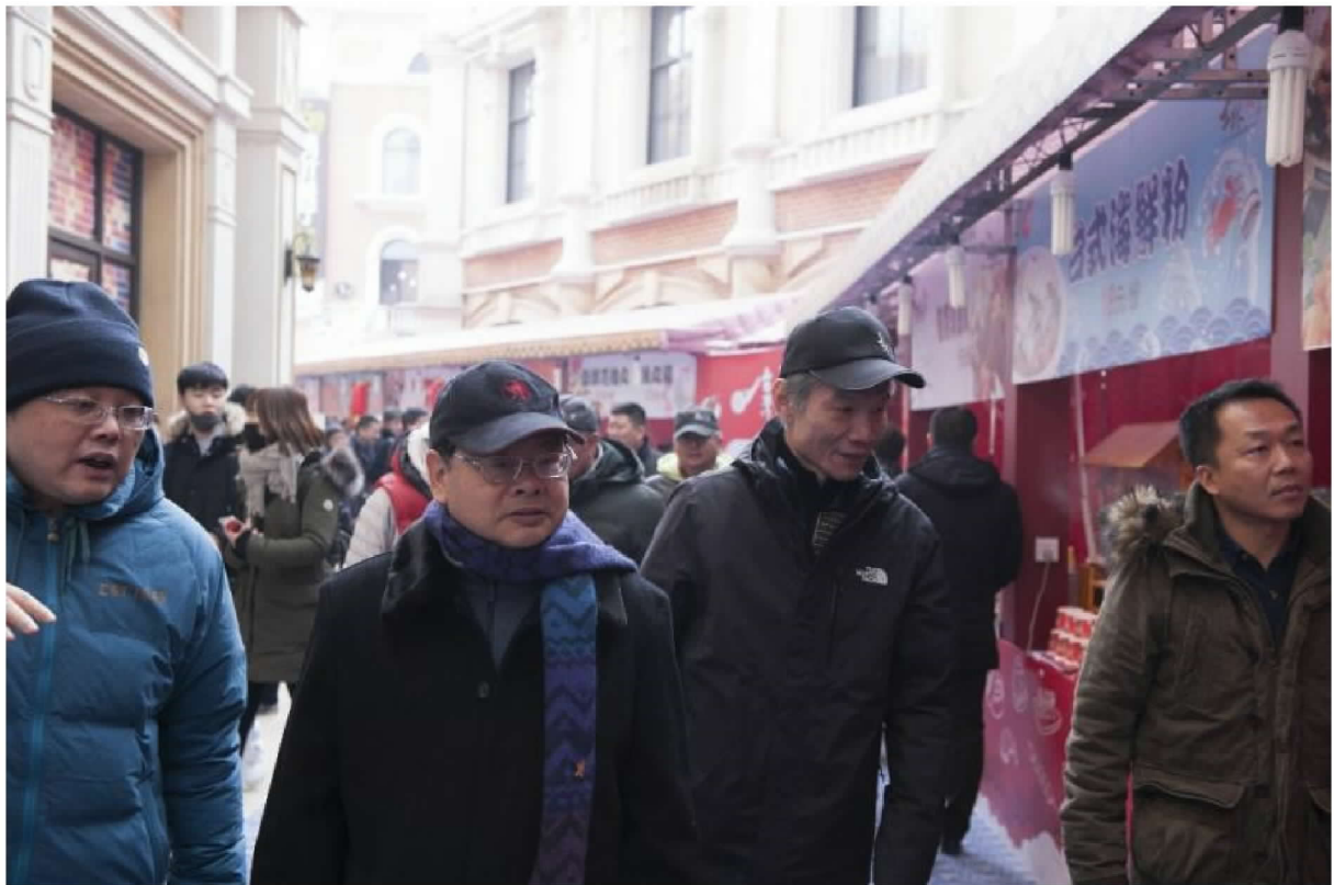
視察士林夜市攤位區慰勉工作人員