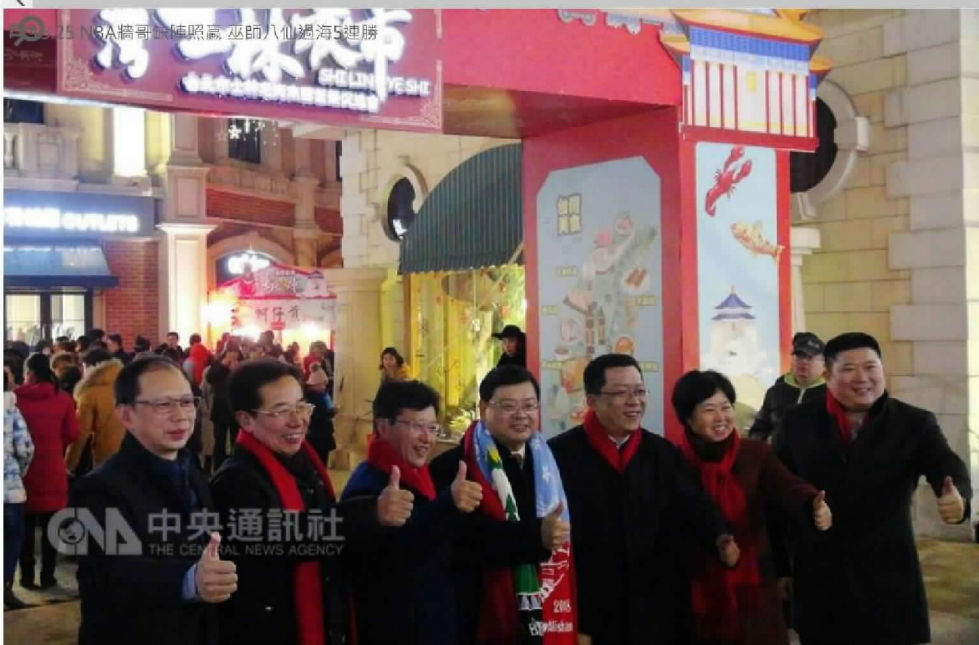
第8屆「台灣江蘇交流燈會」2日點燈，交旅部觀光局副局長、台旅會副會長張錫勳(中)表示，燈會現場獻士林夜市攤商，宣傳台灣美食與自由行。 107年2月2日

「2018台灣燈會」將在3月2日至3月11日於嘉義太保縣府廣場至故宮南院舉辦。台旅會表示，為歡迎中國大陸民衆赴台灣欣賞台灣燈會，台旅會北京及上海辦事處結合組團社推出「台灣燈會主題遊程」，體驗台灣燈會魅力。(編輯：馮毅) 1070202