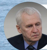
MIKHAIL PLESHKIN , Deputy Director, Department of Energy, Eurasian Economic Commission