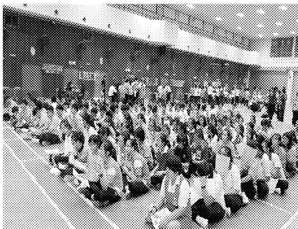
第五場招生宣導說明會實況