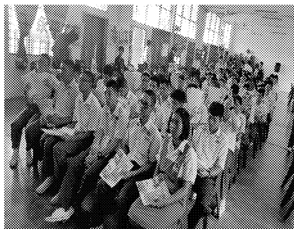
第四場招生宣導說明會實況