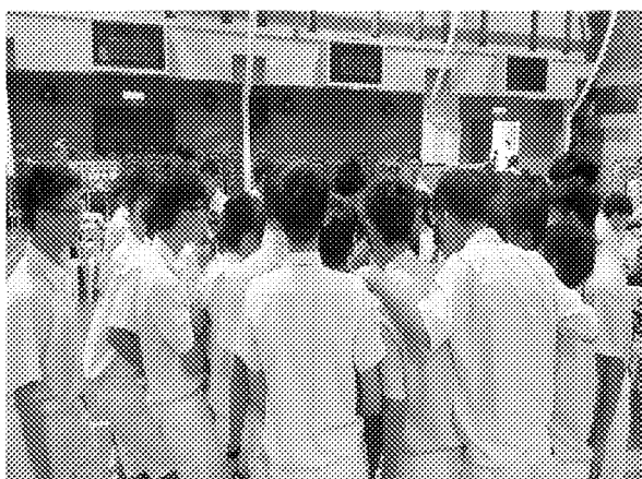
第三場招生宣導說明會實況