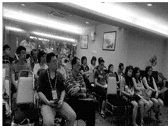
第十場招生宣導說明會實況