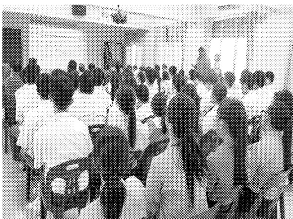
第九場招生宣導說明會實況