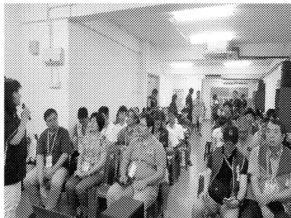
第八場招生宣導說明會實況