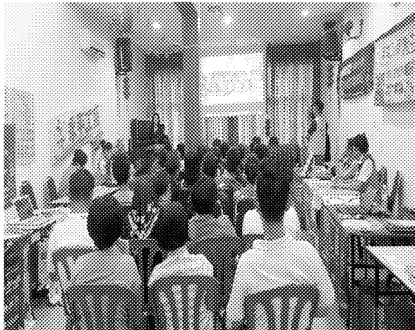
第一場招生宣導說明會實況