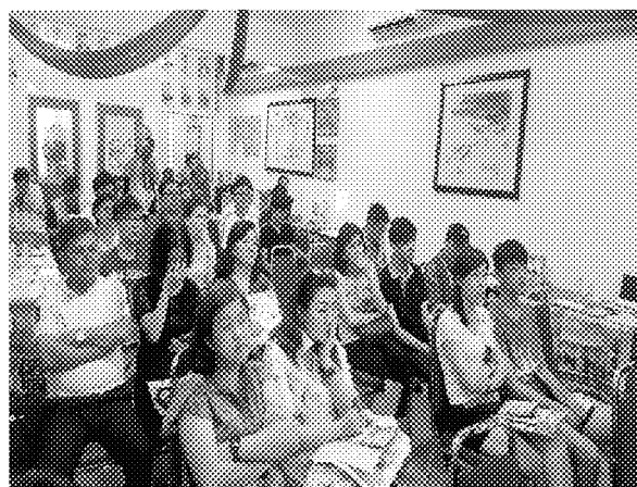
第六場招生宣導說明會實況