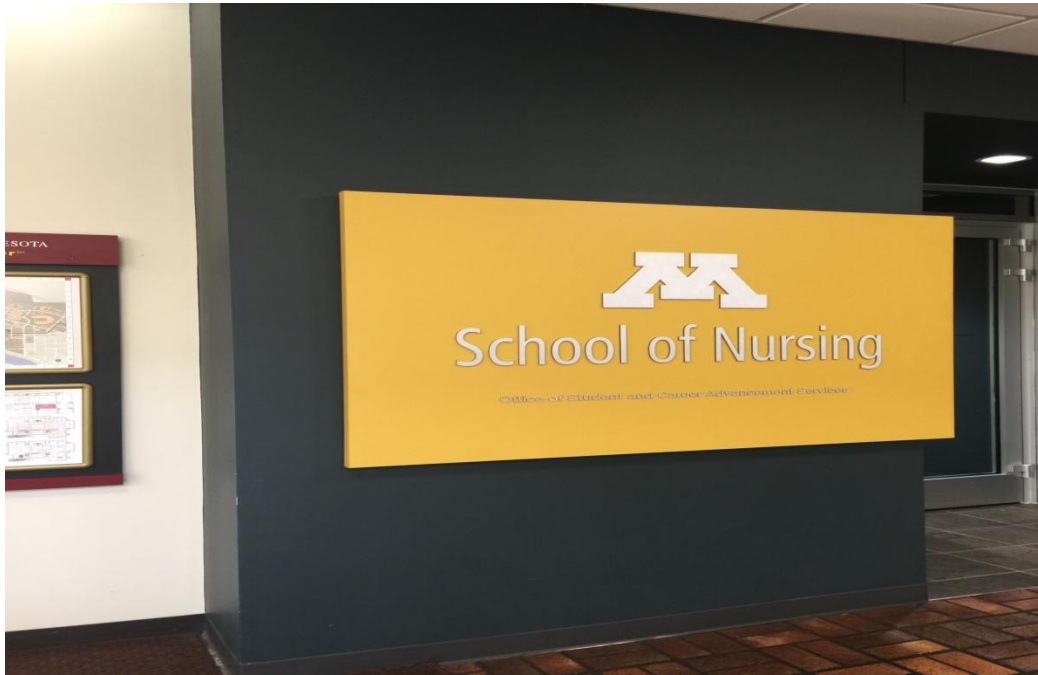
明尼蘇達大學護理學院