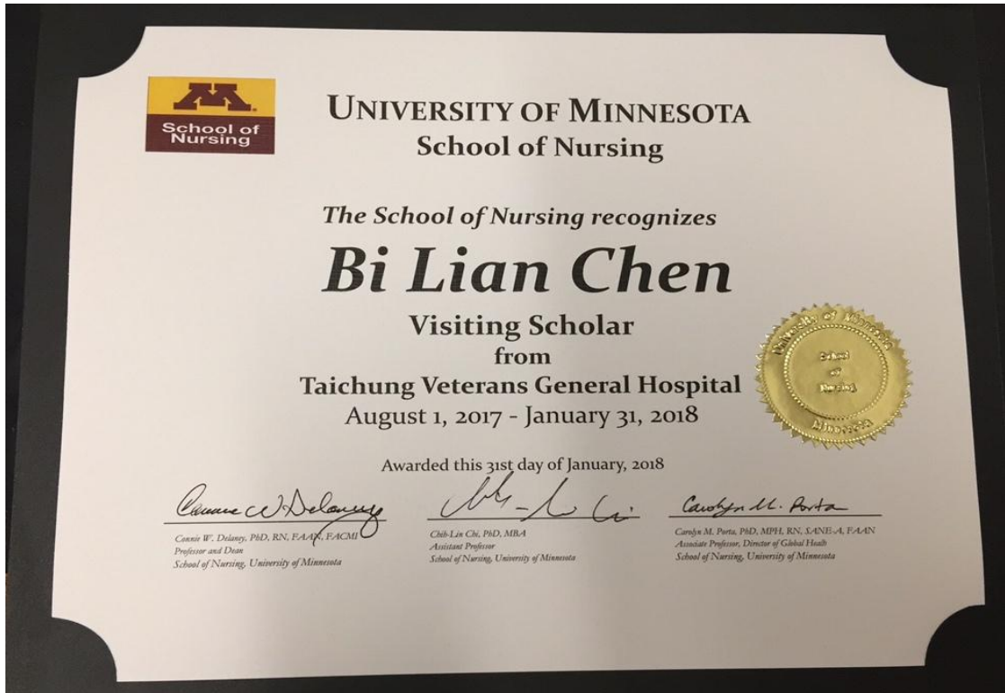
明尼蘇達大學護理學院之訪問學者認證