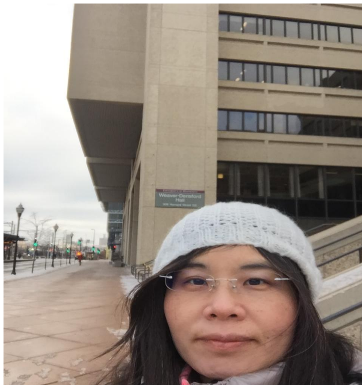
明尼蘇達大學護理學院外觀