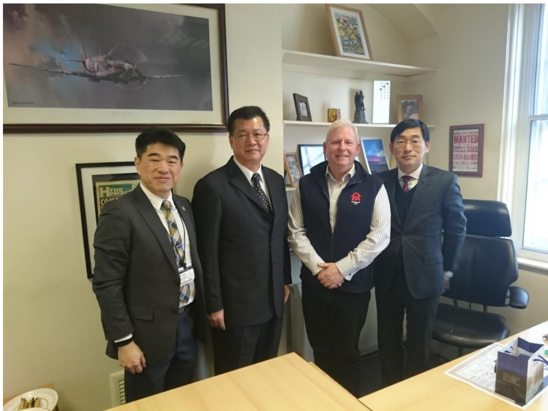
楊主秘與英國退伍軍人援助協會執行長合影