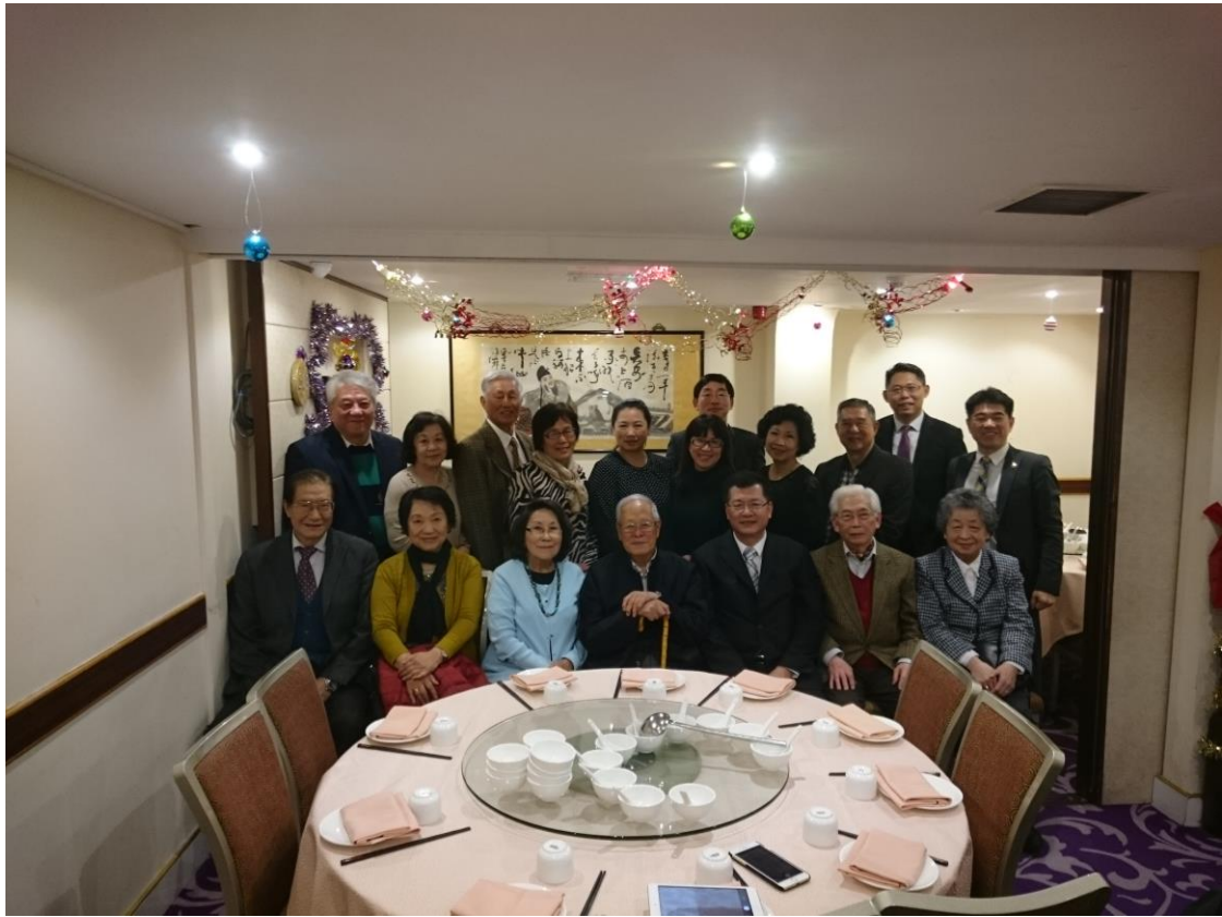
楊主秘與英國榮光會夏體鏘理事長(前排中)及榮光會資深代表合影