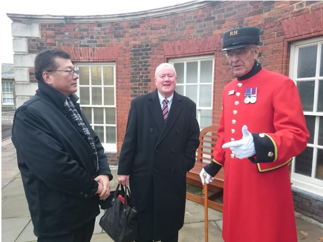
楊主秘拜會英國陸軍榮民之家並聽取榮民簡介