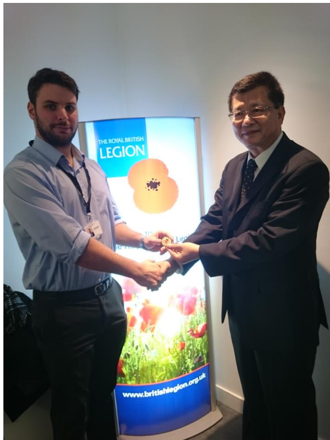
楊主秘致贈紀念品感謝英國皇家軍團退伍軍人協會接待