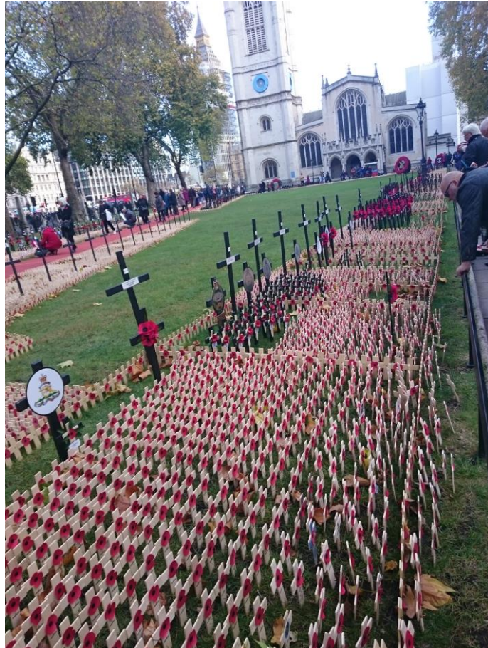
倫敦各地草坪插滿緬懷為國捐軀軍人的罌粟花(11月11日全國同步舉行)