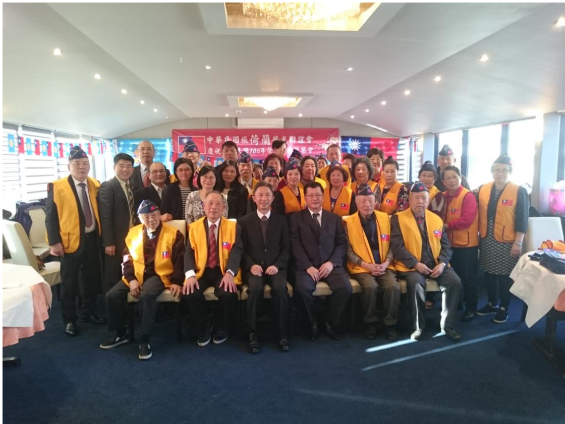
楊主秘與駐荷蘭代表處周台竹代表及榮光會員代表合影