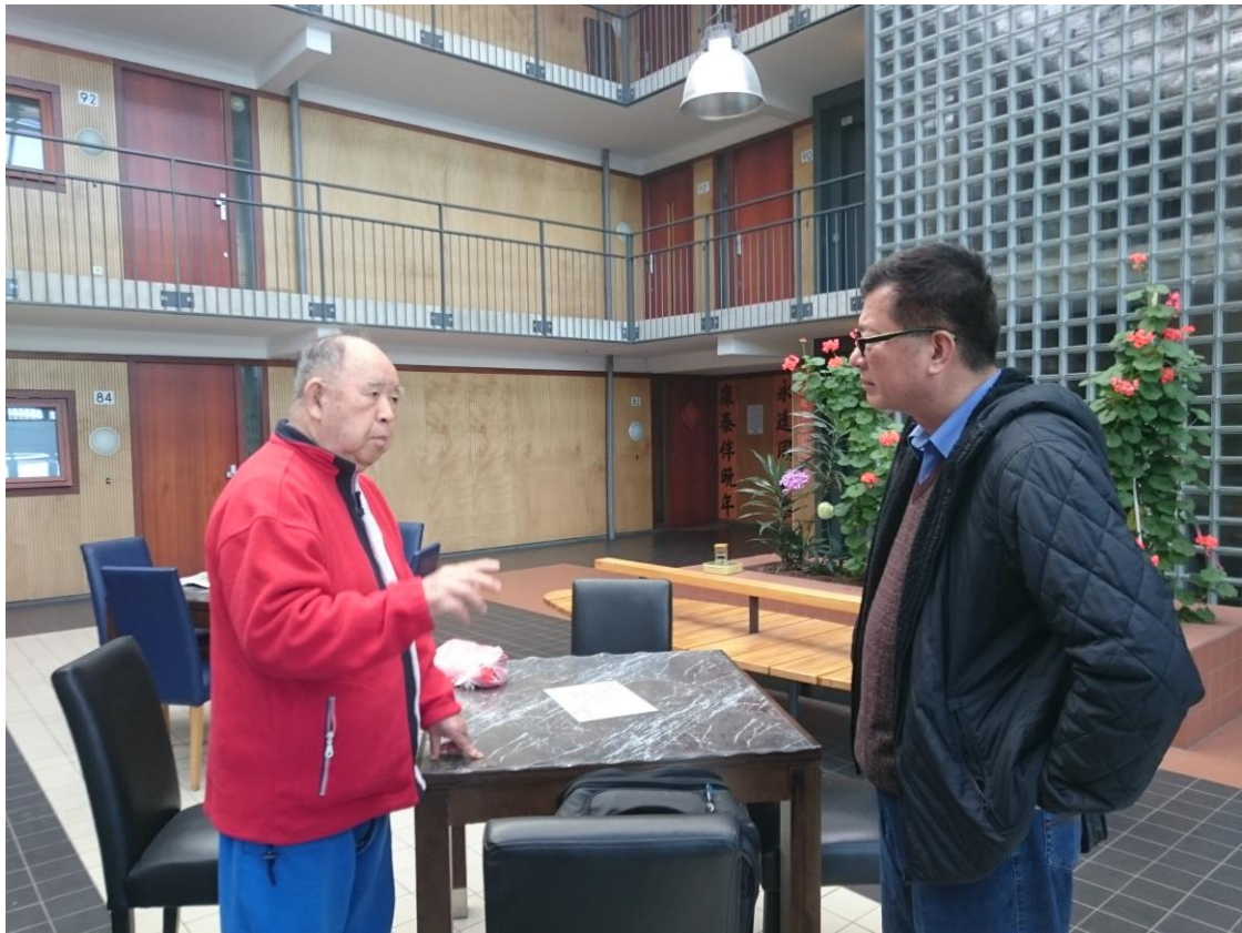
楊主秘赴荷蘭老人公寓探視獨居榮民老前輩(齊正中榮光會創會理事長)