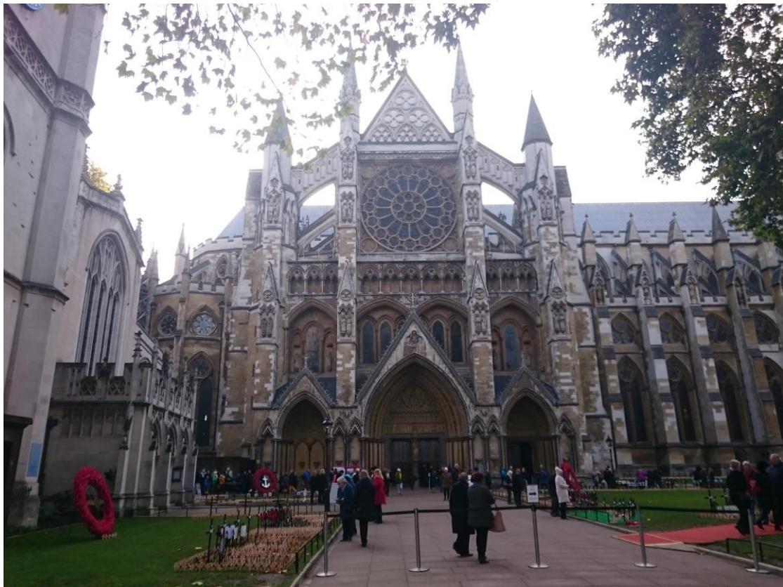
倫敦西敏寺前緬懷為國捐軀軍人之英國人民