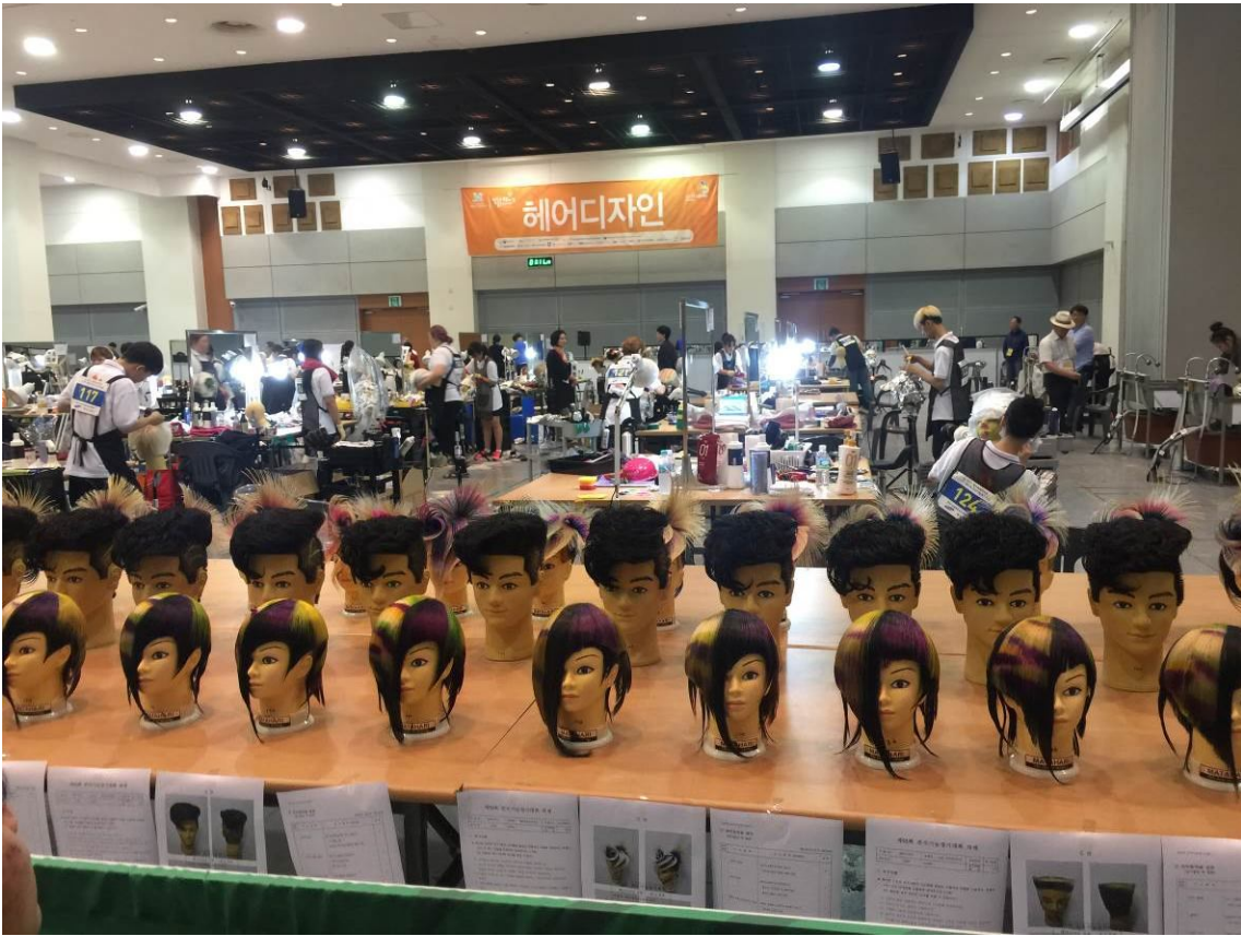
照13 韓國全國技能競賽-美髮職類競賽場