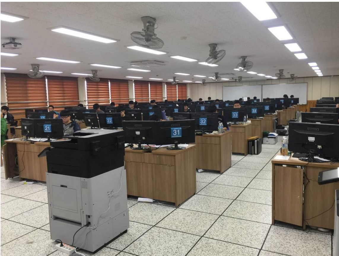
照14 韓國全國技能競賽-資訊類競賽場之一