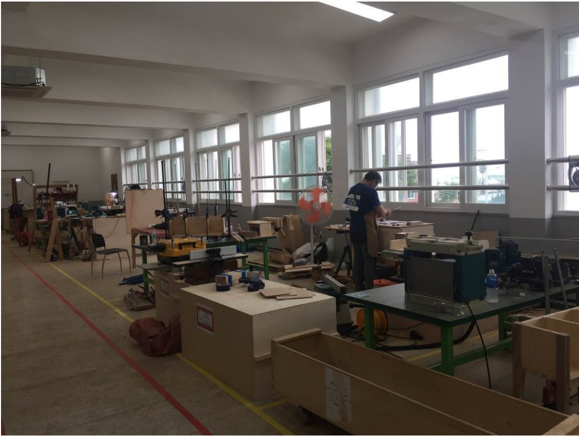
照15 韓國全國技能競賽-木工類競賽場地