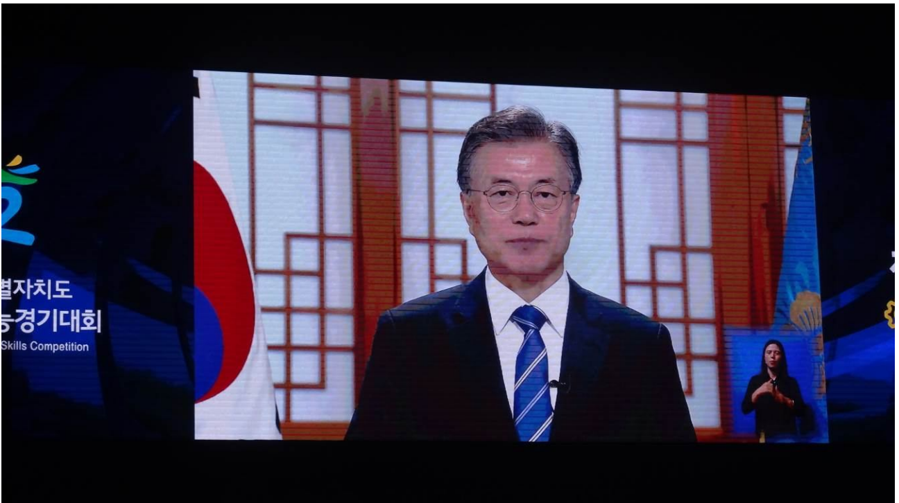
照片6 全國技能競賽開幕典禮邀請韓國總統錄影致詞