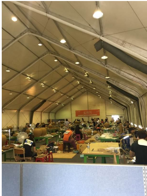
照12 韓國全國技能競賽-陶瓷職類競賽場地