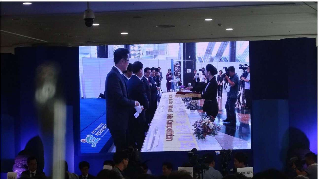
照片2 主辦城市啟動全國技能競賽儀式