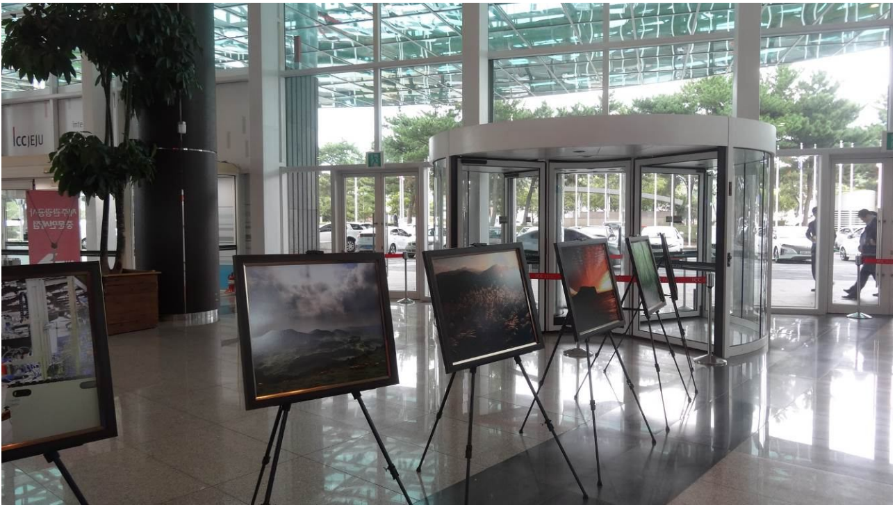
照片3 韓國全國技能競賽周邊活動-當地風景及參加國際賽相片回顧展