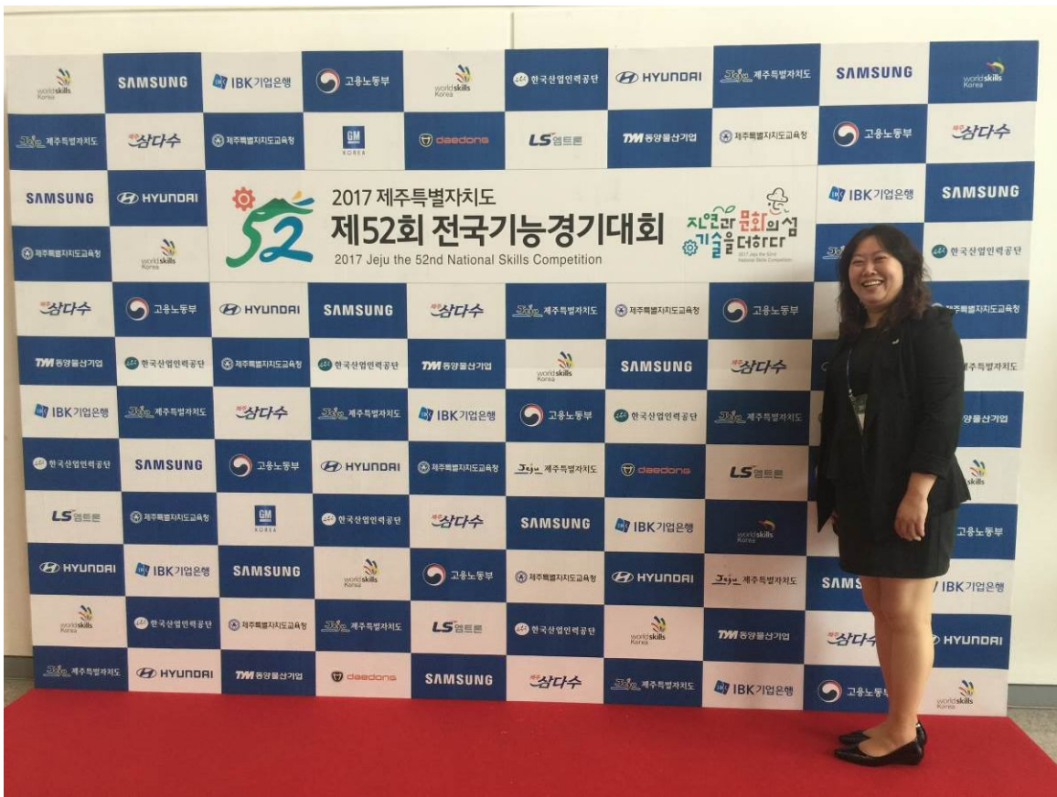
照片10 韓國全國技能競賽為所有贊助廠商設置之統整看板