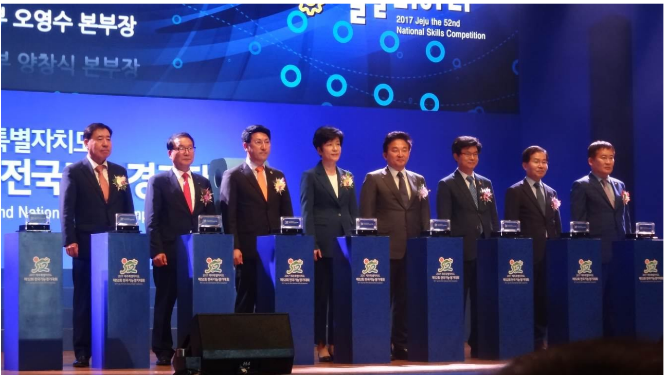
照片8 韓國全國技能競賽開幕典禮邀請貴賓上台啟動儀式，右二為韓國正代表，左一為韓國技術代表，左四為韓國就業及勞動部部長。