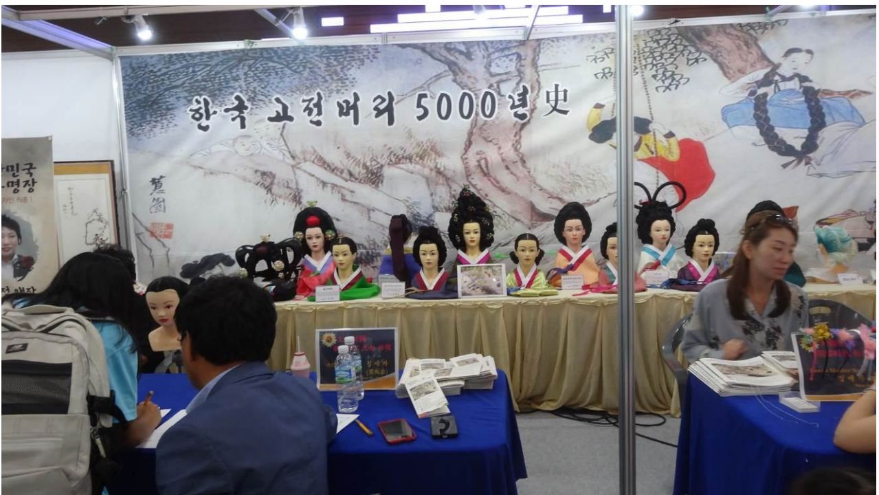
照片4 韓國全國技能競賽周邊活動-邀請知名工匠設攤展出吸引民眾重視技能