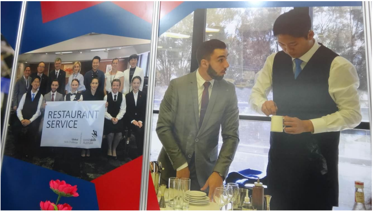
照片5 競賽期間同時邀請即將參加國際技能競賽餐飲服務職類國手表演