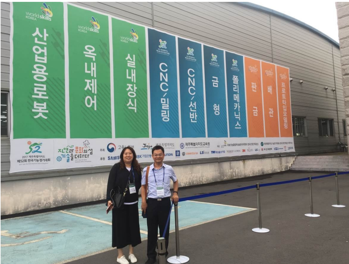
照16 韓國全國技能競賽-競賽場外競賽職類海報