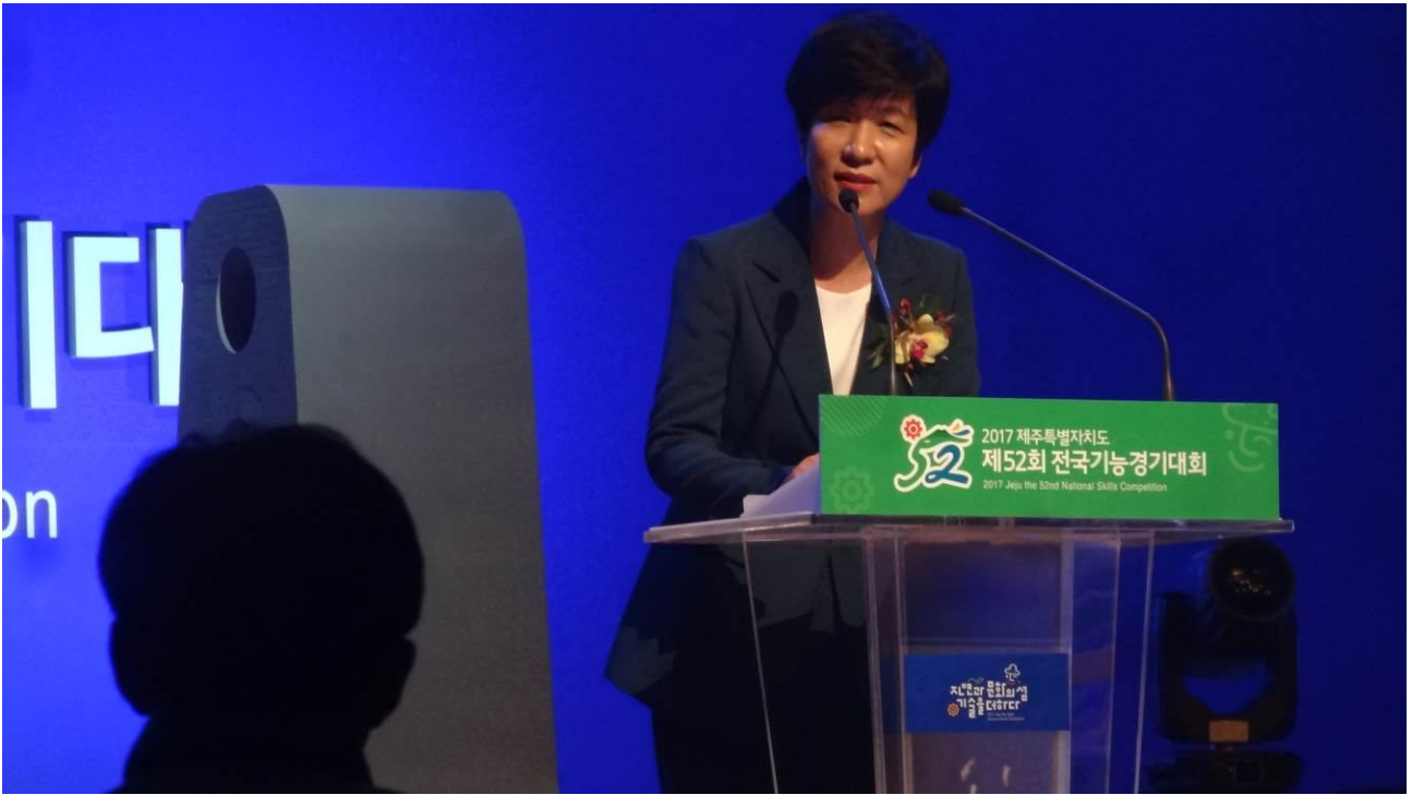
照片7 韓國就業及勞動部長出席全國技能競賽開幕典禮致詞