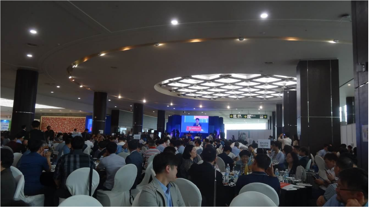
照片1 韓國全國技能競賽開始前，主辦城市市長接待裁判人員餐會。