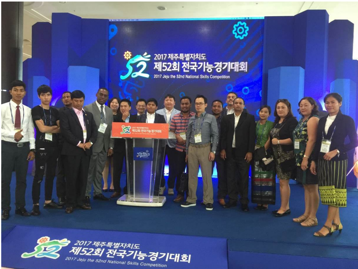
照片9 受邀觀摩參訪韓國全國技能競賽外賓合影