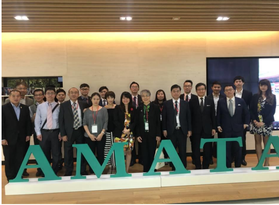
圖 3：訪問團參訪 AMATA 工業區(3)