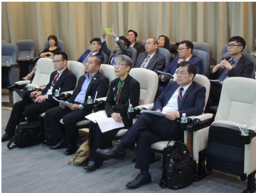
圖 2：訪問團參訪 AMATA 工業區(2)