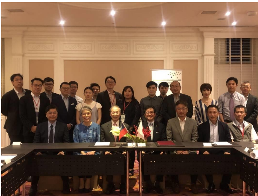
圖 15：全國企業總會與日立先端簽署合作備忘錄(1)