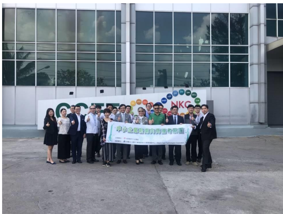
圖 20：訪問團拜會泰金寶