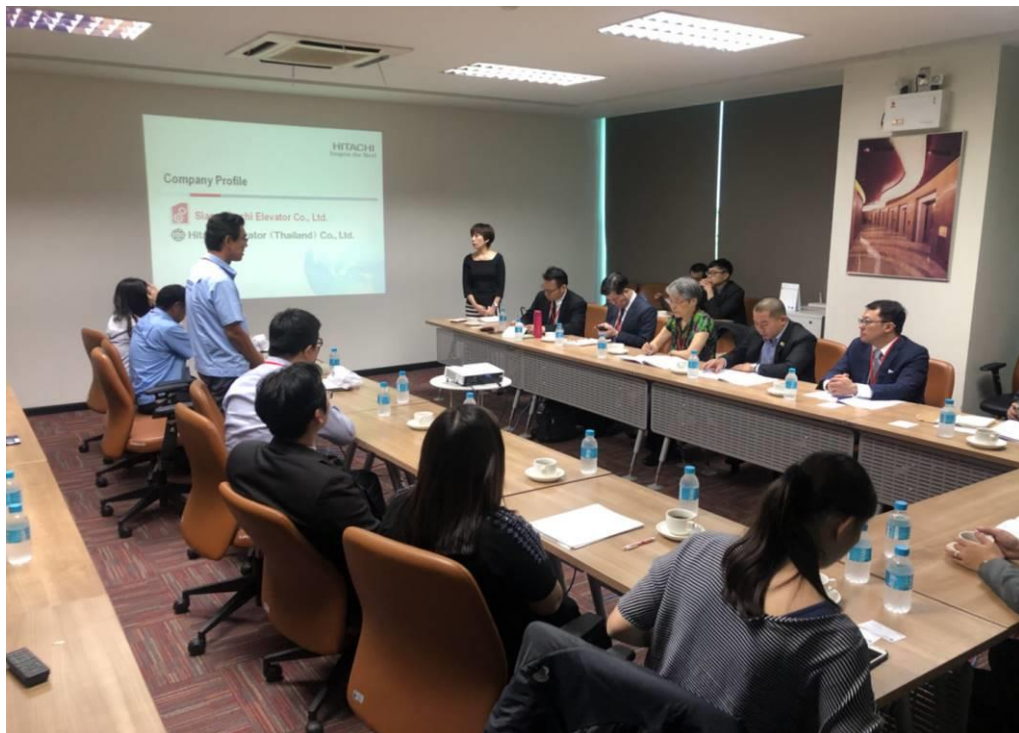
圖 10：訪問團拜會 Siam Hitachi Elevator(1)