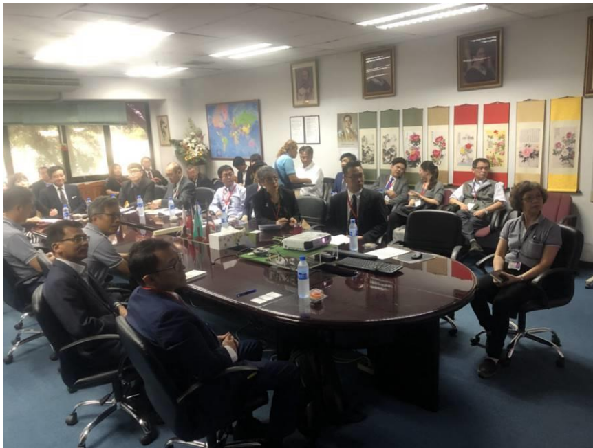
圖 8：訪問團拜會大同泰國工廠(1)