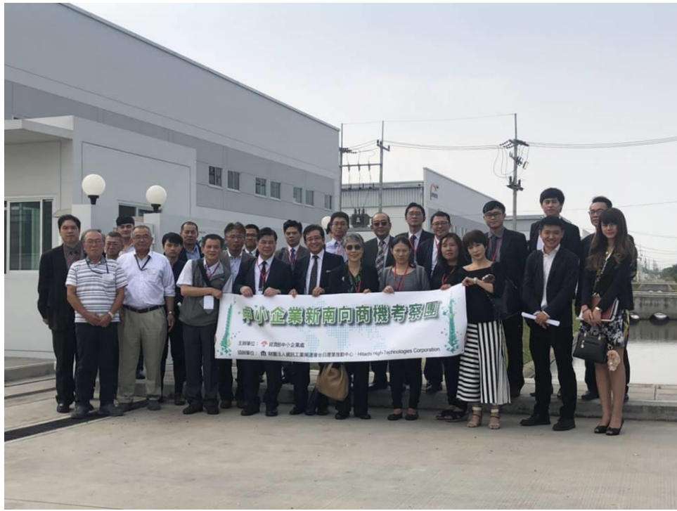
圖 7：日立共享工場參訪(4)