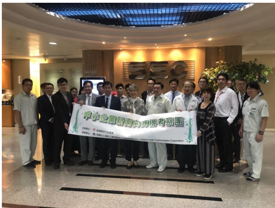
圖 19：訪問團拜會 SEC