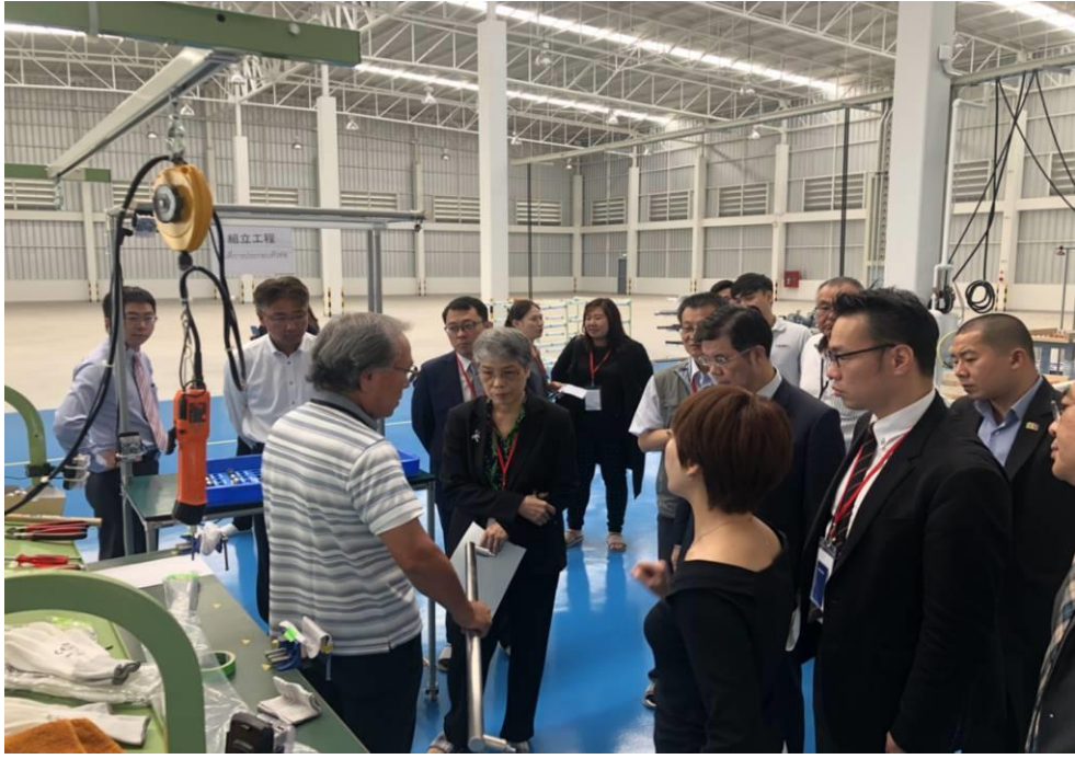
圖 5：日立共享工場參訪(2)