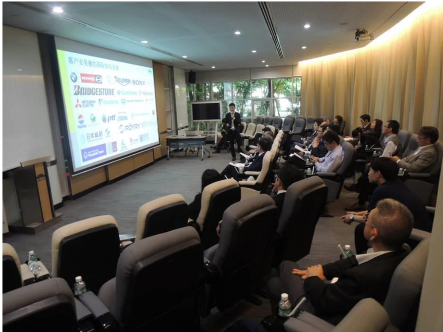
圖 1：訪問團參訪 AMATA 工業區(1)