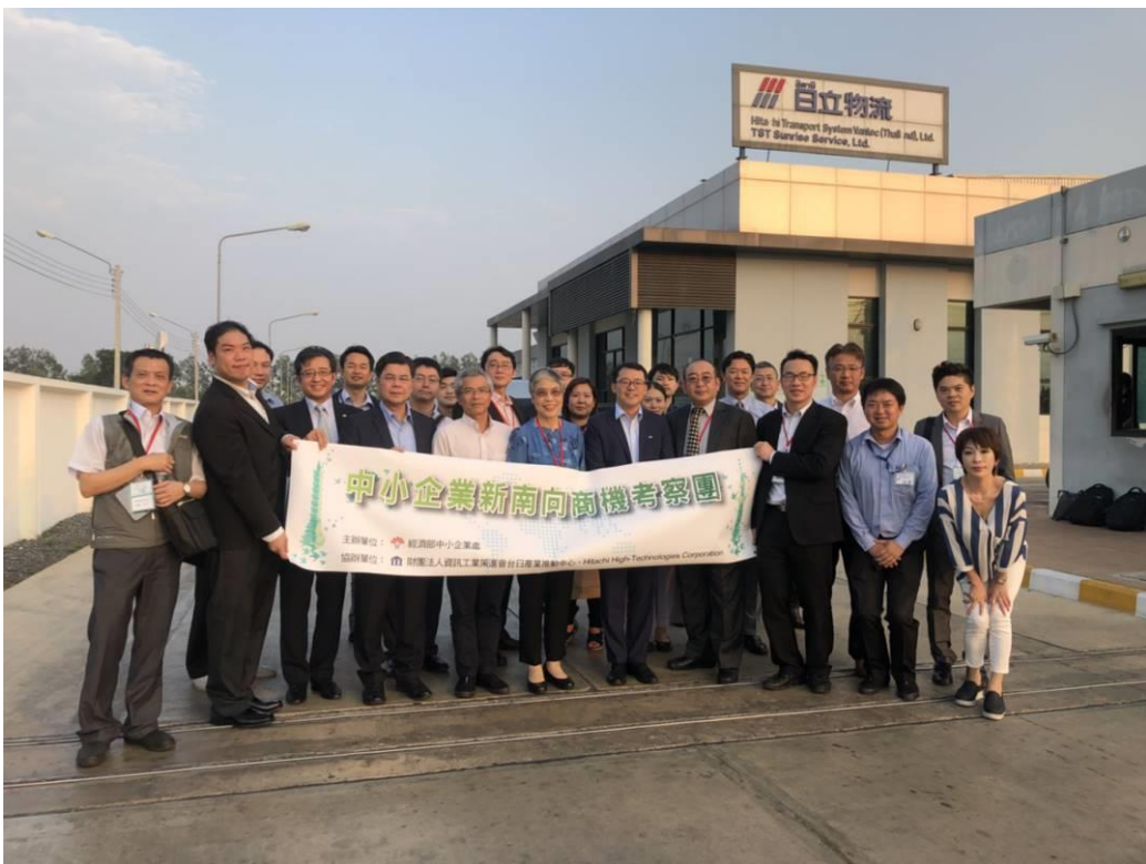
圖 14：訪問團拜會日立物流