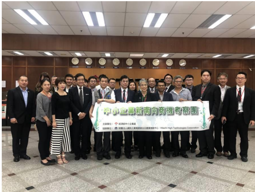
圖 9：訪問團拜會大同泰國工廠(2)