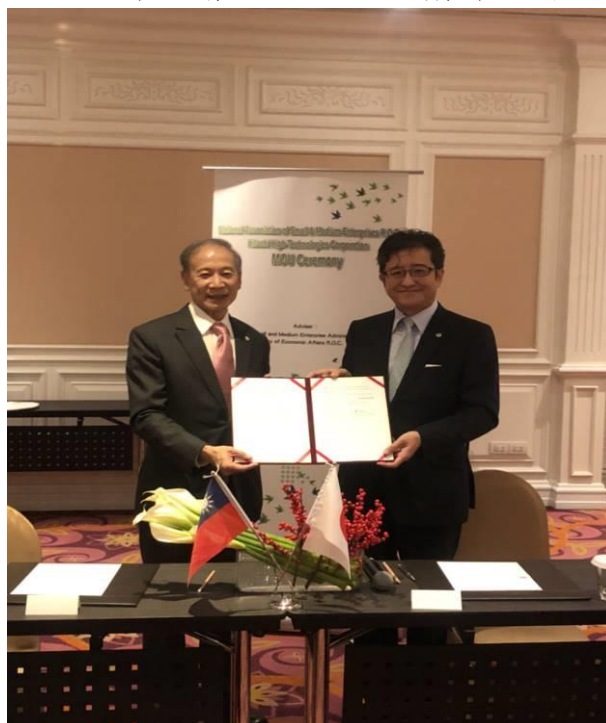
圖 16：全國企業總會與日立先端簽署合作備忘錄(2)