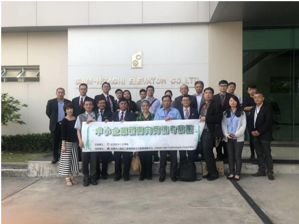
圖 11：訪問團拜會 Siam Hitachi Elevator (2)