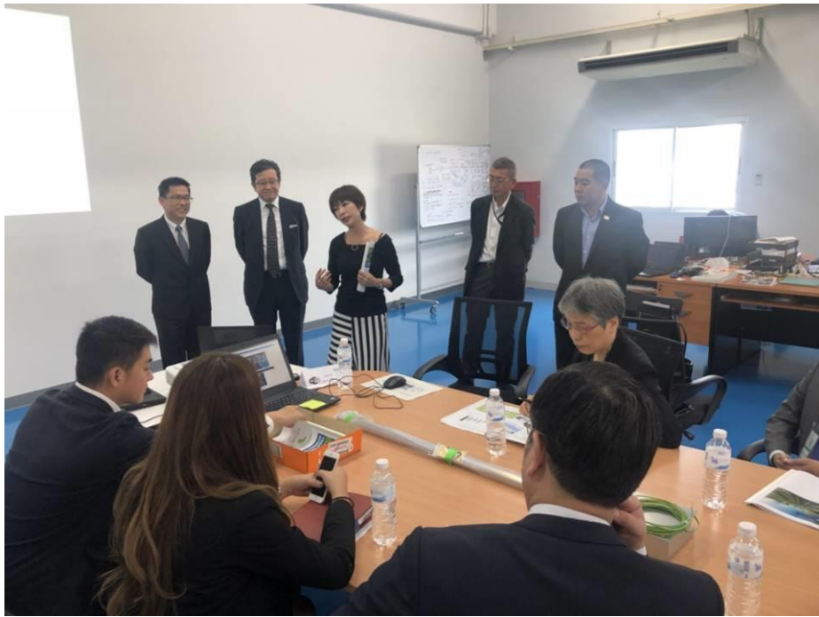
圖 6：日立共享工場參訪(3)