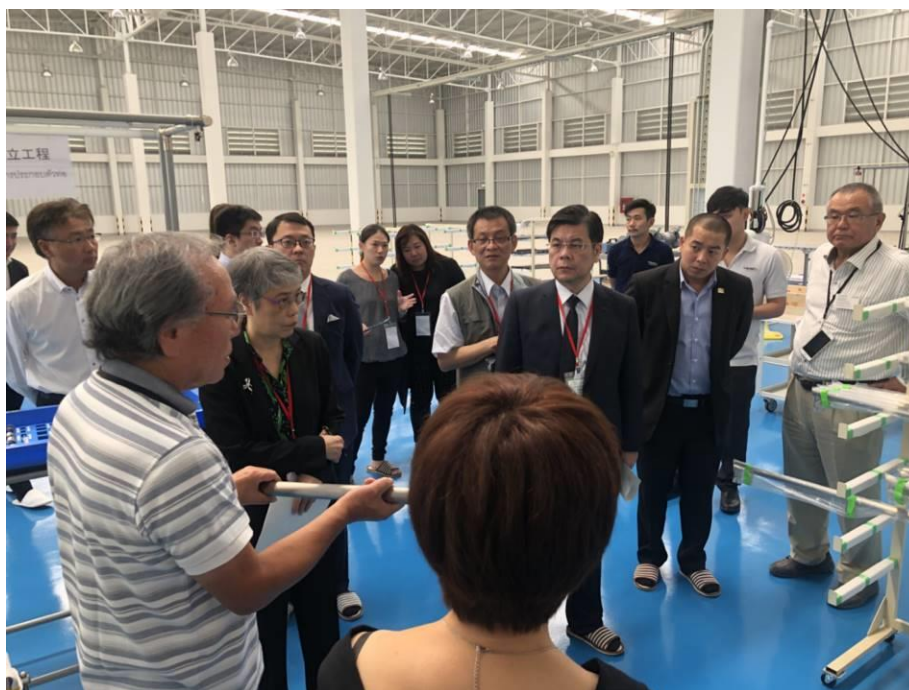
圖 4：日立共享工場參訪(1)