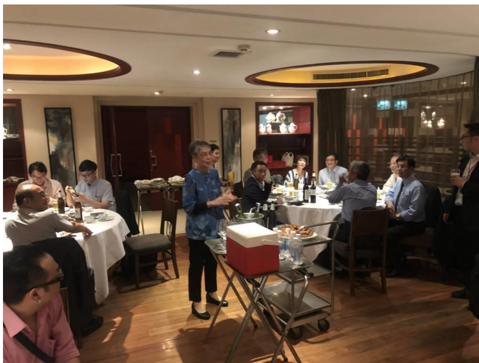
圖 17：台日中小企業新南向商機交流會(1)