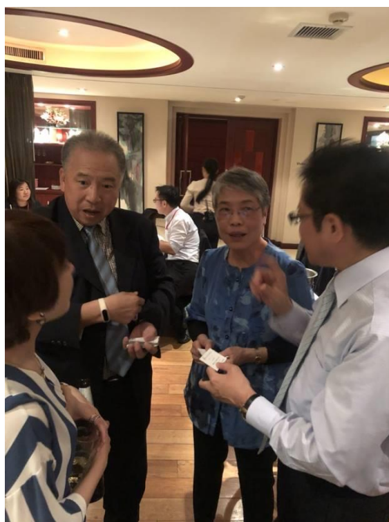
圖 18：台日中小企業新南向商機交流會(2)