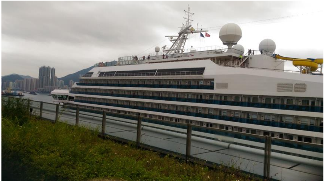
圖 10 哥斯達幸運號郵輪靠泊啟德郵輪碼頭