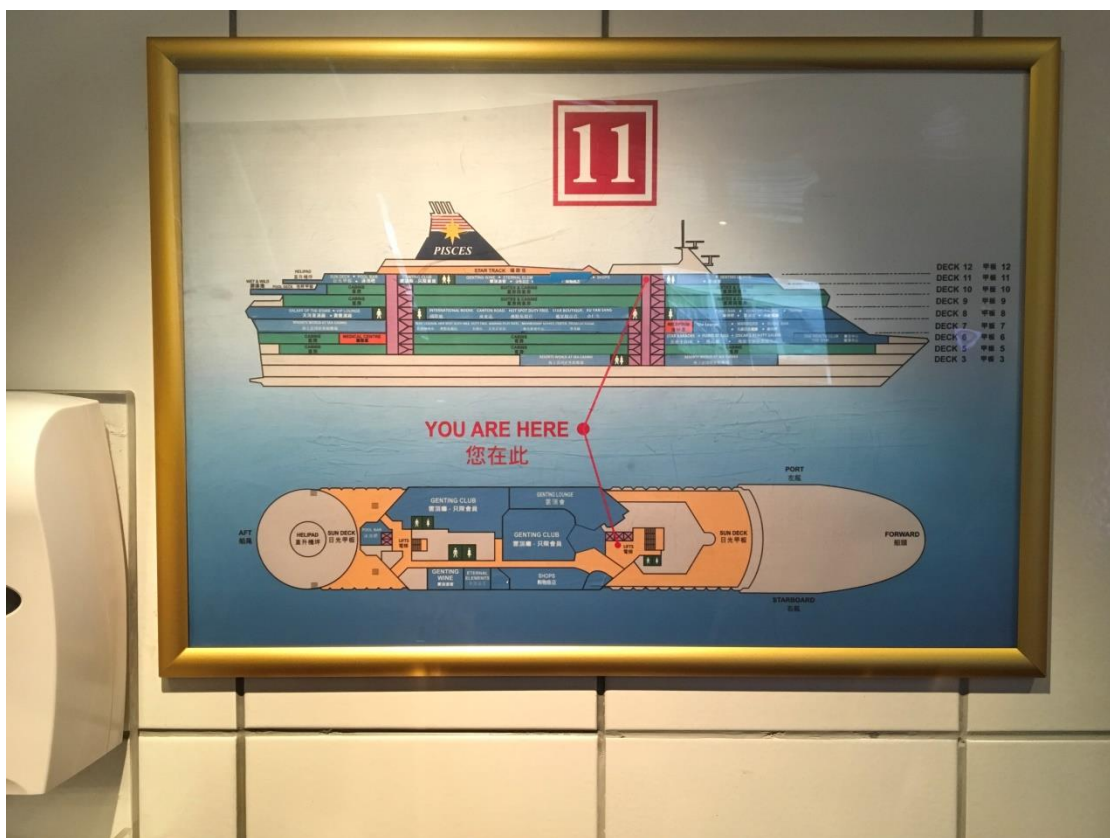
圖 2 會議地點雙魚星號郵輪甲板 11