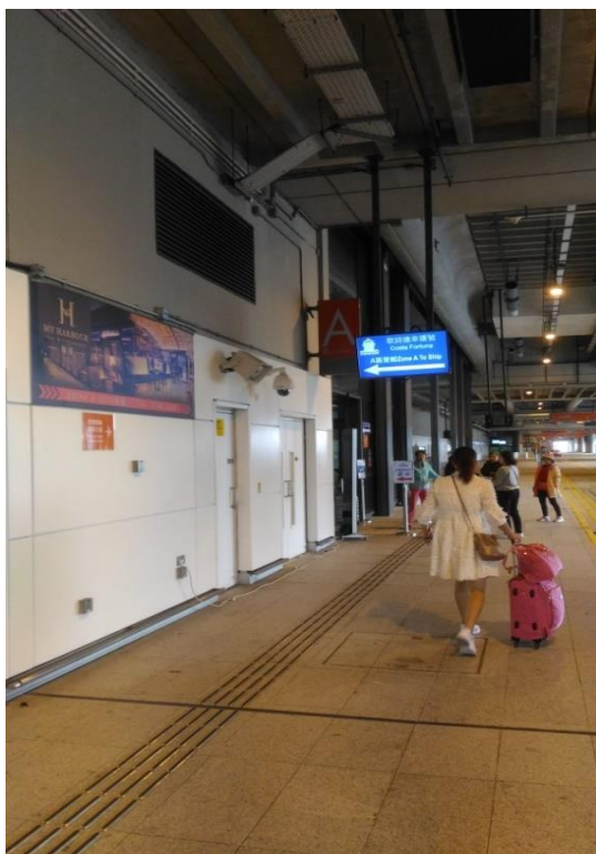
圖 5 啟德郵輪碼頭登船入口