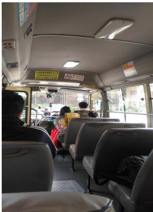
圖 7 至啟德郵輪碼頭 86 號小巴