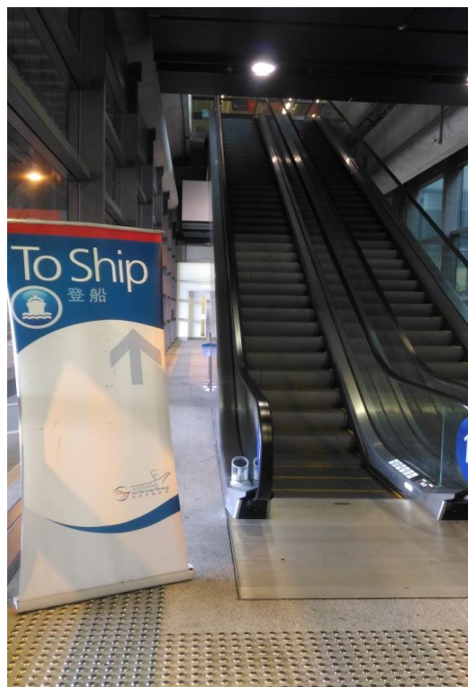
圖 6 啟德郵輪碼頭登船電扶梯