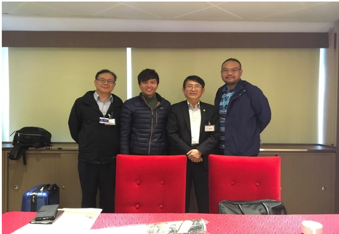
圖 1 麗星郵輪公司與港務公司人員會後留影