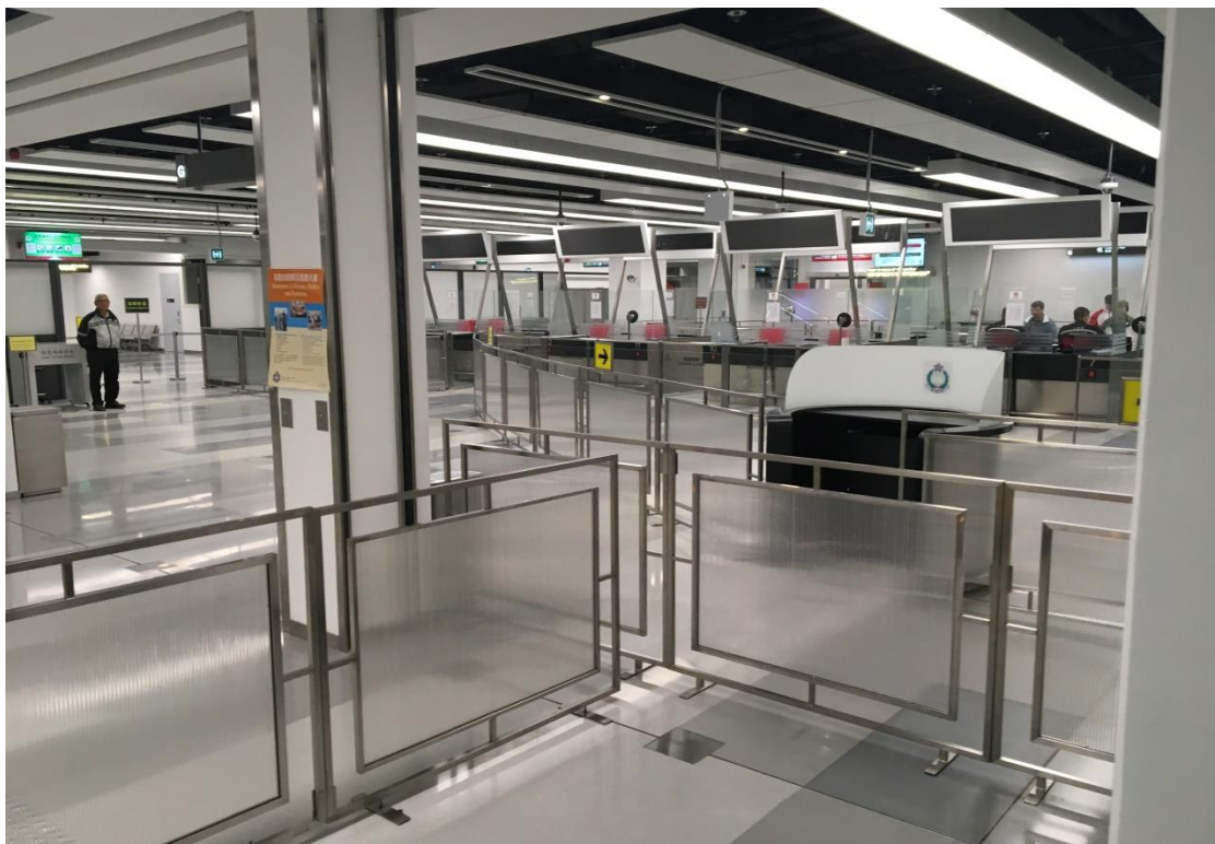
圖 4 海運碼頭郵輪通關設施