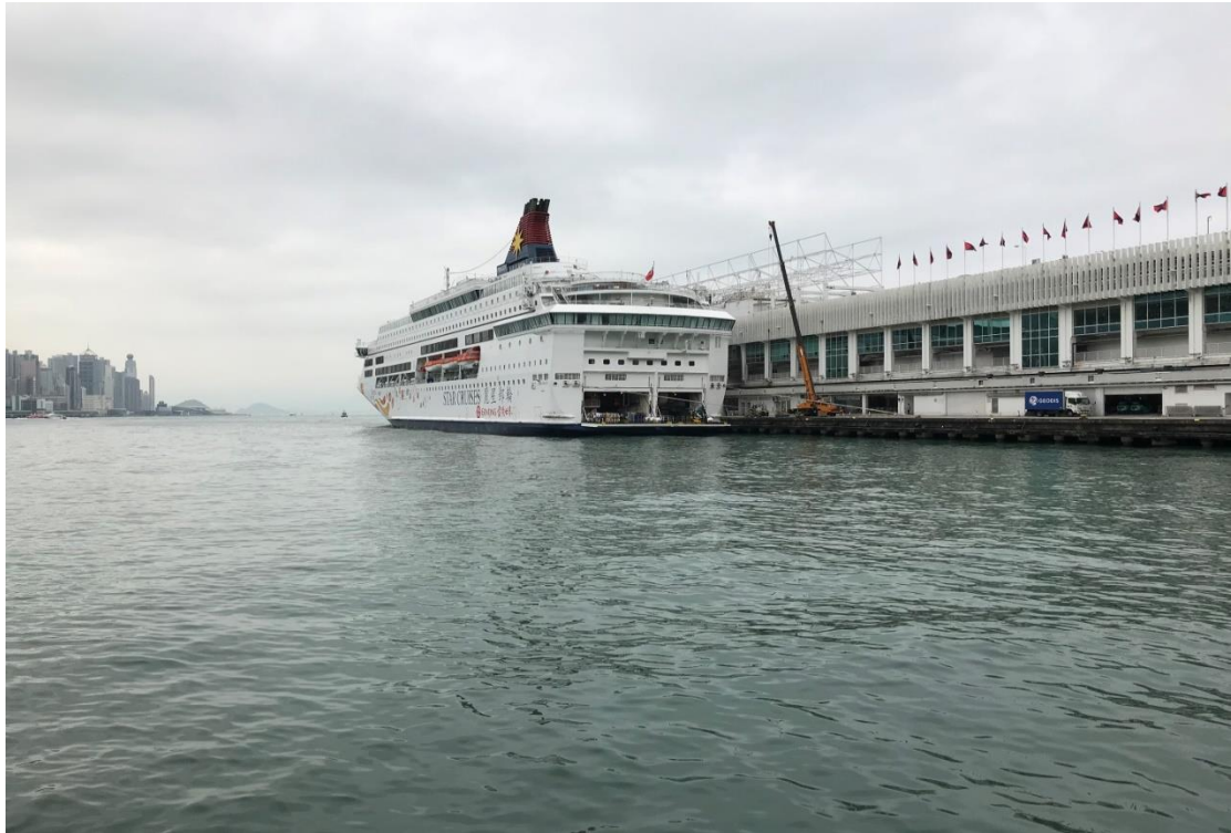
圖 3 雙魚星郵輪靠泊香港尖沙咀海運碼頭