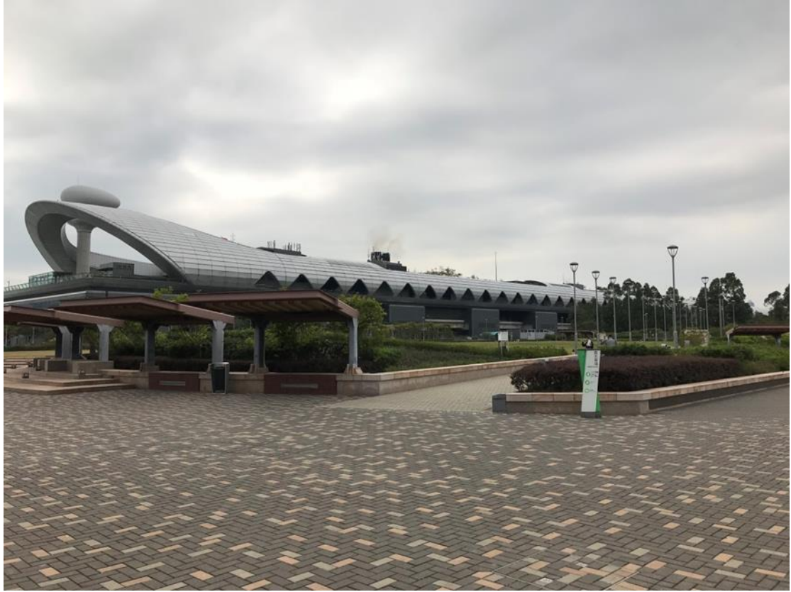
圖 9 啟德郵輪碼頭頂層設有全港最大空中花園