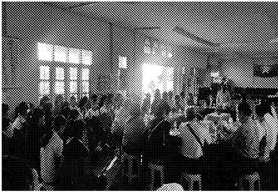
第八場招生宣導說明會實況