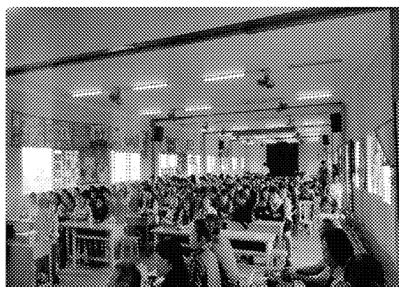
第二場招生宣導說明會實況