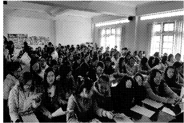
第九場招生宣導說明會實況