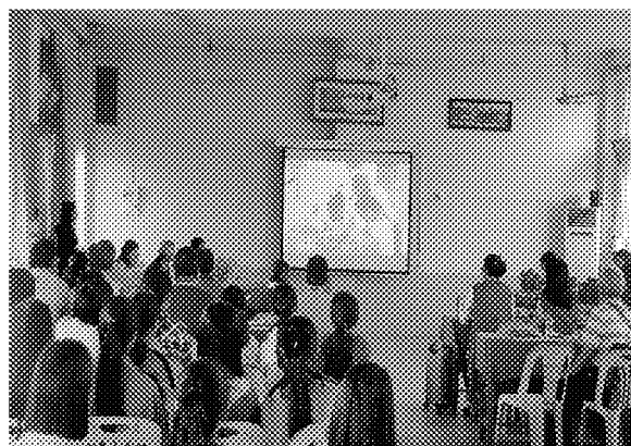
第一場招生宣導說明會實況