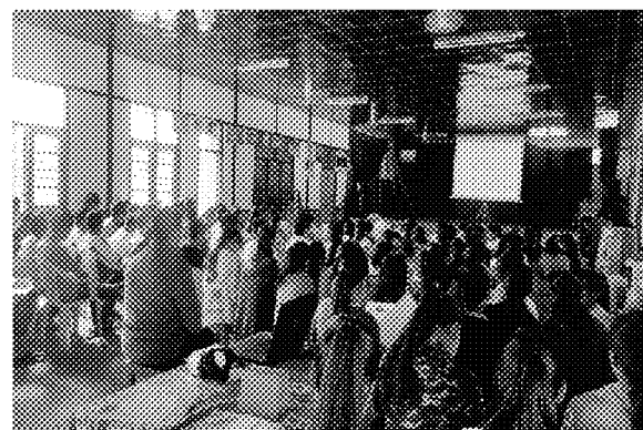
第五場招生宣導說明會實況