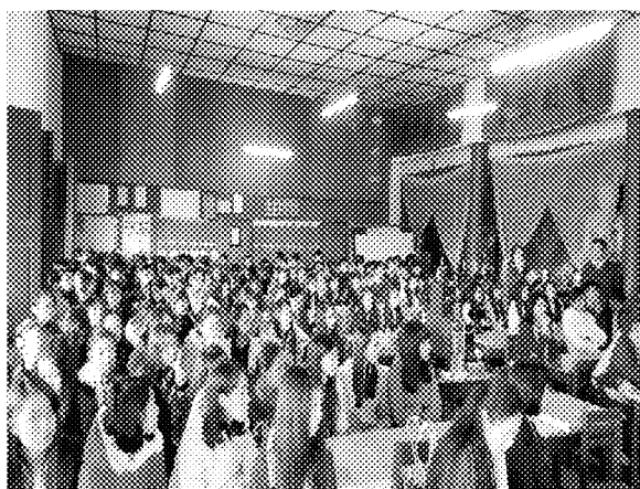
第三場招生宣導說明會實況