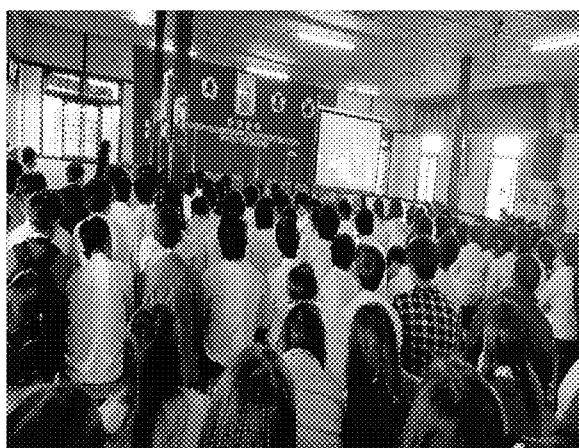
第四場招生宣導說明會實況