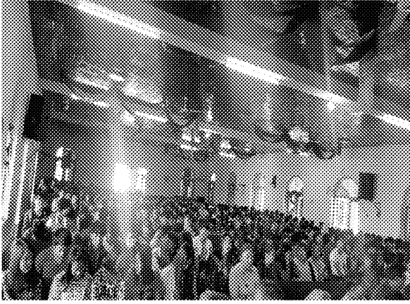
第六場招生宣導說明會實況