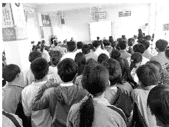
第一場招生宣導說明會實況