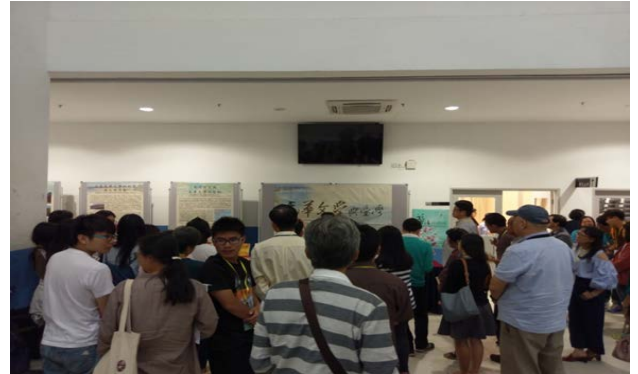
馬來西亞拉曼大學師生踴躍參與情形