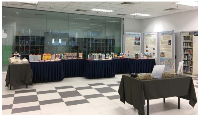
11月27日移展至三樓圖書館展出情形