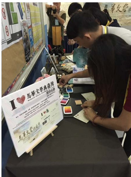
學生踴躍參與「I LOVE 馬華文學與臺灣」DIY 蓋印活動