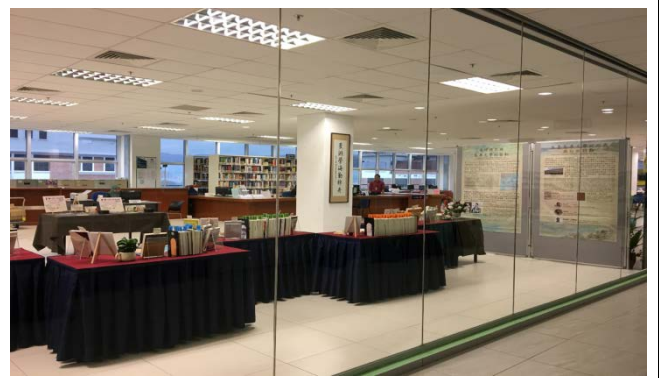
11月27日移展至三樓圖書館展出情形