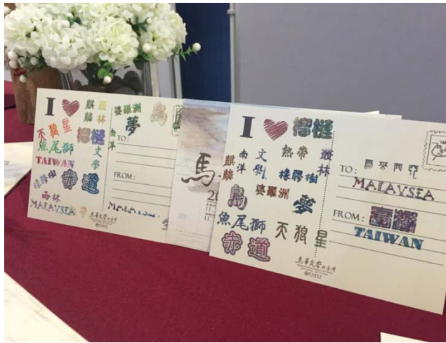
「I LOVE 馬華文學與臺灣」蓋印明信片