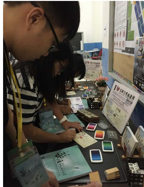
學生踴躍參與「I LOVE 馬華文學與臺灣」DIY 蓋印活動