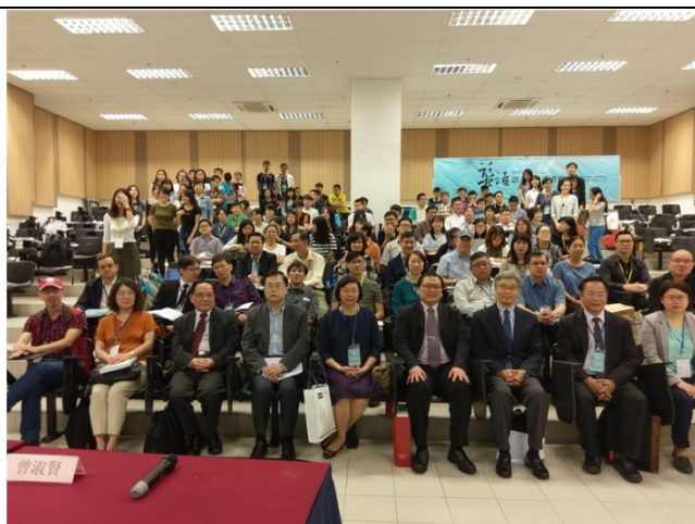
「華語語系南洋書寫」國際研討會嘉賓合影