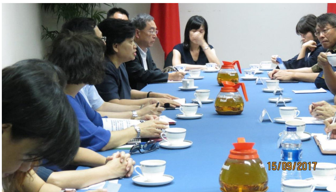
駐印尼代表處座談－印尼