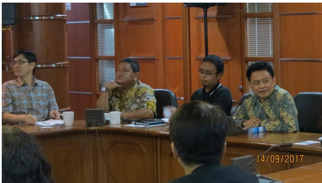
拜會智庫哈比比中心－印尼