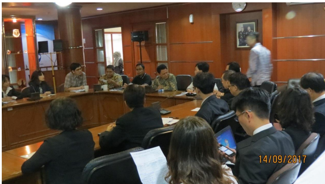
拜會智庫哈比比中心－印尼