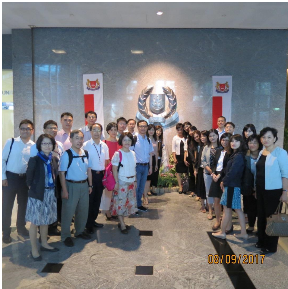
參訪新加坡警察總部—新加坡