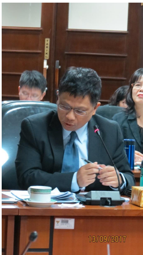
拜會印尼文官學院－印尼