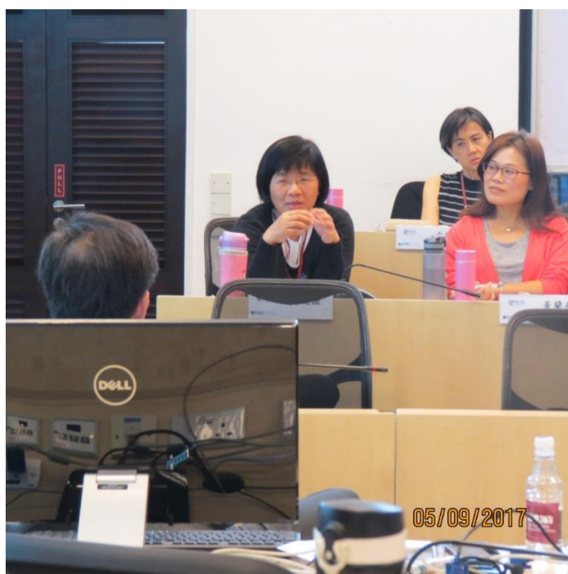
周研究員兼組長瑞淑課堂提問—新加坡