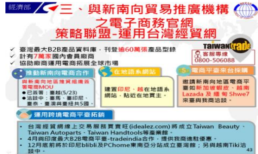
經濟部電子商務推動