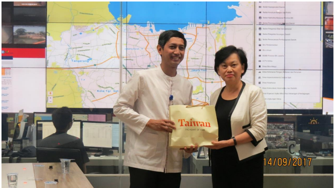
拜會雅加達省政府－印尼