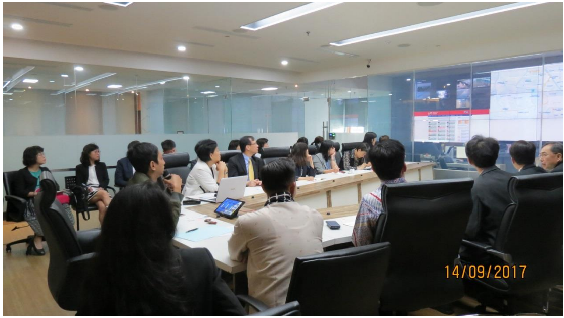
拜會雅加達省政府－印尼