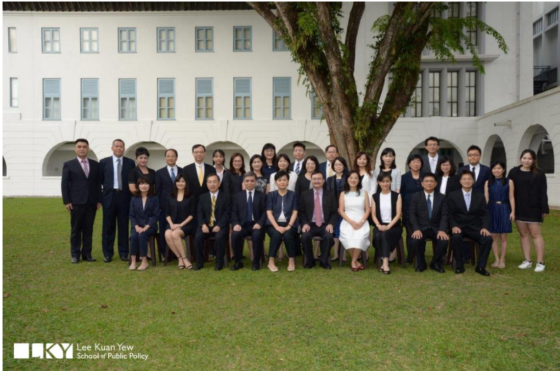
新加坡國立大學李光耀政策學院東南亞國家專題研究班開訓合影—新加坡