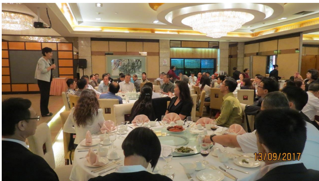
與臺商交流餐會－印尼