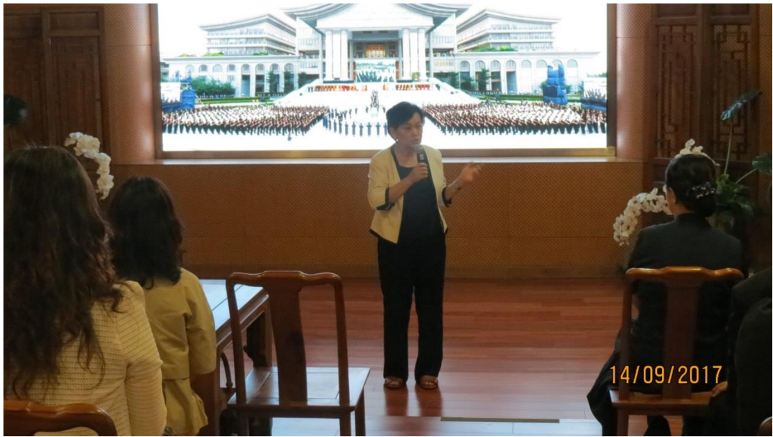
拜會印尼慈濟分會－印尼