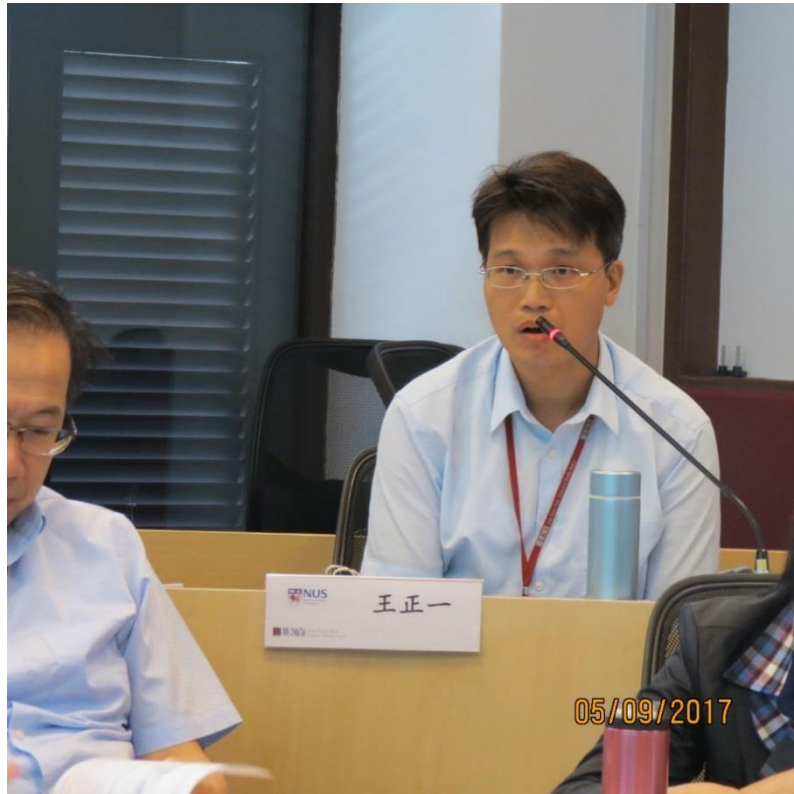
王主任秘書正一課堂發言－新加坡