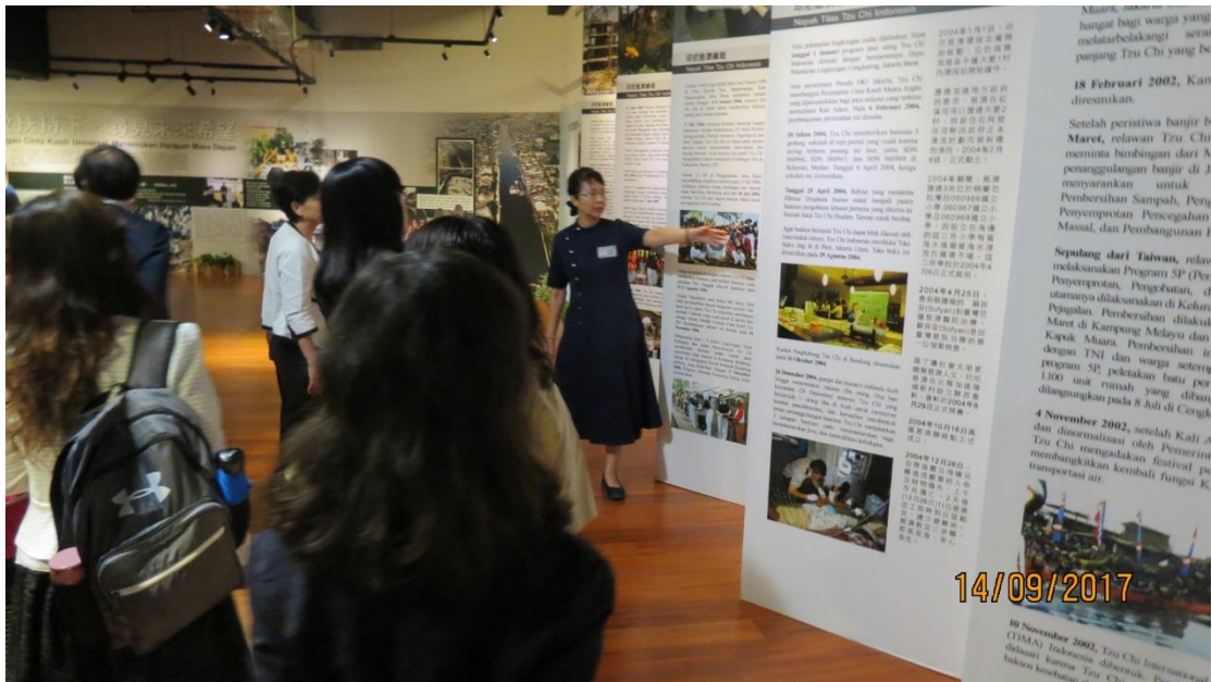
拜會印尼慈濟分會－印尼