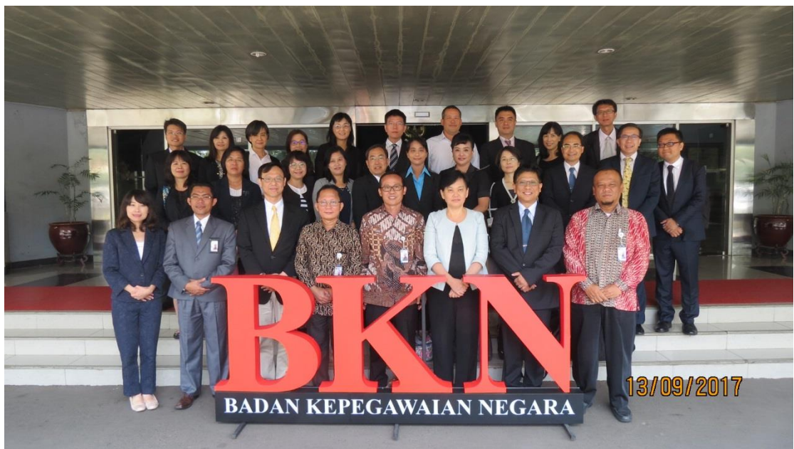
拜會印尼文官學院－印尼