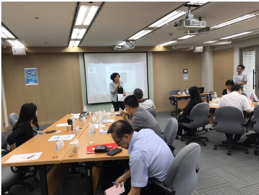
外交部李公使回部辦事宗芬擔任研究員長一行前講習