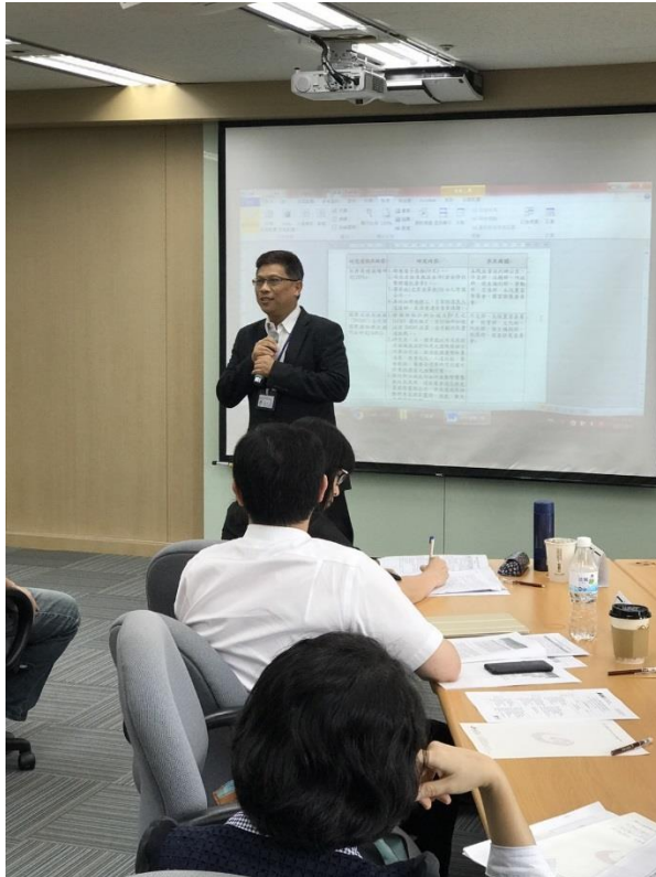
行政院人事行政總處林專門委員延增致詞－行前講習