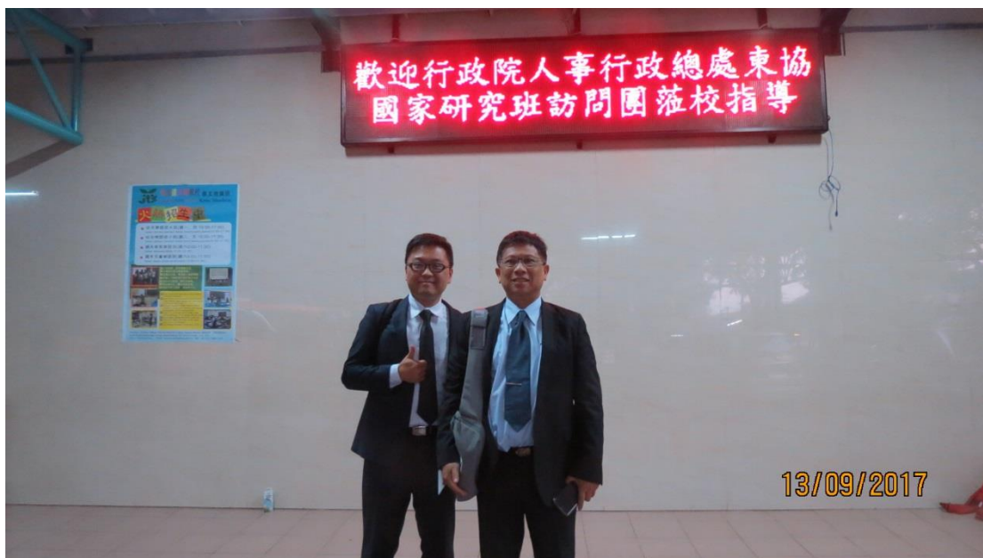
拜會雅加達臺北學校－印尼