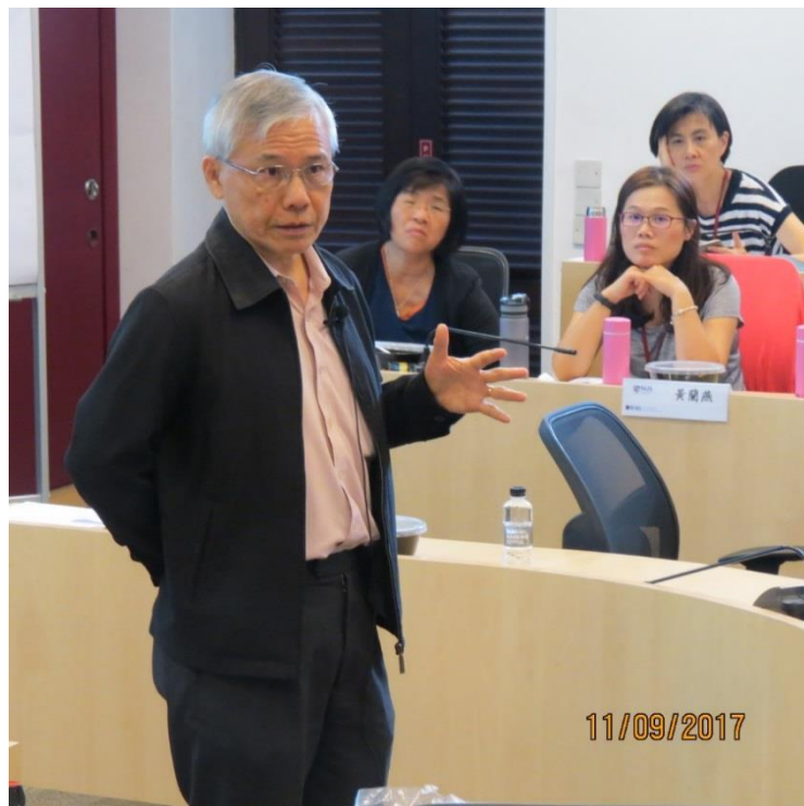
新加坡前內政部兼律政部高級政務部長何炳基副教授講授「跨國打擊犯罪」—新加坡