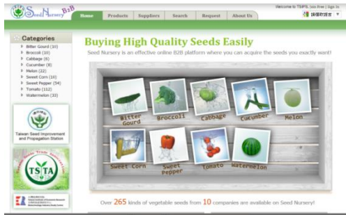
臺灣種子聯合行銷網