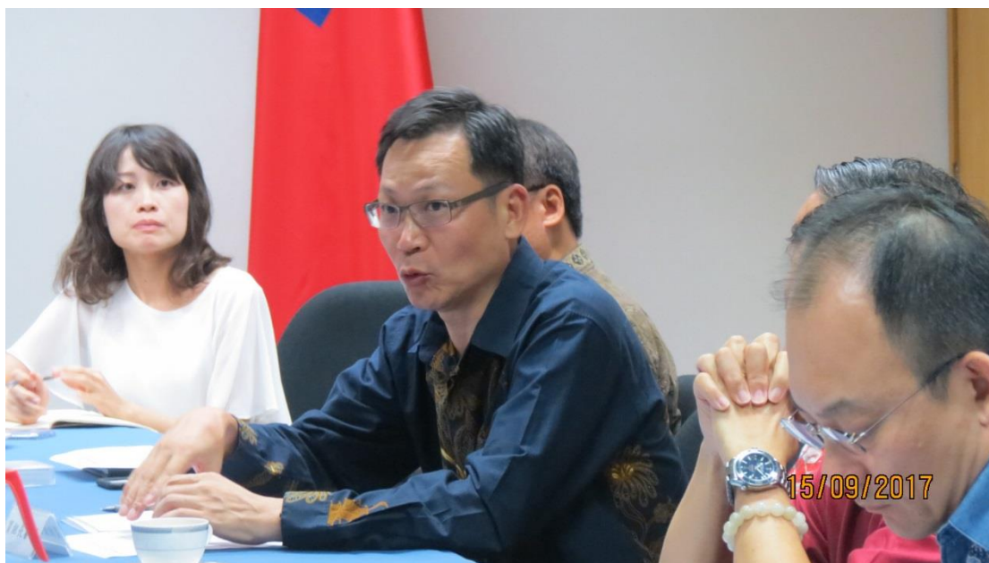
駐印尼代表處座談－印尼