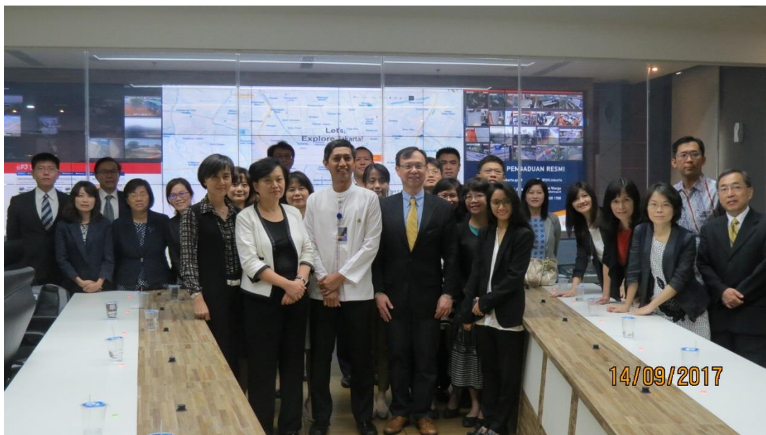
拜會雅加達省政府－印尼