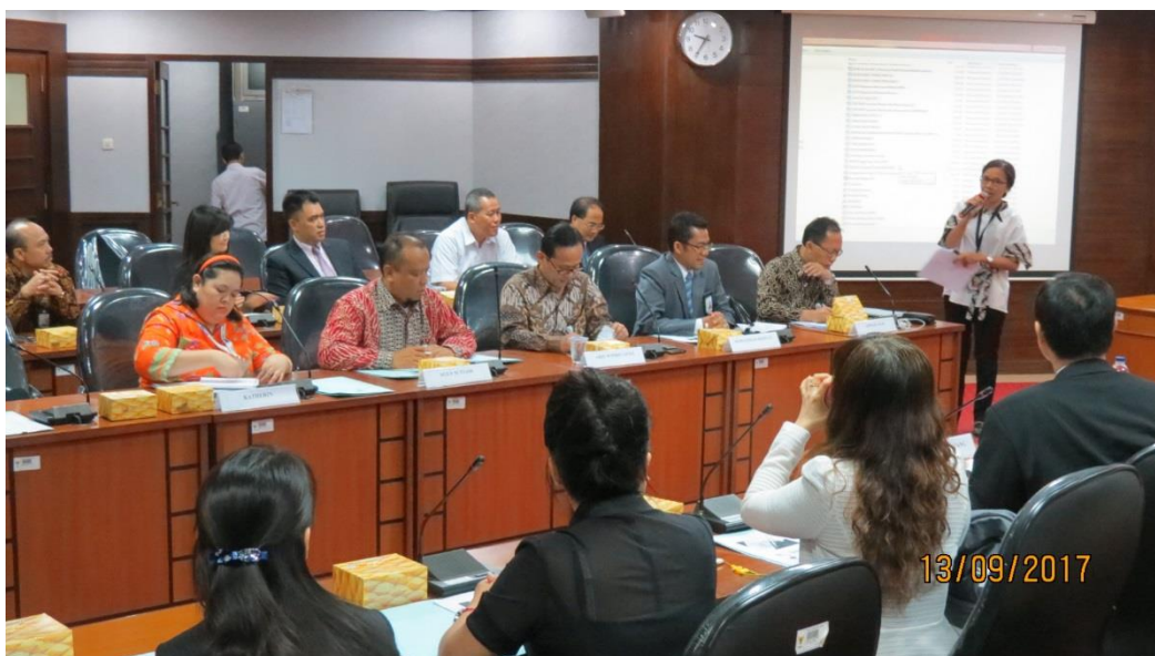
拜會印尼文官學院－印尼