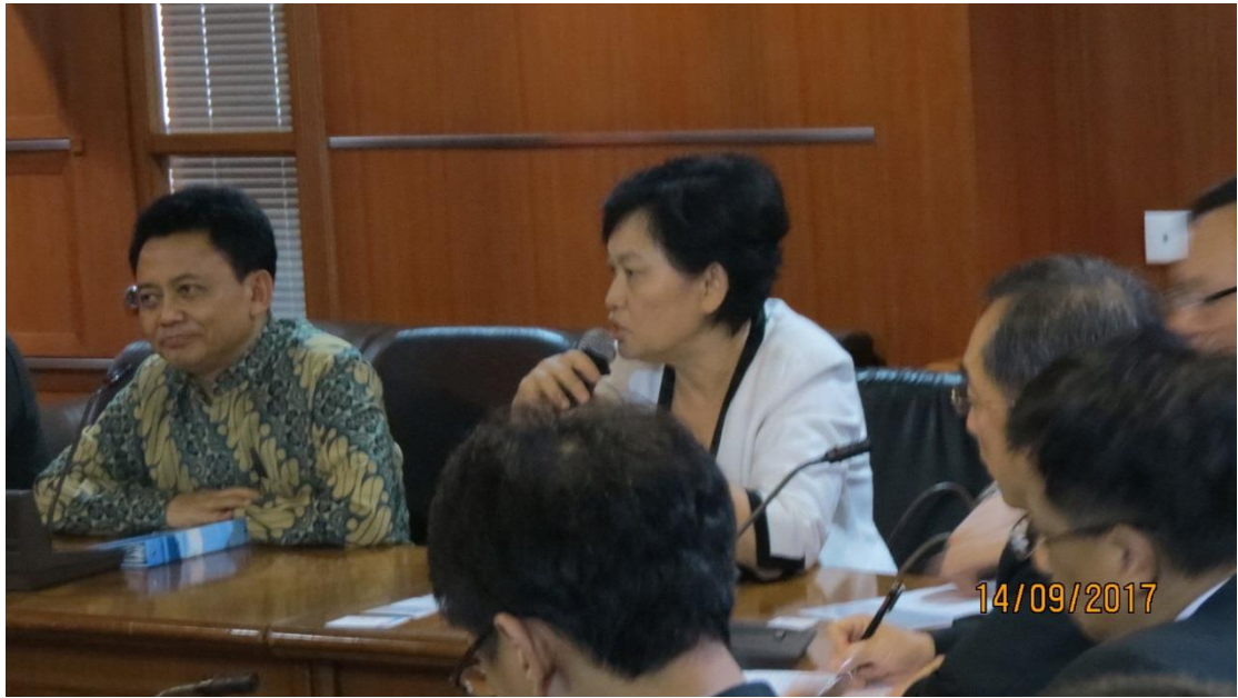
拜會智庫哈比比中心－印尼