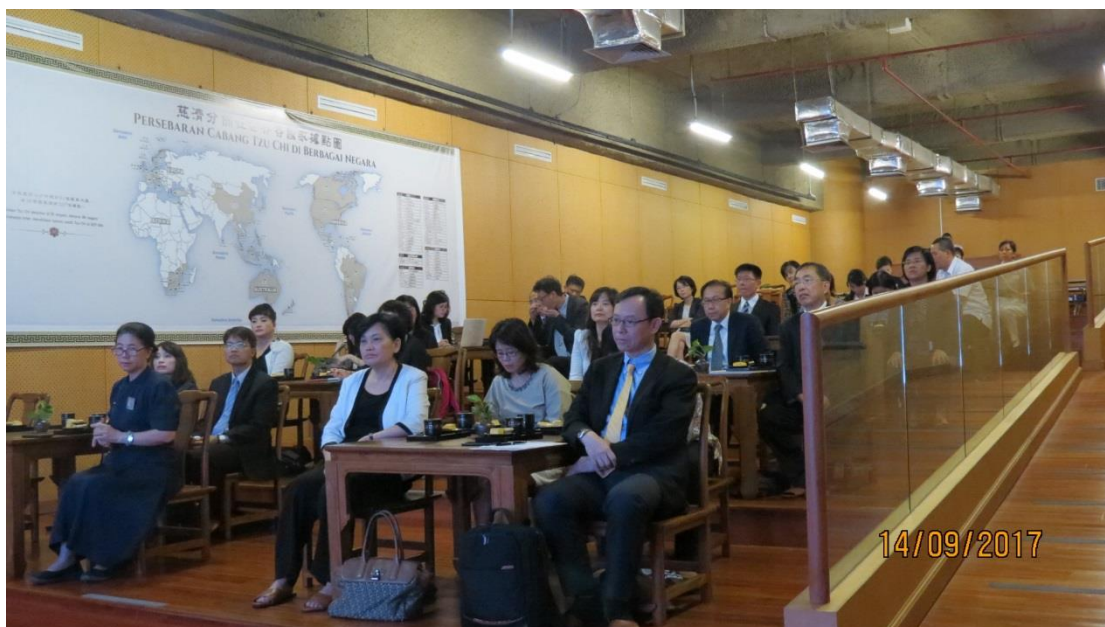
拜會印尼慈濟分會－印尼