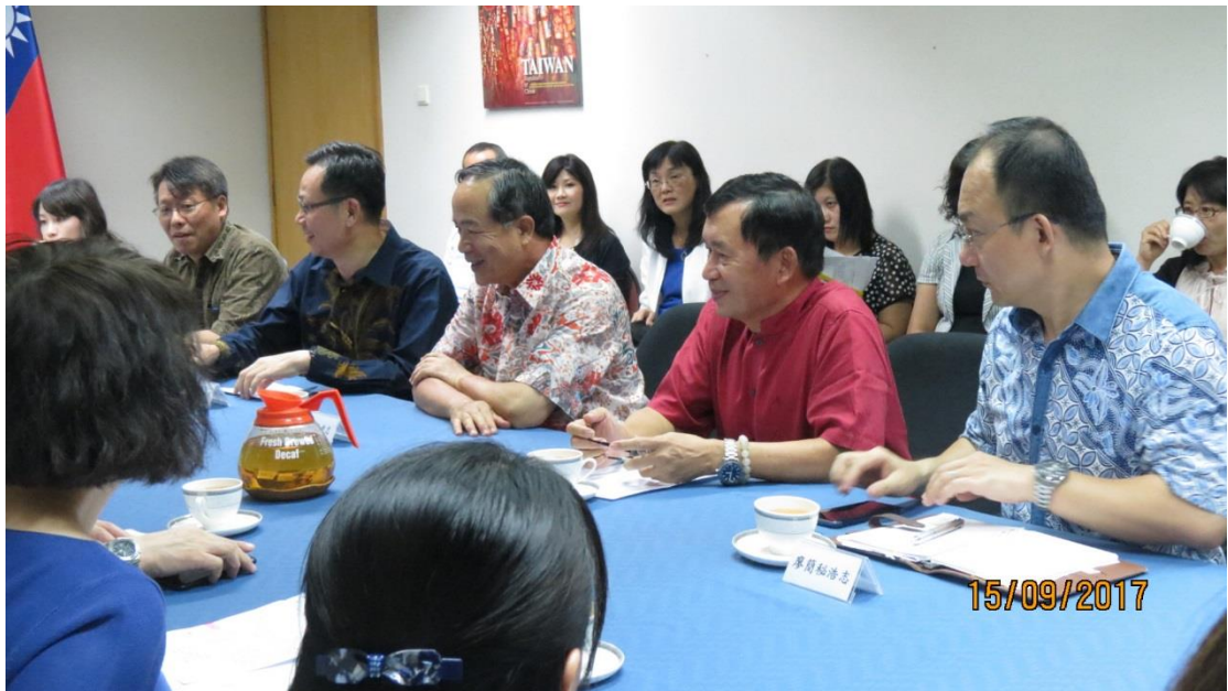
駐印尼代表處座談－印尼