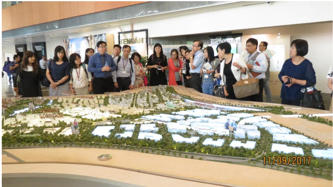
參訪新加坡建屋發展局—新加坡