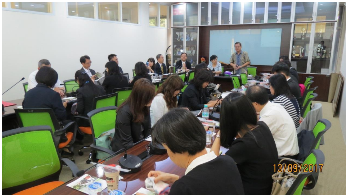
拜會雅加達臺北學校－印尼