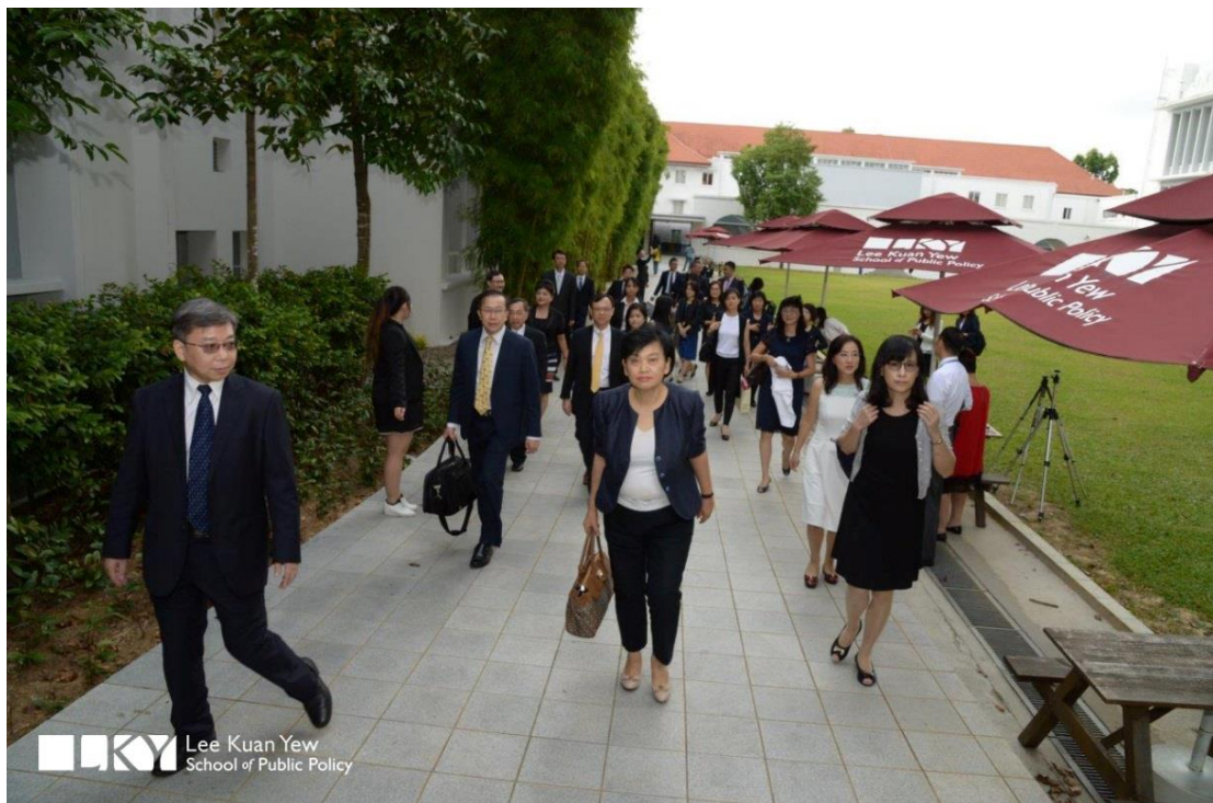
新加坡國立大學李光耀政策學院校園一隅—新加坡