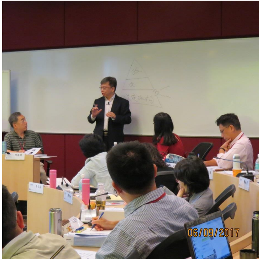
顧清揚教授講授「新加坡醫療體系的創新實踐」—新加坡