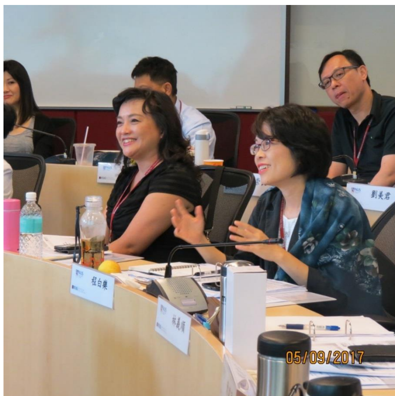
程科長白樂課堂發言—新加坡