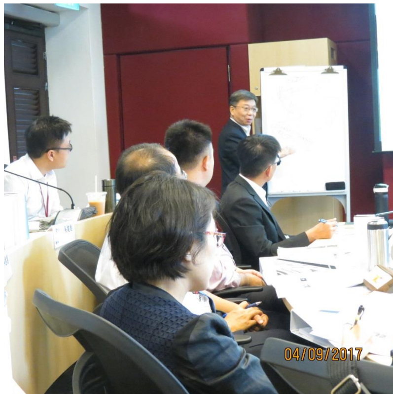
顧清揚教授講授「新加坡經濟發展和產業升級」—新加坡