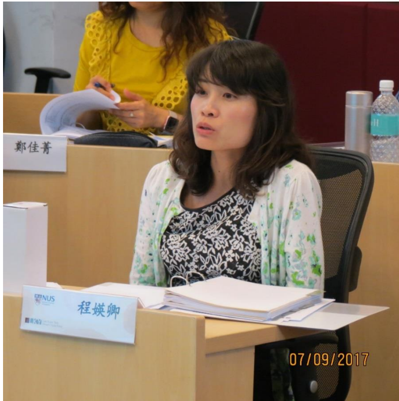
程科長嫻卿課堂發言－新加坡