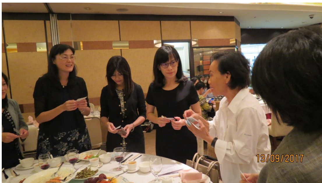
與臺商交流餐會－印尼