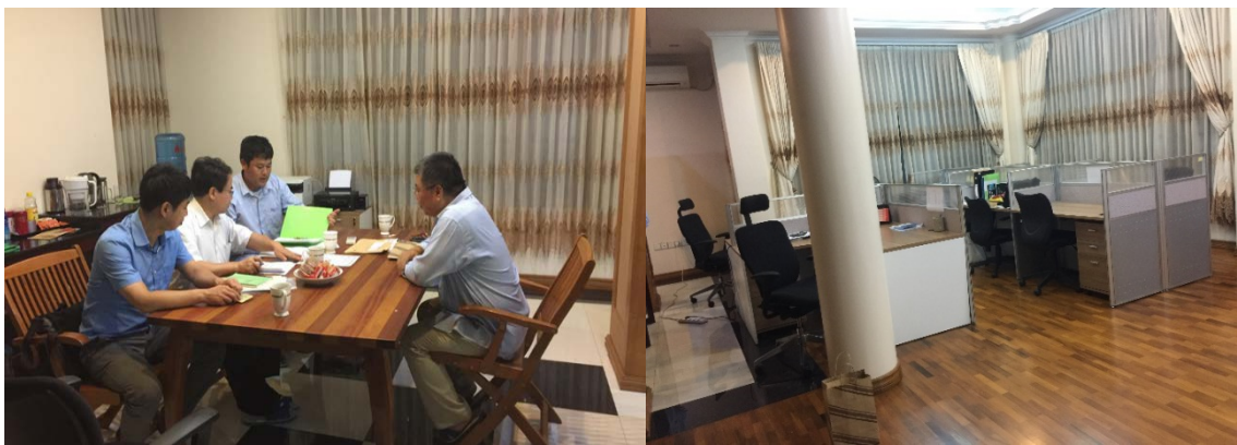
圖 5 中華公司緬甸-仰光辦公室稽核實況