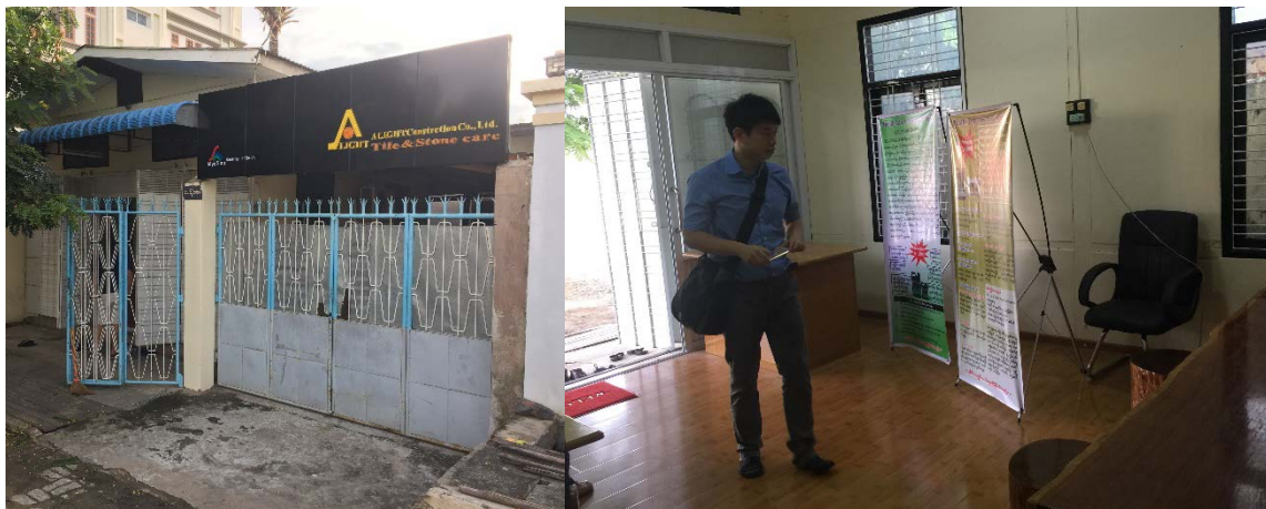
圖 8 景興公司於緬甸曼德勒與 A-LITE 共用辦公室

查證結果：景興公司提供雇用當地台籍學生或當地華僑 1 人之聘用契約書(受僱人：李立鳳)，如附件 3。