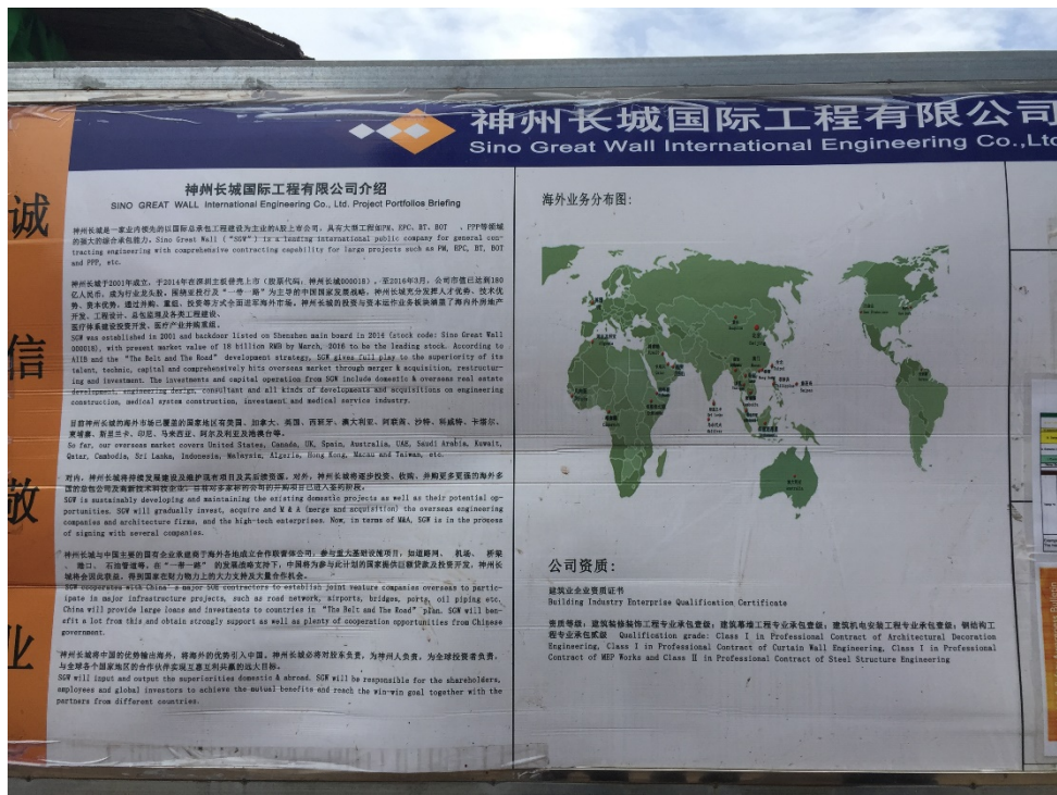
圖 9 M Tower 承攬廠商-神州長城國際工程有限公司