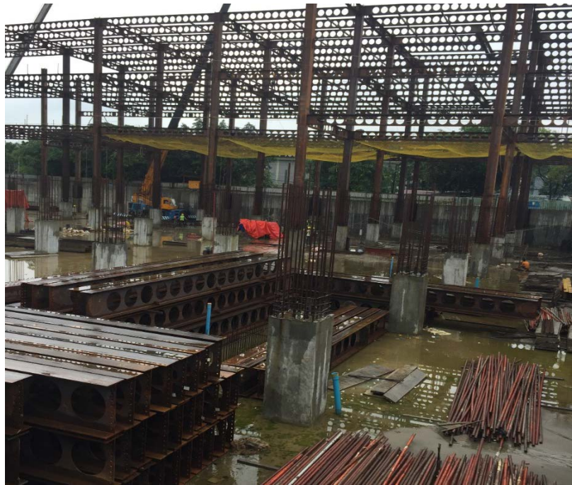
圖 6 Mottama Center building 中空 I 型樑

該工地目前正執行中，業主希望在不影響工程結構及承載強度下，以最經濟的方式進行結構設計，卡文公司即以中空 I 型樑之方式設計之，惟就該等鋼樑腹板開孔方式應無法符合臺灣之鋼樑腹板開孔最大容許寬度及容許最大偏心距離等規定(如圖 6 所示)。