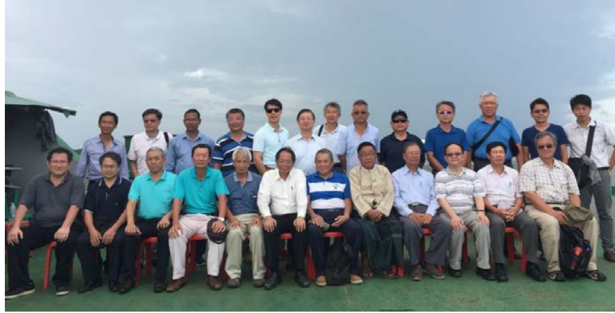
圖 15 仰光河技術參訪人員合影