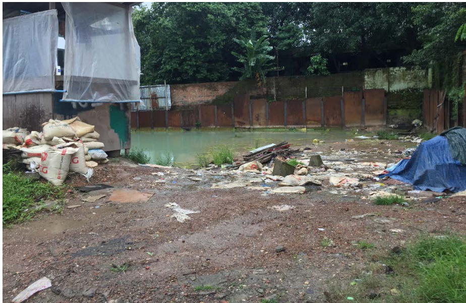
圖 3 Parami Road 合建案現地概貌

依中華公司9月8日回報訊息，本案已完成與地主簽約，後續將尋找合適的工班進場施做，另該公司考慮當地的建築工人施工技術及工作態度不佳，目前規劃赴泰國尋找妥適工班。