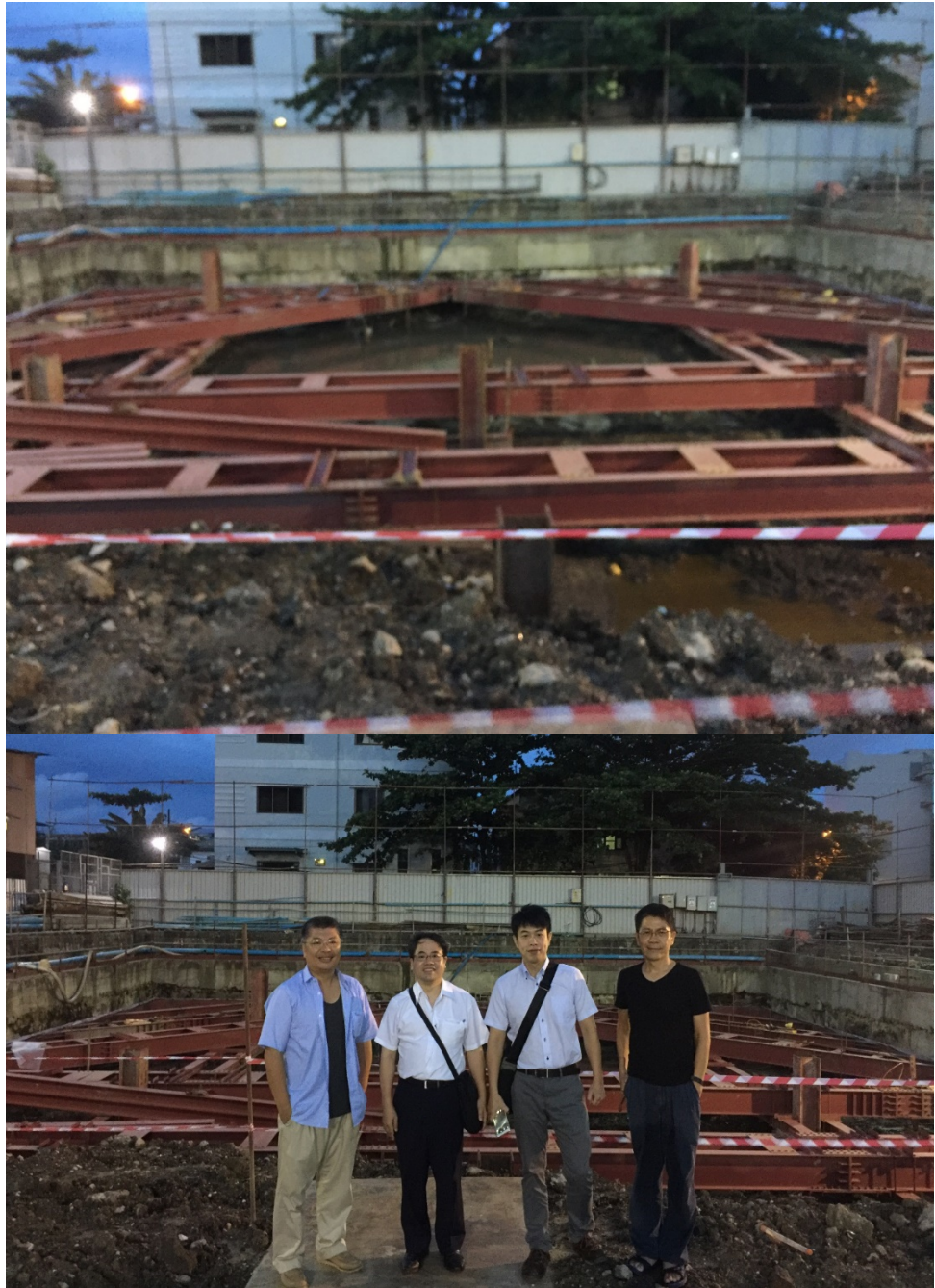
圖 2 PME Tower 鋼構施工