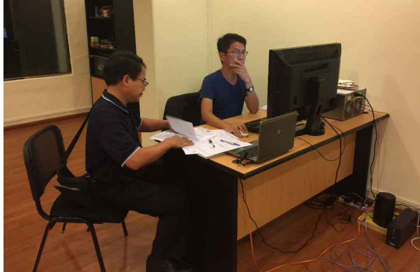
圖 5 卡文公司緬甸辦公室稽核實況