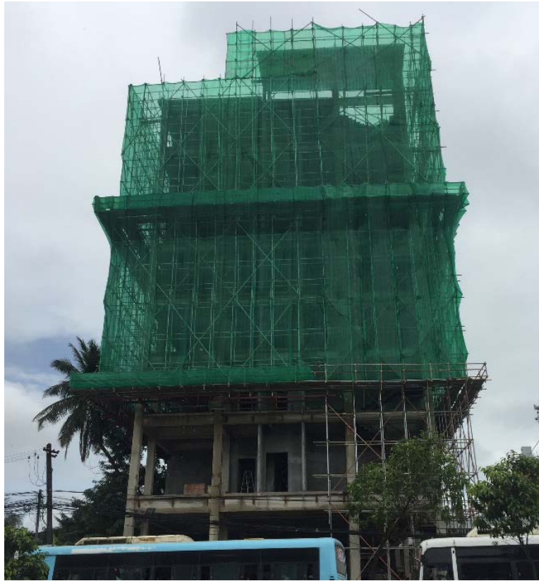
圖 7 Hlaine Tet Hotel 建築結構體