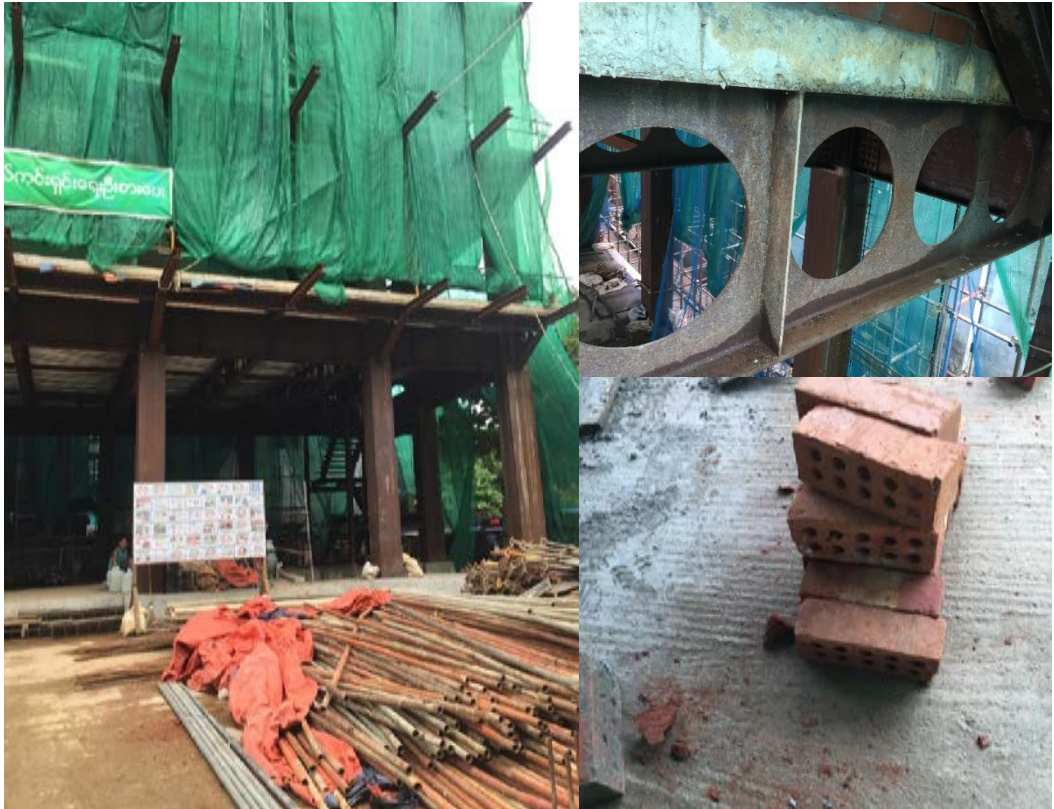
圖 1 UPG_輕量化結構設計

利建築師進行室內設計，惟該長跨度僅為 12 公尺，尚未達我國之長跨度定義，顯示我國結構設計業者於緬甸確實有技術優勢。目前 UPG 工地持續建造中(如圖 10 所示)，而在隔間用料上使用省料有孔洞之磚塊供料，此不同於臺灣於鋼結構建築，多採輕隔間的標準作業方式。