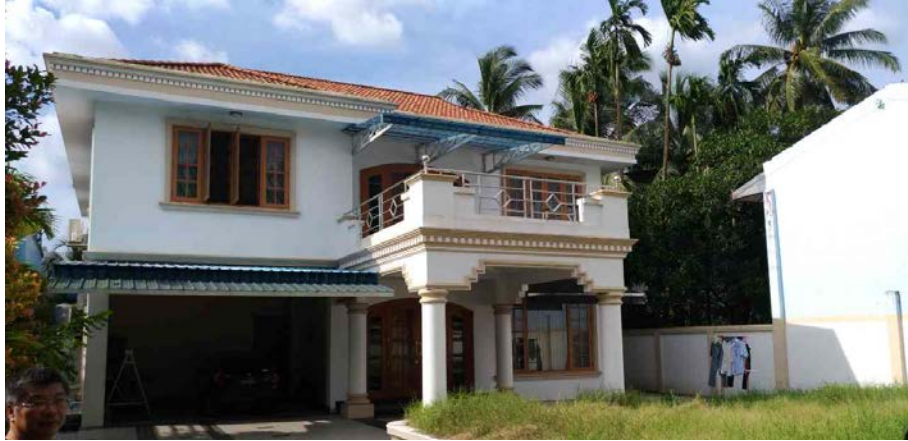
圖 43 中華公司緬甸-仰光辦公室外貌