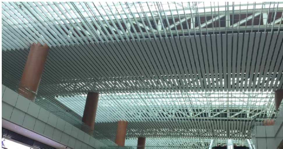
圖 1：T1 航廈屋頂鋼結構工程