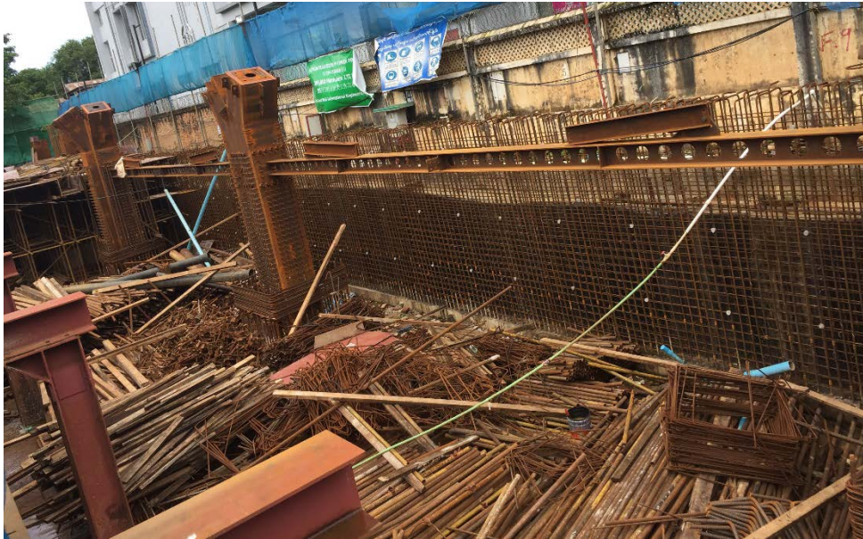
圖 8 M Tower 現場稽核實況